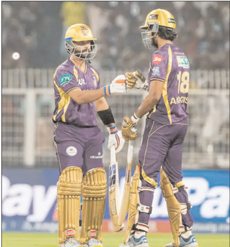
शमी की दूसरी बाल पर कैमरन ग्रीन ने छक्का लगाया। इसी छक्के से साझेदारी 50 पर हो गई। 17वें ओवर में प्रिंस यादव 17 रन दिए। रोवमन पावेल ने आखिरी दो बाल पर बैक टू बैक बाउंड्री लगाई। इनमें एक चौका और एक छक्का शामिल रहा। 15वें ओवर में दिग्वेश राठी ने महज 3 रन दिए। तीनों रन सिंगल के जरिए आए।

पारी के आखिरी ओवर में प्रिंस यादव ने 12 रन दिए। उनके ओवर में ग्रीन और पावेल ने चौके लगाए। इसी के साथ कोलकाता ने लखनऊ को 181 रन का टारगेट दिया। 19वें ओवर में कैमरन ग्रीन और रोवमन पावेल ने 5वें विकेट के लिए फिफ्टी पार्टनरशिप की।