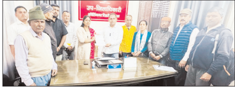
17 अप्रैल तक लोनिवि कीर्तिनगर में तालाबंदी की दी चेतावनी

शाह टाइम्स संवाददाता श्रीनगर। विकासखंड कीर्तिनगर के पट्टी बडियारागढ़ के नौडा-चोनी-धौलियाणा से तेगड़ मोटर मार्ग, छाम से खल्याणी मोटर मार्ग एवं धौडुगी से धवधार मोटर मार्ग निर्माण पर वर्षों से वित्तीय स्वीकृति न मिलने पर ग्रामीणों ने कड़ा रोष व्यक्त किया है। ग्रामीणों ने कहा कि मोटरमार्ग का सुख न मिलने से उनको कई किलोमीटर की दूरी तय करनी पड़ रही है। जिससे बुजुर्गों को खासी दिक्कतों का सामना करना पड़ रहा है।