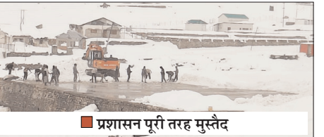
प्रशासन पूरी तरह मुस्तेद

शाह टाइम्स संवाददाता रुद्रप्रयाग। केदारनाथ यात्रा तैयारियों के बीच मौसम विघ्न पैदा कर रहा है। लगातार मौसम खराब होने के कारण तैयारियों में बाधा उत्पन्न हो रही है, जिससे मजबूर भी प्ररंशन हो गए हैं। आगामी 22 अप्रैल से प्रारंभ होने वाली इस महत्वपूर्ण यात्रा से पहले विषम मौसम परिस्थितियों के बावजूद प्रशासन की टीमों धाम क्षेत्र और पैदल यात्रा मार्ग को सुचारु बनाने में लगातार जुटी हुई हैं। पिछले तीन-चार दिनों से केदारनाथ धाम क्षेत्र में हो रही भारी बर्फबारी ने चुनौतियां जरूर बढ़ाई हैं, लेकिन प्रशासन की कार्यशैली पर इसका कोई असर नहीं पड़ा है।