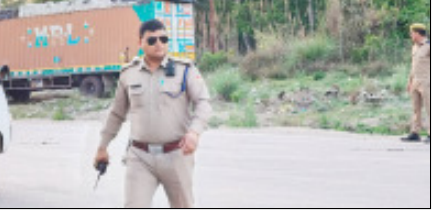
लिए भी खतरा बनते जा रहे हैं। स्थानीय निवासियों ने आरोप लगाया कि कई बार प्रशासन से शिकायत करने के बावजूद कोई ठोस कार्रवाई नहीं की गई है। लोगों के बीच यह चर्चा भी है कि अधिक प्रशासन इस गंभीर समस्या पर कार्रवाई करने से क्यों बच रहा है। कुछ लोगों ने इसे प्रशासन की लापरवाही तो कुछ ने मिलीभगत तक कारण दिया है। क्षेत्रवासियों की मांग है कि सड़क किनारे खड़े इन भारी वाहनों के

बहादुराबाद। क्षेत्र में सड़क सुरक्षा को लेकर एक बार फिर गंभीर सवाल खड़े हो गए हैं। बहादुराबाद में पृथ्वीराज चौहान विराहे से लेकर रघुनाथ मॉल तक सड़क के दोनों ओर भारी संख्या में ट्रक और डंपर खड़े किए जा रहे हैं, जिससे आए दिन दुर्घटनाओं का खतरा बना हुआ है। स्थानीय लोगों का कहना है कि इस मार्ग पर पहले भी कई बार हादसे हो चुके हैं, लेकिन इसमें बावजूद स्थिति जस की तस बनी हुई है। यह मार्ग न केवल मुख्य राजमार्ग है, बल्कि इसके आसपास स्कूल, कॉलेज और अस्पताल भी स्थित हैं। दिनभर इस रास्ते पर भारी आवाजाही रहती है, जिसमें स्कूली बच्चे, मरीजों और आम लोग शामिल होते हैं। ऐसे में सड़क किनारे खड़े ट्रकों का खतरा और भी बढ़ गया है। श्रमिकों के शिवाय यातायात बाधित कर रहे हैं, बल्कि लोगों की जान के