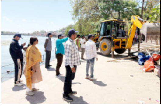
दौरान अधिकारियों ने स्थानीय लोगों और दुकानदारों से नियमों का पालन करने और शाह को अतिक्रमण मुक्त बनाने में सहयोग करने की अपील की। इस कार्रवाई में उप