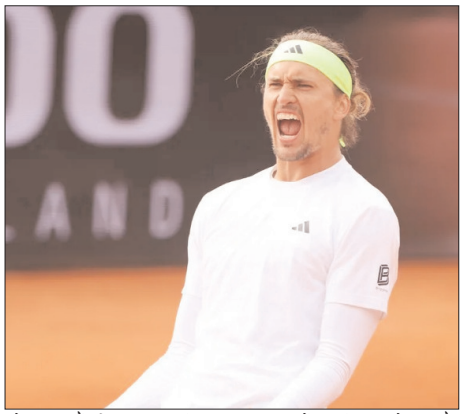
खेला था। मैं जीतकर खुश हूँ। यह एक मुश्किल मैच था और वह अच्छा खेल रहा है, खासकर यहाँ। दिन के आखिर में, कभी-कभी यह सिर्फ जीत हासिल करने के बारे में होता है। दो बार के मॉटे-कार्लो सेमीफाइनलिस्ट ज्वेरेव साल के पहले दो मास्टर्स

मॉटे-कार्लो, वार्ता। एलेक्जेंडर ज्वेरेव ने बुधवार को मॉटे-कार्लो मास्टर्स में बने रहने के लिए मुश्किल से वापसी की। इस साल पहली बार बले पर मुकाबला करते हुए, ज्वेरेव ने आखिरी सेट में 2-5 से संघर्ष करते हुए चिली के क्वालीफायर क्रिस्टियन गारिन को 4-6, 6-4, 7-5 से हराया। एक बड़े फाइनल गेम में, वर्ल्ड नम्बर 3 ने तीन ब्रेक पाईंट बचाए, इससे पहले कि वह आखिरकार अपने तीसरे मैच पाईंट पर जीत पक्की कर लेता। ज्वेरेव ने अप्रैल की धूप में कोर्ट रेंजियर प्ल पर दो घंटे और 50 मिनट के बाद आखिरकार जीत हासिल करने के बाद जोरदार आवाज लगाई। ज्वेरेव ने कहा कि ईमानदारी से कहूँ तो मेरा लेवल बिल्कुल भी नहीं था। लेकिन यह 11 महीनों में मेरा पहला बले-कोर्ट मैच था। मेरे पास तैयारी के लिए ज्यादा समय नहीं था क्योंकि मैंने मियामी में अच्छा