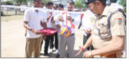
लड़ान रोशनबाद में आयोजित तीन दिवसीय प्रतियोगिता में विभिन्न जनपदों की 14 टीम और 218 खिलाड़ी प्रतिभा कर रहे हैं। खिलाड़ियों ने शानदार मार्च पास किया। डीएम और एसएमपी ने खिलाड़ियों एवं टीम को कां की हौसला अफजाई करते हुए सभी खिलाड़ियों को अच्छा प्रदर्शन करने व विजेता बनने की शुभकामनाएं दी।