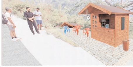
मसुरी को मिलेगा नया शांत पर्यटन मार्ग। प्रकृति के बीच सुकून भरा सफर देगा किपलिंग ट्रैक: एमडीडीए उपाध्यक्ष

मुख्य संवाददाता शाह टाइम्स देहरादून। मुख्यमंत्री पुष्कर सिंह धामी के दिशा-निर्देशों में राज्य में पर्यटन अवसंरचना को सुदृढ़ बनाने की दिशा में लगातार कार्य किए जा रहे हैं। इसी क्रम में देहरादून से मसुरी को जोड़ने वाले ऐतिहासिक किपलिंग ट्रैक को पुनरोद्धार की महत्वाकांक्षी योजना को तेजी से आगे बढ़ाया जा रहा है। मसुरी देहरादून विकास प्राधिकरण (एमडीडीए) द्वारा लगभग 498.14 लाख रुपये की लागत से 3.50 किलोमीटर लंबे इस ऐतिहासिक ट्रैक का व्यापक विकास किया जा रहा है।