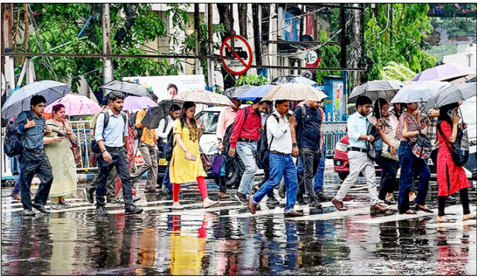
कोलकाता। बारिश के बीच जेब्रा क्रॉसिंग पर करते लोग।