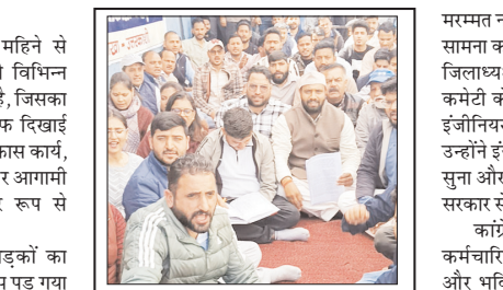
चारधाम यात्रा की तैयारियां भी प्रभावित, कांग्रेसियों ने दिया बताया डिप्लोमा इंजीनियर्स की जायज मांगें

शाह टाइम्स संवाददाता उत्तरकाशी। जिले में पिछले महिने से डिप्लोमा इंजीनियर्स महासंघ अपनी विभिन्न मांगों को लेकर हड़ताल पर डटा हुआ है, जिसका व्यापक असर अब जनजीवन पर साफ दिखाई देने लगा है। इस हड़ताल के चलते विकास कार्य, आपदा प्रबंधन से जुड़े जरूरी काम और आगामी चारधाम यात्रा की तैयारियां गंभीर रूप से प्रभावित हो रही हैं। स्थिति यह है कि जिले में सड़कों का निर्माण और मरम्मत कार्य पूरी तरह ठप पड़ गया है, जिससे आम लोगों को आवागमन में भारी दिक्कतों का सामना करना पड़ रहा है। कई स्थानों पर सड़कें क्षतिग्रस्त और अवरुद्ध हैं, जो चारधाम यात्रा से पहले प्रशासन के लिए चिंता का विषय बन गई हैं। वहीं गंगोत्री धाम में सिंचाई विभाग के घाट निर्माण कार्य भी नहीं आं पदा संभावित