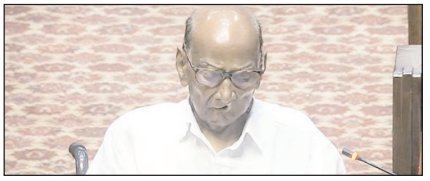
क्या भारतीय राजनीति में अब उम्र की सीमा तय होनी चाहिए सम्पादकीय