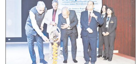
देश के 14 राज्यों की टीमों ने ले रही हैं भाग, विजेता टीम को मिलेगा 25 हजार रुपये, टॉफी व अन्य पुरस्कार

देहरादून। सिद्धार्थ लॉ कॉलेज, देहरादून में दो दिवसीय राष्ट्रीय मूट कोर्ट प्रतियोगिता का आज विधिवत शुभारंभ हुआ। प्रतियोगिता में देश के विभिन्न राज्यों से आई टीमों ने उत्साहपूर्वक भाग लिया। इस प्रतियोगिता में उत्तर प्रदेश, उत्तराखंड, बिहार, मध्य प्रदेश, हरियाणा, छत्तीसगढ़, गुजरात, झारखंड, पंजाब, दिल्ली, हिमाचल प्रदेश तथा कर्नाटक सहित कुल 14 राज्यों की टीमों प्रतिभाग कर रही हैं।