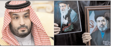
सऊदी अरब और तेहरान के बीच नजदीकियां बढ़ी