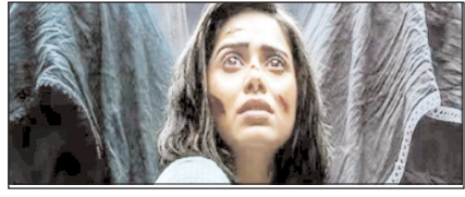
नूसरत का साहसी चुनाव ही बनाता है उनकी अलग पहचान