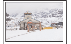
सिर्फ प्रोटोकॉल वालों को मिलेगी सुविधा

दरअसल, हर वर्ष वीआईपी दर्शन को लेकर अव्यवस्थाओं और पक्षपात के आरोप सामने आते रहे हैं। तीर्थ पुरोहितों और श्रद्धालुओं द्वारा लगातार उठाई जा रही आपत्तियों के बाद बड़ी-केंदर मंदिर समिति ने इस बार सख्त निर्णय लिया है। समिति के अनुसार अब