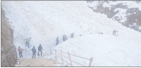
धाम में व्यवस्थाएं दुरुस्त करने में जुटा प्रशासन, बीकेटीसी का एडवांस दल मैदान में

शाह टाइम्स संवाददाता रुद्रप्रयाग। मौसम साफ होते ही केदारनाथ धाम यात्रा की तैयारियों ने जोर पकड़ लिया है। प्रशासन और बंदीनाथ-केदारनाथ मंदिर समिति (बीकेटीसी) पूरी तरह एक्शन मोड में नजर आ रहे हैं। धाम में पिछले दो दिनों से मौसम अनुकूल रहने के चलते तैयारियों में तेजी आई है और विभिन्न व्यवस्थाओं को अंतिम रूप दिया जा रहा है।