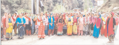
अवैध शराब के खिलाफ केदारघाटी की महिलाओं ने निकाली रामपुर बाजार में आक्रोश रैली

शाह टाइम्स संवाददाता रुद्रप्रयाग। केदारघाटी क्षेत्र में अवैध शराब की बढ़ती बिक्री को खिलाफ महिलाओं का आक्रोश लगातार बढ़ता जा रहा है। शनिवार को रामपुर मुख्य बाजार में न्यालसू और सीतापुर की महिलाओं ने जागरूकता रैली निकालकर विरोध दर्ज कराया। महिलाओं ने कहा कि केदारनाथ यात्रा मार्गों में अवैध शराब बिक रही है, जिससे देश-विदेश से यात्रा पर आने वाले यात्रियों की आस्था को ठेस पहुंच रही है। रैली के दौरान महिलाओं ने "नशामुक्त हो गांव-क्षेत्र हमारा" जैसे नारों के साथ लोगों को जागरूक किया और अवैध शराब की बिक्री पर पूर्ण रोक लगाने की मांग उठाई। महिलाओं का कहना है