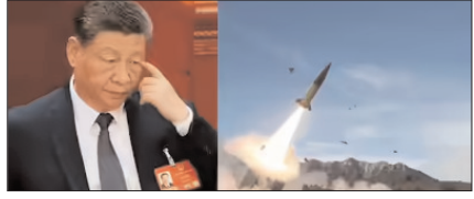
ईरान को हथियार देने की तैयारी में चीन