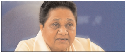
बाबा साहब भीम राव अंबेडकर ने भी शिक्षा को सामाजिक परिवर्तन का मुद्दा बनाया

नई दिल्ली, मुजफ्फरनगर, देहरादून, हल्द्वानी, मुतादाबाद, बरेली, मेरठ व लखनऊ से प्रकाशित