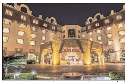
चल रही बातचीत किसी नतीजे पर नहीं पहुंची, तो सिर्फ इजरायल को दोष नहीं दिया जा सकता।

इस्लामाबाद। पाकिस्तान की राजधानी इस्लामाबाद में इरान और अमेरिका के बीच जारी सीजफायर वार्ता का दूसरा दौर शुरू हो गया है। पहला राउंड 2 घंटे तक चला था। मीडिया रिपोर्ट्स के मुताबिक इस दौरान इरान ने लेबनान पर तुरंत इजरायली हमले रोकने की मांग की। इस बैठक में एक्सपर्ट्स ने सुरक्षा, राजनीति, सेना, अर्थव्यवस्था और कानून से जुड़े मुद्दों पर बात की। अमेरिका की तरफ से उपराष्ट्रपति जेडी वेंस, जबकि इरान की तरफ से संसद स्पीकर मोहम्मद बाघेर गालिबाफ ने नेतृत्व किया। यह मॉडरिन कल भी जारी रह सकती है। 47 साल पहले यानी 1979 में इरान की इस्लामिक क्रांति के बाद ये पहली बार था जब दोनों देश के नेताओं ने इरान बड़े स्तर पर आमने-सामने बातचीत की। इससे पहले इरान ने कहा था कि अगर इस्लामाबाद में