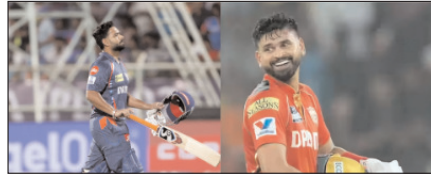
जीत का लक्ष्य बरकरार रखने उतरेगी एलएसजी खेल टाइम्स