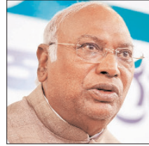
हमें भरोसे में लिए बिना विशेष सत्र बुलाया: कांग्रेस

कांग्रेस अध्यक्ष और राज्यसभा में विपक्ष के नेता मल्लिकार्जुन खड़गे ने रविवार को प्रधानमंत्री नरेंद्र मोदी को पत्र लिखकर सरकार से महिला आरक्षण विधेयक और परिसीमन के मुद्दे से जुड़े प्रस्तावित संवैधानिक संशोधनों पर चर्चा करने के लिए एक सर्वदलीय बैठक बुलाने का आग्रह किया। उन्होंने आरोप लगाया कि विपक्ष को भरोसे में लिए बिना संसद का स्पेशल सेशन बुलाया गया है और चेतावनी दी कि सही चर्चा के लिए जरूरी बातें अभी भी साफ नहीं हैं। यह तब हुआ जब संसद 16 अप्रैल से तीन दिन का स्पेशल सेशन शुरू करने वाली है, जिसका फोकस महिला आरक्षण संशोधन बिल पर होगा। पत्र में खड़गे ने लिखा कि मुझे