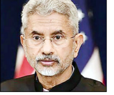
जयशंकर ने भारतीय समुदाय के लोगों को दिया पीएम मोदी का संदेश, राष्ट्रपति से भी की मुलाकात

नई दिल्ली। विदेश मंत्री एस जयशंकर के यूएई दौरे ने एक बार फिर भारत और यूएई के मजबूत रिश्तों को चर्चा में ला दिया है। उन्होंने दुबई और अबू धाबी में शीर्ष नेतृत्व से मुलाकात कर भारत की चिंताओं और प्राथमिकताओं को सामने रखा। खास तौर पर पश्चिम एशिया में चल रहे तनाव के बीच भारतीय समुदाय की सुरक्षा और दोनों देशों के रणनीतिक रिश्तों पर जोर दिया गया।