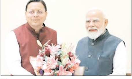
प्रधानमंत्री मोदी 28 वीं बार मंगलवार को आएंगे उत्तराखंड दौरे पर, दिल्ली-देहरादून एक्सप्रेस वे के साथ ही टिहरी में एक हजार मेगावाट क्षमता वाले देश के पहले वेरिएबल स्पीड पंप स्टोरेज संयंत्र का भी करेगा लोकार्पण

प्रधानमंत्री नरेंद्र मोदी का उत्तराखंड से कर्म और मर्म का रिश्ता रहा है। उत्तराखंड उनके हृदय में बसता है। उनके दौरों को लेकर देवभूमिवासियों में भारी उत्साह है। मोदी जी के प्रधानमंत्री बनने के बाद उत्तराखंड में अनेक महत्वपूर्ण परियोजनाओं को मंजूरी मिली है। दो लाख करोड़ से अधिक की विकास योजनाएं धरातल पर उतर चुकी हैं। कनेक्टिविटी के क्षेत्र में क्रांति आई है। चारधाम ऑलवेदर रोड परियोजना, ऋषिकेश-कणप्रयाग रेल परियोजना, केदारनाथ एवं हेमकुंड साहिब रोपवे परियोजना, देहरादून-दिल्ली एलिवेटेड रोड जैसी बड़ी परियोजनाओं को उन्होंने स्वीकृति दी है। आज पीएमजीएसवाई के तहत दूरदराज ग्रामीण इलाकों में सड़कों के निर्माण के साथ ही हवाई और रेल सेवाओं का विस्तार हुआ है। रोप-वे परियोजनाओं पर तेजी से काम आगे बढ़ा है।