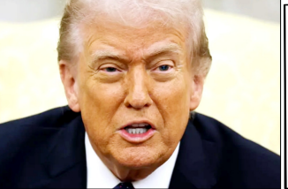
होर्मुज से पास होने वाले जहाजों की निगरानी करेगी अमेरिकी नौसेना, ईरान पर ब्लैकमेल करने का आरोप

वाशिंगटन। अमेरिका और ईरान के बीच तनाव एक बार फिर खतरनाक मोड़ पर पहुंच गया है। पाकिस्तान में हुई नाकाम शांति वार्ता के बाद अमेरिका के राष्ट्रपति डोनाल्ड ट्रम्प ने बेहद सख्त और तीखा बयान जारी किया है, जिसने वैश्विक राजनीति में हलचल मचा दी है। ट्रम्प ने आरोप लगाया कि ईरान ने होर्मुज जलडमरूमध्य खोलने का वादा किया था, लेकिन जानबूझकर उसे तोड़ा, जिससे दुनिया भर में आर्थिक अस्थिरता, डर और संकट की स्थिति पैदा हो गई है।