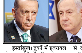
इस्तांबुल। तुर्की में इजरायल के प्रधानमंत्री बेंजामिन नेतन्याहू समेत 35 लोगों के खिलाफ केस दर्ज किया गया है।

4600 साल तक जेल की सजा की मांग, मामला गाजा जा रहे राहत मिशन पर कथित हमले से जुड़ा