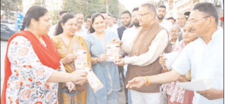
प्रधानमंत्री मोदी के उत्तराखण्ड आगमन पर हाथीबड़कला बाजार में जनसंपर्क कर कैबिनेटमंत्री ने दिया निमंत्रण

मुख्य संवाददाता शाह टाइम्स देहरादून। कृषि एवं सैनिक कल्याण मंत्री गणेश जोशी ने आज हाथीबड़कला बाजार में जनसंपर्क अभियान चलाकर व्यापारियों और स्थानीय लोगों को प्रधानमंत्री नरेंद्र मोदी के 14 अप्रैल को देहरादून दौरे के कार्यक्रम में शामिल होने का निमंत्रण दिया। इस दौरान उन्होंने लोगों से आत्मीय मुलाकात कर जनसभा में अधिक से अधिक संख्या में पहुंचने की अपील की। कृषि मंत्री गणेश जोशी ने केंद्र एवं राज्य सरकार द्वारा चलाई जा रही विकास योजनाओं का फीटबैक भी लिया। कृषि मंत्री गणेश जोशी ने कहा कि प्रधानमंत्री नरेंद्र मोदी का उत्तराखंड से विशेष लगाव है, जिसका प्रमाण है कि वे लगातार राज्य का दौरा करते रहते हैं। उन्होंने कहा कि प्रधानमंत्री के आगमन को लेकर प्रदेशवासियों में खासा उत्साह देखने को मिल रहा है। उन्होंने कहा कि प्रधानमंत्री मोदी ने बाबा केदार की धरती से कहा था