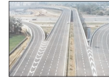
सहारनपुर होते हुए उत्तराखंड की राजधानी देहरादून तक जाएगा। एक्सप्रेसवे का निर्माण चार चरणों में किया गया है जिसमें पहला चरण अक्षरधाम से बागपत के खेकड़ा तक 32 किमी का है जबकि दूसरा चरण बागपत से सहारनपुर के लाखनौर तक 32 किमी, तीसरा चरण लाखनौर से गणेशपुर-बिहारगढ़ तक 42 किमी और चौथा चरण गणेशपुर टोल से देहरादून तक 18 किमी लंबा है। अंतिम चरण में 12 किलोमीटर लंबा एलिवेटेड कॉरिडोर बनाया गया है, जो राजा जी नेशनल पार्क से होकर गुजरेगा।