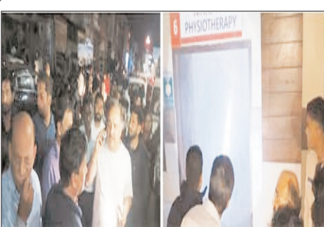
श्री और जनेरेंटर सेट व विद्युत ट्रांसफार्मर सहित भारी नुकसान हो सकता था। हालांकि इस अग्निकांड में पुराने आपातकालीन केंद्र की विद्युत वायरिंग, फिटिंग, फॉल सीलिंग, फर्नीचर और फिजियोथेरेपी से संबंधित मशीनरी सहित लाखों रुपये का सामान जलकर नष्ट हो गया। आग का असर भवन के चौथे तल तक की वायरिंग पर भी देखा गया। राहत की बात यह रही कि इस घटना में किसी भी प्रकार की जनहानि नहीं हुई। अस्पताल में भर्ती सभी मरीज, उनके तोमारदार,

शाह टाइम्स संवाददाता रुड़की। रुड़की स्थित विनय विशाल अस्पताल में शनिवार देर रात अचानक भीषण आग लगने से अफरा-तफरी का माहौल बन गया, लेकिन फायर स्टेशन रुड़की की टीम ने विषम परिस्थितियों, धुएं से भरे वातावरण और पानी की चुनौती के बीच अदम्य साहस का परिचय देते हुए आग पर समय रहते काबू पा लिया। फायर कर्मियों की तेज रिस्पांस टाइम और जोखिमपूर्ण कार्रवाई के चलते एक बड़ी जन-धन हानि टल गई। जानकारी के अनुसार, रात्रि लगभग 22:28 बजे फायर स्टेशन रुड़की को अस्पताल के पुराने आपातकालीन केंद्र में आग लगने की सूचना प्राप्त हुई। सूचना मिलते ही अग्निशमन अधिकारी श्री वंश