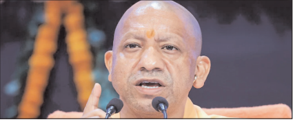
वोट बैंक के सौदागर बंगाल की डेमोग्राफी को बदलना चाहते हैं: योगी

नई दिल्ली, मुजफ्फरनगर, देहरादून, हल्द्वानी, मुताबाद, बरेली, मेरठ व लखनऊ से प्रकाशित