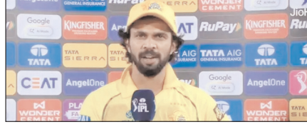
रतुराज गायकवाड़ पर लगा 12 लाख रुपये का जुर्माना