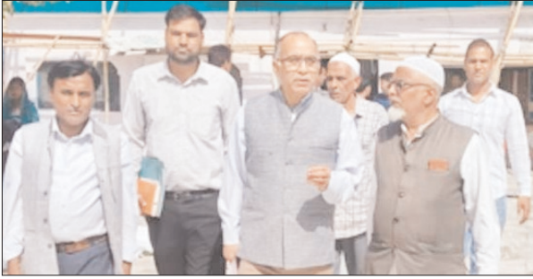
रखने पर जोर दिया। इसके साथ ही उन्होंने कार्यालय के सभी सुपरवाइजर्स के साथ बैठक कर कार्यालय की कार्यप्रणाली और व्यवस्थाओं का जायजा लिया। बैठक में उन्होंने कार्यों

शाह टाइम्स संवाददाता पिरान कलियर। दरगाह क्षेत्र की व्यवस्थाओं को बेहतर बनाने के उद्देश्य से उत्तराखंड मुख्य कार्यपालक अधिकारी गिरधारी सिंह रावत ने शनिवार को पिरान कलियर पहुंचकर कार्यालय एवं आसपास के क्षेत्रों का औचक निरीक्षण किया। निरीक्षण के दौरान उन्होंने साफ-सफाई, व्यवस्थाओं और जनसुविधाओं का जायजा लिया। निरीक्षण के दौरान दरगाह क्षेत्र में फैली गंदगी और अव्यवस्थाओं को देखकर मुख्य कार्यपालक अधिकारी ने नाजामगी जताई। उन्होंने संबंधित अधिकारियों और कर्मचारियों को तत्काल प्रभाव से सफाई व्यवस्था दुरुस्त करने के सख्त निर्देश दिए। साथ ही नियमित सफाई अभियान चलाने और क्षेत्र को स्वच्छ बनाए