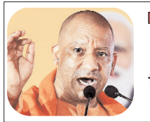
कांग्रेस, वामपंथी दलों और तृणमूल कांग्रेस को भावी पीढ़ी के साथ खिलवाड़ करने की छूट न दी जाए: आदित्यनाथ

सोएम योगी आदित्यनाथ ने रविवार को पश्चिम बंगाल में चुनावी रैली के दौरान कांग्रेस, वामपंथी दलों और तृणमूल कांग्रेस पर जमकर निशाना साधा। उन्होंने कहा कि कुछ दिन पहले बांग्लादेश में एक दलित हिंदू की निर्मम हत्या पर बंगाल की मुख्यमंत्री ममता दीदी मौन रहीं। उन्हें भय था कि बोलने पर उनका मुस्लिम वोट न खिसक जाए। उन्होंने कहा कि वोटबैंक के सौदागर बंगाल की डेमोग्राफी को बदलना चाहते हैं। सोनामुखी में विशाल जनसभा को संबोधित करते हुए मुख्यमंत्री योगी आदित्यनाथ ने कहा कि कांग्रेस, वामपंथी दलों और तृणमूल कांग्रेस को भावी पीढ़ी के साथ खिलवाड़