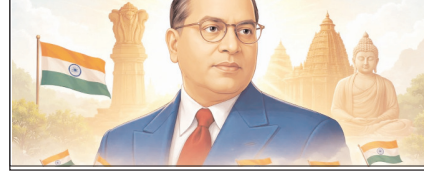
आम्बेडकरवादी भी जातिवादी हैं!