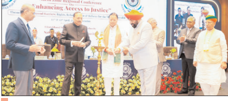
दो दिवसीय नॉर्थ जोन रीजनल कॉन्फ्रेंस का रविवार को भव्य समापन, राज्यपाल और मुख्यमंत्री ने कॉन्फ्रेंस में किया प्रतिभाग

इस सम्मेलन के समापन के अवसर पर राज्यपाल लीफ्टिनेंट जनरल गुरमीत सिंह (से नि), भारत के मुख्य न्यायाधीश एवं नालसा के संरक्षक-प्रधान न्यायमूर्ति सूर्यकांत, मुख्यमंत्री पुष्कर सिंह धामी, केंद्रीय विधि एवं न्याय राज्य मंत्री (स्वतंत्र प्रभार) अर्जुन राम मेघवाल सहित उच्चतम न्यायालय एवं उत्तराखण्ड उच्च न्यायालय के न्यायमूर्तिगण, उत्तर भारत के विभिन्न उच्च न्यायालयों से पधार न्यायमूर्तिगण और विधि विशेषज्ञों ने प्रतिभाग किया। कार्यक्रम का शुभारंभ दीप प्रज्वलन एवं राष्ट्रगीत के साथ हुआ। उत्तराखण्ड उच्च न्यायालय के माननीय मुख्य