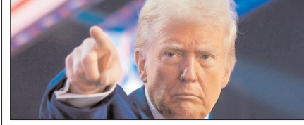
ईरान से वार्ता विफल होने पर भड़के ट्रम्प, ईरान को बताया जिम्मेदार