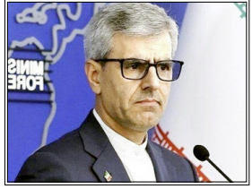
ईरान के प्रस्ताव 'व्यावहारिक' अब अमेरिका को यथार्थवादी रुख अपनाना होगा

मास्को। ईरान और अमेरिका कई मुद्दों पर सहमत हुए लेकिन दो-तीन महत्वपूर्ण मुद्दों पर असहमति होने के कारण इस्लामाबाद में हुई बातचीत के बाद समझौता नहीं हो सका। यह जानकारी ईरानी विदेश मंत्रालय के प्रवक्ता इस्माइल बगई ने दी। मेहर समाचार एजेंसी के अनुसार, बगई ने कहा कि हमारे बीच कई मुद्दों पर सहमति बनी लेकिन दो-तीन महत्वपूर्ण मुद्दों पर हमारे विचार अलग-अलग थे और अंततः वार्ता किसी समझौते पर पहुंचने में विफल रही। अमेरिकी राष्ट्रपति डोनाल्ड ट्रम्प ने आठ अप्रैल को रात ईरान के साथ दो सप्ताह के युद्धविराम समझौते की घोषणा की थी जिसके बाद, ईरान और अमेरिका ने शनिवार को इस्लामाबाद में वार्ता की।