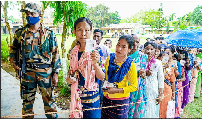
अगरतला। त्रिपुरा जनजातीय क्षेत्र स्वायत्त जिला परिषद (टीटीएएडीसी) चुनाव के दौरान मतदान केंद्र के बाहर अपना वोट डालने के लिए कतार में खड़े होकर अपने पहचान पत्र दिखाते मतदाता।