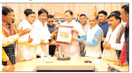
चारधाम में यात्रियों की संख्या सीमित न करने के सीएम धामी के निर्णय का स्वागत

और बेहतर व्यवस्थाएं सरकार की सर्वोच्च प्राथमिकता हैं। उन्होंने कहा कि सभी संबंधित विभागों को समन्वय के साथ कार्य करने के निर्देश दिए गए हैं, ताकि यात्रा के दौरान यात्रियों व चारधाम से जुड़े किसी भी व्यक्ति को किसी प्रकार की असुविधा न हो। इसके लिए सरकार संकल्पबद्ध होकर कार्य कर