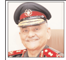
■ हर्षिल में सांस्कृतिक विरासत केंद्र की सीडीएस ने रखी आधारशिला

शाह टाइम्स संवाददाता उत्तरकाशी। भारतीय सैनिकों के चीफ ऑफ डिफेंस जनरल अनिल चौहान ने कहा कि सीमांत गांव के लोग और सेना एक दूसरे के पूरक होते हैं। बाँटें पर स्थानीय लोग सेना की मदद करते हैं, इसलिए सेना का भी कर्तव्य है कि वह सीमांत गांव के विकास में अपना सहयोग करे। वीरवार को भारत-चीन सीमा से सटे हर्षिल पहुंचे भारतीय सेना के रक्षा प्रमुख जनरल अनिल चौहान ने कहा। इस दौरान जनरल अनिल चौहान चीफ ऑफ डिफेंस ने हर्षिल सांस्कृतिक एवं विरासत केंद्र की आधारशिला रखी। इस दौरान उन्होंने संबोधित करते हुए कहा कि यह केंद्र एक महत्वपूर्ण पहल के रूप में परिकल्पित है, जिसका उद्देश्य क्षेत्र की समृद्ध सांस्कृतिक