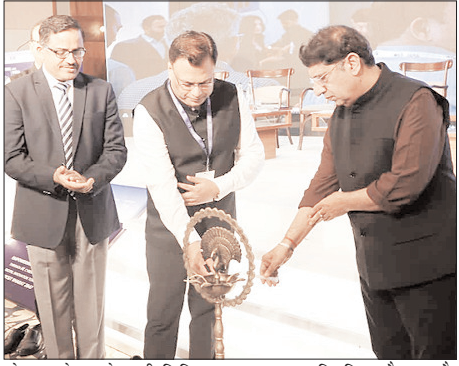
केंद्र के साथ देश-प्रदेश की डिजिटल प्रगति पर चर्चा हुई। इस दौरान सभी का कहना था कि डिजिटल इंडस्ट्री को उत्तराखंड में बढ़ावा देने के लिए हर तरह से

शाह टाइम्स ब्यूरो देहरादून। दिल्ली-देहरादून इकोनॉमिक कॉरिडोर से उत्तराखंड को उम्मीदों का पंचलाग रहे हैं। विकास की योजनाओं का खाका खींचते वक्त दिल्ली-देहरादून इकोनॉमिक कॉरिडोर अब अहम भूमिका में है। डिजिटल प्रगति के लक्ष्य को हासिल करने की राह में भी इसे महदनाार दोस्त की तरह देखा जा रहा है। इंडिया डिजिटल एम्पावरमेंट मीट एंड अवार्ड कार्यक्रम के लिए दून में जुटे देशभर विशेषज्ञों ने डिजिटल प्रगति में एक्सप्रेस-वे की अहमियत को रेखांकित किया है।