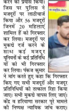
दरज किए जाएं। लाठी चार्ज में घायल मजदूरों का सरकारी खर्च पर इलाज किया जाए और मुआवजा दिया जाए। मजदूर विरोध 4 लेबर कोड रह जाएं। टेका प्रथा समाप्त कर स्थाई कार्य के लिए

स्थाई नियुक्ति की जाए। महिला मजदूरों के नाइट शिफ्ट में काम