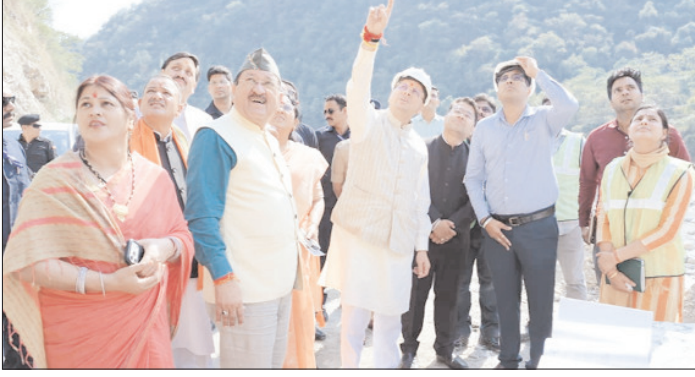
■ जवाड़ी बाईपास, निर्माणाधीन सुरंग, तिलवाड़ा में हटाए गए अतिक्रमण ■ बांसवाड़ा और कुंड-काकड़ागाड़ जैसे भूस्खलन संभावित संवेदनशील क्षेत्रों का किया निरीक्षण

शाह टाइम्स ब्यूरो रुद्रप्रयाग। विश्व प्रसिद्ध केदारनाथ धाम की आगामी 22 अप्रैल से शुरू होने वाली यात्रा को लेकर प्रदेश सरकार पूरी तरह सक्रिय हो गई है। यात्रा को सुरक्षित, सुव्यवस्थित और श्रद्धालुओं के लिए सुगम बनाने हेतु व्यापक तैयारियां की जा रही हैं। इसी क्रम में मुख्यमंत्री पुष्कर सिंह धामी जनपद रुद्रप्रयाग पहुंचे और ग्राउंड जीरो पर यात्रा व्यवस्थाओं का स्थलीय निरीक्षण किया।