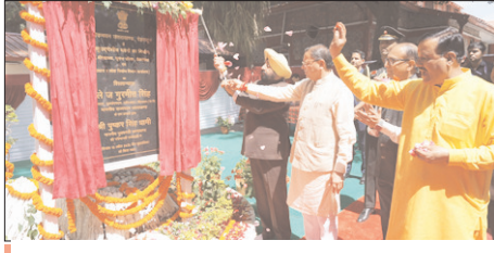
एक ही परिसर में मिलेंगे समेकित सुविधाएं, राज्यपाल व मुख्यमंत्री ने किया बहुउद्देशीय भवनों का शिलान्यास, पारंपरिक पहाड़ी वास्तुकला के अनुरूप बनेंगे लोक भवन के नए भवन

शाह टाइम्स ब्यूरो देहरादून। राज्यपाल लेफ्टिनेंट जनरल गुरमीत सिंह (से नि) एवं मुख्यमंत्री पुष्कर सिंह धामी ने गुरुवार को लोक भवन परिसर में बहुउद्देशीय भवनों का शिलान्यास किया। लोक भवन परिसर में निर्मित किए जाने वाले इन भवनों में विभिन्न आवश्यक सुविधाओं का समावेश किया जाएगा। प्रथम भवन में एक समेकित डिस्पेंसरी का निर्माण किया जाएगा, जिसमें आयुर्वेदिक, होम्योपैथिक एवं एलोपैथिक चिकित्सा कक्ष शामिल होंगे। वहीं दूसरे भवन में सूचना परिसर एवं कैफेटेरिया, तृतीय भवन में लोक निर्माण विभाग कार्यालय एवं चतुर्थ भवन में उद्यान विभाग कार्यालय का निर्माण किया जाना है। इन भवनों का निर्माण पारंपरिक