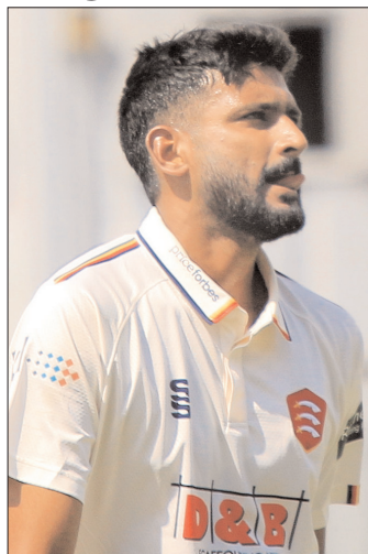
इसी ट्रनिंग में उन्होंने मुंबई को खिलाफ 27 गेंदों पर नाबाद 64 रन भी बनाए थे। सीएसके ने अब तक पांच मैचों में दो जीत हासिल की है।