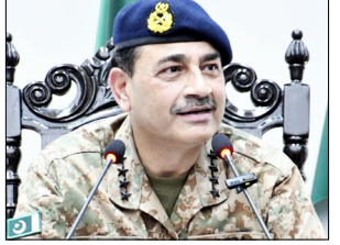
सात अप्रैल को शुरू हुआ दो सप्ताह का नाजुक युद्धविरोध 20 अप्रैल को समाप्त होने वाला है

तेहरान। अमेरिका से मिले एक नए संदेश के साथ, पाकिस्तान के सेना प्रमुख आसिम मुनीर के नेतृत्व में एक उच्च स्तरीय पाकिस्तानी प्रतिनिधिमंडल पश्चिम एशिया में तनाव कम करने के प्रयास में ईरान और अमेरिका के बीच वार्ता के एक नए दौर की संभावना पर ईरानी अधिकारियों के साथ बातचीत कर रहा है। सात अप्रैल को शुरू हुआ दो सप्ताह का नाजुक युद्धविरोध 22 अप्रैल को समाप्त होने वाला है। इस्लामाबाद में रविवार को बिना किसी समझौते के समाप्त हुई प्रारंभिक वार्ता के बाद पाकिस्तान आगे की वार्ता के लिए समन्वय कर रहा है। पाकिस्तान के गृह मंत्री मोहसिन नकवी भी मध्यस्थता प्रयासों में शामिल हैं जबकि प्रधानमंत्री शहबाज शरीफ राजनैतिक वार्ता को आगे बढ़ाने के लिए चार दिवसीय खाड़ी दौर के पहले पड़ाव के रूप में सजुदी अरब में हैं। पाकिस्तानी अधिकारी दूसरे दौर की वार्ता के लिए युद्धविरोध को बढ़ाने की उम्मीद कर रहे हैं और क्षेत्रीय साझेदारों को यह समझाने की कोशिश कर रहे हैं कि वे अमेरिका पर प्रभाव का इस्तेमाल करके ईरान के साथ