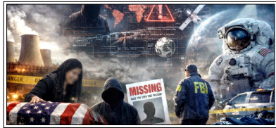
वैज्ञानिकों के लापता या मौत के सभी मामलों में अमेरिका की हाई-सिक्क्योरिटी रिसर्च संस्थाओं से जुड़े बताए जा रहे हैं

वाशिंगटन। अमेरिका में न्यूक्लियर और स्पेस रिसर्च से जुड़े वैज्ञानिकों की मौत और गुमशुदगी के मामलों पर अब व्हाइट हाउस सवालियों के घेरे में है। 2023 से अब तक ऐसे 10 मामलों सामने आए हैं, जिनमें वैज्ञानिक या अधिकारी या तो लापता हो गए या संदिग्ध हालात में मरे।