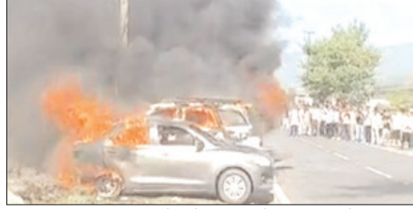
आग पर काबू पाया और आसपास खड़ी अन्य गाड़ियों को सुरक्षित हटा लिया, जिससे बड़ा हादसा टल गया।

शाह टाइम्स संवाददाता विकासनगर। जीवनगढ़ क्षेत्र विकासनगर में उस समय अफरातफरी मच गई, जब एक वैडिंग प्वाइंट के बाहर खड़ी कारों में अचानक आग लग गई। बताया जा रहा है कि शादी समारोह के दौरान बारात में आए कुछ युवक आतिशबाजी कर रहे थे, तभी चिंगारी पास में खड़ी गाड़ियों पर गिर गई और देखते ही देखते आग