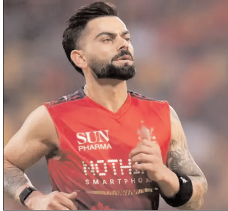
टीम ने पहले गेंदबाजी चुनी थी और वह प्लेइंग 7 का हिस्सा नहीं थे। इससे पहले मुंबई इंडियंस के खिलाफ मैच में भी वह मैदान से बाहर रहे थे। कोहली ने बताया कि उस मैच में उनके घुटने में दर्द हुआ था और बुधवार के मैच से पहले भी वह पूरी तरह फिट नहीं थे। रजत पाटीदार बुधवार को एलएसजी के खिलाफ 13 गेंदों पर 27 रन बनाकर तीसरे स्थान पर पहुंच गए। कोहली, क्लासन और पाटीदार के अलावा ईशान किशन और वैभव सूर्यवंशी ही ऐसे बल्लेबाज हैं जिनके इस सीजन में 200 से ज्यादा रन हैं। पंपल कैप लीडरबोर्ड चेन्नई सुपर किंग्स के तेज गेंदबाज अंशुल कम्बोज और गुजरात टाइटंस के प्रसिद्ध कृष्णा 10 विकेट के साथ संयुक्त रूप से शीर्ष पर बने हुए हैं।

सनराइजर्स हैदराबाद के विकेटकीपर बल्लेबाज हेनरिक क्लासेन 224 रन के साथ दूसरे स्थान पर हैं। यह पहली बार था जब आरसीबी ने कोहली को इम्पैक्ट प्लेयर के रूप में इस्तेमाल किया।