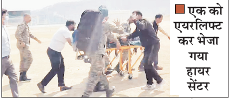
■ एक को एयरलिफ्ट कर भेजा गया हायर सेंटर

शाह टाइम्स संवाददाता चमोली। उत्तराखंड के चमोली जिले में बड़ा सड़क हादसा हुआ है, जहां गोपेश्वर-चोपता मोटर मार्ग पर सेना का एक वाहन अनियंत्रित होकर गहरी खाई में जा गिरा। इस हादसे में दो जवान गंभीर रूप से घायल हो गए, जिन्हें गोपेश्वर जिला अस्पताल ले जाया गया। जिसके बाद एक को गंभीर हालत को देखते हुए सेना के हेलीकॉप्टर से एयरलिफ्ट कर हायर सेंटर भेज दिया गया है।