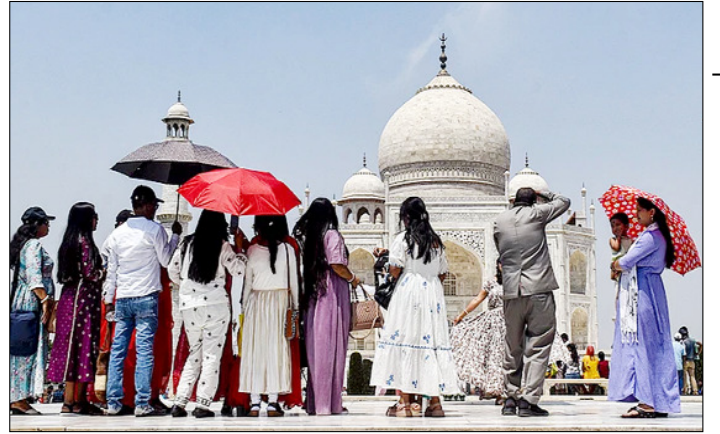
अगरा। गीष्ण गर्मी के बीच ताजमहल का दौरा करते पर्यटक।