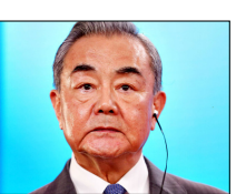
सामान्य आवागमन फिर से बहाल करने के प्रयास अंतर्राष्ट्रीय समुदाय की ओर से एक सर्वसम्मत आह्वान का प्रतिनिधित्व करते हैं। वांग ने कहा कि वर्तमान स्थिति युद्ध और शांति के बीच एक नाजुक मोड़ पर खड़ी है लेकिन इसके साथ उन्होंने यह भी कहा कि कूटनीतिक समाधान के लिए अवसर से मानना है कि दरवाजा भी खुल रहा है। ईरानी

बीजिंग। चीन के विदेश मंत्री वांग इं ने अपने ईरानी समकक्ष अब्बास अराघची से कहा है कि होमज जलडमरूमध्य को खोलना अंतर्राष्ट्रीय समुदाय की सर्वसम्मत मांग है। वांग ने ईरान के विदेश मंत्री अब्बास अराघची से फोन पर बात करते हुए इस बात पर जोर दिया कि एफ और जहां ईरान की संप्रभुता, सुरक्षा और एक तटीय राज्य के रूप में उसके वैध अधिकारों के सम्मान की आवश्यकता है, वहीं दूसरी ओर इस जलडमरूमध्य से नौहन की स्वतंत्रता और समुद्री सुरक्षा को गारंटी भी दी जानी चाहिए वांग ने कहा कि इस जलडमरूमध्य से