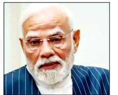
दोनों देश रक्षा, समीकन-डक्ट, क्वांटम और जैव प्रौद्योगिकी के क्षेत्र में भी अपनी साझेदारी को सुदृढ़ करेंगे

नई दिल्ली। प्रधानमंत्री नरेंद्र मोदी ने कहा है कि ऑस्ट्रिया के चांसलर क्रिश्चियन स्टॉर्कर को भारत यात्रा से दोनों देशों के बीच व्यापार और निवेश के क्षेत्र में नई ऊर्जा आएगी और ऑस्ट्रिया की विभिन्न क्षेत्रों में विशेषज्ञता तथा भारत की गति और पैमाना दुनिया के लिए विश्वसनीय आपूर्ति श्रृंखला सुनिश्चित करेगा। दोनों देश रक्षा, समीकन-डक्ट, क्वांटम और जैव प्रौद्योगिकी के क्षेत्र में भी अपनी साझेदारी को सुदृढ़ करेंगे।