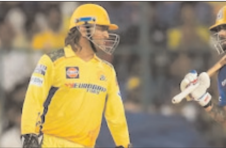
रॉयल चैलेंजर्स बेंगलुरु बनाम चेन्नई सुपर किंग्स कभी भी सिर्फ क्रिकेट नहीं रहा है, यह एक नाटक है, और कभी-कभी, आंकड़ों के साथ परोसा गया दिल टूटने का एहसास भी

है। क्रिकेट की भाषा में, इसे मोमेंटम (गति) कहा जाता है। इंसानी भाषा में, इसे आत्मविश्वास कहा जाता है जो कभी-कभी धमड को हट तक पहुंच जाता है। दूसरी ओर, चेन्नई एक ऐसे अनुभवी सज्जन की तरह आती है जिसने अपना चरमा कहीं खो दिया हो। उन्हें पता है कि क्या करना है, उन्हें याद है कि यह कैसे करना है, लेकिन किसी तरह, इस सीजन के शुरुआती मैचों में इसे ठीक से कर पाना उनके लिए मुश्किल रहा है। दो हारों ने पहले ही दबे-छिपे सवाल उठाने शुरू कर दिए हैं, ऐसे सवाल जो पहले तो विनम्रता से पूछे जाते हैं, और फिर जब नतीजे बेहतर नहीं होते तो जोर से दोहराए जाते हैं। बेंगलुरु की बल्लेबाजी कुछ ऐसी रही है कि दर्शक गेंदबाजों के अस्तित्व को ही भूल जाते हैं। विराट कोहली एक बार फिर इस उथल-पुथल के बीच एक मजबूत सहारा बने हैं,