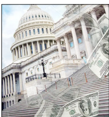
शिक्षा-विदेशी मदद में कटौती की तैयारी

वाशिंगटन। अमेरिका के राष्ट्रपति डोनाल्ड ट्रम्प ने वित्त वर्ष 2027 के लिए अमेरिकी इतिहास का सबसे बड़ा रक्षा बजट पेश किया है। ट्रम्प प्रशासन ने डेढ़ खरब डॉलर के रिकार्ड रक्षा बजट का प्रस्ताव पेश किया है। यह रक्षा बजट में 44 प्रतिशत की बढ़ी वृद्धि है, जिससे पेंटागन के खर्च में खासी बढ़ोतरी होगी। रक्षा बजट बढ़ाने के लिए कई घरेलू कार्यक्रमों में कटौती करने की तैयारी है। व्हाइट हाउस ने अपने आधिकारिक बजट प्रस्ताव में कहा कि राष्ट्रीय रक्षा के लिए पहले दिए गए ऐतिहासिक 1 खरब डॉलर के बजट को आगे बढ़ाते हुए 2027 के लिए 1.5 खरब डॉलर की मांग की गई है, जो 44 प्रतिशत की वृद्धि है। अमेरिकी प्रशासन का कहना है कि यह प्रस्ताव बढ़ते सुरक्षा दबावों के बीच अमेरिका की सैन्य बढ़त को बनाए रखने में मदद करेगा।