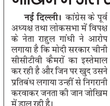
राहुल गांधी ने फेसबुक पर एक पोस्ट में कहा कि सरकार से जब उन्हीं संसद में इस बारे में सवाल पूछा तो ठोस जवाब नहीं दिया गया। उनका कहना था कि सरकार ने हाल में चीनी सीसीटीवी कैमरों के सार्वजनिक उपयोग पर प्रतिबंध लगाया लेकिन सरकार इमारतों के अंदर चीनी कैमरे अब भी लगे हुए हैं। प्रतिबंधित चीनी एप्स बदले हुए नामों के साथ फिर से सामने आ रहे हैं। विदेशी एआई प्लेटफॉर्म संवेदनशील डेटा प्रोसेस कर रहे हैं और सरकार के पास इन सबके बारे में कहने के लिए कुछ भी नहीं है। नैन संसद में इलेक्ट्रॉनिक्स और आईटी मंत्रालय से सवाल पूछा। जवाब में बहुत कुछ कहा गया लेकिन जो पूछा गया था लेकिन सरकारी इमारतों के अंदर चीनी कैमरे अब भी लगे हुए हैं। हमारे कैमरे किन देशों से आए। उनमें से किन सुरक्षा की दृष्टि से प्रमाणित हैं।

नई दिल्ली। कांग्रेस के पूर्व अध्यक्ष तथा लोकसभा में विपक्ष के नेता राहुल गांधी ने आरोप लगाया है कि मोदी सरकार चीनी सीसीटीवी कैमरों का इस्तेमाल कर रही है और जिन पर खूब उसने प्रतिबंध लगाया उन्हीं से निगरानी करवाकर जनता की जान जोखिम में डाल रही है।