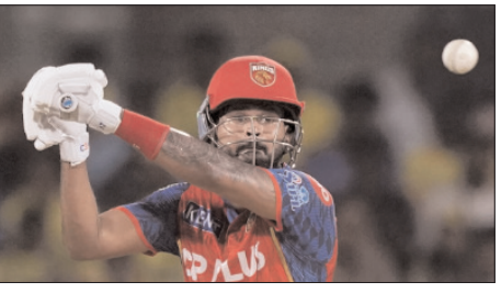
श्रेयस अय्यर पर लगा 24 लाख का जुर्माना चेन्नई। पंजाब किंग्स के कप्तान श्रेयस अय्यर पर जुर्माना लगाया गया है, क्योंकि उनकी टीम ने चेन्नई के एएम चिदंबरम स्टेडियम में चेन्नई सुपर किंग्स के खिलाफ टाटा आईपीएल 2026 के मैच नंबर 7 के दौरान धीमी ओवर-रेट बनाए रखी। चौकी आईपीएल की आचार संहिता के अनुच्छेद 2-22 के तहत यह उनकी टीम का इस सीजन का दूसरा अपराध था - जो न्यूनतम ओवर-रेट अपराधों से संबंधित है - इसलिए अय्यर पर 24 लाख का जुर्माना लगाया गया। प्लेडिंग ग् के बाकी सदस्यों पर, जिसमें इम्पैक्ट प्लेयर भी शामिल है, या तो 6 लाख रुपये या उनकी संबंधित मैच फीस का 25 प्रतिशत जुर्माना लगाया जाएगा।

चेन्नई। पंजाब किंग्स के कप्तान ने कहा कि हमने ड्रेसिंग रूम में फैंसला किया है कि चाहे कुछ भी हो जाए हम एक ब्रांड वाली क्रिकेट खेलेंगे जो एक-दूसरे को प्रभावित करने वाली होगी, न कि बाहर के लोगों को। इंडियन प्रीमियर लीग (आईपीएल) 2026 के सातवें मुकाबले में पंजाब किंग्स ने 200 से अधिक रनों के लक्ष्य का सफलतापूर्वक नौवां बार पीछा किया है। इस टूर्नामेंट में यह किसी टीम द्वारा सर्वाधिक बार किया गया कारनामा है और वे यहाँ तक चेन्नई सुपर किंग्स के खिलाफ पांच विकेट की जीत के साथ पहुंचे हैं। मुकाबला जीतने के बाद श्रेयस ने कहा, हमने ड्रेसिंग रूम में ए निर्णय लिया है कि चाहे कुछ भी हो जाए हम एक ब्रांड वाली क्रिकेट खेलेंगे जो एक-दूसरे को प्रभावित करने वाली होगी, न कि