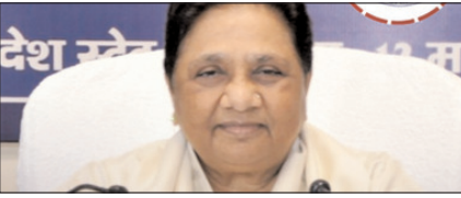
अंबेडकर जयंती पर शक्ति प्रदर्शन, लखनऊ में भारी भीड़ जुटाने की तैयारी

नई दिल्ली, मुजफ्फरनगर, देहरादून, हल्द्वानी, मुगदाबाद, बरेली, मेरठ व लखनऊ से प्रकाशित