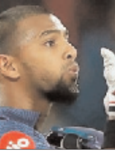
हैदराबाद की एक गर्म दोपहर में, दो टीमों बहुत अलग-अलग तरह के बोझ लेकर मैदान में उतर रही हैं, एक के पास आत्मविश्वास का बोझ है, तो दूसरी के पास सुधार करने का

इस सीजन में हैदराबाद की सफलता में उन्हें एक अहम खिलाड़ी बनाया है। यहां तक कि उनके कप्तान, इशान किशन ने भी टीम को आगे बढ़ाने में अपनी भूमिका निभाई है। उन्होंने कप्तानी और बैटिंग, दोनों जम्मेदारियों को पूरी लगन के साथ निभाया है। कुल मिलाकर, हैदराबाद लगातार 200 से ज्यादा का स्कोर बना रही है यह एक ऐसा ट्रेंड है जो न सिर्फ उनकी अच्छी फॉर्म को दिखाता है, बल्कि उनकी खेल की सोच को भी जाहिर करता है। हालांकि, उनकी गेंदबाजी की कहानी थोड़ी ज्यादा उलझी हुई है। जहां जयदेव उनादकट और इशान मलिंगा जैसे खिलाड़ियों ने बीच-बीच में असरदार गेंदबाजी करते हुए कुछ अहम विकेट लिए हैं, वहीं पुरी गेंदबाजी यूनिट में लगातार अच्छा प्रदर्शन करने की कमी दिखी है। रन काफी ज्यादा दिए गए हैं,