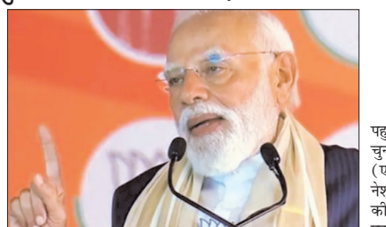
मोदी ने विपक्षी दल कांग्रेस, एलडीएफ और यूडीएफ पर जमकर प्रहार

केरल में चुनावी विगुल बज चुका है और इसी कड़ी में प्रधानमंत्री नरेंद्र मोदी ने शनिवार को सबूत के तिरुवेल्ला में एक विशाल जनसभा को संबोधित किया। अपने संबोधन में पीएम मोदी ने विपक्षी दल कांग्रेस, लेफ्ट डेमोक्रेटिक फ्रंट (एलडीएफ) और यूनाइटेड डेमोक्रेटिक फ्रंट (यूडीएफ) पर जमकर प्रहार किए। पीएम ने कांग्रेस पर बेहद गंभीर आरोप लगाते हुए कहा कि कांग्रेस पार्टी सिर्फ चुनावी फायदे और मुझे गाली देने के लिए एक करोड़ प्रवासियों की जिंदगी दांव पर लगाने को तैयार है। प्रधानमंत्री ने कहा कि कांग्रेस की मंशा बेहद खतरनाक है। वे चाहते हैं कि पश्चिम एशिया के देश भारत को अपना दुश्मन समझ लें। उन्होंने कहा कि कांग्रेस चाहती है कि हम यहां कोई ऐसी गलती कर दें या कोई ऐसा बयान दें, जिससे खाड़ी देशों में रह रहे हमारे भारतीय भाई-बहनों पर बड़ी मुसीबत आ जाए। पीएम मोदी ने सीधे तौर पर कहा कि कांग्रेस जानबूझकर खाड़ी देशों को नाराज करने वाले बयान दे रही है, जिससे देश में डर का माहौल बने और उन्हें केंद्र सरकार को कोसने का मौका मिल सके। प्रधानमंत्री ने विरोधियों को कड़ा संदेश देते हुए कहा कि मैं कांग्रेस और एलडीएफ-यूडीएफ के लोगों से साफ कह देना चाहता हूँ कि राजनीति अपना जगह है और चुनाव आते-जाते रहेंगे। मेरे लिए केरल के जो लाखों लोग वहां काम कर रहे हैं, उनकी सुरक्षा सबसे बड़ी प्राथमिकता है और मैं इसके लिए पूरी तरह प्रतिबद्ध हूँ। प्रधानमंत्री ने केरल को संस्कृति नगरी और हॉलीवूड का लक्ष्य भी विषय को आड़े हाथों लिया।