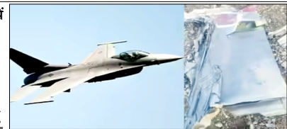
फाइटर जेट को मार गिराया गया। यह ईरान के दक्षिण-पश्चिम हिस्से में उड़ान भर रहा था। एफ-5ई फाइटर जेट के क्रू को दूढ़ने के लिए अमेरिकी विमान 1-10 अटैक एयरक्राफ्ट पहुंचा तो उस पर भी हमला हुआ। ए-10 हमले के बाद कुवैत के हवाई क्षेत्र तक पहुंच गया, जहां पायलट ने सुरक्षित तरीके से इजेक्ट किया। पायलट सुरक्षित है, हालांकि विमान कुवैत में क्रैश हो गया। एफ-5ई में दो क्रू मैनबर थे। इनमें से एक को सुरक्षित निकाल लिया गया है, जबकि दूसरा लापता है। ईरानी सरकारी मीडिया का

पिछले 24 घंटों में अमेरिका के दो सैन्य विमान और सर्च ऑपरेशन में लगे दो ब्लैकहॉक हेलीकॉप्टर ईरान के हमले का शिकार हुए