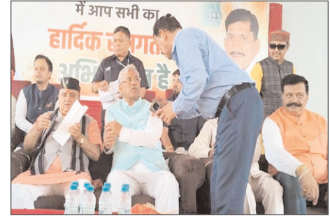
मांग की है। अशोक नगर के जर्जर सभागार के निर्माण के लिए सांसद निधि से धन आवंटित करने, 2-ढंढेरा के फाटक में 512पर 2013 से