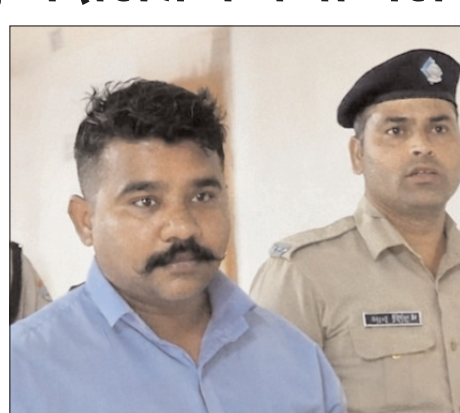
हेट स्पीच पर दून पुलिस का सख्त प्रहार