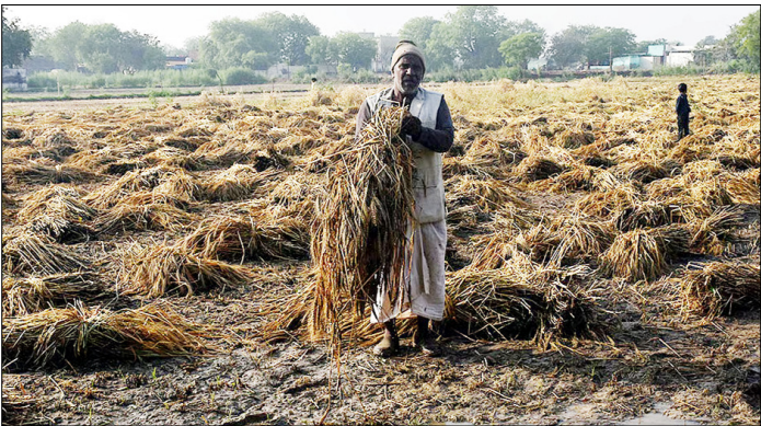
आगरा। कई गांवों में बारिश और ओलावृष्टि के बाद क्षतिग्रस्त हुए गेहूँ की फसल को इकट्ठा करता मजदूर।