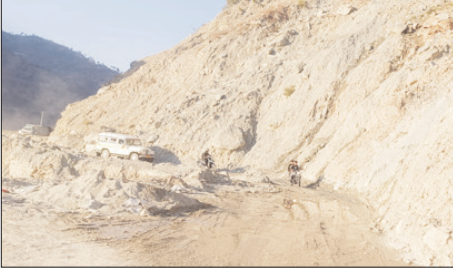
■ गंगोत्री-यमुनोत्री मार्गों की बहाल स्थिति, यात्रियों की बढ़तेगी मुश्किलें

चिरंजीव सेमवाल उत्तरकाशी। चारधाम यात्रा के लिए तैयारियां जोरों पर हैं, लेकिन जमीनी हकीकत यह है कि तीर्थयात्रियों के लिए डगर अभी भी आसान नहीं है। गंगोत्री हाईवे पर धरासू, नाल्पाणी, रतूड़ी सेरा, नैताला, लालढांग, लिम्बुवागाड पुल भी संकरी सड़क के कारण यात्रा में बाधा डाल रहा है।