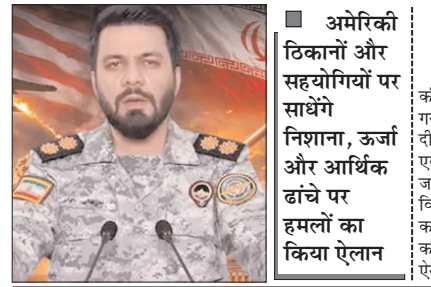
संभव कदम उठाएगा। ईरान ने सिर्फ अमेरिकी सैन्य ठिकानों ही नहीं, बल्कि उन देशों को भी चेतावनी दी है जो अपने यहां अमेरिकी सैन्य बेस को अनुमति देते हैं। प्रवक्ता ने कहा कि ऐसे देशों को अमेरिका को अपने क्षेत्र से बाहर करने के लिए कदम उठाने चाहिए, अन्यथा उन्हें भी इसका खामियाजा भुगतना पड़ सकता है। ईरानी सेना ने संकेत दिए हैं कि जवाबी कार्रवाई केवल सैन्य ठिकानों तक सीमित नहीं होगी। इसमें ऊर्जा संयंत्र, ईंधन केंद्र और आर्थिक ढांचे भी निशाने पर हो सकते हैं। बयान में कहा गया है कि यह कार्रवाई पहले से कहीं ज्यादा व्यापक और कठोर होगी। यह पूरा