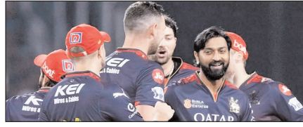
आरसीबी के खिलाफ सीएसके को करनी होगी वापसी