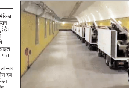
संख्या में मौजूद हैं, जो होर्मुज स्ट्रेट में जहाजों के लिए खतरा बनी हुई हैं। ब्राइड हाउस ने इन खुफिया आकलनों पर सवाल उठाते हुए कहा कि गुप्तता सूत्र टप्पू की छवि खराब करने की कोशिश कर रहे हैं। सरकार का दावा है कि ईरान की नौसेना लगभग खत्म हो चुकी है, वो-तिहाई सैन्य उत्पादन क्षमता नष्ट हो गई है और अमेरिका तथा इजरायल को हवाई बंदूक हासिल है। रक्षा मंत्री पीट हेंगसेथ ने भी कहा है कि ईरान के मिसाइल और ड्रोन हमलों में करीब 90 प्रतिशत की कमी आई है। हालांकि जमीनी स्थिति इससे अलग

लगातार पांच हफ्तों से जारी अमेरिकी और इजरायल के हमलों के बावजूद ईरान की सैन्य क्षमता पूरी तरह खत्म नहीं हुई है। अमेरिकी खुफिया आकलन, जिसका हवाला सीएनएन ने तीन सूत्रों के जरिये बताया है कि ईरान के करीब आधे मिसाइल लॉन्चर अब भी सुरक्षित हैं और उसके पास हजारों आत्मघाती ड्रोन मौजूद हैं। खुफिया रिपोर्ट के अनुसार, कुछ लॉन्चर ऐसे हैं, जो हमलों के बाद जमीन के नीचे दब गए हैं या पहुंच से बाहर हो गए हैं, लेकिन नष्ट नहीं हुए। एक सूत्र का कहना है कि ईरान अब भी पूरे क्षेत्र में गंभीर नुकसान पहुंचाने की क्षमता रखता है। ड्रोन ताकत भी काफी हद तक बची हुई है। अनुमान है कि ईरान की लगभग आधी ड्रोन क्षमता अब भी सक्रिय है। इसके अलावा तटीय रक्षा के लिए इस्तेमाल होने वाली क्रूज मिसाइलें भी बड़ी