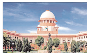
सुप्रीम कोर्ट में सबरीमाला मंदिर में महिलाओं के प्रवेश से जुड़े 2018 के फैसले की समीक्षा याचिकाओं पर अंतिम सुनवाई शुरू