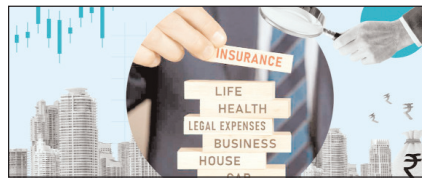
क्यों कम हुई हेल्थ इंश्योरेंस कंपनियों की विश्वसनीयता