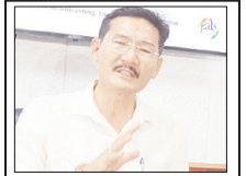
अपर आयुक्त खाद्य, नागरिक आपूर्ति एवं उपभोक्ता मामले