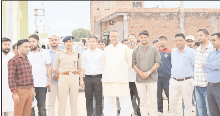
खटीमा में 9 अप्रैल को आयोजित होगा सम्मान समारोह, कार्यक्रम स्थल का किया निरीक्षण

शाह टाइम्स ब्यूरो खटीमा। सैनिक कल्याण मंत्री गणेश जोशी ने आज खटीमा पहुंचकर सुबेदार स्व० शेर सिंह धामी की 6वीं पुण्यतिथि पर 09 अप्रैल को आयोजित होने वाले सैनिक सम्मान समारोह की तैयारियों के संबंध में कार्यक्रम स्थल का स्थलीय निरीक्षण किया। निरीक्षण के दौरान सैनिक कल्याण मंत्री गणेश जोशी ने संबंधित अधिकारियों को सभी आवश्यक तैयारियां समय पर पूर्ण करने के निर्देश दिए। उन्होंने कार्यक्रम में आने वाले लोगों के बैठने, पेयजल एवं अन्य आवश्यक सुविधाओं की समुचित व्यवस्था