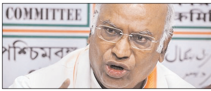
खड़गे का हिमंत् पर हमला, लगाए क्षप्टाचार के आरोप

नई दिल्ली, मुजफ्फरनगर, देहरादून, हल्द्वानी, मुगदाबाद, बरेली, मेरठ व लखनऊ से प्रकाशित