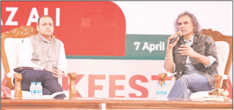
दून बुक फेस्टिवल के चौथे दिन दिग्गज फिल्म निर्माता निर्देशक अली ने विशेष सत्र में किया फिल्मी अनुभवों को साझा

मुख्य संवाददाता शाह टाइम्स देहरादून। दून बुक फेस्टिवल 2026 का चौथा दिन साहित्यिक सत्रों, चर्चाओं, सांस्कृतिक प्रस्तुतियों और आपसी बातचीत का एक दिलचस्प मेल रहा। चौथे दिन का मुख्य आकर्षण जाने-माने फिल्म निर्माता निर्देशक इम्तियाज अली रहे, जो एक विशेष सत्र में शामिल हुए। उन्होंने अपनी रचनात्मक यात्रा और निजी अनुभवों से जुड़ी बातें साझा कीं। अपने बचपन के किस्से सुनाते हुए इम्तियाज अली ने बताया कि बचपन में वह छिप-छिपकर फिल्में देखा करते थे। अपनी मशहूर फिल्म शॉकस्टार और कश्मीर में शूटिंग के अनुभवों पर बात करते हुए उन्होंने कहा कि कश्मीर में शूटिंग करना सचमुच एक बहुत ही खास और यादगार अनुभव था। बचपन के दौरान उन्होंने अपने शुरुआती दिनों और रेल यात्राओं के प्रति अपने लगाव के बारे में भी बताया। फिल्म शर्धुधर पर चर्चा करते हुए उन्होंने कहा, धरुधर अब सिनेमाघरों में वापस आने लगे हैं, और दर्शक अब एक बार फिर लंबी अवधि वाली