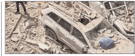
ईरान समर्थित समूहों का अमेरिकी ठिकानों पर झेन हमला