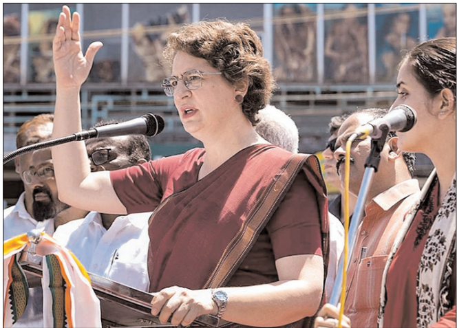
केरल विधानसभा चुनाव से पहले, वायनाड जिले के पदिनजरथारा में कांग्रेस महासचिव और वायनाड सांसद प्रियंका गांधी ने एक नुक्कड़ सभा को संबोधित किया।