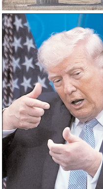
खर्ग द्वीप-पुल को बनाया निशाना, एक साथ 50 ठिकाने तबाह IRGC ने अमेरिका को लक्ष्मण रेखा पार न करने की चेतावनी दी

तबरीज-जंजान हाईवे के पुल पर भी हमला किया गया। इससे पहले अमेरिकी राष्ट्रपति डोनाल्ड ट्रम्प ने चेतावनी दी थी कि अगर ईरान ने मंगलवार को रात 8 बजे (अमेरिका समयानुसार) तक हार्मुज स्ट्रेट नहीं