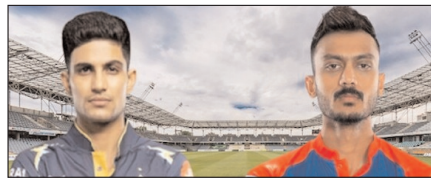
गुजरात को जीत की तलाश, दिल्ली की नजरें जीत की हैट्टिक पर खेल टाइम्स