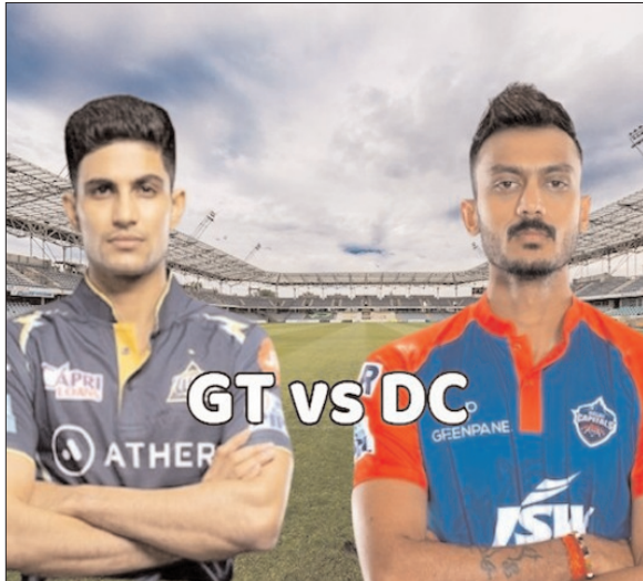
तो भी पावरप्ले के बाद उन्हें परेशान करने वाला कोई है। एनगिडी कर सकते हैं जीटी के शीर्ष क्रम को परेशान भारत में हुए टी-20 विश्व कप से ही लुगी एनगिडी

पिछले आईपीएल के दो मैचों में जीटी को दोनों में जीत मिली है, वहीं दिल्ली में भी दोनों टीमों के बीच खेले गए तीन मैचों में जीटी 2-1 से आगे है। राहुल को रहना होगा रबाडा और प्रसिद्ध से सावधान केल राहुल के लिए आईपीएल 2026 की शुरुआत कुछ खास नहीं रही है और दो मैचों में उनका स्कोर 0 और 1 का है। राहुल का यह खराब फॉर्म जीटी के खिलाफ मैच में भी जारी रह सकता है क्योंकि जीटी के तेज गेंदबाज प्रसिद्ध कृष्णा और कगिसो रबाडा उन्हें परेशान करते हैं। प्रसिद्ध अपने राज्य के साथी को सात पारियों में तीन जबकि रबाडा भी उन्हें 12 पारियों में तीन बार आउट कर चुके हैं। राशिद खान ने भी राहुल को तीन बार आउट किया है, जिसका मतलब है कि अगर राहुल टिक भी जाते हैं