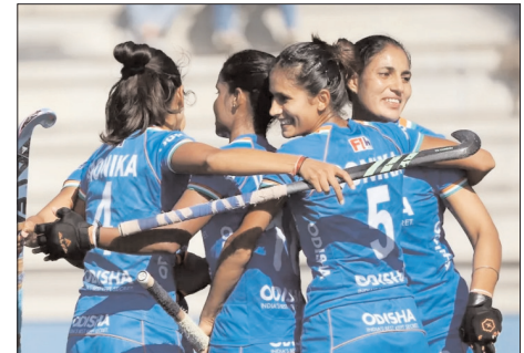
प्रदान करेगा। यह हॉकी इंडिया के रणनीतिक कैलेंडर के साथ पूरी तरह से मेल खाता है, जिसका उद्देश्य एफआईएच हॉकी विश्व कप बर्लिनजयम और नीदरलैंड्स 2026 और इस साल के अंत में होने वाले एशियाई खेलों के एकल अहम दौर में प्रवेश कर रही है। इस दौरे के बारे में बात करते हुए,

नई दिल्ली, वार्ता। भारतीय सौनियर महिला हॉकी टीम अप्रैल में अर्जेंटीना के दौरे पर जाने के लिए तैयार है। इस दौरे पर चार मैचों की एक सीरीज खेले जाएगी, जो 13 से 17 अप्रैल तक ब्यूस आर्यस के सेनाई में आयोजित होगी।