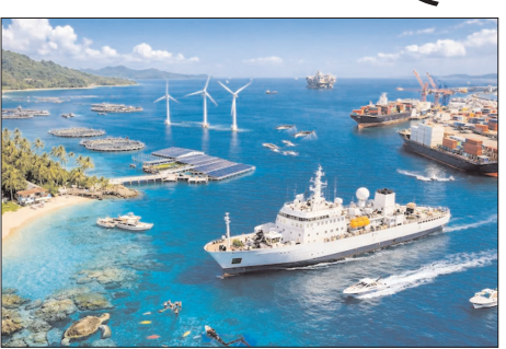
और लगातार आने वाली लहरों (स्वेल पैटर्न) के लिए प्रसिद्ध, लिटिल अंडमान उच्च-स्तरीय सर्फिंग के लिए आदर्श परिस्थितियां प्रदान करता है। विशेष रूप से बटलर बे का रीफ ब्रेक देश के सबसे संभावनाशील सर्फिंग स्थलों में से एक के रूप में उभर रहा है, जो शीर्ष स्तर की प्रतिस्पर्धीताओं की मेजबानी करने और देश-विदेश के सर्फर्स को आकर्षित करने में सक्षम है। इस पहल से न केवल भारत में प्रतिस्पर्धी सर्फिंग के स्तर को ऊंचा उठाने की उम्मीद है, बल्कि अंडमान को समुद्री खेलों और

लिटिल अंडमान, वार्ता। अंडमान एवं निकोबार द्वीपसमूह तेजी से भारत के अगले प्रमुख सर्फिंग गंतव्य के रूप में उभर रहे हैं। अंडमान पर्यटन ने इस दिशा में एक महत्वपूर्ण कदम उठाते हुए क्षेत्र में पहली बार राष्ट्रीय सर्फिंग और स्टैंड-अप पैडलिंग चैंपियनशिप, लिटिल अंडमान प्रो 2026 की मेजबानी करने जा रहा है। सर्फिंग फेडरेशन ऑफ इंडिया (एसएफआई) द्वारा आयोजित और अंडमान पर्यटन के पूर्व सहयोग से होने वाली यह चैंपियनशिप 9 से 12 अप्रैल तक बटलर बे में आयोजित होगी, जो भारत के सर्फिंग मानचित्र को पारंपरिक तटीय क्षेत्रों से आगे बढ़ाने में एक महत्वपूर्ण मील का पत्थर है। अपनी स्वच्छ तटरेखा, प्रवाल भित्तियां (कोरल रीफ)