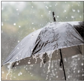
तेज आंधी-तूफान के साथ बारिश और ओले गिरने की चेतावनी दी गई है। कहीं-कहीं बिजली गिरने की भी आशंका है।

लखनऊ। यूपी में अगले 48 घंटे पश्चिमी और पूर्वी दोनों संभागों के लिए भारी हो सकती है। प्रदेश भर में आज तेज आंधी के साथ बारिश, बिजली गिरने और ओलावृष्टि की चेतावनी दी गई है। मंगलवार सुबह से नोएडा, गाजियाबाद, मेरठ समेत प्रदेश के कई जिलों में काले बादल छाए हुए हैं। कई जगहों पर बादलों की तेज गड़गड़ाहट हो रही है, तो कहीं बारिश भी देखने को मिल रही है।