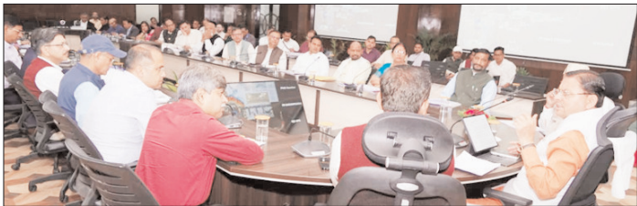
मुख्यमंत्री ने की 5 विधानसभाओं की सीएम घोषणाओं की समीक्षा

शाह टाइम्स ब्यूरो देहरादून। राज्य के पर्वतीय क्षेत्रों में स्वास्थ्य सुविधाओं को बेहतर बनाने पर विशेष ध्यान दिया जाए। विधायकगणों द्वारा अपने क्षेत्र की जन समस्याओं को उठाया जा रहा है, अधिकारी उन्हें गंभीरता से लेते हुए प्राथमिकता के आधार पर समाधान करें। जिन योजनाओं का समाधान शीघ्र हो सकता है, यह सुनिश्चित किया जाए कि उनमें अनावश्यक विलंब न हो। कार्यों में अनावश्यक देरी करने वाले अधिकारियों को जिम्मेदारी तय की जाए। विकास कार्यों में गुणवत्ता और समयबद्धता का विशेष ध्यान रखा जाए। सभी विभाग आपसी समन्वय से जन समस्याओं का समाधान करें। मुख्यमंत्री पुष्कर सिंह धामी ने मंगलवार को सचिवालय की मुख्यमंत्री घोषणाओं के अंतर्गत विधानसभा क्षेत्र थराली, कर्णप्रयाग, कंदारनाथ, रुद्रप्रयाग और देवप्रयाग की समीक्षा के दौरान ये निर्देश