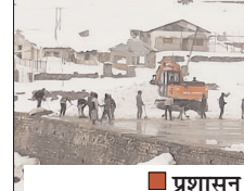
प्रशासन पूरी तरह मुस्तेद

शाह टाइम्स संवाददाता रुद्रप्रयाग। केदारनाथ यात्रा तैयारियों के बीच मौसम विघ्न पैदा कर रहा है। लगातार मौसम खराब होने के कारण तैयारियों में बाधा उत्पन्न हो रही है, जिससे मजबूर भी प्रशासन हो गए हैं। आगामी 22 अप्रैल से प्रारंभ होने वाली इस महत्वपूर्ण यात्रा से पहले विषम मौसम परिस्थितियों के बावजूद प्रशासन की टीमों धाम क्षेत्र और पैदल यात्रा मार्ग को सुचारु बनाने में लगातार जुटी हुई हैं। पिछले तीन-चार दिनों से केदारनाथ धाम क्षेत्र में हो रही भारी बर्फबारी ने चुनौतियां जरूर बढ़ाई हैं, लेकिन प्रशासन की कार्यशैली पर इसका कोई असर नहीं पड़ा है।