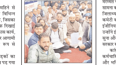
चारधाम यात्रा की तैयारियां भी प्रभावित, कांग्रेसियों ने दिया बताया डिप्लोमा इंजीनियर्स की जायज मांगें

शाह टाइम्स संवाददाता उत्तरकाशी। जिले में पिछले महिने से डिप्लोमा इंजीनियर्स महासंघ अपनी विभिन्न मांगों को लेकर हड़ताल पर डटा हुआ है, जिसका व्यापक असर अब जनजीवन पर साफ दिखाई देने लगा है। इस हड़ताल के चलते विकास कार्य, आपदा प्रबंधन से जुड़े जरूरी काम और आगामी चारधाम यात्रा की तैयारियां गंभीर रूप से प्रभावित हो रही हैं। स्थिति यह है कि जिले में सड़कों का निर्माण और मरम्मत कार्य पूरी तरह ठप पड़ गया है, जिससे आम लोगों को आवागमन में भारी दिक्कतों का सामना करना पड़ रहा है। कई स्थानों पर सड़क क्षतिग्रस्त और अवरुद्ध हैं, जो चारधाम यात्रा से पहले प्रशासन के लिए चिंता का विषय बन गई हैं। वहीं गंगोत्री धाम में सिंचाई विभाग के घाट निर्माण कार्य भी नहीं आं पदा संभावित