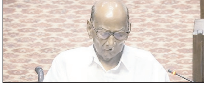
क्या भारतीय राजनीति में अब उम्र की सीमा तय होनी चाहिए सम्पादकीय