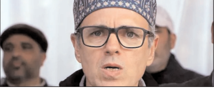
बेकाबू हो रहे इजरायल पर लगाम कसे अमेरिका: उमर अब्दुल्ला

नई दिल्ली, मुजफ्फरनगर, देहरादून, हल्द्वानी, मुतादाबाद, बरेली, मेरठ व लखनऊ से प्रकाशित