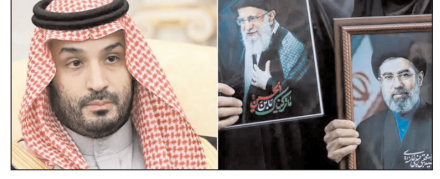
सऊदी अरब और तेहरान के बीच नजदीकियां बढ़ी