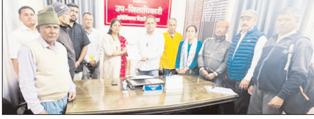
17 अप्रैल तक लोनिवि कीर्तिनगर में तालाबंदी की दी चेतावनी

शाह टाइम्स संवाददाता श्रीनगर। विकासखंड कीर्तिनगर के पट्टी बडियारागढ़ के नौडा-चोनी-धौलियाणा से तेगड़ मोटर मार्ग, छाम से खल्याणी मोटर मार्ग एवं धौड़गी से धवधार मोटर मार्ग निर्माण पर वर्षों से वित्तीय स्वीकृति न मिलने पर ग्रामीणों ने कड़ा रोष व्यक्त किया है। ग्रामीणों ने कहा कि मोटरमार्ग का सुख न मिलने से उनको कई किलोमीटर की दूरी तय करनी पड़ रही है। जिससे बुजुर्गों को खासी दिक्कतों का सामना करना पड़ रहा है।