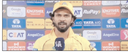
रतुराज गायकवाड़ पर लगा 12 लाख रुपये का जुर्माना