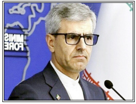
ईरान के प्रस्ताव 'व्यावहारिक' अब अमेरिका को यथार्थवादी रुख अपनाना होगा

मास्को। ईरान और अमेरिका कई मुद्दों पर सहमत हुए लेकिन दो-तीन महत्वपूर्ण मुद्दों पर असहमति होने के कारण इस्लामाबाद में हुई बातचीत के बाद समझौता नहीं हो सका। यह जानकारी ईरानी विदेश मंत्रालय के प्रवक्ता इस्माइल बगई ने दी। मेहर समाचार एजेंसी के अनुसार, बगई ने कहा कि हमारे बीच कई मुद्दों पर सहमति बनी लेकिन दो-तीन महत्वपूर्ण मुद्दों पर हमारे विचार अलग-अलग थे और अंततः वार्ता किसी समझौते पर पहुंचने में विफल रही। अमेरिकी राष्ट्रपति डोनाल्ड ट्रम्प ने आठ अप्रैल को रात ईरान के साथ दो सप्ताह के युद्धविराम समझौते की घोषणा की थी जिसके बाद, ईरान और अमेरिका ने शनिवार को इस्लामाबाद में वार्ता की।