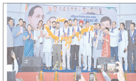
उत्तराखंड को भाजपा से बचाने के लिए करना होगा संघर्ष, युवा जागा, तो बदलेगा देश, आंबेडकर जयंती पर दून से कन्हैया ने दिया बड़ा संदेश

शाह टाइम्स प्रमुख संवाददाता देहरादून। बाबा साहेब का दिया हुआ संविधान देश की आत्मा है, मगर आज सत्ता में बैठे लोग उसी संविधान की मूल भावना पर लगातार प्रहार कर रहे हैं। सत्ताधारियों की और से नारा तो देश का दिया जा रहा है, मगर खजाना अपने दोस्त का भरा जा रहा है। यह बात रविवार को संविधान निर्माता बाबा साहेब डॉ. भीमराव अंबेडकर की 135वीं जयंती पर देहरादून में 'जय भीम, जय हिंद' कार्यक्रम में मुख्य वक्ता के रूप में पहुंचे छात्र संगठन एनएसयूआई के राष्ट्रीय प्रभारी कन्हैया कुमार ने कही। उन्होंने आरोप लगाया कि देश में नफरत, असमानता और अन्याय को बढ़ावा दिया जा रहा है, जो बाबा साहेब के सपनों के भारत के बिल्कुल विपरीत है। उन्होंने युवाओं का आह्वान करते