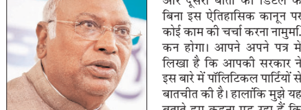
हमें भरोसे में लिए बिना विशेष सत्र बुलाया: कांग्रेस

अभी-अभी 16 अप्रैल से नारी शक्ति वंदन अधिनियम पर चर्चा के लिए संसद के स्पेशल सेशन पर आपका लेटर मिला है। यह स्पेशल सेशन हमें भरोसे में लिए बिना बुलाया गया है और आपकी सरकार होने वाले डिजिटल मिशन पर कोई डिटेल्स बताए बिना फिर से हमारा सहयोग मांग रही है।