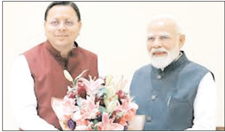
प्रधानमंत्री मोदी 28 वीं बार मंगलवार को आएंगे उत्तराखंड दौरे पर, दिल्ली-देहरादून एक्सप्रेस के साथ ही टिहरी में एक हजार मेगावाट क्षमता वाले देश के पहले वेरिएबल स्पीड पंप स्टोरेज संयंत्र का भी करेंगे लोकार्पण

शाह टाइम्स ब्यूरो देहरादून। प्रधानमंत्री नरेंद्र मोदी, मंगलवार को अपने 28 वें दौर पर उत्तराखंड पहुंच रहे हैं। मुख्यमंत्री पुष्कर सिंह धामी के साठे चार साल के कार्यकाल में यह उनका 18वां दौरा होगा। प्रधानमंत्री नरेंद्र मोदी इस दौरान दिल्ली-देहरादून एक्सप्रेस के साथ ही, टिहरी में 1 हजार मेगावाट क्षमता वाले देश के पहले वेरिएबल स्पीड पंप स्टोरेज संयंत्र का भी लोकार्पण करेंगे। प्रधानमंत्री मोदी के आगमन को लेकर उत्तराखंडवासियों में भारी उत्साह है। प्रदेश सरकार लोकार्पण समारोह को यादगार बनाने की तैयारियों में जुटी है।