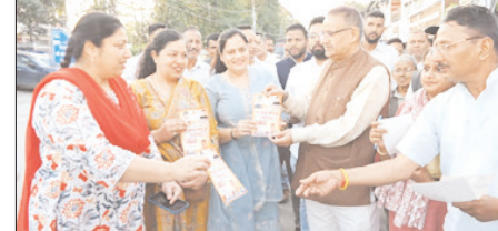
प्रधानमंत्री मोदी के उत्तराखण्ड आगमन पर हाथीबड़कुला बाजार में जनसंपर्क कर कैबिनेटमंत्री ने दिया निमंत्रण

मुख्य संवाददाता शाह टाइम्स देहरादून। कृषि एवं सैनिक कल्याण मंत्री गणेश जोशी ने आज हाथीबड़कुला बाजार में जनसंपर्क अभियान चलाकर व्यापारियों और स्थानीय लोगों को प्रधानमंत्री नरेंद्र मोदी के 14 अप्रैल को देहरादून दौरे के कार्यक्रम में शामिल होने का निमंत्रण दिया। इस दौरान उन्होंने लोगों से आत्मीय मुलाकात कर जनसभा में अधिक से अधिक संख्या में पहुंचने की अपील की। कृषि मंत्री गणेश जोशी ने केंद्र एवं राज्य सरकार द्वारा चलाई जा रही विकास योजनाओं का फीडबैक भी लिया। कृषि मंत्री गणेश जोशी ने कहा कि प्रधानमंत्री नरेंद्र मोदी का उत्तराखंड से विशेष लगाव है, जिसका प्रमाण है कि वे लगातार राज्य का दौरा करते रहते हैं। उन्होंने कहा कि प्रधानमंत्री के आगमन को लेकर प्रदेशवासियों में खासा उत्साह देखने को मिल रहा है। उन्होंने कहा कि प्रधानमंत्री मोदी ने बाबा केदार की धरती से कहा था