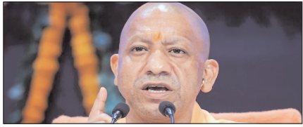
वोट बैंक के सौदागर बंगाल की डेमोग्राफी को बदलना चाहते हैं: योगी

नई दिल्ली, मुजफ्फरनगर, देहरादून, हल्द्वानी, मुगदाबाद, बरेली, मेरठ व लखनऊ से प्रकाशित