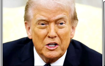
होर्मुज से पास होने वाले जहाजों की निगरानी करेगी अमेरिकी नौसेना, ईरान पर ब्लैकमेल करने का आरोप

वाशिंगटन। अमेरिका और ईरान के बीच तनाव एक बार फिर खतरनाक मोड़ पर पहुंच गया है। पाकिस्तान में हुई नाकाम शांति वार्ता के बाद अमेरिका के राष्ट्रपति डोनाल्ड ट्रम्प ने बेहद सख्त और तीखा बयान जारी किया है, जिसने वैश्विक राजनीति में हलचल मचा दी है। ट्रम्प ने आरोप लगाया कि ईरान ने होर्मुज जलडमरूमध्य खोलने का वादा किया था, लेकिन जानबूझकर उसे तोड़ा, जिससे दुनिया भर में आर्थिक अस्थिरता, डर और संकट की स्थिति पैदा हो गई है।