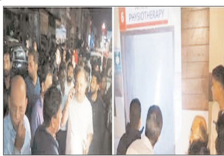
श्री और जनेरेंटर सेट व विद्युत ट्रांसफार्मर सहित भारी नुकसान हो सकता था। हालांकि इस अग्निकांड में पुराने आपातकालीन केंद्र की विद्युत वायरिंग, फिटिंग, फॉल सीलिंग, फर्नीचर और फिजियोथेरेपी से संबंधित मशीनरी सहित लाखों रुपये का सामान जलकर नष्ट हो गया। आग का असर भवन के चौथे तल तक की वायरिंग पर भी देखा गया। राहत की बात यह रही कि इस घटना में किसी भी प्रकार की जनहानि नहीं हुई। अस्पताल में भर्ती सभी मरीज, उनके तोमारदार,

शाह टाइम्स संवाददाता रुड़की। रुड़की स्थित विनय विशाल अस्पताल में शनिवार देर रात अचानक भीषण आग लगने से अफरा-तफरी का माहौल बन गया, लेकिन फायर स्टेशन रुड़की की टीम ने विषम परिस्थितियों, धुएं से भरे वातावरण और पानी की चुनौती के बीच अदम्य साहस का परिचय देते हुए आग पर समय रहते काबू पा लिया। फायर कर्मियों की तेज रिसांस टाइम और जोखिमपूर्ण कार्रवाई के चलते एक बड़ी जन-धन हानि टल गई। जानकारी के अनुसार, रात्रि लगभग 22:28 बजे फायर स्टेशन रुड़की को अस्पताल के पुराने आपातकालीन केंद्र में आग लगने की सूचना प्राप्त हुई। सूचना मिलते ही अग्निशमन अधिकारी श्री वंश