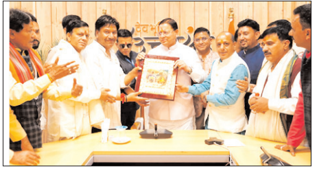
चारधाम में यात्रियों की संख्या सीमित न करने के सीएम धामी के निर्णय का स्वागत

मुख्य संवाददाता शाह टाइम्स देहरादून। राज्य सरकार द्वारा उत्तराखंड के चारों धामों में यात्रियों की संख्या सीमित करने के निर्णय पर चारों धामों से जुड़े तीर्थ पुरोहितों, पुजारियों, हितधारकों, चार धाम होटल एसोसिएशन, ट्रैवल एजेंसियों एवं विभिन्न संगठनों ने मुख्यमंत्री आवास में मुख्यमंत्री पुष्कर सिंह धामी का आभार व्यक्त किया है। इस अवसर पर चारों धामों से जुड़े तीर्थ पुरोहितों और हितधारकों ने मुख्यमंत्री को कपाट खुलने के अवसर पर आमंत्रित भी किया। मुख्यमंत्री पुष्कर सिंह धामी ने कहा कि राज्य सरकार श्रद्धालुओं की आस्था का सम्मान करते हुए चार धाम यात्रा को और अधिक सुगम एवं सुलभ बनाने के लिए प्रतिबद्ध है। राज्य में दर्शन के लिए आने वाले सभी श्रद्धालुओं की सुविधा, सुरक्षा