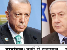
इस्तांबुल। तुर्की में इजरायल के प्रधानमंत्री बेंजामिन नेतन्याहू समेत 35 लोगों के खिलाफ केस दर्ज किया गया है।

4600 साल तक जेल की सजा की मांग, मामला गाजा जा रहे राहत मिशन पर कथित हमले से जुड़ा