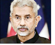
जयशंकर ने भारतीय समुदाय के लोगों को दिया पीएम मोदी का संदेश, राष्ट्रपति से भी की मुलाकात

नई दिल्ली। विदेश मंत्री एस जयशंकर के यूएई दौरे ने एक बार फिर भारत और यूएई के मजबूत रिश्तों को चर्चा में ला दिया है। उन्होंने दुबई और अबू धाबी में शीर्ष नेतृत्व से मुलाकात कर भारत की चिंताओं और प्राथमिकताओं को सामने रखा। खास तौर पर पश्चिम एशिया में चल रहे तनाव के बीच भारतीय समुदाय की सुरक्षा और दोनों देशों के रणनीतिक रिश्तों पर जोर दिया गया।