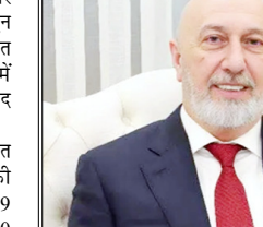
पहले दौर में किसी भी उम्मीदवार को दो-तिहाई बहुमत नहीं मिला, इसलिए मुकाबला अमेदी और अमीन के बीच दूसरे दौर में चला गया

निजार अमेदी बने देश के नए राष्ट्रपति, जल्द होगा नए पीएम का चुनाव