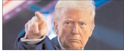
ईरान से वार्ता विफल होने पर भड़के ट्रम्प, ईरान को बताया जिम्मेदार