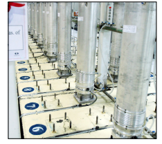
■ होर्मुज तनाव के बीच पुतिन का बड़ा दांव शांतिवार्ता के लिए पेश की ये योजना

मास्को। ईरान और अमेरिका के बीच शांति वार्ता विफल होने के बाद पश्चिम एशिया में तनाव काफी बढ़ गया है। इस बीच रूस ने भविष्य में होने वाली शांति वार्ता के लिए एक नया प्रस्ताव पेश किया है। क्रैमलिन ने सोमवार को जानकारी दी कि रूस अमेरिका के साथ किसी भी संभावित शांति समझौते के तहत ईरान का संवर्धित यूरेनियम (enriched uranium) अपने पास रखने के लिए तैयार है।