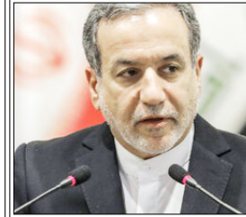
■ सहमति के बहुत करीब होने के बावजूद बदलती शर्तों और प्रतिबंधों को हमारे समक्ष लाया गया: अराघची

नई दिल्ली। ईरान के विदेश मंत्री अब्बास अराघची ने इस्लामाबाद वार्ता को विफलता के लिए अमेरिका को जिम्मेदार ठहराते हुए कहा है कि 'बदलती शर्तों और प्रतिबंधों' को हमारे सामने रखा गया।