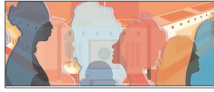
आखिर सुनी गई आधी आबादी की आवाज सम्पादकीय