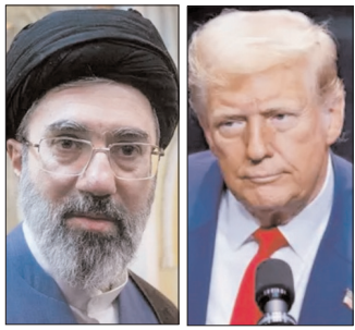
समय लिया गया है जब दोनों देशों के बीच पाकिस्तान में हुई बातचीत बिना किसी समयोत्ते के खत्म हो गई। अमेरिका का कहना है कि यह कदम ईरान पर दबाव बढ़ाने के लिए उठाया गया है। वहीं, ईरान ने इसे अंतर्राष्ट्रीय कानून के खिलाफ बताया

तेहरान, बार्ता ईरान- अमेरिका के बीच तनाव लगातार बढ़ता जा रहा है। अमेरिका ने ईरान के बंदरगाहों की नाकेबंदी का ऐलान कर दिया है। इसके जवाब में ईरान ने सख्त चेतावनी दी। ईरान की सेना ने कहा है कि अगर उसका बंदरगाहों को निशाना बनाया गया, तो फारस की खाड़ी से लेकर ओमान सागर तक कोई भी बंदरगाह सुरक्षित नहीं रहेगा। इस बयान के बाद पूरे क्षेत्र में तनाव और बढ़ गया है।