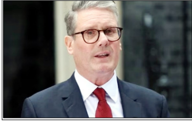
■ अमेरिका ने होर्मुज जलडमरूमध्य को नाकेबंदी में सहयोग के लिए अनुरोध नहीं किया: आस्ट्रेलिया हम चाहते हैं कि बातचीत जारी रहे और फिर से शुरू हो हम इस संघर्ष का अंत देखना चाहते हैं: अल्बानीज

लंदन/अंकारा/कैनबरा। ब्रिटेन के प्रधानमंत्री कीर स्टार्मर ने सोमवार को स्पष्ट किया कि उनका देश ईरान के खिलाफ अमेरिका के नेतृत्व वाली किसी भी नौसैनिक नाकेबंदी में शामिल नहीं होगा। उन्होंने जोर देकर कहा कि ब्रिटेन को ईरान के साथ युद्ध में नहीं घसीटा जाएगा। स्टार्मर ने कहा कि होर्मुज जलडमरूमध्य को नौवहन के लिए पूरी तरह खुला रखना उनकी प्राथमिकता है, क्योंकि इसके बंद होने से वैश्विक ऊर्जा बाजार प्रभावित हो रहे हैं और लोगों के लिए बिजली-गैस के बिल बढ़ रहे हैं।