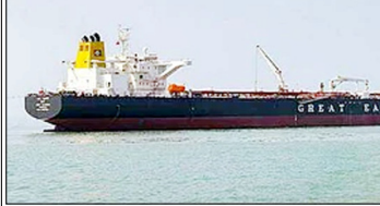
हुई है, लेकिन ये दावे पश्चिम एशिया में बढ़ते भू-राजनीतिक तनाव के बीच सामने आए हैं। इस बीच, रूस के राष्ट्रपति व्लादिमीर पुतिन ने क्षेत्रीय नेताओं से बातचीत कर कूटनीतिक समाधान की संभावनाओं पर जोर दिया है। राष्ट्रपति के सहयोगी निकोलाई पत्रुशोव ने नाटो पर 'सी शील्ड 2026' अभ्यास के जरिए काला सागर क्षेत्र में सैन्य ढांचे का विस्तार करने के आरोप लगाया है। पत्रुशोव ने कहा कि रूस का मुकाबला करने के उद्देश्य से किए जा रहे इन युद्धाभ्यासों के लिए रोमानिया को मुख्य