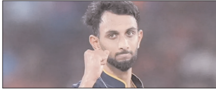
आईपीएल 2026: बेहतरीन प्रदर्शन से पर्पल कैप पर प्रसिद्ध कृष्णा का कब्जा खेल टाइम्स