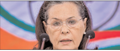
परिसीमन, महिला आरक्षण को लेकर सोनिया गांधी ने सरकार पर साधा निशाना पेज 2

नई दिल्ली, मुजफ्फरनगर, देहरादून, हल्द्वानी, मुगदाबाद, बरेली, मेरठ व लखनऊ से प्रकाशित