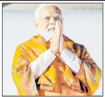
प्रधानमंत्री मोदी के आगमन को लेकर बेसब्री से इंतजार

शाह टाइम्स ब्यूरो देहरादून। प्रधानमंत्री नरेंद्र मोदी 14 अप्रैल को महत्वाकांक्षी परियोजना दिल्ली देहरादून इकोना. मिक कारिडोर एक्सप्रेसवे का उद्घाटन करेंगे। इसके साथ ही यह एक्सप्रेसवे आम लोगों के लिए विधिवत रूप से खुल जाएगा और उत्तर भारत की कनेक्टिविटी को एक नई दिशा मिलेगी। देहरादूनवासी भी इस परियोजना का बेसब्री से इंतजार कर रहे हैं। इस परियोजना के पूरे होने से देहरादून स्थित डाट काली मंदिर आने वाले यूपी के श्रद्धालुओं को 1 से डेढ़ घंटे का समय लगेगा। प्रधानमंत्री मोदी के दौरे को लेकर शासन-प्रशासन ने सभी तैयारियां पूरी कर ली हैं। मुख्यमंत्री पुष्कर सिंह धामी ने सभी व्यवस्थाओं और तैयारियों का कई बार मौके पर जाकर निरीक्षण किया है। प्रधानमंत्री मोदी के 14 अप्रैल को आगमन के दौरान 12 से 14 किमी का रोड शो भी होगा, जिसे भव्य और ऐतिहासिक बनाने की पूरी तैयारी की गई है। देहरादून से दिल्ली का सफर के दौरान मिलेंगी जाम से मुक्ति उत्तराखंड की राजधानी देहरादून