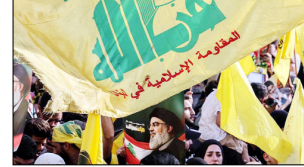
■ कहा: लेबनान सरकार का हिजबुल्लाह के खिलाफ रुख देश में आंतरिक विभाजन पैदा कर सकता है