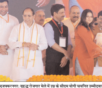
मुजफ्फरनगर: वृहद रोजगार मेले में उग्र के सीएम योगी चयनित उम्मीदवार को नियुक्ति पत्र सौंपते हुए। साथ में केंद्रीय राज्य मंत्री जयंत चौधरी व अन्य।

शाह टाइम्स ब्यूरो लखनऊ/नोएडा। नोएडा में वेतन वृद्धि और न्यूनतम मजदूरी की मांग को लेकर फेक्ट्री कर्मियों द्वारा हिंसक प्रदर्शन के बाद उत्तर प्रदेश सरकार ने तुरंत एक बड़ा कदम उठाते हुए मजदूरों और उद्योगों के बीच बढ़ते तनाव को कम करने की दिशा में पहल की है। मुख्यमंत्री योगी आदित्यनाथ के