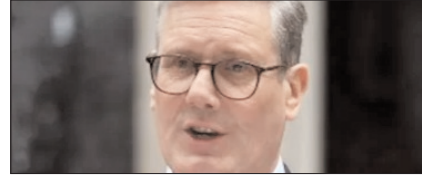
ब्रिटेन होर्मुज स्ट्रेट की नाकेबंदी में शामिल नहीं होगा: स्टार्मर पेज 12