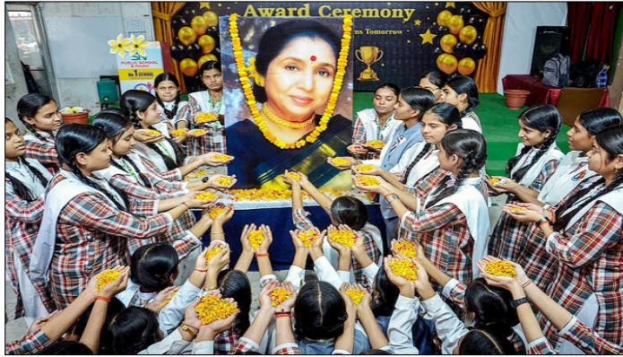
निर्जापुर। दिवंगत दिग्गज पावर गायिका आशा भोसले को श्रद्धांजलि अर्पित करती छात्राएं।