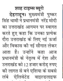
शाह टाइम्स ब्यूरो देहरादून। मुख्यमंत्री पुष्कर सिंह धामी ने प्रधानमंत्री नरेंद्र मोदी का उत्तराखंड आगमन पर स्वागत करते हुए कहा कि उनका प्रत्येक दौरा उत्तराखंड के लिए नई ऊर्जा और विकास की नई सीगात लेकर आता है। उन्होंने कहा आज प्रधानमंत्री के नेतृत्व में देश और उत्तराखंड को 12 हजार करोड़ रुपये की लागत से बने एशिया के सबसे लंबे एलिवेटेड वाइल्डलाइफ कॉरिडोर की सीगात मिल रही है।