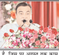
■ सड़क परिवहन, राजमार्ग मंत्री ने रखा विकास परियोजनाओं का खिचण ■ केंद्र सरकार के सहयोग से उत्तराखण्ड में चल रहा करीब एक लाख 30 हजार करोड़ के प्रोजेक्ट पर काम

शाह टाइम्स ब्यूरो देहरादून। केंद्रीय सड़क परिवहन और राजमार्ग मंत्री नितिन गडकरी ने अपने संबोधन में कहा कि दिल्ली देहरादून इकोनॉमिक कॉरिडोर उत्तराखण्ड के विकास को नई गति प्रदान करेगा। उन्होंने कहा कि केंद्र सरकार के सहयोग से उत्तराखण्ड में करीब एक लाख 30 हजार करोड़ के प्रोजेक्ट पर काम चल रहा है। गडकरी ने कहा कि सहानुर बाईपास से हरिद्वार तक 51 किलोमीटर छह लेन रोड का भी जून में उद्घाटन होने जा रहा है। इसी तरह 1650 करोड़ के लागत से पौटा साहिब से देहरादून फोर लेन मार्ग अगले महीने तक शुरू हो जायेगा। 1600 करोड़ की लागत से हरिद्वार में फोर लेन ग्रीन फील्ड बाईपास फंज-1 अक्टूबर, 2026 तक पूरा हो जायेगा, जिससे हरिद्वार और ऋषिकेश जाने में टूटिक जाम की समस्या हल होगी। इसके साथ ही केंद्र सरकार ने 1100 करोड़ की लागत से ऋषिकेश बाईपास परियोजना को भी मंजूरी प्रदान कर