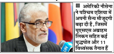
अमेरिकी नौसेना ने पश्चिम एशिया में अपनी सैन्य मौजूदगी बढ़ा दी है, जिसमें यूएसएस अब्राहम लिंकन सहित कई युद्धपोत और 11 विध्वंसक तैनात हैं

न्यूयॉर्क। ईरान ने अमेरिका द्वारा उसके बंदरगाहों की कथित नौसैनिक नाकेबंदी की कड़ी निंदा करते हुए इसे उसकी संप्रभुता और क्षेत्रीय अखंडता का 'घोर उल्लंघन' बताया है। संयुक्त राष्ट्र में ईरान के स्थायी प्रतिनिधि अमीर साईद इरावानी ने संयुक्त राष्ट्र महासचिव एंटीनियो गुटेरेस और संयुक्त राष्ट्र सुरक्षा परिषद के अध्यक्ष को लिखे पत्र में इस कदम को 'अवैध आक्रामक कार्रवाई' करार दिया, जो क्षेत्रीय और अंतर्राष्ट्रीय शांति के लिए खतरा है। इरावानी ने कहा कि 12 अप्रैल को यूएस सेंट्रल कमांड द्वारा घोषित यह नाकेबंदी संयुक्त राष्ट्र चार्टर के अनुच्छेद 2(4) का उल्लंघन है और अंतर्राष्ट्रीय कानून के तहत 'आक्रामकता का स्पष्ट उदाहरण' है। उन्होंने आरोप लगाया कि यह कदम ईरान के बंदरगाहों से आने-जाने वाले समुद्री यातायात को रोकने का प्रयास है, जिससे न केवल ईरान के संप्रभु अधिकारों में हस्तक्षेप हो रहा है, बल्कि तीसरे देशों और वैध समुद्री व्यापार के अधिकारों का भी उल्लंघन हो रहा है। ईरानी दूत ने चेतावनी दी कि तेहरान अपनी संप्रभुता और राष्ट्रीय हितों की रक्षा के लिए 'सभी आवश्यक और उचित कदम'