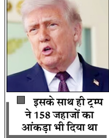
इसके साथ ही ट्रम्प ने 158 जहाजों का आंकड़ा भी दिया था

ट्रम्प का दावा: ईरान सैन्य और अन्य रूप से 'पूरी तरह से तबाह' हो चुका है