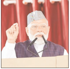
शाह टाइम्स ब्यूरो देहरादून। सिर पर ब्रह्मकमल टोपी, भाषण में गढ़वाली कुमाऊं की छोटे-छोटे वाक्य और भावनाओं में उत्तराखंड की बेहतरी।