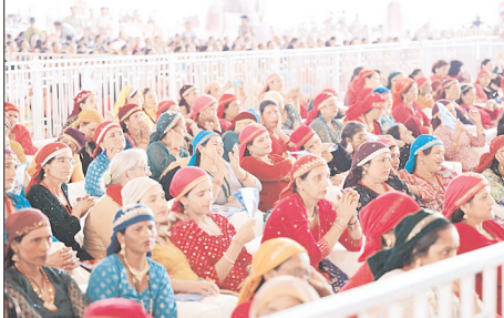
■ एक्सप्रेस-वे के उद्घाटन कार्यक्रम में प्रधानमंत्री मोदी का जबरदस्त लोकल कनेक्ट ■ मां डाट काली से लेकर पंच बदरी-केदार तक का जिक्र

प्रधानमंत्री नरेंद्र मोदी के साथ ये तीन बातें मंगलवार को एक बार फिर से दिखाई दें। दिल्ली-दुन एक्सप्रेस-वे के उद्घाटन के मौके पर प्रधानमंत्री मोदी ने अपने चिर परिचित अंदाज में एक बार फिर साबित किया कि उत्तराखंड की प्रगति से उनका खास वास्ता है। अपने भाषण में प्रधानमंत्री मोदी बहुत खुबसूरती से लोकल कनेक्ट करते हैं। इसी लिए चाहे वेशभूषा हो, भाषा शैली हो या फिर स्थानीय जगहों के नाम का उल्लेख