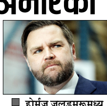
होर्मुज जलडमरूमध्य को खोलने से इन्कार पर शांति वार्ता का स्वरूप बदल जाएगा: जेडी वेंस

वाशिंगटन। अमेरिकी उपराष्ट्रपति जेडी वेंस ने दावा किया है कि शांति वार्ता के दौरान अमेरिका और ईरान ने काफी प्रगति की है। हालांकि, उन्होंने यह भी कहा कि यदि ईरान होर्मुज जलडमरूमध्य को खोलने से इन्कार करता है, तो शांति वार्ता का स्वरूप बदल जाएगा। वेंस ने फॉक्स न्यूज से कहा कि सिर्फ यह नहीं कहें कि चीजें गलत हुईं, मुझे यह भी लगता है कि चीजें सही रही हैं।