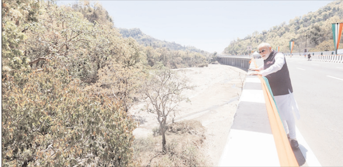
■ प्रधानमंत्री ने देहरादून में आयोजित भव्य समारोह में किया 210 किमी लंबे, दिल्ली-देहरादून इकोनॉमिक कॉरिडोर का किया लोकार्पण ■ केंद्रीय मंत्री नितिन गडकरी, मुख्यमंत्री धामी, राज्यपाल सहित मंत्री, सांसद और विधायक रहे मौजूद

शाह टाइम्स ब्यूरो देहरादून। प्रधानमंत्री नरेंद्र मोदी ने मंगलवार को जसवंत सिंह आर्या ग्राउंड, गढ़ी कैंट में आयोजित समारोह में 210 किमी लंबे, दिल्ली-देहरादून इकोनॉमिक कॉरिडोर का रिमोट बटन दबाकर लोकार्पण किया। इससे पहले प्रधानमंत्री ने गढ़ी कैंट तक 12 किलोमीटर लंबे रोड शो में प्रतिभाग करने के साथ ही डाटाकाली मंदिर में दर्शन करने के बाद पूजा भी की।