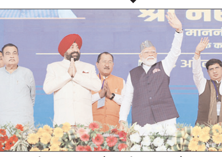
■ राज्य में विकास की सीगात लेकर आता है प्रधानमंत्री का दौरा ■ मुख्यमंत्री ने प्रधानमंत्री को नंदा राजजात यात्रा पर आधारित स्मृति चिन्ह किया भेंट

मुख्यमंत्री ने कहा कि आज का दिन कई मायनों में विशेष है। एक ओर जहां दिल्ली-देहरादून इकोनॉमिक कॉरिडोर के रूप में उत्तराखंड की विकास यात्रा को नई गति मिल रही है, वहीं यह अवसर भीमराव अंबेडकर की जयंती का भी है। उन्होंने बाबा साहेब को श्रद्धांजलि अर्पित करते हुए कहा कि बाबा साहेब ने सामाजिक सौहार्द एवं समरसता को मजबूत करने के लिए वंचित वर्गों को समाज की मुख्य धारा से जोड़ने का काम