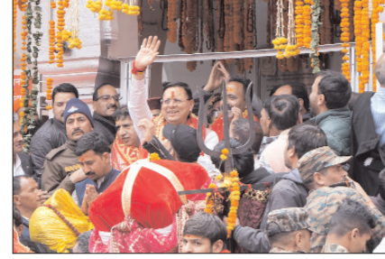
रविवार को मां गंगा की उत्सव डोली भैरव चाटी स्थित भैरव मंदिर से चलकर गंगोत्री धाम पहुंची। गंगोत्री धाम में विशेष पूजा-अर्पण के साथ 12 बजकर 15 मिनट पर गंगोत्री मंदिर

उत्तरकाशी। गंगोत्री और यमुनोत्री धामों के कपाट रविवार को अक्षय तृतीया के पावन पर्व पर वैदिक मंत्रोच्चारण और पूजा-अर्चना के साथ श्रद्धालुओं के दर्शनार्थ खोल दिए गए। इसके साथ ही उत्तराखंड की चारधाम यात्रा 2026 का भी शुभारंभ हो गया है। दोनों धामों में प्रधानमंत्री के नाम से पहली पूजा की गई। मुख्यमंत्री पुष्कर सिंह धामी ने गंगोत्री धाम में कपाटोद्घाटन समारोह में संकल्प लेकर प्रधानमंत्री नरेन्द्र मोदी के नाम से पहली पूजा की और चारधाम यात्रा के सफल आयोजन तथा महिलाओं के खिलाफ की गई हिंसा के कृत्यों के उजागर होने की संभावना उतनी ही अधिक होगी।