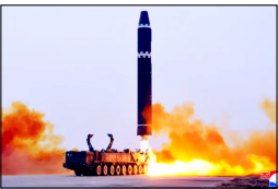
यह इलाका पहले भी मिसाइल परीक्षणों के लिए जाना जाता रहा है

सियोल। एशिया में एक बार फिर तनाव की लहर तेज हो गई है। रविवार को दक्षिण कोरिया ने दावा किया कि उत्तर कोरिया ने अपनी पूर्वी समुद्री सीमा की ओर कई बैलिस्टिक मिसाइलें दागी हैं। यह कदम ऐसे समय पर उठाया गया है, जब क्षेत्र पहले से ही सुरक्षा चुनौतियों और शक्ति संतुलन के दबाव से जूझ रहा है। लगातार हो रहे मिसाइल परीक्षण न केवल पड़ोसी देशों के लिए चिंता का कारण बन रहे हैं, बल्कि वैश्विक स्तर पर भी अस्थिरता की आशंका को बढ़ा रहे हैं। दक्षिण कोरियाई सेना के जाईई चीफ्स ऑफ स्टाफ के अनुसार ये मिसाइलें रविवार सुबह उत्तर कोरिया के पूर्वी तटीय इलाके सिनपो से छोड़ी गईं। यह इलाका पहले भी मिसाइल परीक्षणों के लिए जाना जाता रहा है। दक्षिण कोरिया ने कहा है कि वह इस स्थिति पर लगातार नजर बनाए हुए है और अपनी निगरानी व्यवस्था को