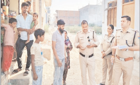
पुलिस अधीक्षक हरिद्वार जनपद हरिद्वार द्वारा ऑपरेशन प्रहार के तहत दिये गये। दिशा निर्देश के क्रम में प्रभारी निरीक्षक कोतवाली भगवानपुर के नेतृत्व में भगवानपुर पुलिस टीमों द्वारा ऑपरेशन प्रहार के अन्तर्गत कार्यवाही को जारी रखते हुये भगवानपुर पुलिस द्वारा दिनांक-19.04.2026 को थाना भगवानपुर पुलिस द्वारा थाना क्षेत्रान्तर्गत बिना सत्यापन क्षेत्र में निवासरत बाहरी प्रदेशों से आये कर्मचारी / मजदूर / फुड टेली गुड चर्खा वालों के सत्यापन हेतु अलग अलग टीमों बनाकर चांद कालोनी कास्बा भगवानपुर क्षेत्रान्तर्गत विशेष अभियान चलाया गया। अभियान के दौरान पुलिस

शाह टाइम्स संवाददाता भगवानपुर। ऑपरेशन प्रहार के तहत हरिद्वार पुलिस की ताबडोड कार्यवाही लगातार जारी है। इसी के तहत भगवानपुर क्षेत्रान्तर्गत चांद कॉलोनी, माइनपुर, शाहपुर में संदिग्ध व्यक्तियों के विरुद्ध सत्यापन अभियान चलाया गया। सत्यापन अभियान के दौरान बिना क्षेत्र में रह रहे बाहरी प्रदेशों से आये 350 किरायेदारों व मजदूरों का सत्यापन किया गया। बिना सत्यापन किरायेदार रखने पर 120 मकान मालिकों के विरुद्ध पुलिस अधिनियम के अंतर्गत कार्रवाई कर वसूला गया 12 लाख रुपए का जुर्माना वसूला गया। जाणकारी के अनुसार वरिष्ठ