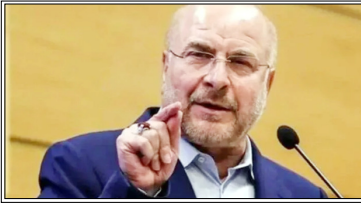
ईरानी विदेश मंत्रालय ने अंतर्राष्ट्रीय कानून के अनुपालन की यूरोपीय संघ की अपील को किया खारिज

हमें दुश्मन पर भरोसा नहीं है, अमी मी, जब हम यहां बैठे हैं, युद्ध छिड़ सकता है: संसद अध्यक्ष