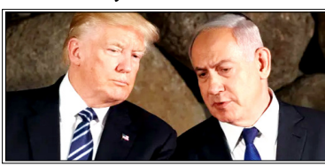
इजरायली प्रधानमंत्री बेंजामिन नेतन्याहू और उनके सलाहकारों में चिंता बढ़ गई और व्हाइट हाउस से स्पष्टीकरण मांगा गया

वाशिंगटन। पश्चिम एशिया में जारी ईरान संकट और इजरायल-लेबनान तनाव के बीच अमेरिका और इजरायल के रिश्तों में भी हलचल देखने को मिली है। अमेरिकी राष्ट्रपति डोनाल्ड ट्रम्प के ताजा बयानों ने कूटनीतिक स्तर पर नई बहस छेड़ दी है। यह बयान ऐसे समय में आया है जब संयुक्त राज्य अमेरिका-इजरायल और ईरान के बीच तनाव बढ़ रहा है।