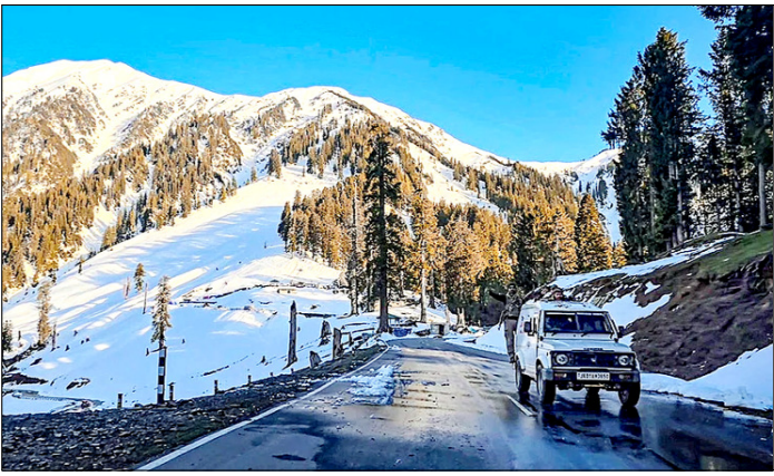
जम्मू-कश्मीर। डोडा जिले के मदेरवाह के पास तीन महीने से अधिक समय तक हिमपात के कारण बंद रहने के बाद फिर से खोले गए मदेरवाह-चंबा अंतरराष्ट्रीय मार्ग के पास से यात्रा करते सुरक्षाकर्मी।