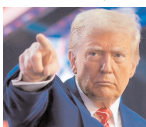
होमरुज स्ट्रेट किसी बेतकूफ के ट्वीट पर नहीं खुलेगा

ट्रंप ने दावा किया कि ईरान ने होमरुज स्ट्रेट में गोलीबारी कर मौजूदा युद्धविराम समझौते की धमकियां उड़ा दी हैं। उन्होंने बताया कि ईरानी हमलों का निशाना फ्रांस और ब्रिटेन के जहाज बने हैं। ट्रंप के मुताबिक, ईरान का यह कदम उसकी हताशा को दर्शाता है। इस तनाव के बीच ट्रंप ने कूटनीतिक रास्ते का आखिरी विकल्प भी खुला रखा है। अमेरिकी प्रतिनिधियों का एक दल सोमवार शाम पाकिस्तान की राजधानी इस्लामाबाद पहुंच रहा है। वहां ईरान के साथ निर्णायक बातचीत होगी। ट्रंप ने कहा कि यह ईरान के पास आखिरी मौका है। ईरान की ओर से होमरुज स्ट्रेट को बंद करने की घोषणा पर तब कसते हुए ट्रंप ने कहा कि अमेरिकी नाकबंदी ने