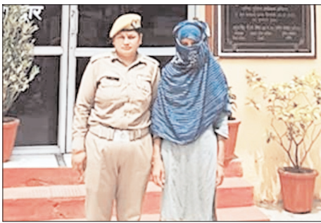
कलियर के नेतृत्व में विशेष टीम गठित की गई। पुलिस ने सीसीटीवी फुटेज खंगाले और मोबाइल नंबरों की लोकेशन ट्रेस की। संदिग्ध महिला को लोकेशन दिल्ली, लखनऊ, मध्यप्रदेश होते हुए अंततः बैंगलोर (कर्नाटक) में ट्रेस हुई, जबकि पीड़िता का मोबाइल स्वच

कर्नाटक पहुंचा दिया था। मामले में वादिया निवासी मुस्लिम नगर, बक्सी का तालाब थाना जानकीपुरम लखनऊ (हाल निवासी मुकदमपुर कलियर, हरिद्वार) ने थाना पिरान कलियर में लिखित तहरीर दी कि 09.04.2026 को उसकी 14 वर्षीय पुत्री को पड़ोस में रहने वाली महिला कपड़े खरीदवाने के बहाने अपने साथ ले गई और वापस नहीं लौटी। इस संबंध में मुकदमा दर्ज किया गया। घटना की गंभीरता को देखते हुए वरिष्ठ पुलिस अधीक्षक हरिद्वार के निर्देश पर पुलिस अधीक्षक देहात व क्षेत्राधिकारी रुड़की के पर्यवेक्षण में प्रभारी निरीक्षक पिरान