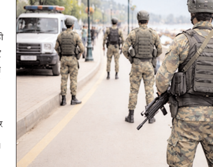
कर दिया था। लगभग 50 ट्रिस्टि स्पॉट बंद कर दिए गए थे। बाद में सिक्योरिटी ऑडिट के बाद कुछ स्पॉट दोबारा खोले गए। पहलगांम में वरिफिकेशन के बाद ही ट्रिस्टि और वेंडरों को एंटी दी जा

पहलगांम आतंकी हमले की पहली बरसी से पहले कश्मीर भर के ट्रिस्टि स्पॉट्स पर सुरक्षा बढ़ा दी गई है। सभी सुरक्षा एजेंसियों को निर्देश दिया गया है कि वे पहलगांम हमले की बरसी पर ट्रिस्टि स्पॉट्स के आसपास, किसी भी संभावित आतंकी हमले को लेकर सतर्क रहें। पहलगांम आने वाले ट्रिस्टि स्पॉट्स की सुरक्षा सुनिश्चित करने के लिए कई कदम उठाए गए हैं। हर सर्विस प्रोवाइडर की जांच-पड़ताल की गई है। उन्हें रजिस्टर्ड किया है। उन्हें यूनीक क्यूआर कोड दिया गया है। इसमें व्यक्ति को निजी जानकारी और दूसरी डिटेल्स हैं। दरअसल, पिछले साल 22 अप्रैल को लश्कर-ए-तैयबा के आतंकीयों ने पहलगांम को बायसलन वैली में 26 लोगों को गोली मारकर हत्या कर दी थी। इनमें 25 ट्रिस्टि और एक पौनी राइडर शामिल था। हमले के कारण जम्मू-कश्मीर में ट्रिस्टि ने आना बंद