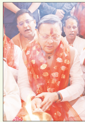
लिफ आस्था के प्रमुख केन्द्र हैं, और इन दिव्य धामों के दर्शन का सांभाल प्राप्त करने की इच्छा

शाह टाइम्स संवाददाता उत्तरकाशी। गंगोत्री और यमुनोत्री धाम के कपाट रविवार को अक्षय तृतीया के पावन पर्व पर वैदिक मंत्रोच्चारण और पूजा-अर्चना के साथ श्रद्धालुओं के दर्शनार्थ खोल दिए गए।