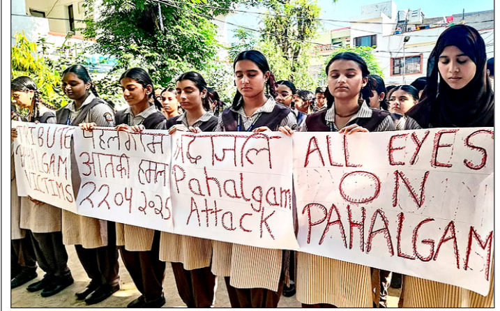
जम्मू। पहलगाम आतंकी हमले की पहली बरसी पर प्रार्थना व श्रद्धांजलि अर्पित करती छात्राएं।

बर्लिन। जर्मनी होर्मुज जलडमरूमध्य में जहाजों को सुरक्षित करने के वास्ते अंतर्राष्ट्रीय मिशन में भाग लेने के लिए तीन जहाज तैनात करने की योजना बना रहा है। 'डेर स्पीगल' मैगजीन ने जर्मन राष्ट्रीय सुरक्षा परिषद के सदस्यों का हवाले से अपनी रिपोर्ट में यह जानकारी दी है। मैगजीन ने मंगलवार को अपनी रिपोर्ट में बताया कि जर्मन चांसलर फ्रेडरिक मर्ज की अध्यक्षता में परिषद की बैठक हुई, जिसमें पश्चिम एशिया की स्थिति सहित कई महत्वपूर्ण राजनीतिक और आर्थिक मुद्दों पर चर्चा की गई। रिपोर्ट में कहा गया है कि परिषद इस मिशन में भाग लेने के लिए दो माइन्स्वीपर (बारूदी सुरंग हटाने वाले जहाज) और एक आपूर्ति जहाज तैनात करने की इजाजत दे सकती है। इसके अलावा, रिपोर्ट में बताया गया है कि जर्मनी ने 'एस्पाइड्स' मिशन के हिस्से के रूप में वर्तमान में जितनी भी तैनात एक छोटे टोही विमान को भी तैनात करने का प्रस्ताव दिया है।