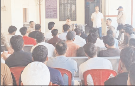
बचने के लिए चेतावत हुए कोतवाली पुलिस द्वारा निम्नलिखित दिशा निर्देश दिये गये- सभी दुकानदार अपनी दुकान में एक रजिस्टर बनाएंगे जिसमें मोबाइल क्रय/विक्रय करने वाले व्यक्ति का आधारकार्ड नंबर, मोबाइल नंबर व पुरा पता अंकित किया जाए। सभी संचालक अपनी-अपनी दुकानों में ब्ळ्ट कैमरा लगाएंगे जिसका व्यू सड़क को भी पुरा कवर करे। कोई भी दुकानदार बिना बिल लिए किसी के मोबाइल का लॉक नहीं तोड़ेगा। पुराना मोबाइल खरीदने से पहले संचार साधी एप में पडमप चेक करेंगे

जानकारी के अनुसार कोतवाली भगवानपुर क्षेत्रांतर्गत मोबाइल शॉप का संचालन कर रहे सभी दुकानदारों की प्रभारी निरीक्षक भगवानपुर की अध्यक्षता में कोतवाली प्रांगण में मीटिंग ली गई। इस दौरान उपस्थित जन को लापरवाही से