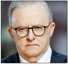
■ प्रधानमंत्री एंथनी अल्बानीज ने अमेरिकी राष्ट्रपति ट्रम्प की भाषा पर कड़ी आपत्ति जताई

कैनबरा। ऑस्ट्रेलिया के प्रधानमंत्री एंथनी अल्बानीज ने अमेरिका, इजरायल और ईरान के बीच हुए दो सप्ताह के युद्धविराम का स्वागत करते हुए इसे पश्चिम एशिया में तनाव कम करने की दिशा में महत्वपूर्ण कदम बताया, लेकिन साथ ही अमेरिकी राष्ट्रपति डोनाल्ड ट्रम्प की भाषा पर कड़ी आपत्ति जताई।