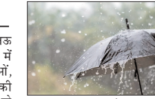
बारिश दर्ज की गई। मौसम विभाग के अनुसार लखनऊ, रायबरेली, उन्नाव, प्रतापगढ़, प्रयागराज, मिर्जापुर, सोनभद्र, चंदौली, वाराणसी, जौनपुर, आजमगढ़, अंबेडकरनगर, संतकबीरनगर, लखीमपुर खीरी, पीलीभीत, बरेली, रामपुर, मुरादाबाद, अमरौली, बिजनौर, बदायूं, हरदोई और शाहजहांपुर में येलो अलर्ट जारी किया गया है। यहाँ 40 किमी प्रति घंटे तक की रफ्तार से हवाएं चलने और हल्की गरज-चमक की संभावना है। बहराइच, बारा, बकी, सोतापुर, बस्ती, गाँडा, सुल्तानपुर और अमेठी में ऑरेंज अलर्ट जारी किया गया है। इन क्षेत्रों में 41 से 61 किमी प्रति घंटे की रफ्तार से तेज हवाओं के साथ मध्यम स्तर के तूफान की आशंका जताई गई है।

प्रदेश में मंगलवार को दिनभर की तपिश के बाद शाम को अचानक मौसम सुहावना हो गया, जिससे लोगों को गर्मी से राहत मिली। शाम होते-होते लखनऊ में बादल छा गए और तेज हवाओं के साथ हल्की बारिश शुरू हो गई। इसी तरह के हालात प्रदेश के अन्य जिलों में भी देखने को मिले। मौसम विभाग के पश्चिमी से पूर्वी उप्र तक कई जिलों में हल्की बारिश दर्ज की गई। सहारनपुर से लेकर सोनभद्र और आगरा तक मौसम का असर देखा गया। प्रदेश के कई जिलों में पांच मिमी तक