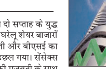
अधिक की तेजी रही। और मीडिया समूहों के सूचकांक भी ड्राई से तीन प्रतिशत तक चढ़े। मझौली और छोटी कंपनियों में भी लिवाली हावी रही। निफ्टी मिडकैप-50 सूचकांक 4.09 फीसदी और स्मॉलकैप-100 सूचकांक 4.39 फीसदी की बढ़त में रहा। सैंसेक्स की कंपनियों में इंडिगो का शेयर आठ फीसदी से ज्यादा उछल गया। एलएंडटी में साढ़े सात प्रतिशत और बजाज फाइनेंस में सात प्रतिशत से अधिक की तेजी रही। महिंद्रा एंड महिंद्रा, एक्सिस बैंक, मार्सति सुजुकी, अल्ट्राटेक सीमेंट और टाटास्टील के शेयर छह से सात प्रतिशत चढ़े। बजाज फिनसर्व, एचडीएफसी बैंक, अडानी पोर्ट्स, आईसीआईसीआई बैंक और इटनल के शेयर पांच से छह फीसदी ऊपर बढ़े हुए। कोटक महिंद्रा बैंक, एशियन पेंट्स, रिलायंस इंडस्ट्रीज और टाटा स्टील में तीन से चार फीसदी की तेजी देखी गई। भारतीय स्टेट बैंक और एंटी के शेयर दो से तीन प्रतिशत तक चढ़े। हिंदुस्तान यूनीलिवर, भारतीय एयरटेल, एनटीपीसी, आईटीसी और बीईएल के शेयर एक से दो प्रतिशत के बीच मजबूत हुए।

अमेरिका और ईरान के बीच दो सप्ताह के युद्ध विराम पर सहमति बनी है। इससे दुनिया भर में निवेश धारणा मजबूत हुई और शेयर बाजारों में तेजी रही। चोतरफा लिवाली के बीच ऑटो सेक्टर का सूचकांक साढ़े छह प्रतिशत से अधिक चढ़ा। रिजर्व बैंक द्वारा बैंकों के लिए राहत के उपचारों की घोषणा से बैंकिंग सेक्टर का सूचकांक साढ़े पांच प्रतिशत से ज्यादा मजबूत हुआ। रिपोर्टों में पौने सात फीसदी की ओर टिकाऊ उपभोक्ता उत्पाद समूह में पांच प्रतिशत से