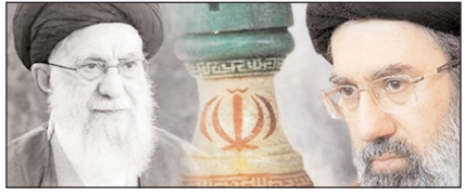
सीजफायर नहीं, कूटनीति की जीत का ऐलान सम्पादकीय