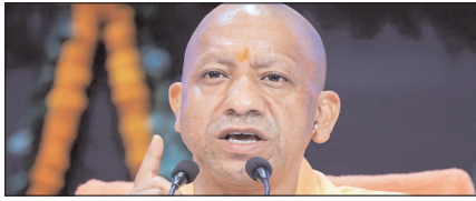
किसानों को त्वरित राहत के निर्देश, क्षतिपूर्ति में नहीं होगी देरी: योगी

नई दिल्ली, मुजफ्फरनगर, देहरादून, हल्द्वानी, मुगदाबाद, बरेली, मेरठ व लखनऊ से प्रकाशित