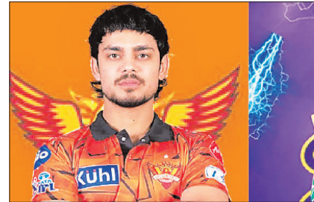
सबकी नजरों का केंद्र होगी केकेआर, जब वे गुरुवार को इंडन गार्डन्स में लखनऊ सुपर जायंट्स की मेजबानी करेंगे, मुकाबला खिलाड़ियों के व्यक्तिगत प्रदर्शन व बढ़ते दबाव के बीच

यह मुकाबला दोनों टीमों की अलग-अलग फॉर्म, खिलाड़ियों के व्यक्तिगत प्रदर्शन और बढ़ते दबाव के बीच खेला जाएगा। कोलकाता और लखनऊ के बीच होने वाला यह मैच अब एक ऐसी कहानी बन गया है, जिसमें एक संघर्षरत टीम अपने अभियान को फिर से पटरी पर लाने की कोशिश कर रही है, जबकि दूसरी टीम आईपीएल में ज्यादा संतुलित और लय में नजर आ रही है। केकेआर के लिए, इस कहानी की मुख्य बातें हैं—जल्दबाजी और टीम के सभी 11 खिलाड़ियों के प्रदर्शन में लगातार उतार-चढ़ाव। बल्लेबाजी