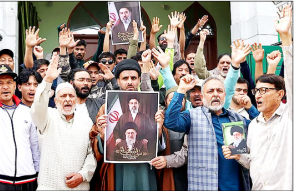
जम्मू। ईरान, अमेरिका व इजरायल के बीच हुए दो सप्ताह के युद्धविराम समझौते के मद्देनजर ईरान के सर्वोच्च नेता अयातुल्ला अली खामेनेई का चित्र लहराकर नारे लगाते लोग।

युद्धविराम पर आगे की बातचीत करेंगे। वहीं पाकिस्तान के प्रधानमंत्री शहबाज शरीफ ने बुधवार को घोषणा किया कि इस्लामिक रिपब्लिक ऑफ ईरान और अमेरिका अपने सहयोगियों के साथ लेबनान सहित सभी मोर्चों पर तत्काल एवं व्यापक युद्धविराम के लिए सहमत हो गए हैं। शरीफ ने कहा कि अत्यंत विनमता के साथ, मुझे यह घोषणा करते हुए खुशी महसूस हो रही है कि ईरान और अमेरिका हर जगह तत्काल प्रभाव से युद्धविराम पर सहमत हो गए हैं। उन्होंने इस कदम को संघर्षरत पश्चिम एशिया क्षेत्र में शांति एवं स्थिरता बहाल करने के उद्देश्य से उठाया गया एक दूरदर्शी कदम बताया। इस घटनाक्रम का स्वागत करते हुए पाकिस्तानी प्रधानमंत्री ने दोनों देशों के नेतृत्व के प्रति आभार व्यक्त किया और औपचारिक रूप से उनके प्रतिनिधिमंडलों को 10 अप्रैल को इस्लामाबाद में उच्च स्तरीय वार्ता के लिए आमंत्रित किया। प्रस्तावित वार्ता को 'इस्लामाबाद वार्ता' नाम दिया गया है जिसमें लंबे समय से चले आ रहे विवादों को सुलझाने के लिए एक व्यापक एवं स्थाई समझौते पर पहुंचने पर ध्यान केंद्रित किए जाने की उम्मीद है। शरीफ ने इस बात पर बल दिया कि दोनों पक्षों ने असाधारण बुद्धिमत्ता और सूझबूझ का प्रदर्शन किया है और शांति को आगे बढ़ाने में रचनात्मक रूप से लगे हुए हैं। उन्होंने आगे कहा, हम पूरी उम्मीद करते हैं कि इस्लामाबाद वार्ता स्थाई शांति प्राप्त करने में सफल होगी और उन्होंने अपने वाले दिनों में और भी सकारात्मक घटनाक्रमों होने के प्रति आशा व्यक्त की।