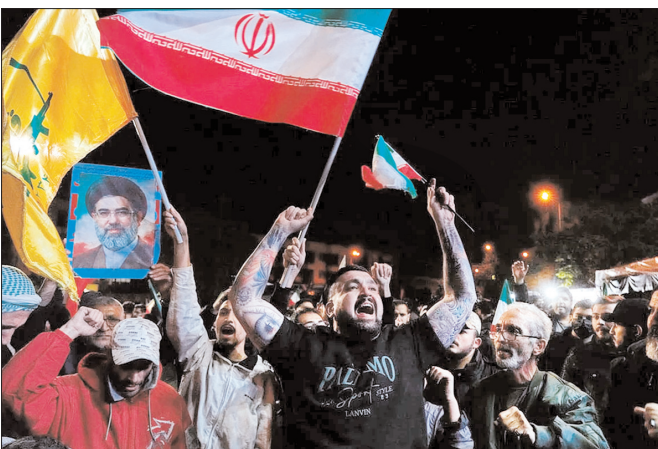
ईरान-अमेरिका युद्धविराम की 10 शर्तें

अमेरिका के राष्ट्रपति डोनाल्ड ट्रम्प ने वाशिंगटन के समयानुसार शाम 6:32 बजे (भारतीय समयानुसार बुधवार तड़के 4:02 बजे) अपने सोशल मीडिया प्लेटफॉर्म ट्विटर पर पोस्ट किया कि वह ईरान पर नियोजित सैन्य हमलों को दो सप्ताह की अवधि के लिए स्थगित कर देंगे। दूसरी ओर, ईरान के विदेश मंत्री सैयद अब्बास अराघची ने भी कुछ घंटे बाद युद्धविराम की पुष्टि करते हुए कहा कि ईरान होर्मुज स्ट्रेट से जहाजों का सुरक्षित आवागमन सुनिश्चित करेगा। युद्धविराम की मध्यस्थता की पहल करने वाले पाकिस्तान के प्रधानमंत्री शहबाज शरीफ ने भी दो सप्ताह के युद्धविराम की पुष्टि करते हुए कहा कि अमेरिका और ईरान 10 अप्रैल से इसे अंतिम रूप देने के लिए शान्ति वार्ता करेंगे। ट्रम्प ने कहा कि प्रस्तावित सैन्य हमलों को दो सप्ताह के लिए स्थगित किया जा रहा है, ताकि वार्ता आगे बढ़ सके। उन्होंने यह भी कहा कि यह दोनों पक्षों का युद्धविराम होगा और अमेरिका अपने सैन्य उद्देश्यों को