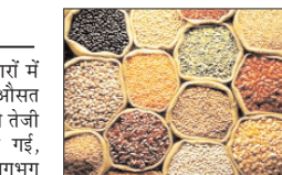
प्रति क्विंटल महंगी हुई। मसूर दाल के दाम कमोबेश स्थिर रहे। अमेरिका और ईरान के बीच दो सप्ताह के युद्ध विराम पर सहमति बनने के बाद विदेशों में खाद्य तेलों में तीन प्रतिशत से अधिक की बड़ी गिरावट देखी गई। मलेेशिया के बुरसा मलेेशिया डेरिवेटिव एक्सचेंज में जून का मूंग ऑयल वायदा 179 रिंगिट गिरकर 4,586 रिंगिट प्रति टन पर रहा। जुलाई का अमेरिकी सोया तेल वायदा 3.65 प्रतिशत फिसलकर 66.87 सेंट प्रति पौंड

घरेलू थोक जिस बाजारों में बुधवार को चावल का औसत भाव चढ़ गया। दालों में भी तेजी रही। गेहूं में नरमी देखी गई, जबकि चीनी की कीमत लगभग अपरिवर्तित रही। खाद्य तेलों में उतार-चढ़ाव का रुख रहा। औसत दर्जे के चावल का औसत भाव 22 रुपये बढ़कर 3,867 रुपये प्रति क्विंटल पर पहुंच गया। गेहूं की रुपये सरता हुआ और 2,771 रुपये प्रति क्विंटल बोला गया। आटे की कीमत तीन रुपये प्रति क्विंटल चढ़ गयी। दाल-दलहन में तेजी रही। मूंग दाल की औसत कीमत 18 रुपये और तुअर दाल की 16 रुपये प्रति क्विंटल बढ़ गई। उड़द दाल 15 रुपये और चना दाल 11 रुपये