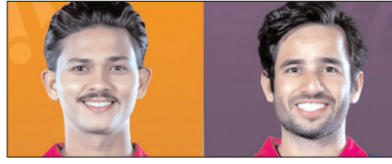
ऑरेंज कैप और पर्पल कैप पर आरआर के खिलाड़ियों का कब्जा खेल टाइम्स