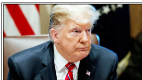
■ स्क्रीन पर इजरायल की खुफिया एजेंसी मोसाद के प्रमुख डेविड बार्निया और इजरायली सैन्य अधिकारी जुड़े हुए थे

वाशिंगटन। इजरायल के प्रधानमंत्री बेंजामिन नेतन्याहू सुबह ही व्हाइट हाउस पहुंच चुके थे। वह कड़े महीनों से अमेरिका पर दबाव डाल रहे थे कि ईरान पर बड़ा हमला किया जाए। हालांकि इस बार की मुलाकात बेहद सीक्रेट थी। उन्हें बिना किसी औपचारिक स्वागत के सीधे अंदर ले जाया गया ताकि मीडिया को कुछ पता न चले। पहले कैबिनेट रूम में बातचीत हुई और फिर उन्हें व्हाइट हाउस के सिचुएशन रूम में ले जाया गया, जहाँ असली बैठक हुई। यह वही जगह है जहाँ अमेरिका युद्ध और राष्ट्रीय सुरक्षा से जुड़े बड़े फैसले करता है, लेकिन आमतौर पर यहाँ विदेशी नेताओं को नहीं लाया जाता। आमतौर पर