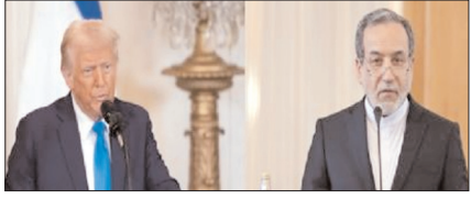
अमेरिका का ईरानी शांति योजना स्वीकार करना युद्ध में जीत: ईरानी सुरक्षा परिषद