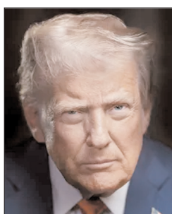
चल रहा है। उन्होंने आशा व्यक्त किया कि सब कुछ ठीक चलेगा। ट्रम्प ने कहा कि यह अमेरिका की तरह पश्चिम एशिया का स्वर्ण युग हो सकता है।

वाशिंगटन। अमेरिकी राष्ट्रपति डोनाल्ड ट्रम्प ने ईरान के साथ दो सप्ताह के युद्धविराम को विश्व शांति के लिए एक बड़ा दिन बताया और कहा कि अमेरिका होर्मुज स्ट्रेट में यातायात व्यवस्था को सुचारू बनाने में मदद करेगा। उन्होंने कहा कि ईरान ऐसा चाहता है, क्योंकि वे तंग आ चुके हैं। इसी तरह बाकी सभी भी तंग आ चुके हैं। उन्होंने कहा कि अमेरिका होर्मुज स्ट्रेट में यातायात बढ़ाने में मदद करेगा और कई सकारात्मक कदम उठाए जाएंगे। उन्होंने कहा कि खूब पैसा बनाया जाएगा और ईरान पुनर्निर्माण प्रक्रिया शुरू कर सकता है। ट्रम्प ने कहा कि हम हर तरह की आपूर्ति लेकर आएं और यहाँ आसपास मंडराते रहेंगे, ताकि यह सुनिश्चित हो सके कि सब कुछ ठीक चल रहा है। उन्होंने आशा व्यक्त किया कि सब कुछ ठीक चलेगा। ट्रम्प ने कहा कि यह अमेरिका की तरह पश्चिम एशिया का स्वर्ण युग हो सकता है।