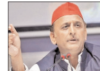
चाहते हैं। सपा प्रमुख ने कहा कि आम जनता शांति और भाईचारा चाहती है, लेकिन कुछ स्वार्थी लोग समाज में भय और अविश्वास का वातावरण बनाकर अपने राजनीतिक हित साधने में लगे हैं। उन्होंने आरोप लगाया कि ऐसे लोग भोले-भाले लोगों को बहकाकर हिंसा और तनाव की स्थिति पैदा करते हैं। यादव ने दावा किया कि अब जनता इन तथ्यों को समझ रही है और ऐसे लोगों को अपने बीच जगह नहीं दे रही है। उन्होंने विश्वास जताया कि आने वाले समय में जनता इन नीतियों को पूरी तरह खारिज कर देगी और देश में सकारात्मक बदलाव होगा।

उन्होंने सोशल मीडिया पर पोस्ट में कहा कि कुछ संगठन अपनी पहचान छुपाकर समाज में सक्रिय हैं और लोगों के बीच दरार पैदा करने का काम कर रहे हैं। उन्होंने ऐसे तत्वों को 'अंतर्राजिस्टर्ड गिरोह' करार देते हुए आरोप लगाया कि ये समाज में अस्थिरता फैलाकर जनता का ध्यान असली मुद्दों से भटकाना