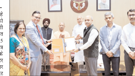
सीएम योगी ने बीईएल को सौंपा 75 हेक्टेयर जमीन का आवंटन पत्र

बीईएल यहां करीब 562.5 करोड़ रुपये का निवेश कर अत्याधुनिक रक्षा निर्माण यूनिट लगाएगा। इस यूनिट में राडार और एयर डिफेंस सिस्टम तैयार किए जाएंगे। इससे 300 से ज्यादा लोगों को सीधे रोजगार मिलेगा, जबकि आसपास के क्षेत्रों में अप्रत्यक्ष रूप से और भी रोजगार के अवसर बनेंगे। सीएम योगी आदित्यनाथ ने कहा कि इस परियोजना से बुंदेलखंड क्षेत्र में औद्योगिक विकास