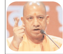
रबी फसलों को हुए नुकसान पर गहरी संवेदना व्यक्त की, अफसरों को त्वरित, पारदर्शी और संवेदनशील कार्रवाई के निर्देश

योगी ने बुधवार सुबह आयोजित उच्चस्तरीय समीक्षा बैठक में कहा कि इस संकट की घड़ी में राज्य सरकार अज्जदाताओं के साथ मजबूती से खड़ी है। उन्होंने अधिकारियों को निर्देश दिए कि प्रत्येक प्रभावित किसान एवं बाईएदार के नुकसान का सटीक, निष्पक्ष और समयबद्ध आकलन कर तत्काल क्षतिपूर्ति सुनिश्चित