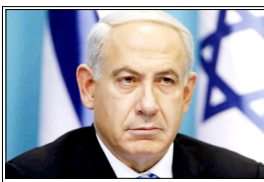
■ नेतन्याहू का यह बयान पाक के प्रधानमंत्री शहबाज शरीफ की उस घोषणा के बाद आया

नेल अवीव। इजरायल के प्रधानमंत्री बेंजामिन नेतन्याहू ने ईरान पर हमले रोकने के अमेरिका के फंसले का समर्थन किया है, लेकिन कहा कि दो सप्ताह का यह युद्धविराम लेबनान में इजरायल के जारी सैन्य अभियानों पर लागू नहीं होगा। उन्होंने कहा कि इस युद्धविराम में लेबनान शामिल नहीं है, जबकि पाकिस्तानी प्रधानमंत्री शहबाज शरीफ ने युद्धविराम की घोषणा करते हुए कहा था कि इस संघर्ष विराम में लेबनान सहित ईरान के तमाम सहयोगियों पर भी तत्काल प्रभाव से हमले रोकना है।