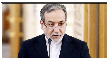
■ समझौता कराने के लिए पाक पीएम शरीफ और सेना प्रमुख आसिम मुनीर के प्रति जताया

तेहरान। ईरान के विदेश मंत्री सैयद अब्बास अराघची ने कहा है कि उनका देश अमेरिका के साथ दो सप्ताह के युद्धविराम के लिए सहमत हो गया है और इस दौरान होर्मुज जलडमरूमध्य से जहाजों को सुरक्षित आवाजाही की अनुमति दी जाएगी। अराघची ने युद्धविराम समझौता करवाने के लिए पाकिस्तान के प्रधानमंत्री शहबाज शरीफ और सेना प्रमुख आसिम मुनीर के प्रति आभार व्यक्त किया। अराघची ने बुधवार तड़के ईरान की सुरक्षा परिषद की ओर से जारी बयान में कहा कि इस्लामिक गणराज्य ईरान की ओर से क्षेत्र में युद्ध समाप्त करने के लिए अथक प्रयास के लिए अपने भाई पाकिस्तान के प्रधानमंत्री शहबाज शरीफ और फील्ड मार्शल मुनीर के प्रति आभार और सराहना व्यक्त करता हूँ।