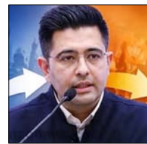
सात सांसदों ने राज्यसभा के सभापति को सौंपे दस्तावेज