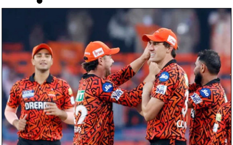
अपनी लय वापस पा ली है। उनकी वापसी का श्रेय उनकी आक्रामक बल्लेबाजी शैली को जाता है, जिसने हाल के मैचों में विरोधी टीमों की गेंदबाजी को पूरी तरह से पस्त कर दिया है। अर्धोक्त शर्मा सबसे बेहतरीन प्रदर्शन करने वाले खिलाड़ी रहे हैं, उन्होंने 200 से ज्यादा के स्ट्राइक रेट से 323 रन बनाए हैं, जिसमें पिछले मैच में बनाया गया एक तूफानी शतक भी शामिल है। उन्हें हेनरिक क्लासेन का भी भरपूर साथ मिला है, जिनकी निरंतरता और जोरदार हिटिंग ने उन्हें इस सीजन के सबसे खतरनाक मध्यक्रम के बल्लेबाजों में से एक बना दिया है। कप्तान ईशान किशन ने आगे बढ़कर टीम की अगुवाई की है और तेज गति से रन बनाते हुए टीम के लिए महत्वपूर्ण योगदान दिया है। ट्रेविस हेड, भले ही अभी तक अपनी