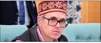
कश्मीर को राज्य का दर्जा न देना 'सजा' के समान : उमर अब्दुल्ला

नई दिल्ली, मुजफ्फरनगर, देहरादून, हल्द्वानी, मुतादाबाद, बरेली, मेरठ व लखनऊ से प्रकाशित