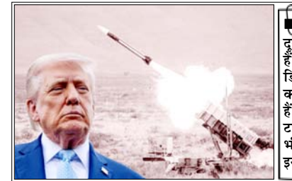
ये 600 मील से ज्यादा दूर तक मार कर सकती हैं और दुश्मन की एयर डिफेंस से बचकर हमला करने के लिए बनाई गई हैं, इसके अलावा टामहाक मिसाइलों का भी बड़े पैमाने पर इस्तेमाल हुआ

वाशिंगटन। ईरान के साथ 38 दिन चले युद्ध में अमेरिका ने अपनी कई अहम और महंगी मिसाइलें खर्च कर दीं। इनमें वो मिसाइलें भी शामिल हैं, जो चीन जैसे बड़े युद्ध के लिए सभालकर रखी गई थीं। अब अमेरिका का हथियार भंडार तेजी से कम हो रहा है। इस युद्ध में अमेरिका ने करीब 1100 लंबी दूरी की स्टीलथ मिसाइलें (जेएएसएसएम-ईआर) इस्तेमाल कीं। ये खास तौर पर चीन के खिलाफ इस्तेमाल के लिए बनाई गई थीं। इसके अलावा 1000 से ज्यादा टामहाक मिसाइलें, 1200 से ज्यादा पैट्रियट मिसाइलें और 1000 से ज्यादा दूसरी स्टाइक मिसाइलें भी दागी गईं। इस पूरे युद्ध पर 28 से 35 अरब डालर खर्च हुए।