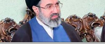
दुश्मन के मीडिया अभियान, ईरानी लोगों को भड़काने और राष्ट्रीय एकता को कमजोर करने की कोशिश कर रहे हैं: मोजतबा खामेनेई

सर्वोच्च नेता ने देशवासियों से चौकन्ना रहने की अपील की, ईरानी जनता की मजबूत एकता की तारीफ