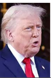
हेरिस की डेमोक्रेटिक पार्टी के पास 47 हैं। ट्रम्प की रिपब्लिकन पार्टी के ही लगभग 10 सांसद ईरान युद्ध के विरोध में आवाज उठा चुके हैं।

अब एक मई से पहले उन्हें संसद से युद्ध की मंजूरी लेनी है। रिपोर्ट्स के मुताबिक ट्रम्प संसद का सामना नहीं करना चाहते हैं। 100 सदस्यों वाली सीनेट में ट्रम्प के 53 सांसद हैं। जबकि विपक्षी कमला