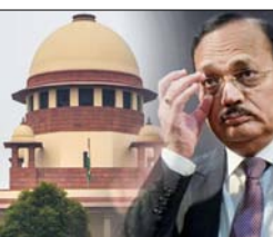
SIR लिस्ट से बाहर चुनाव अधिकारियों की याचिका पर कहा: इस बार वोट नहीं डाल पाएंगे