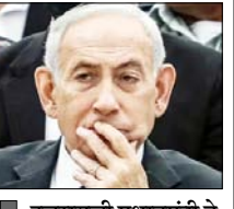
इजरायली प्रधानमंत्री ने कब और कैसे कराया अपना इलाज, खुद ही किया इसका खुलासा

नेल अवीवा। इजरायल के प्रधानमंत्री बेंजामिन नेतन्याहू के स्वास्थ्य को लेकर एक बहुत बड़ी खबर सामने आई है। लंबे समय से चल रही अटकलों पर विराम लगाते हुए इजरायली प्रधानमंत्री ने खुद इस बात का आधिकारिक खुलासा किया है कि वह कैसर जैसी गंभीर बीमारी से पीड़ित रहे हैं। नेतन्याहू ने बताया है कि उन्हें शुरुआती चरण का प्रोस्टेट कैंसर था, जिसका उन्होंने समय रहते इलाज करवा लिया है। अपनी सालाना मेडिकल रिपोर्ट सार्वजनिक होने के बाद नेतन्याहू ने शुक्रवार को सोशल मीडिया प्लेटफॉर्म एक्स पर यह अहम जानकारी दी। उन्होंने देश और