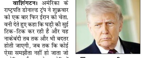
कहा: समय निकलता जा रहा है और नाकेबंदी 'और भी बदतर' होगी

वाशिंगटन। अमेरिका के राष्ट्रपति डॉनाल्ड ट्रंप ने शुक्रवार को एक बार फिर ईरान को चेतावनी देते हुए कहा कि घड़ी की सुई टिक-टिक कर रही है और यह नाकेबंदी अब तक और भी बदतर होती जाएगी, जब तक कि कोई ऐसा समझौता नहीं हो जाता जो अमेरिका और उसके सहयोगियों के लिए फायदेमंद हो। ट्रंप ने अपने सोशल मीडिया प्लेटफॉर्म पर कहा कि समय उनके पक्ष में नहीं है। यह नाकेबंदी पूरी तरह से अंधेरा और मजबूत है और अब यहाँ से स्थिति और भी खराब होती जाएगी। कोई भी समझौता तभी किया जाएगा, जब वह अमेरिका, उसके सहयोगियों और बाकी दुनिया के लिए उचित और हितकारी होगा। अमेरिकी मीडिया पर एक बार फिर निशाना साधते हुए राष्ट्रपति ट्रंप ने कहा कि न्यूयॉर्क टाइम्स और सीएनएन जैसे मीडिया संस्थानों को लगता है, मैं ईरान के साथ युद्ध खत्म करने के लिए अब हमारे बीच नहीं रहे।