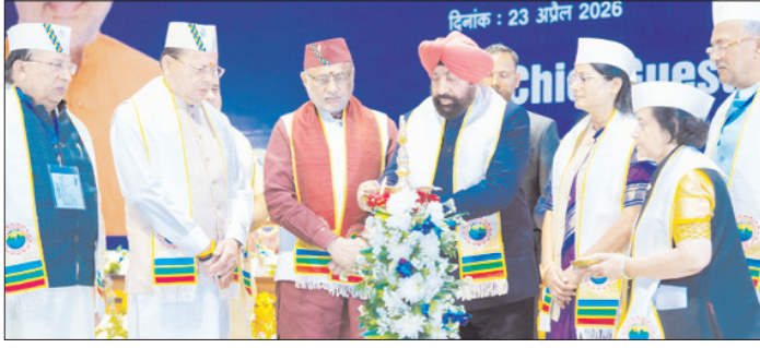
■ एम्स ऋषिकेश दीक्षांत समारोह: उपराष्ट्रपति ने स्नातकों से सहानुभूति, सत्यनिष्ठा और राष्ट्र निर्माण के प्रति प्रतिबद्धता के साथ सेवा करने का किया आह्वान ■ उपराष्ट्रपति ने की बुनियादी ढांचे और सेवाओं को मजबूत करने में मुख्यमंत्री धामी के नेतृत्व की प्रशंसा

शाह टाइम्स ब्यूरो देहरादून / ऋषिकेश। भारत के उपराष्ट्रपति सी. पी. राधाकृष्णन ने गुरुवार को ऋषिकेश स्थित अखिल भारतीय आयुर्विज्ञान संस्थान (एम्स) के छठे दीक्षांत समारोह को संबोधित किया। ऋषिकेश को चिंतन और उपचार का वैश्विक केंद्र होने के साथ-साथ हिमालय का प्रवेश द्वार के रूप में आध्यात्मिक और सांस्कृतिक महत्व देते हुए उपराष्ट्रपति ने कहा कि ऐसा वातावरण दीक्षांत समारोह को गंभीरता को और भी गहरा कर देता है।