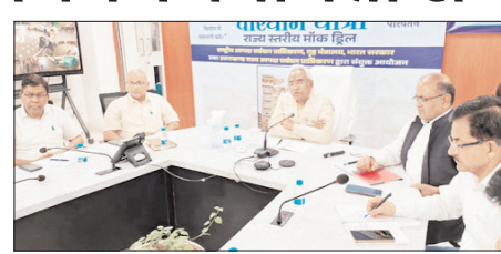
■ कैबिनेट मंत्री मदन कौशिक ने दिए निर्देश ■ प्रथम चरण में ग्राम प्रधानों को दिया जाएगा प्रशिक्षण ■ आधुनिक संसाधनों से युक्त डीडीओसी भी बनाए जाएंगे

मुख्य संवाददाता शाह टाइम्स देहरादून। उत्तराखण्ड को आपदा सुरक्षित बनाने की दिशा में आपदा प्रबंधन एवं पुनर्वासि मंत्री श्री मदन कौशिक ने महत्वपूर्ण पहल की है। अब आपदा प्रबंधन विभाग और पंचायती राज विभाग मिलकर कार्य करेंगे, ताकि ग्राम स्तर पर आपदा से निपटने की क्षमता को मजबूत किया जा सके और स्थानीय स्तर पर त्वरित प्रतिक्रिया सुनिश्चित हो सके। इस पहल के तहत प्रथम चरण में राज्य के ग्राम प्रधानों को आपदा प्रबंधन का व्यावहारिक एवं आवश्यक तकनीकी प्रशिक्षण दिया जाएगा।