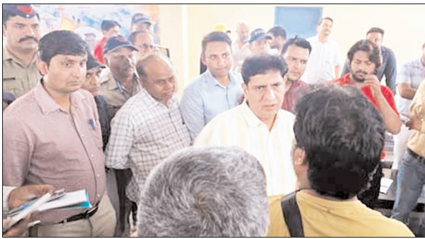
दौरान आने वाले श्रद्धालुओं को किसी प्रकार की असुविधा न हो। उन्होंने विशेष रूप से यातायात व्यवस्था, चिकित्सा सुविधाओं, स्वच्छता और सुरक्षा व्यवस्था को मजबूत बनाए रखने

शाह टाइम्स संवाददाता नारसन। चारधाम यात्रा को लेकर परिवहन मंत्री प्रदीप बत्रा ने नारसन बार्डर पर निरीक्षण कर यात्रियों को यात्रा सुरक्षा किट बांटी है। इस दौरान उन्होंने यात्रा मार्ग पर सुरक्षा, यातायात प्रबंधन एवं श्रद्धालुओं की सुविधाओं का जायजा लिया। चारधाम यात्रा की तैयारियों को लेकर उत्तराखंड सरकार पूरी तरह सक्रिय नजर आ रही है। इसी क्रम में माननीय परिवहन मंत्री प्रदीप बत्रा ने नारसन बार्डर पर पहुंचकर व्यवस्थाओं का निरीक्षण किया। इस दौरान उन्होंने यात्रा मार्ग पर सुरक्षा, यातायात प्रबंधन एवं श्रद्धालुओं की सुविधाओं का जायजा लिया। निरीक्षण के दौरान मंत्री ने संबंधित अधिकारियों को निर्देश दिए कि चारधाम यात्रा के