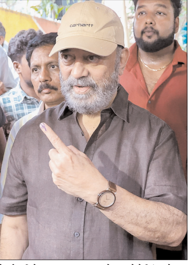
चेन्नई। अभिनेता कमल हासन मतदान के बाद फोटो खिंचवाते हुए।

कोलकाता/चेन्नई, वार्ता पश्चिम बंगाल और तमिलनाडु विधानसभा चुनाव में गुरुवार को बंपर वोटिंग हुई। बंगाल की 294 सीटों में से 152 सीटों पर पहले फेज में 92.54 प्रतिशत मतदान हुआ। वहीं, तमिलनाडु की सभी 234 सीटों पर रिकॉर्ड 85.13 फीसदी वोटिंग हुई। दोनों राज्यों के इतिहास में पहली बार सबसे ज्यादा वोटिंग हुई है। ममता ने वोटिंग के बाद कहा कि बंगाल की जनता ने एसआईआर के विरोध में बंपर वोटिंग की है। इससे पहले असम, केरल और पुडुचेरी में भी 9 अप्रैल को रिकॉर्ड वोटिंग हुई थी। असम के इतिहास में सबसे ज्यादा 85.91 फीसदी, पुडुचेरी में 90 प्रतिशत और केरल में 1987 के बाद सबसे ज्यादा 78.27 प्रतिशत वोटिंग हुई थी। पश्चिम बंगाल के दक्षिण मिनदापुर में कुमारगंज सीट से भाजपा कांडिडेट सुवेंदु सरकार को भीड़ ने दौड़ा-दौड़ाकर पीटा। उनका सिक्वोरिटी गार्ड उनके साथ था। इसके बावजूद भीड़ ने उन्हें खदेड़ दिया। पश्चिम बर्धमान जिले के बर्नपुर में आसनसोल साउथ सीट से भाजपा उम्मीदवार अग्निमित्रा पाल को कार पर हमला हुआ। इससे गाड़ी के पीछे का शीशा टूट गया। अग्निमित्रा ने बताया कि उनकी कार पर पथर