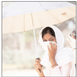
सकती है, लेकिन छोटे बच्चों, बुजुर्गों और गंभीर बीमारियों से ग्रसित लोगों में स्वास्थ्य संबंधी समस्याएं बढ़ने की आशंका रहती है।

उत्तर प्रदेश के अधिकांश जिलों में भीषण गर्मी और उष्ण लहर (हीट वेव) का प्रकोप जारी है। मौसम विभाग ने 24 अप्रैल से 26 अप्रैल तक के लिए रेड अलर्ट जारी किया है। 24 अप्रैल से 26 अप्रैल तक बांदा, चित्रकूट, कोशाम्बी, प्रयागराज, फतेहपुर, प्रतापगढ़, सोनभद्र, मिर्जापुर, चंदौली, वाराणसी, संत रविदास नगर, जौनपुर, गाजीपुर, आजमगढ़, मऊ, बलिया, बहराइच, लखीमपुर खीरी, सीतापुर, हरदोई, फर्रुखाबाद, कन्नौज, कानपुर देहात, कानपुर नगर, उन्नाव, लखनऊ, बाराबंकी, रायबरेली, अमेठी, सुल्तानपुर, अयोध्या और अंबेडकर नगर में लू का असर देखने को मिल सकता है।