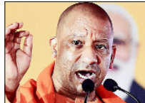
सरकार ने इलाज को 1400 करोड़ रुपये दिए

शाह टाइम्स ब्यूरो लखनऊ। उत्तर प्रदेश के मुख्यमंत्री योगी आदित्यनाथ ने अटल बिहारी वाजपेयी चिकित्सा विश्वविद्यालय में कांईयोलॉजी सोसायटी ऑफ इंडिया द्वारा आयोजित 'नेशनल इंटरवेंशनल का उद्घाटन किया। इस अवसर पर उन्होंने कहा कि प्रदेश सरकार ने अब तक गरीब मरीजों के इलाज के लिए 1400 करोड़ रुपये की आर्थिक सहायता प्रदान की है। मुख्यमंत्री ने कहा कि उत्तर प्रदेश अब देश की अर्थव्यवस्था का ग्रोथ इंजन बन चुका है। उन्होंने कहा कि करीब 9 वर्ष पहले तक यूपी को बीमार राज्य माना जाता था, लेकिन आज प्रदेश विकास की नई ऊंचाई को छू रहा है। उन्होंने बदलती जीवनशैली पर चिंता जताते हुए कहा कि आधुनिक दिनचर्या ने बीमारियों को बढ़ावा दिया है। हमारे सामने दो बड़ी चुनौतियां हैं—एक बचाव और दूसरी उपचार। बीमारियों के तेजी से बढ़ते प्रभाव