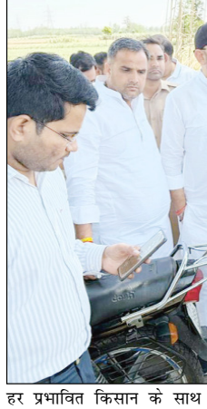
हर प्रभावित किसान के साथ मजबूती से खड़े हैं।