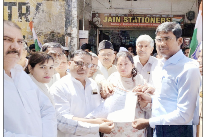
मुजफ्फरनगर: नगर मजिस्ट्रेट को ज्ञापन सौंपते प्रदर्शनकारी कांग्रेस कार्यकर्ता।