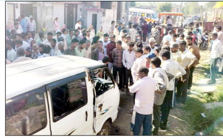
अफरा-तफरी का माहौल बन गया।

शाह टाइम्स संवाददाता पुरकाजी। विकासखंड पुरकाजी क्षेत्र के ग्राम हरीनगर-झबरपुर में शुक्रवार सुबह उस समय हड़कंप मच गया, जब बच्चों को स्कूल लेकर जा रही एक स्कूली वैन अचानक आग की चपेट में आ गई। देखते ही देखते वैन धुंध-धुंध कर जलने लगी और कुछ ही पलों में आग के गोले में तब्दील हो गई।