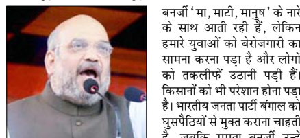
बेरोजगार युवकों को भी तीन हजार की मदद: गृहमंत्री

नई दिल्ली/कोलकाता, वार्ता गृहमंत्री अमित शाह ने शुक्रवार को पश्चिम बंगाल के देवरा में जनसभा को संबोधित करते हुए कहा कि ममता बनर्जी बंगाल के लोगों की चिंता नहीं करती हैं। उन्हें बस भतीजे अभिषेक बनर्जी को अगला सीएम बनाने में दिलचस्पी है। भारतीय जनता पार्टी ने शुक्रवार को पश्चिम बंगाल के लिए पार्टी का घोषणा पत्र यानी 'भरोसा का पत्र' जारी किया। इसमें महिलाओं को 3 हजार महीना, युवा बेरोजगारों को 3 हजार महीना को मदद, पहले 6 महीने में यूसीसी लागू करना और सरकारी कर्मचारियों को 45 दिन में सातवां वेतनमान देने की घोषणा की गई। शाह ने पत्र जारी करते हुए कहा कि बंगाल की जनता के लिए पिछले 15 साल बुरे सपने के जैसे