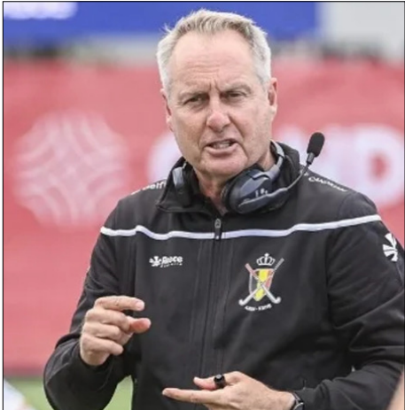
के बीच, वह बेल्जियम की राष्ट्रीय महिला टीम के कोचिंग स्टाफ का भी एक अहम हिस्सा था। इस दौरान टीम ने अपनी विश्व रैंकिंग में

उनका मुख्य लक्ष्य अंतर्राष्ट्रीय स्तर के सितारों की अगली पीढ़ी को तैयार करना है। भारत आने से पहले, व्हाइट बेल्जियम की अंडर-21 महिला टीम के कोच थे, और उन्होंने दिसम्बर में हुए 2025 जूनियर विश्व कप में टीम को कांस्य पदक दिलाने में अहम भूमिका निभाई थी। 2021 से 2024