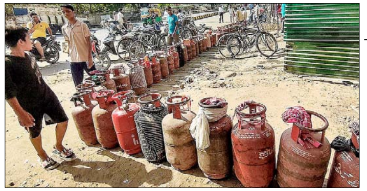
पटना। आपूर्ति संकट के बीच खाली एलपीजी सिलेंडरों के साथ लाइन में लगे लोग।

तेहरान। भारत में ईरानी दूतावास ने शुक्रवार को एलान किया कि उसने जंग के दौरान वित्तीय मदद के लिए बनाए गए सभी खाते बंद कर दिए। इसके साथ ही भारतीय नागरिकों के समर्थन और मदद के लिए शुक्रिया कहा। दूतावास ने अपनी सोशल मीडिया पोस्ट में कहा कि भारतीय नागरिकों से मिले भारी समर्थन और उनकी मदद को देखते हुए अब वे खाते निष्क्रिय कर दिए गए हैं। इसके साथ ही लोगों से दूतावास के नाम पर चल रहे किसी भी खातों में पैसा भेजने की अपील की गई है। इससे पहले 22 मार्च को ईरानी दूतावास ने भारतीयों की नेक इरादों और इंसानियत के लिए उन्हें शुक्रिया कहा था।