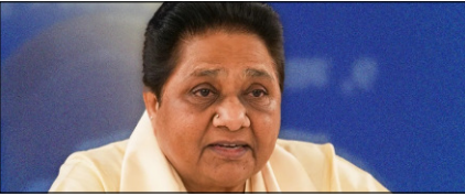
बाबा साहब भीमराव अंबेडकर ने भी शिक्षा को सामाजिक परिवर्तन का मुद्दा बनाया

नई दिल्ली, मुजफ्फरनगर, देहरादून, हल्द्वारी, मुतादाबाद, बरौली, मेरठ व लखनऊ से प्रकाशित