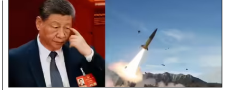
ईरान को हथियार देने की तैयारी में चीन