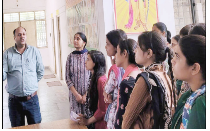
हिंसा, यौन शोषण और साइबर क्राइम आदि से संबंधित विभिन्न सेवाओं के बारे में जानकारी दी गई।

शाह टाइम्स ब्यूरो देवबन्द। राजकीय मॉडल महाविद्यालय कपुरी गोविंदपुर में जागरूकता कार्यक्रम का आयोजन हुआ। इसमें तहल छात्राओं को बालिका सुरक्षा, हिंसा रोकथाम आदि के लिए सरकार द्वारा चलाई जा रही विभिन्न हेल्पलाइन सेवाओं के बारे में जानकारी दी गई।