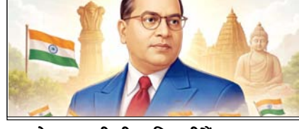
आम्बेडकरवादी भी जातिवादी हैं!