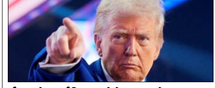
ईरान से वार्ता विफल होने पर भड़के ट्रम्प, ईरान को बताया जिम्मेदार