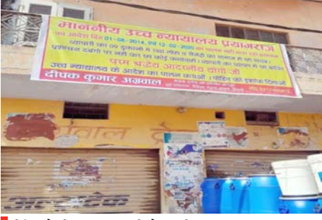
पीड़ित ने दी आत्महत्या की चेतावनी पीड़ित व्यापारी ने अपना वीडियो वायरल कर कई लोगों पर लगाया आरोप, प्रशासन से लगाई मदद की गुहार।

शाह टाइम्स संवाददाता कांधला। कस्बे के रेलवे रोड निवासी व्यापारी के पुत्र ने कस्बे के कई व्यक्तियों पर करीब 40 करोड़ रुपये मूल्य की अपनी संपत्ति पर जबरन कब्जा करने का