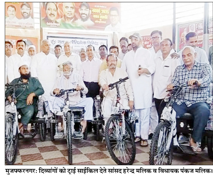
मुजफ्फरनगर: दिव्यांगों को ट्राई साइकिल देते सांसद हरेंद्र मलिक व विधायक पंकज मलिक।

बोले- जनप्रतिनिधियों को कार्यक्रमों से दूर रखना सही परंपरा नहीं शाह टाइम्स संवाददाता मुजफ्फरनगर। दिव्यांगजनों को बैटरी चालित ट्राई साइकिल वितरित की गई। बैटरी चालित ट्राई साइकिल पाकर जरूरतमंदों के चेहरों पर मुस्कान नजर आई। कार्यक्रम के दौरान सांसद हरेंद्र मलिक ने मुख्यमंत्री योगी आदित्यनाथ और केंद्रीय मंत्री जयंत चौधरी के मुजफ्फरनगर क्षेत्र के लेंकर उन्हें निमंत्रण न मिलने पर नाराजगी जताई। उन्होंने कहा कि दोनों बड़े नेता जनपद में आ रहे हैं, लेकिन उन्हें स्वागत का अवसर नहीं दिया गया, जो उचित