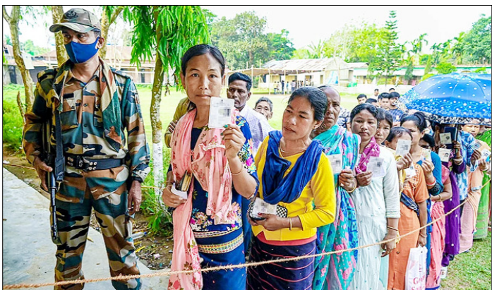
अगरतला। त्रिपुरा जनजातीय क्षेत्र स्वायत्त जिला परिषद (टीटीएएडीसी) चुनाव के दौरान मतदान केंद्र के बाहर अपना वोट डालने के लिए कतार में खड़े होकर अपने पहचान पत्र दिखाते मतदाता।