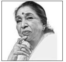
चेस्ट इंफेक्शन के बाद अस्पताल में हुई थीं भर्ती आज शाम 4 बजे शिवाजी पार्क में किया जाएगा अंतिम संस्कार