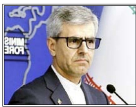
ईरान के प्रस्ताव 'व्यावहारिक' अब अमेरिका को यथार्थवादी रुख अपनाना होगा

कई मुद्दों पर सहमति बनी, अंततः वार्ता किसी समझौते पर पहुंचने में विफल रही