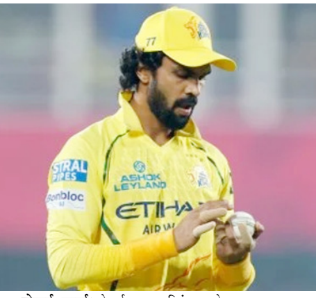
चेन्नई, वाता। चेन्नई सुपर किंग्स के कप्तान रुतुराज गायकवाड़ पर 12 लाख रुपये का जुर्माना लगाया गया है

गायकवाड़ पर भीम ओवर रेट के लिए 12 लाख रुपये का जुर्माना लगाया गया है क्योंकि उनकी टीम ने चेन्नई के एम ए चिदंबरम स्टेडियम में दिल्ली कैपिटल्स के खिलाफ टाटा इंडियन प्रीमियर लीग (आईपीएल) 2026 के मैच नम्बर 18 के दौरान धीमा ओवर-रेट बनाए रखा। आईपीएल के कोड ऑफ कंडक्ट के आर्टिकल 2-22 के तहत उनकी टीम का इस सीजन का पहला उल्लंघन था, जो मिनिमम ओवर-रेट अपराधों से संबंधित है, इसलिए गायकवाड़ पर 12 लाख रुपये का जुर्माना लगाया गया।