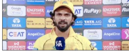
रुतुराज गायकवाड़ पर लगा 12 लाख रुपये का जुर्माना