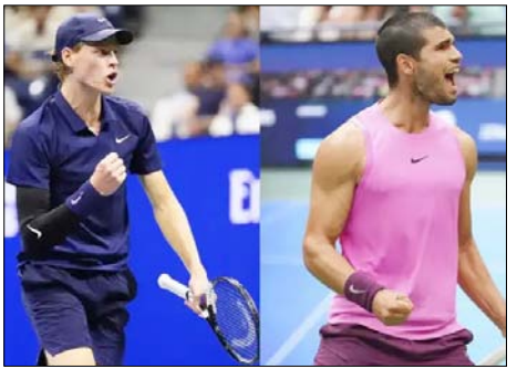
यह मैच का डायनामिक बदल देता है। मेरे पास खाने के लिए कुछ नहीं है। यहां आकर फाइनल में पहुंचना मेरे लिए बहुत मायने रखता है, इसलिए बेशक मैं कल आखिरी दिन जितना हो सक उतना जोर लगाने की कोशिश करूंगा, दुनिया के नम्बर एक अल्काराज ने सिनर के साथ मैचों में 10-6 की बढ़त बना ली है, जिनसे वह पिछले नवम्बर में एटीपी फाइनल्स चैंपियनशिप

मोंटे क्लॉर्, वाता। डिफेंडिंग चैंपियन कालोस अल्काराज मोंटे कालोस मास्टर्स के फाइनल में जानिक सिनर से भिड़ेंगे, जिसमें जीतने वाला दुनिया का नम्बर एक खिलाड़ी बन जाएगा। दोनों शनिवार को सेमीफाइनल में सीधे सेटों में जीते, जिसमें सिनर ने तीसरे सीड अलेक्जेंडर ज्वेरेव को 6-1, 6-4 से हराया और अल्काराज ने घरेलू पसंदीदा वैलेंटिन वैचरोट का सिलसिला 6-4, 6-4 से खत्म किया। टूर्नामेंट के दूसरे सीड और दुनिया के दूसरे नम्बर के खिलाड़ी सिनर, 2015 में नोबाक जोकोविच के बाद एक सीजन में पहले तीन मास्टर्स 1000 फाइनल में पहुंचने वाले पहले खिलाड़ी बन गए हैं।