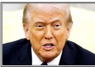
होर्मुज से पास होने वाले जहाजों की निगरानी करेगी अमेरिकी नौसेना, ईरान पर ब्लैकमेल करने का आरोप ट्रम्प ने ईरान को चेतावनी भरे अंदाज में तुरंत इस जलमार्ग को खोलने की मांग की