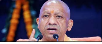
वोट बैंक के सौदागर बंगाल की डेमोग्राफी को बदलना चाहते हैं: योगी

नई दिल्ली, मुजफ्फरनगर, देहरादून, हल्द्वानी, मुरादाबाद, बरेली, मेरठ व लखनऊ से प्रकाशित