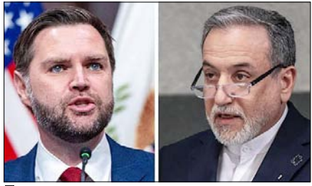
मिडिल ईस्ट में फिर जंग शुरू होने की आशंका बढ़ी, लेबनान को लेकर स्थिति अभी भी तनावपूर्ण

पश्चिम एशिया में जारी तनाव के बीच इस्लामाबाद में शांति वार्ता को लेकर बड़ी खबर सामने आई है। 21 घंटे की बातचीत का कोई नतीजा नहीं निकला है और अमेरिकी प्रतिनिधिमंडल पाकिस्तान से लौटा गया है। इससे अब एक बार फिर जंग शुरू होने की आशंका बढ़ गई है, हालांकि लेबनान को लेकर स्थिति अभी भी तनावपूर्ण है।