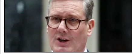
ब्रिटेन होर्मुज स्ट्रेट की नाकेबंदी में शामिल नहीं होगा: स्टार्मर पेज 12