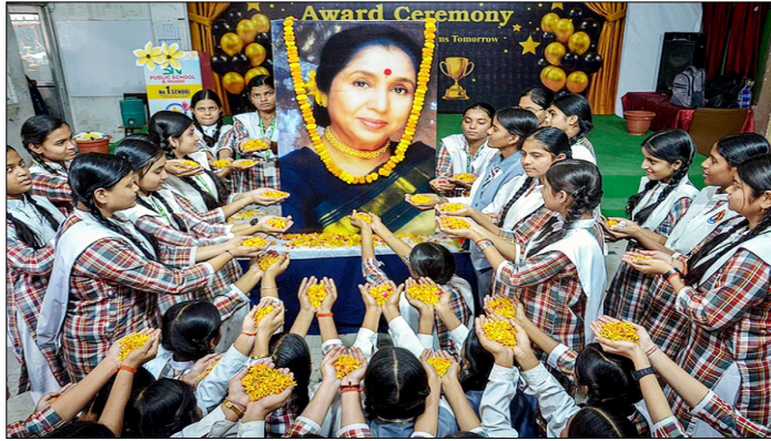
जिर्जापुर। दिवंगत दिग्गज पार्वी गायिका आशा भोसले को श्रद्धांजलि अर्पित करती छात्राएं।

बेरुत। हिजबुल्लाह के राजनीतिक परिषद के उपाध्यक्ष महमूद कोमती ने बताया कि हिजबुल्लाह को उम्मीद है कि रूस, जिसके इरान सहित मध्य पूर्वी देशों के साथ मैत्रीपूर्ण संबंध हैं, इस क्षेत्र में संघर्ष के समाधान में महत्वपूर्ण भूमिका निभा सकता है। कोमती ने कहा कि आज, रूस, ईरान के साथ अपने संबंधों और क्षेत्रीय स्तर पर कई अरब देशों और लेबनान के साथ अपने निष्ठापूर्ण संबंधों के कारण, एक भूमिका निभा सकता है और हम इसकी उम्मीद करते हैं। लेकिन, दुर्भाग्य से, संयुक्त राज्य अमेरिका की किसी भी भूमिका में बाधाएं और रुकावटें पैदा कर रहा है। इस बीच, आज अमेरिका और विशेष रूप से (राष्ट्रपति डोनाल्ड) ट्रम्प, ईरान को प्रभावित करने और युद्धविराम हासिल करने के लिए रूस की ओर रुख कर रहे हैं।