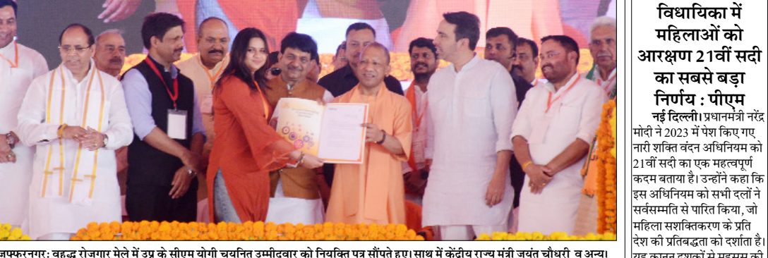
मुजफ्फरनगर: वृद्ध रोजगार मेले में उग्र के सीएम योगी चयनित उम्मीदवार को नियुक्ति पत्र सौंपते हुए। साथ में केंद्रीय राज्य मंत्री जयंत चौधरी व अन्य

एस. आलम अंसारी देहरादून। प्रधानमंत्री नरेंद्र मोदी, मंगलवार को अपने 28 वें दौर पर उत्तराखंड पहुंच रहे हैं। मुख्यमंत्री पुष्कर सिंह धामी के साथे चार साल के कार्यकाल में यह उनका 18वां दौरा होगा। प्रधानमंत्री नरेंद्र मोदी इस दौरान 11970 करोड़ की 210 किलोमीटर लंबे दिल्ली-देहरादून इकोनॉमिक कॉरिडोर परियोजना (एक्सप्रेस वे) के साथ ही, टिहरी में एक हजार मेगावाट क्षमता वाले देश के पहले वेरिबल स्पीड पंप स्टोरेज संयंत्र का भी लोकार्पण करेंगे। प्रधानमंत्री अपने दौर में डाट काली मंदिर में पूजा अर्चना भी करेंगे। प्रधानमंत्री की पूजा के