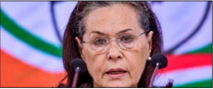
परिसीमन, महिला आरक्षण को लेकर सोनिया गांधी ने सरकार पर साधा निशाना पेज 2

नई दिल्ली, मुजफ्फरनगर, देहरादून, हल्द्वारी, मुतादाबाद, बरौली, मेरठ व लखनऊ से प्रकाशित