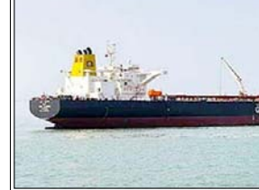
हुई है, लेकिन ये दावे पश्चिम एशिया में बढ़ते भू-राजनीतिक तनाव के बीच सामने आए हैं। इस बीच, रूस के राष्ट्रपति व्लादिमीर पुतिन ने क्षेत्रीय नेताओं से बातचीत कर कूटनीतिक समाधान की संभावनाओं पर जोर दिया है। राष्ट्रपति के सहयोगी निकोलाई पत्रुशोव ने नाटो पर 'सी शील्ड 2026' अभ्यास के जरिए काला सागर क्षेत्र में सैन्य ढांचे का विस्तार करने का आरोप लगाया है। पत्रुशोव ने कहा कि रूस का मुकाबला करने के उद्देश्य से किए जा रहे इन युद्धाभ्यासों के लिए रोमानिया को मुख्य

मास्को। रूस ने अमेरिका के राष्ट्रपति डोनाल्ड ट्रंप के ईरानी बंदरगाहों की नाकेबंदी के फैसले की आलोचना करते हुए कहा है कि इससे वैश्विक बाजारों पर नकारात्मक असर पड़ सकता है। क्रैमलिन के प्रवक्ता दिमित्री पेत्रोव ने कहा कि इस तरह की कार्रवाई अंतर्राष्ट्रीय बाजारों को प्रभावित करती रहेगी और इसके आर्थिक परिणाम दीर्घकालिक हो सकते हैं।