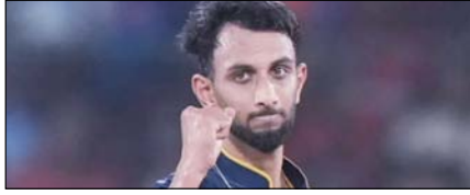
आईपीएल 2026: बेहतरीन प्रदर्शन से पर्पल कैप पर प्रसिद्ध कृष्णा का कब्जा खेल टाइम्स