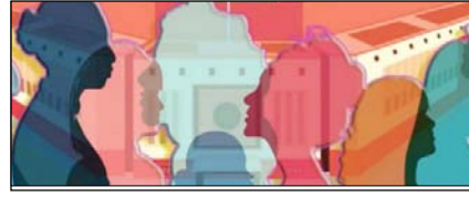
आखिर सुनी गई आधी आबादी की आवाज सम्पादकीय