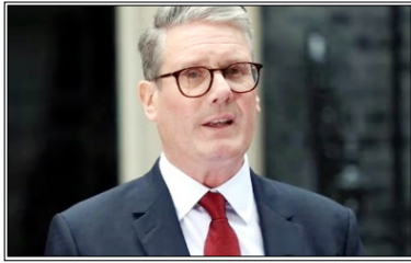
■ अमेरिका ने होर्मुज जलडमरूमध्य को नाकेबंदी में सहयोग के लिए अनुरोध नहीं किया: आस्ट्रेलिया हम चाहते हैं कि बातचीत जारी रहे और फिर से शुरू हो हम इस संघर्ष का अंत देखना चाहते हैं: अल्बानीज

लंदन/अंकारा/कैनबरा। ब्रिटेन के प्रधानमंत्री कीर स्टार्मर ने सोमवार को स्पष्ट किया कि उनका देश ईरान के खिलाफ अमेरिका के नेतृत्व वाली किसी भी नौसैनिक नाकेबंदी में शामिल नहीं होगा। उन्होंने जोर देकर कहा कि ब्रिटेन को ईरान के साथ युद्ध में नहीं घसीटा जाएगा। स्टार्मर ने कहा कि होर्मुज जलडमरूमध्य को नौवहन के लिए पूरी तरह खुला रखना उनकी प्राथमिकता है, क्योंकि इसके बंद होने से वैश्विक ऊर्जा बाजार प्रभावित हो रहे हैं और लोगों के लिए बिजली-गैस के बिल बढ़ रहे हैं।