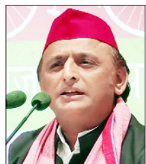
व्यापारियों और सूक्ष्म, लघु एवं मध्यम उद्यमों के लिए नुकसानदायक साबित हो रही हैं।

लखनऊ। हाल ही में उच्चतम न्यायालय के आदेश पर मेरठ की सेंट्रल मार्केट में सरकार की तरफ से की गई सीलिंग को कार्रवाई को लेकर समाजवादी पार्टी अध्यक्ष अखिलेश यादव ने निशाना साधा है।