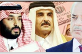
सिर्फ 11 दिन का समय बाकी है। इसके अलावा, अप्रैल में पाकिस्तान को कुल करीब 4.8 अरब डॉलर चुकाने हैं, जिसमें एक बड़ा बॉन्ड भी शामिल है। आईएमएफ ने पाकिस्तान को खराब आर्थिक स्थिति को संभालने के लिए 3 साल का प्रोग्राम शुरू किया है, जिसके तहत उसे करीब 7 अरब डॉलर की मदद मिलेगी। इसके बतले आईएमएफ ने शर्त रखी है कि पाकिस्तान के बड़े कर्जदाता सऊदी

इस्लामाबाद। पाकिस्तान को सऊदी अरब और कतर से 5 अरब डॉलर (लगभग 46500 करोड़ रुपये) की वित्तीय मदद मिलेगी। यह मदद ऐसे समय में आ रही है, जब देश को इस महाने के अंत तक यूई को 3.5 अरब डॉलर (लगभग 29000 करोड़ रुपये) चुकाने हैं। डान की रिपोर्ट के मुताबिक, पाकिस्तान की कमजोर विदेशी मुद्रा स्थिति संभालने के लिए यह मदद अहम मानी जा रही है। यूई ने हाल ही में कर्ज रोलओवर की नीति में बदलाव किए थे। इसके बाद पाकिस्तान ने अप्रैल तक यूई का 3.5 अरब डॉलर का कर्ज चुकाने का फैसला किया। तब शेंडयूल के मुताबिक 23 अप्रैल तक पाकिस्तान को इस कर्ज की आखिरी किस्त देनी है। इसका मतलब कर्ज चुकाने के लिए