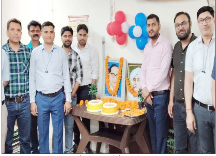
बुढ़ाना: स्थापना दिवस पर महापुरुषों को नमन करते बैंक कर्मी।