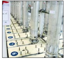
■ होर्मुज तनाव के बीच पुतिन का बड़ा दांव शांतिवार्ता के लिए पेश की ये योजना

मास्को। ईरान और अमेरिका के बीच शांति वार्ता विफल होने के बाद पश्चिम एशिया में तनाव काफी बढ़ गया है। इस बीच रूस ने भविष्य में होने वाली शांति वार्ता के लिए एक नया प्रस्ताव पेश किया है। क्रैमलिन ने सोमवार को जानकारी दी कि रूस अमेरिका के साथ किसी भी संभावित शांति समझौते के तहत ईरान का संवर्धित यूरेनियम (enriched uranium) अपने पास रखने के लिए तैयार है।