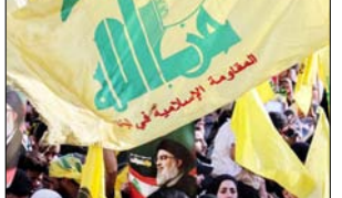
■ कहा: लेबनान सरकार का हिजबुल्लाह के खिलाफ रुख देश में आंतरिक विभाजन पैदा कर सकता है