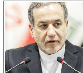
■ सहमति के बहुत करीब होने के बावजूद बदलती शर्तों और प्रतिबंधों को हमारे समक्ष लाया गया: अराघची

नई दिल्ली। ईरान को विदेश मंत्री अब्बास अराघची ने इस्लामाबाद वार्ता की विफलता के लिए अमेरिका को जिम्मेदार ठहराते हुए कहा है कि 'बदलती शर्तों और प्रतिबंधों' को हमारे सामने रखा गया। अराघची ने सोमवार को 'एक्स' पर अपनी पोस्ट में कहा कि वार्ता के दौरान सहमति के बहुत करीब होने के बावजूद बदलती शर्तों और प्रतिबंधों को हमारे समक्ष लाया गया। अराघची ने एक अन्य