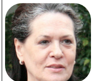
सरकार 2029 से महिला आरक्षण लागू करना चाहती है, तो यह निर्णय पहले क्यों नहीं लिया गया, पारदर्शिता नहीं बरती जा रही

नई दिल्ली, वार्ता कांग्रेस संसदीय दल की अध्यक्ष सोनिया गांधी ने एक निजी अखबार में लिखे अपने लेख के जरिए केंद्र सरकार पर महिला आरक्षण और परिसीमन के मुद्दे को लेकर हमला बोला है।