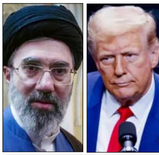
समय लिया गया है जब दोनों देशों के बीच समझौते के खत्म हो गईं। अमेरिका का कहना है कि यह कदम ईरान पर दबाव बढ़ाने के लिए उठाया गया है। वहीं, ईरान ने इस अंतर्राष्ट्रीय कानून के खिलाफ बताया

तेहरान, वार्ता ईरान- अमेरिका के बीच तनाव लगातार बढ़ता जा रहा है। अमेरिका ने ईरान के बंदरगाहों की नाकेबंदी का ऐलान कर दिया है। इसके जवाब में ईरान ने सख्त चेतावनी दी। ईरान की सेना ने कहा है कि अगर उसके बंदरगाहों को निशाना बनाया गया, तो फारस की खाड़ी से लेकर ओमान सागर तक कोई भी बंदरगाह सुरक्षित नहीं रहेगा। इस बयान के बाद पूरे क्षेत्र में तनाव और बढ़ गया है।