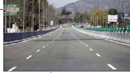
लंबे समय से विकास की दौड़ में एक पिछड़ा राज्य रहा है। जिसका मुख्य कारण वर्ष 1991 के आर्थिक सुधारों के बाद राज्य की अर्थव्यवस्था का प्राथमिक क्षेत्र

अव्बकर शिब्ली सहारनपुर। उत्तर प्रदेश सरकार अब राज्य के सामाजिक-आर्थिक विकास को सुदृढ़ औद्योगिक अवसरचना के साथ जोड़कर देख रही है। जिसके चलते सरकार राज्य के परिवहन इंफ्रास्ट्रक्चर को मजबूत करने के प्रयास में लगी है। प्रधानमंत्री नरेंद्र मोदी द्वारा मंगलवार को राष्ट्र को समर्पित किया गया ग्रीनफील्ड दिल्ली-देहरादून आर्थिक कॉरिडोर इसी श्रृंखला की अगली कड़ी है। दरअसल, उत्तर प्रदेश लंबे समय से विकास की दौड़ में एक पिछड़ा राज्य रहा है। जिसका मुख्य कारण वर्ष 1991 के आर्थिक सुधारों के बाद राज्य की अर्थव्यवस्था का प्राथमिक क्षेत्र (कृषि) से सीधे तृतीय क्षेत्र (सेवा) में चले जाना रहा है। लगभग तीन दशकों तक द्वितीय क्षेत्र (उद्योग) इस राज्य में उपेक्षित ही रहा। जिसका परिणाम यह हुआ कि राज्य में अपेक्षित रोजगार सृजन नहीं हो पाया, क्योंकि उद्योग ही रोजगार सृजन क्षेत्र है। इसी उपेक्षा के कारण दीर्घकाल में राज्य सामाजिक आर्थिक विकास की