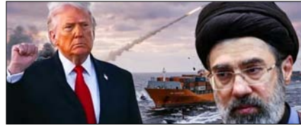
अमेरिकी नौसैनिक नाकेबंदी संभ्रमता का घोर उल्लंघन: ईरान