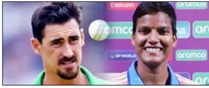
मिचेल स्टार्क और दीप्ति शर्मा बने विजडन के साल के सर्वश्रेष्ठ क्रिकेटर