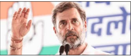
नोएडा में वेतन बढ़ाने को श्रमिक आंदोलन सही: राहुल गांधी

नई दिल्ली, मुजफ्फरनगर, देहरादून, हल्द्वानी, मुतादाबाद, बरौली, मेरठ व लखनऊ से प्रकाशित