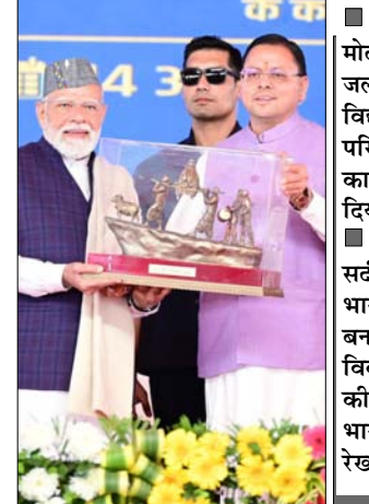
पीएम मोदी ने सहारनपुर में किया रोड शो

उत्तराखंड, यूपी व दिल्ली को 212 किमी लम्बे इकोनॉमिक कॉरिडोर की दी सौगात शाह टाइम्स ब्यूरो देहरादून। उत्तराखंड के लिए मंगलवार का दिन बेहद खास और ऐतिहासिक रहा। प्रदेशवासियों का इंतजार उस समय खत्म हो गया जब पीएम नरेंद्र मोदी ने देहरादून-दिल्ली इकोनॉमिक कॉरिडोर का लोकार्पण कर जनता को समर्पित किया। इससे पहले पीएम मोदी ने बाबा साहब भीमराव अंबेडकर के चित्र पर पुष्पांजलि अर्पित की।