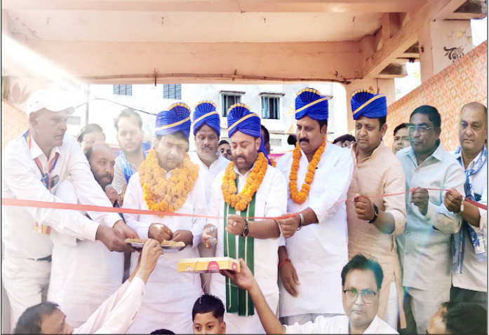
मुजफ्फरनगर: टाउनहाल में आंबेडकर जयंती पर शोभायात्रा का शुभारंभ करते मंत्री व अन्य।