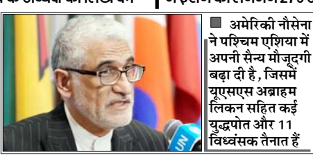
अमेरिकी नौसेना ने पश्चिम एशिया में अपनी सैन्य मौजूदगी बढ़ा दी है, जिसमें यूएसएस अब्राहम लिंकन सहित कई युद्धपोत और 11 विध्वंसक तैनात हैं

न्यूयॉर्क। ईरान ने अमेरिका द्वारा उसके बंदरगाहों की कथित नौसैनिक नाकेबंदी की कड़ी निंदा करते हुए इसे उसकी संप्रभुता और क्षेत्रीय अखंडता का 'घोर उल्लंघन' बताया है। संयुक्त राष्ट्र में ईरान के स्थायी प्रतिनिधि अमीर साईद इरावानी ने संयुक्त राष्ट्र महासचिव एंटोनियो गुटेरेस और संयुक्त राष्ट्र सुरक्षा परिषद के अध्यक्ष को लिखे पत्र में इस कदम को 'अवैध आक्रामक कार्रवाई' करार दिया, जो क्षेत्रीय और अंतर्राष्ट्रीय शांति के लिए खतरा है। इरावानी ने कहा कि 12 अप्रैल को यूएस सेंट्रल कमांड द्वारा घोषित यह नाकेबंदी संयुक्त राष्ट्र चार्टर के अनुच्छेद 2(4) का उल्लंघन है और अंतर्राष्ट्रीय कानून के तहत 'आक्रामकता का स्पष्ट उदाहरण' है। उन्होंने आरोप लगाया कि यह कदम ईरान के बंदरगाहों से आने-जाने वाले समुद्री यातायात को रोकने का प्रयास है, जिससे न केवल ईरान के संप्रभु अधिकारों में हस्तक्षेप हो रहा है, बल्कि तीसरे देशों और वैध समुद्री व्यापार के अधिकारों का भी उल्लंघन हो रहा है। ईरानी दूत ने चेतावनी दी कि तेहरान अपनी संप्रभुता और राष्ट्रीय हितों की रक्षा के लिए 'सभी आवश्यक और उचित कदम'