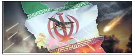
व्यापक सभ्यताओं का संघर्ष है ईरान का अमेरिका से युद्ध