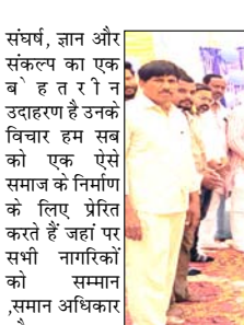
संघर्ष, ज्ञान और संकल्प का एक बे ह त र ी न उदाहरण है उनके विचार हम सब को एक ऐसे समाज के निर्माण के लिए प्रेरित करते हैं जहां पर सभी नागरिकों को सम्मान, समान अधिकार और समान अवसर प्राप्त हो। उन्होंने कहा कि भारत के संविधान निर्माता भारत रत्न बाबा साहेब डॉक्टर भीमराव अंबेडकर जी को सच्ची श्रद्धांजलि और नमन नहीं होगा कि हम उनके आदर्शों को अपनाकर सामाजिक न्याय, समता, समानता और सशक्तिकरण के उनके सपने को साकार करने का संकल्प ले और यही प्रण हमें शिक्षा और उच्च