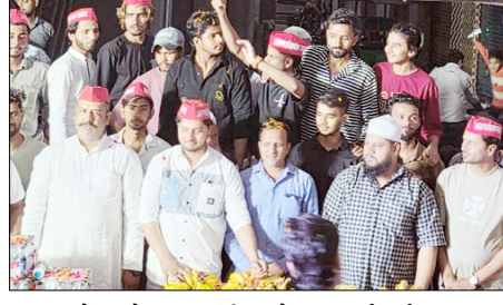
जानसठ में आम्बेडकर जयंती मनाते सपा कार्यकर्ता।