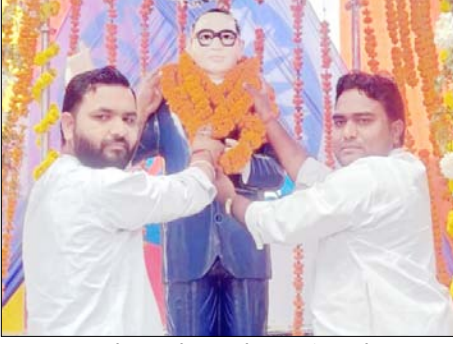
बुढ़ाना: बुढ़ाना में डा. आम्बेडकर को माल्यार्पण करते अतिथि।

भारत रत्न बाबा साहेब डॉक्टर भीमराव आंबेडकर की 135वीं जयंती के पावन अवसर पर मंगलवार को कस्बा बुढ़ाना में जन्मोत्सव व भव्य शोभायात्रा का आयोजन किया गया। दोपहर बाद कस्बे के आंबेडकर पार्क से शुरू हुई शोभायात्रा में हजारों की संख्या में अनुयायी शामिल हुए। पूरा कस्बा जय भीम-जय संविधान के नारों से गूंज उठा। शोभायात्रा आंबेडकर भवन से आरंभ होकर कस्बे के कांथला रोड को होती हुई अन्य मुख्य मार्गों से गुजरती शोभायात्रा में डोजे की धुन पर युवा बाबा साहेब के गीतों पर थिरकते नजर आए। सबसे बड़ा आकर्षण का केंद्र डॉक्टर आंबेडकर के जीवन संघर्ष, शिक्षा और संविधान निर्माण से जुड़ी मनमोहक झांकियां रही। भगवान (बु) की झांकी और संविधान की प्रति लिए झांकी को लोगों ने हाथ जोड़कर नमन किया। युवाओं ने हाथों में नीले झंडे लेकर वादक रैली भी निकाली। शोभायात्रा को लेकर प्रशासन पूरी तरह मुस्तैद रहा। सुरक्षा की दृष्टि से कस्बे में चप्पे चप्पे पर पुलिस बल तैनात किया गया था। बुढ़ाना कोतवाली प्रभारी सुभाष अजी सीओएचजेड पाल सिंह के नेतृत्व में पुलिस फोर्स लेकर शोभायात्रा के साथ चलते रहे। ड्रोन कैमरे से भी पूरे मार्ग की निगरानी की गई। शांतिपूर्ण माहौल में शोभायात्रा का समापन देर रात आंबेडकर भवन पर हुआ जहां प्रसाद वितरण किया गया। इस मौके पर मुख्य अतिथि कश्यप समाज बुढ़ाना क्षेत्र की खाप के चौधरी डाक्टर सौ. कश्यप ने कहा कि डॉक्टर