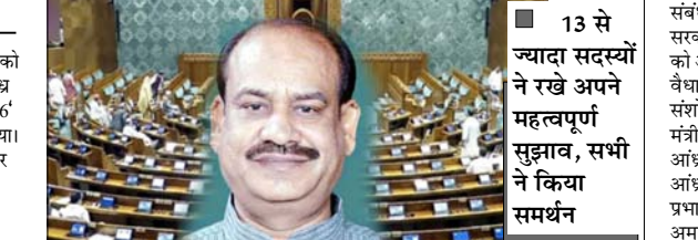
13 से ज्यादा सदस्यों ने रखे अपने महत्वपूर्ण सुझाव, सभी ने किया समर्थन

नई दिल्ली। लोकसभा ने अमरावती को आंध्र प्रदेश की राजधानी बनाने वाले 'आंध्र प्रदेश पुनर्गठन (संशोधन) विधेयक 2026' को बुधवार को ध्वनिमत से पारित कर दिया। गृह राज्य मंत्री नित्यानंद राय ने इस पर हुई चर्चा का जवाब देते हुए कहा कि विधेयक पर करीब दो घंटे चर्चा चली जिसमें 13 से ज्यादा सदस्यों ने अपने महत्वपूर्ण सुझाव इसमें रखे हैं और लगभग सभी सदस्यों ने इस विधेयक का समर्थन किया है। उन्होंने बताया कि अमरावती को आंध्र प्रदेश की राजधानी बनाने को लेकर