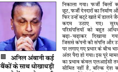
अनिल अंबानी की बैंकों के साथ धोखाधड़ी मामले में कर रहे कानूनी कार्रवाई का सामना

नई दिल्ली। केंद्रीय जांच ब्यूरो यानी सीबीआई ने बुधवार को रिलायंस कम्युनिकेशंस लिमिटेड, इसके प्रमोटर अनिल अंबानी और कुछ अज्ञात सरकारी कर्मचारियों के खिलाफ एक नया मामला दर्ज किया है। यह मामला भारतीय जीवन बीमा निगम को कथित तौर पर 3,750 करोड़ रुपये का गलत तरीके से नुकसान पहुंचाने से जुड़ा है।