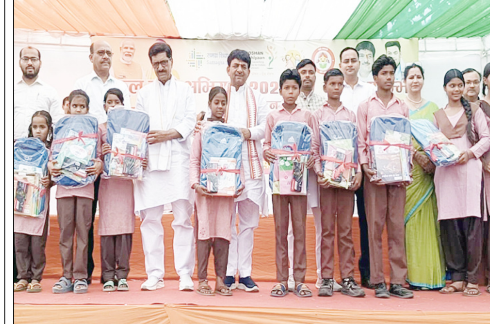
मुजफ्फरनगर: उत्कृष्ट कार्य करने वाले शिक्षकों को सम्मानित करते मंत्री व जिला पंचायत अध्यक्ष।