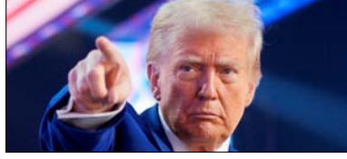
ईरान में चल रहा अमेरिकी सैन्य ऑपरेशन बहुत जल्द खत्म कर दिया जाएगा, एक माह से जारी जंग के बीच आया ट्रम्प का बयान

वाशिंगटन। पश्चिम एशिया में जारी संघर्ष दिन-ब-दिन और भयावह होता जा रहा है। अमेरिका और इजरायल के भीषण हमलों से दहक रहे मोर्चे पर ईरान भी इजरायल और खाड़ी देशों में मौजूद अमेरिकी सैन्य ठिकानों पर जोरदार पलटवार कर रहा है। मिसाइलों और ड्रोन की गरज के बीच यह संघर्ष अब अपने 33वें दिन में प्रवेश कर चुका है और पूरे क्षेत्र में तनाव अब भी चरम पर है। इसी उग्र हालात के बीच अब अमेरिका के राष्ट्रपति डोनाल्ड ट्रम्प का बड़ा बयान सामने आया है। उन्होंने कहा कि ईरान में चल रहा अमेरिकी सैन्य ऑपरेशन बहुत जल्द खत्म कर दिया जाएगा। अपने बयान में ट्रम्प ने अमेरिका को अगले दो से तीन हफ्तों के अंदर