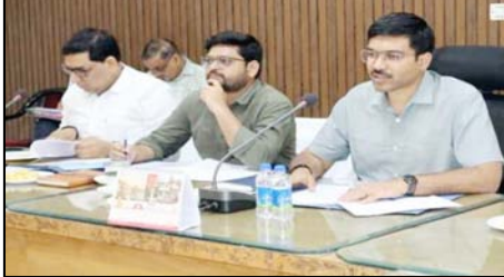
वैध फिटनेस प्रमाण-पत्र और निर्धारित सुरक्षा मानकों को कोई भी वाहन सड़क पर संचालित नहीं होगा। जिलाधिकारी ने निर्देश दिए कि अगले 15 दिनों के भीतर प्रत्येक विद्यालय में स्कूली बच्चों की सुरक्षा समिति को बैठक आयोजित कर सुरक्षा व्यवस्थाओं की समीक्षा की जाए। उन्होंने कहा कि नए पोर्टल पर डेटा फीडिंग और फिटनेस जांच अभियान का मुख्य उद्देश्य बच्चों की