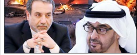
ईरान जंग में शामिल हो सकता है यूई पेज 12