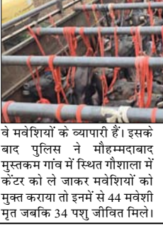
मंगलवार की शाम लगभग चौने छह ब्रजघाट के पास हाइवे पर वाहन चैकिंग कर रहे थे, तभी मुरादाबाद दिशा की ओर से एक आयरशर केंटर आया। पुलिस ने उसे रूकवाया और तिरपाल के अंदर देखा तो उसमें बेहद क्रूरता के साथ मवेशी भरे हुए थे। जिनमें से कई हांप रहे थे तो वहीं एक दूसरे के ऊपर पड़े थे और रम्भा रहे थे। पुलिस ने केंटर चालक व कैबिन में मौजूद लोगों से पूछा तो बताया कि

पुलिस ने चैकिंग के दौरान पकड़ा केंटर, पांच आरोपियों के विरुद्ध मुकदमा दर्ज, तीन गिरफ्तार