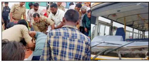
पत्नी गंभीर रूप से घायल, बाइक पर सवार होकर पूजा करने जा रहा था परिवार, बस चालक गिरफ्तार