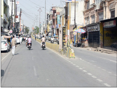
आमतौर पर चहल-पहल से भरे रहने वाले बाजारों में रविवार को अपेक्षाकृत कम भीड़ देखने को मिली। लोग जल्दी काम होने पर ही घरों से बाहर निकले, जबकि अधिकांश लोगों ने दोपहर के समय घर में रहना ही उचित समझा। गर्मी का असर इस कदर था कि सार्वजनिक स्थानों पर भी लोगों की आवाजाही काफी कम हो गई। शहर के प्रमुख बाजारों में बड़ा बाजार, नया बाजार, गांधी चौक, नेहरू मार्केट और कबाड़ी बाजार सहित प्रमुख चौराहों जैसे गुरुद्वारा तिराहा, फव्वारा चौक, विजय चौक और रविवार चौक पर भी दिनभर सन्नाटा पसरा रहा। दुकानदारों का कहना है कि भीषण गर्मी के कारण ग्राहकों की संख्या में भारी कमी आई है, जिससे उनके व्यापार पर भी असर पड़ रहा है। खासतौर पर दोपहर के समय बाजार लगभग खाली नजर आए। गर्मी के बढ़ते प्रभाव के चलते लोग अपनी दिनचर्या में भी बदलाव कर रहे हैं। कई लोग सुबह और शाम के समय ही बाहर निकलना पसंद कर रहे हैं, जबकि दिन के समय घरों में रहकर गर्मी से बचने का प्रयास कर रहे हैं। बच्चों और बुजुर्गों को विशेष रूप से गर्मी से बचाने के लिए परिवारों द्वारा अतिरिक्त सावधानियाँ बरती जा रही हैं। इस मौसम में सतक रहने की सलाह दी है। उनका कहना है कि अत्यधिक गर्मी के कारण शरीर में पानी की कमी हो सकती है, जिससे डिहाइड्रेशन और हीट स्ट्रोक जैसी समस्याएँ उत्पन्न हो सकती हैं। इसलिए लोगों को पर्याप्त मात्रा में पानी पीने, हल्के और ढीले कपड़े पहनने तथा धूप में निकलने से पहले सिर को ढकने की सलाह दी गई है। विशेषज्ञों ने यह भी कहा कि दोपहर के समय अनावश्यक रूप से बाहर निकलने से बचें और यदि बाहर जाना जरूरी हो तो सावधानी बरतें। आने वाले दिनों में तापमान और बढ़ने की संभावना जताई जा रही है, ऐसे में नागरिकों को सतक रहने और अपने स्वास्थ्य का विशेष ध्यान रखने की जरूरत है।

शाह टाइम्स संवाददाता शामली। जनपद में गर्मी का प्रकोप लगातार बढ़ता जा रहा है और तापमान में तेजी से हो रही वृद्धि ने आम जनजीवन को प्रभावित करना शुरू कर दिया है। रविवार को अधिकतम तापमान 39 डिग्री सेल्सियस तक पहुँच गया, जबकि न्यूनतम तापमान 22 डिग्री सेल्सियस दर्ज किया गया। सुबह से ही तेज धूप का असर दिखाई देने लगा था और करीब 10 बजे के बाद गर्मी ने अपना तीखा रूप दिखाना शुरू कर दिया। जैसे-जैसे दिन चढ़ता गया, वैसे-वैसे तापमान में बढ़ोतरी होती रही, जिससे लोगों को भीषण गर्मी का सामना करना पड़ा। तेज धूप और गर्म हवाओं के चलते शहर की सड़कों और बाजारों में सन्नाटा छा गया।