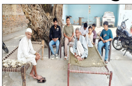
और वीडियो के नाम पर ब्लैकमेल करते हुए करीब तीन लाख रुपये वसूल लिए। इसके बावजूद आरो. पितृ लगातार उसे ब्लैकमेल करते रहे और अश्लील सामग्री उसके परिचितों को भेजने की धमकी दे रहे हैं। गिरोह ने हनी ट्रेप में फँसे युवक की लापरवाही बर्दाश्त नहीं की जाएगी।