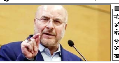
ईरानी विदेश मंत्रालय ने अंतर्राष्ट्रीय कानून के अनुपालन की यूरोपीय संघ की अपील को किया खारिज

हमें दुश्मन पर भरोसा नहीं है, अमी मी, जब हम यहां बैठे हैं, युद्ध छिड़ सकता है: संसद अध्यक्ष