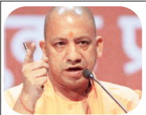
पत्रकार वार्ता में कांग्रेस, सपा, टीएमपी और डीएमके पर सीएम ने बोला हमला, कहा- महत्वपूर्ण विधेयक का विरोध किया

लखनऊ। उत्तर प्रदेश के मुख्यमंत्री योगी आदित्यनाथ ने राजधानी में आयोजित एक प्रकर समलेन में संसद के हालिया घटनाक्रम को लेकर विपक्ष, खासकर इंडी गठबंधन, पर तीखा प्रहार किया। उन्होंने कहा कि संसद में जिस प्रकार का आचरण विपक्षी दलों द्वारा किया गया, वह न केवल दुर्भाग्यपूर्ण है, बल्कि देश की लोकतांत्रिक मर्यादाओं के भी खिलाफ है।