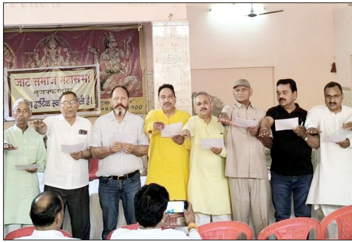
मुजफ्फरनगर। जाट महासभा की नई कार्यकारिणी शपथ लेते हुए।

स्थानीय लोगों के अनुसार, स्मार्ट मीटर और ऑनलाइन सिस्टम लागू होने के बाद इस तरह की त्रुटियां बड़ी हैं। छोटी-छोटी समस्याओं के समाधान के लिए भी उपभोक्ताओं को बार-बार विभाग के चक्कर काटने पड़ रहे हैं, जिससे नाराजगी बढ़ रही है। लोगों ने मांग की है कि विभाग ऐसे मामलों को गंभीरता से लेकर त्वरित समाधान सुनिश्चित करें और जिम्मेदार कर्मचारियों के खिलाफ कार्रवाई की जाए, ताकि भविष्य में इस तरह की लापरवाही दोहराई न जाए।