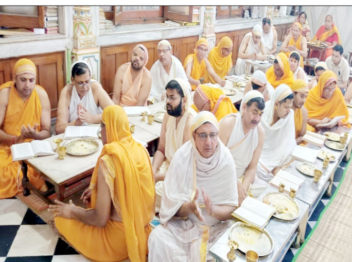
खतौली: अक्षय तृतीया पर श्रद्धा का अर्पण।