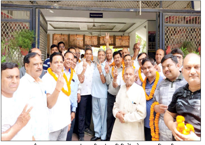
मुजफ्फरनगर: जैन कन्या पाठशाला संस्था की प्रबंध समिति में चुने गए पदाधिकारी।