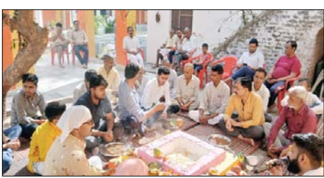
पर प्रकाश डालते हुए कहा कि वे न्याय, धर्म और सत्य के प्रतीक थे। पूरे आयोजन के दौरान मंदिर परिसर भगवान परशुराम के जयकारों से गुंजायमान रहा। कार्यक्रम के अंत में श्रद्धालुओं के न्याय, धर्म और सत्य के प्रतीक थे। पूरे आयोजन के दौरान मंदिर परिसर भगवान परशुराम के जयकारों से गुंजायमान रहा।