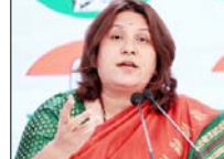
भाजपा नहीं देना चाहती महिलाओं को आरक्षण

कांग्रेस ने कहा है कि भाजपा हमेशा महिलाओं को आरक्षण देने के खिलाफ रही है और यही वजह है कि इस बार उसने महिला आरक्षण को आड़ में परिसीमन लाने का पदचरित्र किया, जिसके कारण संसद में पेश संविधान संशोधन विधेयक गिर गया और भाजपा को मुंह की खानी पड़ी।