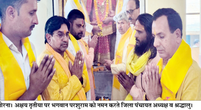
मोराणा। अक्षय तृतीया पर भगवान परशुराम को नमन करते जिला पंचायत अध्यक्ष व श्रद्धालु।