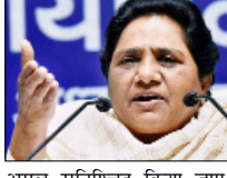
अवश्यक बताया और कार्यकर्ताओं से इसे जन-जन तक पहुंचाने का आह्वान किया। उन्होंने 22 फरवरी 2026 को लखनऊ में आयोजित ऑनलाइन बैठक का भी उल्लेख करते हुए कहा कि उसमें पार्टी और मूवमेंट के हित में दिए गए दिशा-निर्देशों को भी समयबद्ध ढंग से पूरा किया जाए। उन्होंने निर्देश दिया कि प्रदेशभर में आयोजित बैठकों के दौरान बसपा सरकार में कराए गए विकास कार्यों और जनहित योजनाओं की जानकारी आम जनता तक पहुंचाई जाए। उन्होंने कहा कि प्रदेश में बने कई एक्सप्रेस-वे और नोएडा में विकसित हो रहा अंतर्राष्ट्रीय हवाई अड्डा जैसे परियोजनाओं को परिकल्पना बसपा शासनकाल में ही की गई थी। बसपा प्रमुख ने कानून द्वारा कानून का राज तथा सर्वजन हिताय, सर्वजन सुखाय की नीति को प्रदेश के समुचित विकास और बेहतर कानून-व्यवस्था के लिए

बसपा प्रमुख मायावती ने दिए पदाधिकारियों को निर्देश शाह टाइम्स ब्यूरो लखनऊ। उत्तर प्रदेश की पूर्व मुख्यमंत्री और बहुजन समाज पार्टी की राष्ट्रीय अध्यक्ष मायावती ने उत्तर प्रदेश के पार्टी पदाधिकारियों और कार्यकर्ताओं को संगठन को मजबूत करने, जनाधार बढ़ाने और आगामी चुनावों को तैयारियों में तेजी लाने के निर्देश दिए हैं। उन्होंने कहा कि वह वर्तमान में पार्टी कार्य के सिलसिले में दिल्ली में हैं और कार्य पूर्ण होने ही शीघ्र ही लौटेंगी। मायावती ने 31 मार्च 2026 को लखनऊ में आयोजित प्रदेश स्तरीय बैठक का उल्लेख करते हुए कहा कि उसमें संगठन विस्तार, कैंडिड मजबूती, आर्थिक संसाधनों को सुदृढ़ करने और विधानसभा उपचुनाव को तैयारियों को लेकर जो दिशा-निर्देश दिए गए थे, उन पर पूरी निष्ठा और ईमानदारी के साथ