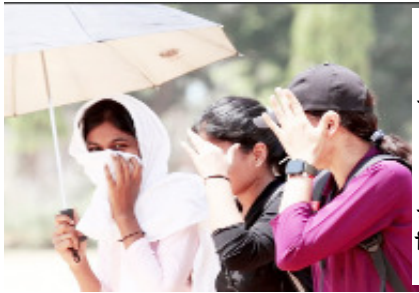
कहा गया है कि हरदोई, उन्नाव, रायबरेली, अमेठी, सुल्तानपुर, गाजीपुर, गोरखपुर मंडल के कुछ हिस्सों सहित मध्य और पूर्वी यूपी के तेजी से वृद्धि दर्ज की जा रही है। मौसम विभाग के अनुसार 26 अप्रैल के आसपास कुछ स्थानों पर आंशिक बदलाव के संकेत हैं, जहां कहीं-कहीं गरज-चमक के साथ हल्की बारिश या बौछारें पड़ सकती हैं, लेकिन उससे राहत के आसार नहीं हैं।

शाह टाइम्स ब्यूरो लखनऊ। उत्तर प्रदेश में भीषण गर्मी का प्रकोप लगातार बढ़ता जा रहा है और विभिन्न जिलों में तापमान सामान्य से ऊपर बना हुआ है। मौसम विभाग द्वारा बुधवार को जारी प्रभाव आधारित पूर्वानुमान के अनुसार प्रदेश के अधिकांश हिस्सों में मौसम शुष्क रहने तथा तेज सतही हवाएं चलने की संभावना है, जबकि कई जिलों में लू की स्थिति बनी रहेगी। राजधानी लखनऊ समेत कानपुर, प्रयागराज, वाराणसी, झांसी, आगरा, अलीगढ़ और मेरठ मंडलों के जिलों में अधिकतम तापमान 40 से 45 डिग्री सेल्सियस के बीच दर्ज किया जा रहा है। बुंदेलखंड और पूर्वांचल के जिलों बांदा, चित्रकूट, कौशांबी, फतेहपुर, प्रतापगढ़, जौनपुर, आजमगढ़, मऊ और बलिया में तापमान 44 डिग्री सेल्सियस के आसपास पहुंचने से जनजीवन प्रभावित हो रहा है। मौसम विभाग के अनुसार 22 से 25 अप्रैल के बीच पश्चिमी और पूर्वी उत्तर प्रदेश में अधिकतम स्थानों पर मौसम शुष्क रहेगा, जबकि दिन के समय तेज गर्म हवाएं (30-40 किमी/घंटा) चल सकती हैं। पूर्वानुमान में