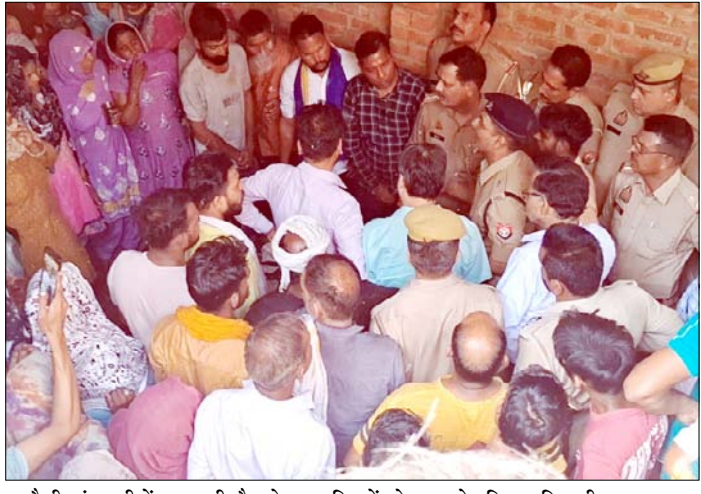
खतौली: गंगधाड़ी में युवक की मौत के बाद परिजनों को समझाते पुलिस अधिकारी।

मिलते ही कोतवाली पुलिस मौके पर पहुंची और शव को नीचे उतरवाकर आवश्यक कार्रवाई की। पुलिस ने पंचनामा भरकर शव को पोस्टमार्टम के लिए भेज दिया है। पुलिस अधिकारियों का कहना है कि शुरुआती जांच में मामला आत्महत्या का लग रहा है, हालांकि सभी बिंदुओं पर जांच की जा रही है। युवक की असमय मौत से परिवार में गहरा दुख है और परिजनों का रो-रोकर बुरा हाल है। वहीं, क्षेत्र में भी इस घटना को लेकर शोक और चर्चा का माहौल बना हुआ है। मामला कुछ भी हो लेकिन युवक की जान चली गई है एक मां से बेटा छिन्न गया और बहन से भाई।