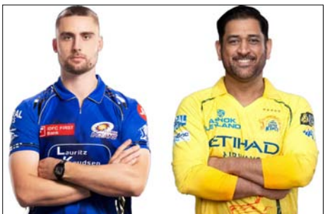
पी-सीजन शिविर के दौरान पिडली में खिलाड़ों से उबर रहे धोनी में किसी भी तरह की परेशानी के कोई लक्षण नहीं दिखे और वह मैच के लिए पूरी तरह तैयार नजर आए। सीएसके इस समय अंक तालिका में आठवें स्थान पर है, उसने छह मैचों में से केवल दो मैच जीते हैं, ऐसे में धोनी की वापसी टीम के बल्लेबाजी क्रम को बहुत जरूरी स्थिरता और अनुभव दे सकती है।

मुंबई, वार्ता। महेंद्र सिंह धोनी और विल जैक्स गुरुवार रात वानखेड़े स्टेडियम में मुंबई इंडियंस और चेन्नई सुपर किंग्स (सीएसके) के बीच होने वाले इंडियन प्रीमियर लीग (आईपीएल) 2026 के बड़े मुकामले के लिए वापसी करने को तैयार दिख रहे हैं। कल होने वाले मुकाबले धोनी की मौजूदगी संर्घा कर रही सीएसके टीम के लिए एक बड़ा सहारा बन सकती है। 44 साल के इस अनुभवी खिलाड़ी ने मंगलवार को वानखेड़े में अभ्यास किया। उन्होंने करीब आधे घंटे तक विकेटकीपिंग की और फिर 30 मिनट तक बिना किसी परेशानी के बल्लेबाजी का अभ्यास किया। मुंबई, वार्ता। महेंद्र सिंह धोनी और विल जैक्स गुरुवार रात वानखेड़े स्टेडियम में मुंबई इंडियंस और चेन्नई सुपर किंग्स (सीएसके) के बीच होने वाले इंडियन प्रीमियर लीग (आईपीएल) 2026 के बड़े मुकामले के लिए वापसी करने को तैयार दिख रहे हैं। कल होने वाले मुकाबले धोनी की मौजूदगी संर्घा कर रही सीएसके टीम के लिए एक बड़ा सहारा बन सकती है। 44 साल के इस अनुभवी खिलाड़ी ने मंगलवार को वानखेड़े में अभ्यास किया। उन्होंने करीब आधे घंटे तक विकेटकीपिंग की और फिर 30 मिनट तक बिना किसी परेशानी के बल्लेबाजी का अभ्यास किया।