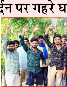
निकला। ग्रामीणों ने तुरंत घायल युवक को एम्बुलेंस की मदद से अस्पताल भेजा। गांव में इस घटना के बाद से दहशत का माहौल बना हुआ है। ग्रामीणों का कहना है कि क्षेत्र में पिछले कुछ दिनों से गुलदार की गतिविधियां देखी जा रही थीं, लेकिन वन विभाग द्वारा

कोई ठोस कदम नहीं उठाया गया। वहीं गुलदार के हमले से गांव में दहशत का माहौल है और लोग अपने घरों से बाहर निकलने में भी डर महसूस कर रहे हैं।