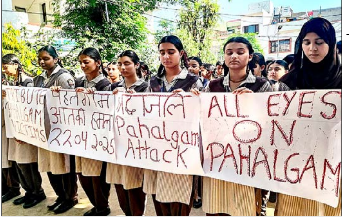
जम्मू। पहलगाम आतंकी हमले की पहली बरसी पर प्रार्थना व श्रद्धांजलि अर्पित करती छात्राएं।

बर्लिन। जर्मनी होर्मुज जलडमरूमध्य में जहाजों को सुरक्षित करने के वास्ते अंतर्राष्ट्रीय मिशन में भाग लेने के लिए तीन जहाज तैनात करने की योजना बना रहा है। 'डेर स्पीगल' मैगजीन ने जर्मन राष्ट्रीय सुरक्षा परिषद के सदस्यों का हवाले से अपनी रिपोर्ट में यह जानकारी दी है। मैगजीन ने मंगलवार को अपनी रिपोर्ट में बताया कि जर्मन चांसलर फ्रेडरिक मर्ज की अध्यक्षता में परिषद की बैठक हुई, जिसमें पश्चिम एशिया की स्थिति सहित कई महत्वपूर्ण राजनीतिक और आर्थिक मुद्दों पर चर्चा की गई। रिपोर्ट में कहा गया है कि परिषद इस मिशन में भाग लेने के लिए दो माइन्स्वीपर (बारूदी सुरंग हटाने वाले जहाज) और एक आपूर्ति जहाज तैनात करने की इजाजत दे सकती है। इसके अलावा, रिपोर्ट में बताया गया है कि जर्मनी ने 'एस्पाइड्स' मिशन के हिस्से के रूप में वर्तमान में जितनी भी तैनात एक छोटी टोही विमान को भी तैनात करने का प्रस्ताव दिया है।