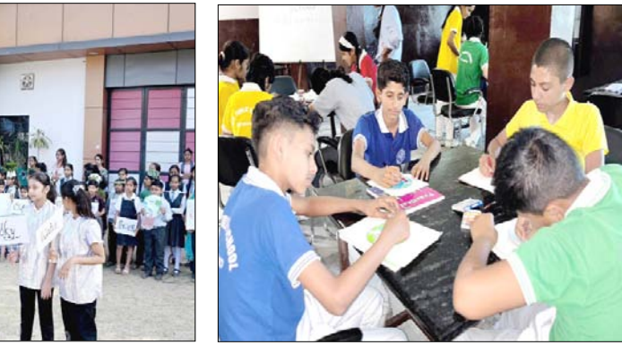
ने बताया कि कार्यक्रम का उद्देश्य छात्रों को पर्यावरण संरक्षण के प्रति जागरूक करना तथा पृथ्वी को स्वच्छ और हरा भरा बनाए रखने के लिए प्रेरित करना था। राजकीय माडल