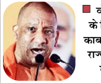
वोट का सही प्रयोग करें बंगाल के निवासी, बंगाल की पहचान काबा से नहीं, मां कालीबाड़ी से है राज्य की आर्थिक स्थिति पर भी मुख्यमंत्री ने उठाए सवाल

लखनऊ/कोलकाता, वार्ता पश्चिम बंगाल में चुनावी माहौल के बीच उत्तर प्रदेश के मुख्यमंत्री योगी आदित्यनाथ ने बुधवार को कोलकाता के जोरसांको में अपनी पहली जनसभा को संबोधित करते हुए तुम्हारे कांग्रेस और मुख्यमंत्री ममता बनर्जी पर तीखा हमला बोला। उन्होंने दावा किया कि 4 मई को चुनाव परिणाम आने पर राज्य में भाजपा का भगवा ध्वज लहराएगा। सभा में बड़ी संख्या में समर्थक योगी की बूलडोजर लाओं, हम तुम्हारे साथ हैं, लिखे पोस्टर लेकर पहुंचे थे। मुख्यमंत्री ने कहा कि 23 अप्रैल को होने वाले पहले चरण के मतदान में भाजपा करीब 80 प्रतिशत सीटें जीतने जा रही है और राज्य में