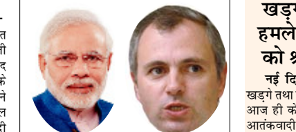
मोदी, शाह व उमर ने हमले में मारे गए निर्दोष लोगों को याद

नई दिल्ली, वार्ता प्रधानमंत्री नरेंद्र मोदी और गृहमंत्री अमित शाह ने पहलगांम आतंकवादी हमले की पहली बरसी पर उसमें प्राण गंवाने वाले लोगों को याद किया है और आतंकवाद के खिलाफ सरकार के दृढ़ संकल्प को दोहराया है। श्री मोदी ने अपने संवेदना संदेश में मंगलवार को कहा, 'पिछले साल इसी दिन पहलगांम में हुए भयावह आतंकवादी हमले में जान गंवाने वाले दुखी लोगों को कभी भुलाया नहीं जा सकेगा। इस दुख की घड़ी में मेरी संवेदनाएं पीड़ित परिवारों के साथ हैं। मोदी ने कहा कि एक राष्ट्र के रूप में, हम शोक की घड़ी में एकजुट हैं और दृढ़ संकल्प है। भारत आतंकवाद के किसी भी रूप के आगे कभी नहीं झुकेंगा। केंद्रीय गृह एवं सहकारिता मंत्री अमित शाह ने पहलगांम आतंकवादी हमले की पहली बरसी पर इस हमले के पीड़ितों को श्रद्धांजलि अर्पित करते हुए कहा कि अपने लोगों को खोने का दुख और पीड़ा आज भी हर भारतीय के दिल में है। उन्होंने सोशल मीडिया एक्स पर एक पोस्ट में कहा कि आज के दिन हम पिछले वर्ष पहलगांम के भयावह आतंकवादी हमले में खो चुके मासूम लोगों को श्रद्धापूर्वक याद करते हैं। अपने लोगों को खोने का दुख और पीड़ा आज भी हर भारतीय के दिल में है।