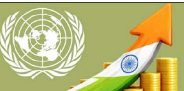
दर से बढ़ी। इसमें भारत की मजबूत वृद्धि का प्रमुख योगदान रहा। 2024 में इन अर्थव्यवस्थाओं की वृद्धि दर 5.2 फीसदी रही थी। इकनामिक एंड सोशल सर्वे ऑफ एशिया एंड द पैसिफिक-2026 शीर्षक वाली रिपोर्ट के मुताबिक, 2025 में भारतीय जीडीपी 7.4 फीसदी की मजबूत रफ्तार से बढ़ी। इसे मजबूत खपत (विशेष रूप से ग्रामीण अर्थव्यवस्था से मांग), जीएसटी दरों

पश्चिम एशिया संकट से उपजी वैश्विक अनिश्चितताओं के बावजूद भारतीय अर्थव्यवस्था इस साल 6.4 फीसदी की रफ्तार से बढ़ेगी। अगले साल यानी 2027 में वृद्धि की यह रफ्तार और बढ़कर 6.6 फीसदी पहुंच सकती है। संयुक्त राष्ट्र ने भारत की मजबूत आर्थिक बुनियाद पर भरोसा जताते हुए कहा कि आर्थिक वृद्धि के ये आंकड़े एशिया-प्रशांत क्षेत्र के एक प्रमुख चालक के रूप में देश की निरंतर मजबूत स्थिति को दर्शाते हैं। संयुक्त राष्ट्र आर्थिक एवं सामाजिक आयोग एशिया-प्रशांत (ईएससीएपी) ने सोमवार को जारी रिपोर्ट में कहा कि दक्षिण और दक्षिण-पश्चिम एशिया की अर्थव्यवस्थाएं 2025 में 5.4 फीसदी की