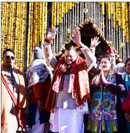
सीएम पुष्कर धामी बने साक्षी, पूजा-अर्चना कर प्रदेशवासियों के सुख, समृद्धि व कल्याण की कामना की, पीएम मोदी के नाम से प्रथम पूजा की अर्पित

इस पावन अवसर पर प्रदेश के मुख्यमंत्री पुष्कर सिंह धामी भी उपस्थित रहे और उन्होंने बाबा केदारनाथ के दर्शन कर प्रदेश एवं देश की सुख, समृद्धि और शांति की कामना की। सिख रेजीमेंट के बैंड की भक्तिमय धुनों के बीच कपाट उद्घाटन का यह दिव्य क्षण और भी आलौकिक बन गया। मुख्यमंत्री पुष्कर सिंह धामी ने समस्त देशवासियों को शुभकामनाएं देते हुए कहा कि केदारनाथ धाम न केवल सनातन धर्मालंबियों को आस्था का प्रमुख केंद्र है, बल्कि यह भारत की समृद्ध आध्यात्मिक और सांस्कृतिक विरासत का भी प्रतीक है। उन्होंने कहा कि चारधाम यात्रा हर वर्ष एक कीर्तिमान स्थापित कर रही है और इस वर्ष भी बाबा केदार के आशीर्वाद से यात्रा ऐतिहासिक होगी। उन्होंने कहा कि राज्य सरकार द्वारा चारधाम यात्रा को सुरक्षित, सुव्यवस्थित एवं सुगम