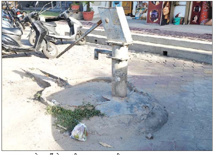
मुजफ्फरनगर: तेज गमी के बाद भी सूखा पड़ा सरकारी नला।