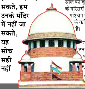
इसे सामाजिक सुधार के तहत सही ठहराया जा सकता है। अगर राज्य चाहे कि अन्य

नई दिल्ली। उच्चतम न्यायालय ने इस साल की शुरुआत में कोलकाता में आई-पैक के परिसरों पर ईडी की छापेमारी के दौरान पश्चिम बंगाल की मुख्यमंत्री ममता बनर्जी के कथित हस्तक्षेप पर कड़ी आपत्ति जताई है।