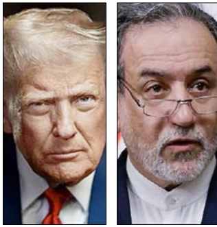
ईरान के भीतर गंभीर रूप से विभाजित स्थिति को देखते हुए यह कदम उठाया

व्हाइट हाउस द्वारा भारतीय समानुसार देर रात के बाद जारी बयान में कहा गया कि राष्ट्रपति ट्रंप ने पाकिस्तान के नेतृत्व की अपील पर ईरान पर नियोजित सैन्य हमलों को स्थगित करने और युद्धविराम को बढ़ाने पर सहमति व्यक्त की है। उन्होंने बताया कि ईरान के भीतर गंभीर रूप से विभाजित स्थिति को देखते हुए यह कदम उठाया गया है, जिससे ईरान की ओर से एकजुट बातचीत की स्थिति पर सवाल उठ रहे हैं। बयान के अनुसार, युद्धविराम बढ़ाने का अनुरोध पाकिस्तान के सेना प्रमुख आसिम मुनिर और प्रधानमंत्री शहबाज शरीफ ने किया था। अमेरिका ने कहा है कि जब तक