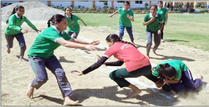
निहित, तनाव, चिंता आदि को दूर कर उनके अंदर अलग ही स्फूर्ति का संचार करता है, जिससे कि बच्चों का