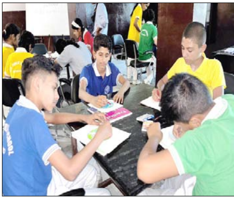
महाविद्यालय कपुरी गांवदेपुर रोवर्स रोजर्स और राष्ट्रीय सेवा योजना इकाई के संयुक्त तत्वावधान में विजय प्रतियोगिता हुई। इसमें पर्यावरण से जुड़े विभिन्न विषयों जैसे जलवायु