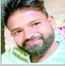
मृतक का फाइल फोटो।

शाह टाइम्स संवाददाता खतौली। गंगधाड़ी गांव में आत्मदाह की घटना में घायल युवक की इलाज के दौरान मौत हो जाने से पूरे क्षेत्र में शोक और तनाव का माहौल बन गया है। बुधवार को जैसे ही युवक का शव गांव पहुंचा, परिजनों में चीख-पुकार मच गई और माहौल बेहद गमगीन हो गया। हालात को देखते हुए प्रशासन ने गांव में भारी पुलिस बल तैनात कर दिया और अधिकारियों की निगरानी में कड़ी सुरक्षा के बीच अंतिम संस्कार कराया गया। जानकारी के अनुसार, गांव