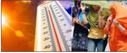
यूपी में अगले तीन दिनों तक भीषण हीटवेव! पेज 2

नई दिल्ली, मुजफ्फरनगर, देहरादून, हल्द्वानी, मुस्ताबाद, बरेली, मेरठ व लखनऊ से प्रकाशित