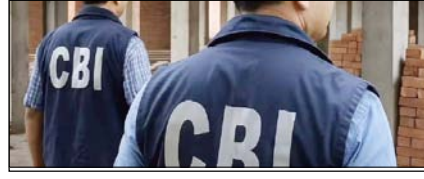
सीबीआई अधिकारियों को सजा संस्थागत भ्रष्टाचार पर सवाल सम्पादकीय