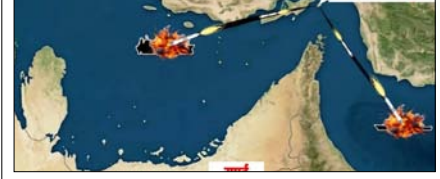
फारस की खाड़ी-होर्मुज स्ट्रेट में तेल रिसाव का खतरा पेज 12