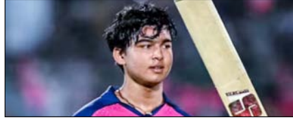
बैभव के सबसे तेज 500 आईपीएल रन खेल टाइम्स