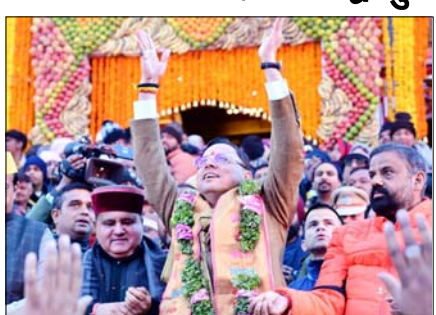
प्रधानमंत्री नरेंद्र मोदी के नाम से पहली महाभिषेक पूजा संपन्न कर देश एवं प्रदेश की

मुख्यमंत्री पुष्कर सिंह धामी ने कपाट उद्घाटन के शुभ अवसर पर