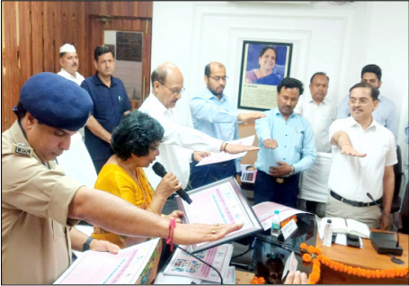
महिला जन-सुनवाई उपरांत

मुजफ्फरनगर। राष्ट्रीय महिला आयोग में पंजीकृत 48 प्रकरणों एवं अन्य उपस्थित प्रकरणों में जनसुनवाई कर नियमानुसार आवश्यक कार्यवाही करते हुए संबंधित अधिकारियों को निस्तारण सुनिश्चित करने हेतु निर्देशित किया गया। उक्त प्रकरणों में संबंधित अधिकारियों को अनुपालन आख्या आयोग को उपलब्ध कराने के निर्देश दिये गये। इसके साथ ही महिला जनसुनवाई हेतु उपस्थित महिलाओं/बालिकाओं को भारत सरकार एवं 3090 सरकार द्वारा संचालित विभिन्न कल्याणकारी योजनाओं-जैसे मुख्यमंत्री कन्या सुमंगला योजना, 3090 मुख्य बाल सेवा योजना, प्रधान मंत्री