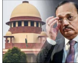
SIR लिस्ट से बाहर चुनाव अधिकारियों की याचिका पर कहा: इस बार वोट नहीं डाल पाएंगे

नई दिल्ली। सुप्रीम कोर्ट ने पश्चिम बंगाल विधानसभा चुनाव के पहले चरण में हुई रिकॉर्ड वोटिंग की तारीफ की। शुक्रवार को हुई सुनवाई के दौरान सीजेआई सुर्यकांत, जस्टिस जॉयमाल्या बागची और जस्टिस विपिन पंचोली की बेंच ने राज्य में चुनावी हिंसा न होने पर संतोष जताया। सीजेआई ने कहा कि भारत के नागरिक के रूप में, मुझे मतदान प्रतिशत देखकर बहुत खुशी हुई। जब लोग अपने मताधिकार का प्रयोग करते हैं, तो इससे लोकतांत्रिक व्यवस्था मजबूत होती है। सुप्रीम कोर्ट ने कहा कि जिनके नाम वोट लिस्ट से हटा दिए गए हैं, वे लोग समाधान के लिए कोर्ट को तर्फ से नियुक्त 19 अपीलीय ट्रिब्यूनलों से संपर्क करें। कोर्ट बंगाल में एसआईआर को चुनौती देने वाली याचिकाओं की सुनवाई कर रहा था। सुप्रीम कोर्ट ने चुनाव से पहले इस प्रक्रिया को रोकने से इन्कार कर दिया था। कोर्ट ने अपीलीय ट्रिब्यूनलों से कहा कि वे उन लोगों को पहले सुनवाई का मौका दें, जो वोट लिस्ट में नाम