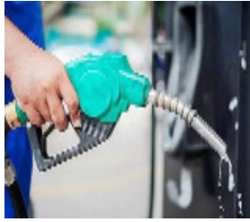
शाह टाइम्स ब्यूरो

लखनऊ। उत्तर प्रदेश के नेपाल सीमा से लगे जिलों में पेट्रोल और डीजल की मांग में अचानक आई तेजी ने प्रशासन और तेल कंपनियों की चिंता बढ़ा दी है। अधिकारियों का कहना है कि यह स्थिति किसी वास्तविक कमी के कारण नहीं, बल्कि अफवाहों, सख्त एंटी-होर्डिंग उपायों और सीमा पार कीमतों के अंतर के चलते पैदा हुई 'डिमॉंड डिस्टॉर्शन' है।