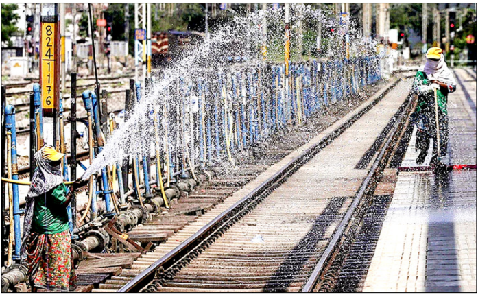
प्रयागराज। रेलवे स्टेशन पर भीषण गर्मी के बीच प्लेटफॉर्म पर पानी का छिड़काव करती रेलवे कर्मचारी।

गाजा युद्ध में प्रतिदिन औसतन 47 महिलाएं और लड़कियां मारी गईं: संरा न्यायक। गाजा पट्टी में अक्टूबर 2023 से दिसम्बर 2025 के बीच इजरायल की सैन्य कार्रवाई में 38000 से अधिक महिलाएं और लड़कियां मारी गई हैं, जो इस अवधि में प्रतिदिन औसतन 47 मौतों के बराबर हैं। संयुक्त राष्ट्र की एक रिपोर्ट में यह जानकारी दी गई। संयुक्त राष्ट्र महिला इकाई की रिपोर्ट गाजा में युद्ध की क्रांति: महिलाएं और लड़कियां में कहा