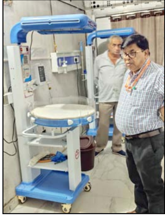
पर उन्होंने हॉस्पिटल को नोटिस जारी किया। उन्होंने बताया कि अभियान चलाकर अवैध रूप से संचालित हॉस्पिटलों के खिलाफ कार्रवाई की जाएगी।