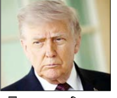
कहा: समय निकलता जा रहा है और नाकेबंदी 'और भी बढ़त' होगी

वनी देते हुए कहा कि घड़ी की सुई टिक-टिक कर रही है और यह नाकेबंदी तक और भी बढ़त होती जाएगी, जब तक कि कोई ऐसा समझौता नहीं हो जाता जो अमेरिका और उसके सहयोगियों के लिए फायदेमंद हो। ट्रंप ने अपने सोशल मीडिया प्लेटफॉर्म पर कहा कि समय उनके पक्ष में नहीं है। यह नाकेबंदी पूरी तरह से अंधेरा और मजबूत है और अब यहां से स्थिति और भी खराब होती जाएगी। कोई भी समझौता तभी किया जाएगा, जब वह अमेरिका, उसके सहयोगियों और बाकी दुनिया के लिए उचित और हितकारी होगा। अमेरिकी मीडिया पर एक बार फिर निशाना साधते हुए राष्ट्रपति ट्रंप ने कहा कि न्यूयॉर्क टाइम्स और सीएनएन जैसे मीडिया संस्थानों को लगता है, मैं ईरान के साथ युद्ध खत्म करने के लिए