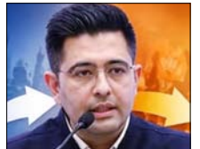
सात सांसदों ने राज्यसभा के सभापति को सौंपे दस्तावेज

नई दिल्ली। आम आदमी पार्टी के नेता और राज्यसभा सांसद राघव चड्ढा ने शुक्रवार को पार्टी से इस्तीफा दे दिया। इसके साथ ही वो भाजपा में शामिल हो गए। राघव के अलावा संदीप पाठक, अशोक मित्तल, हरभजन सिंह, विक्रजित सिंह साहनी, राजेंद्र गुप्ता के अलावा दिल्ली से आप की राज्यसभा सांसद स्वाति मालिवाल भी भाजपा में शामिल हो गईं। राघव ने एकस पर जानकारी देते हुए लिखा, आज संविधान के प्रावधानों के तहत यह बड़ा राजनीतिक घटनाक्रम हुआ। आम आदमी पार्टी के दो-तिहाई से अधिक राज्यसभा सांसद भाजपा में शामिल हो गए। कुल सात सांसदों ने इस विलय संबंधी दस्तावेज पर हस्ताक्षर किए। इन