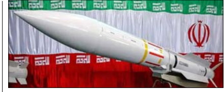
ईरान जंग में खर्च हुई चीन के लिए रिजर्व अमेरिकी मिसाइलें