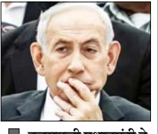
इजरायली प्रधानमंत्री ने कब और कैसे कराया अपना इलाज, खुद ही किया इसका खुलासा

नेल अवीवा। इजरायल के प्रधानमंत्री बेंजामिन नेतन्याहू के स्वास्थ्य को लेकर एक बहुत बड़ी खबर सामने आई है। लंबे समय से चल रही अटकलों पर विराम लगाते हुए इजरायली प्रधानमंत्री ने खुद इस बात का आधिकारिक खुलासा किया है कि वे कैसर जैसी गंभीर बीमारी से पीड़ित रहे हैं। नेतन्याहू ने बताया है कि उन्हें शुरुआती चरण का प्रोस्टेट कैंसर था, जिसका उन्होंने समय रहते इलाज करवा लिया है। अपनी सालाना मेडिकल रिपोर्ट सार्वजनिक होने के बाद नेतन्याहू ने शुक्रवार को सोशल मीडिया प्लेटफॉर्म एक्स पर यह अहम जानकारी दी। उन्होंने देश और