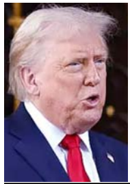
हेरिस की डेमोक्रेटिक पार्टी के पास 47 हैं। ट्रम्प की रिपब्लिकन पार्टी के ही लगभग 10 सांसद ईरान युद्ध के विरोध में आवाज उठा चुके हैं।

अमेरिकी राष्ट्रपति ट्रम्प के पास जंग जारी रखने के लिए 7 दिन हैं। अमेरिकी संविधान के अनुसार, किसी भी युद्ध को 60 दिन में संसद की मंजूरी लेनी पड़ती है। यहाँ भी ट्रम्प ने खेल किया। युद्ध 28 फरवरी को छेड़ा, संसद को 2 मार्च को सूचित किया। अब एक मई से पहले उन्हें संसद से युद्ध को मंजूरी लेनी है। रिपोर्ट्स के मुताबिक ट्रम्प संसद का सामना नहीं करना चाहते हैं। 100 सदस्यों वाली सीनेट में ट्रम्प के 53 सांसद हैं। जबकि विपक्षी कमला