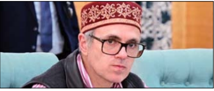
कश्मीर को राज्य का दर्जा न देना 'सजा' के समान : उमर अब्दुल्ला

नई दिल्ली, मुजफ्फरनगर, देहरादून, हल्द्वारी, मुरादाबाद, बरेली, मेरठ व लखनऊ से प्रकाशित