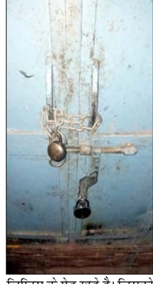
लिप्टिस के पेड़ खड़े हैं। जिसको काटकर पैसे की मांग करते हैं। जिसका पुजारी करता है। पुजारी का कहना है कि मंदिर की