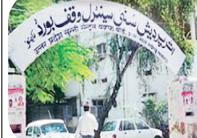
सबसे ज्यादा लखनऊ में खारिज हुए, बिजनौर सहारनपुर, बाराबंकी, अमरोहा व बागपत में कम मामलों सामने आए

अधिकारियों के अनुसार यह कार्रवाई मुख्य रूप से डाटा एंटी में त्रुटियों और अधूरे दस्तावेजों के कारण की गई है। सूचों की मांगों तो खारिज की गई सूचों के अनुसार सबसे अधिक पंजीकरण लखनऊ (1,114) में खारिज हुए हैं। इसके बाद बिजनौर (1,003) और सहारनपुर (990) का स्थान है। अन्य जिलों में बाराबंकी