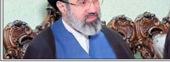
दुश्मन के मीडिया अभियान, ईरानी लोगों को भड़काने और राष्ट्रीय एकता को कमजोर करने की कोशिश कर रहे हैं: मोजतबा खामेनेई

सर्वोच्च नेता ने देशवासियों से चौकन्ना रहने की अपील की, ईरानी जनता की मजबूत एकता की तारीफ