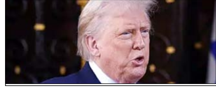
प्रेसिडेंट ट्रंप का गोल्ड कार्ड वीजा हुआ फ्लॉप