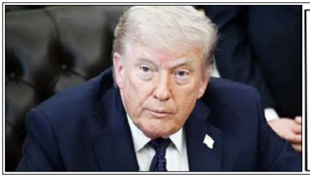
ट्रम्प ने फरवरी, 2025 में 'गोल्ड कार्ड' वीजा प्रोग्राम शुरू करने का ऐलान किया था, उस वक़्त उन्होंने इसकी कीमत पांच मिलियन डॉलर रखी थी अब अमेरिका सिर्फ टैलेंटड लोगों को ही वीजा देगा, न कि ऐसे लोगों को जो अमेरिकियों की नौकरियां छीन सकते हैं

अब तक सिर्फ एक व्यक्ति ने ही हासिल किया, 1300 आवेदन बेचे जाने का किया था सरकार ने दावा ब्रिटेन ने जंग में साथ नहीं दिया, ट्रम्प नाराज