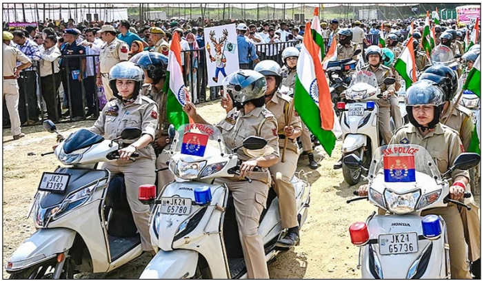
जम्मू-कश्मीर। सांबा में 'नशा मुक्त-जम्मू-कश्मीर' अभियान के दौरान जम्मू-कश्मीर पुलिस के जवान।