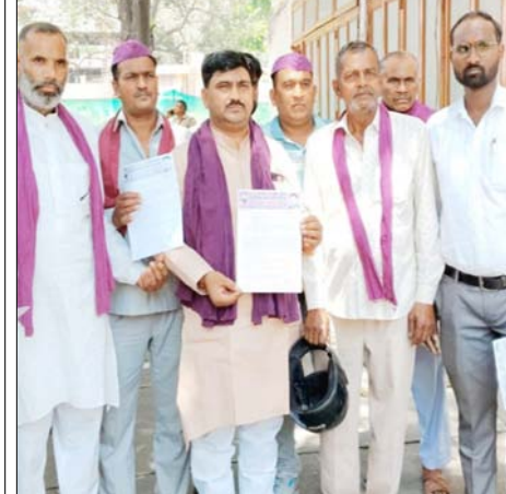
सामाजिक न्याय पार्टी के कार्यकर्ता ज्ञापन देते हुए।