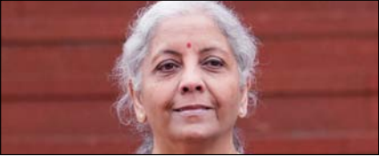
देश के शेयर बाजार का सफर लम्बा, उपलब्धियां विश्वस्तरीय : निर्मला सीतारमण

नई दिल्ली, मुजफ्फरनगर, देहरादून, हल्द्वारी, मुतादाबाद, बरेली, मेरठ व लखनऊ से प्रकाशित