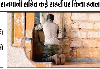
सुबह-सुबह भारी गोलाबारी और लगातार धमाकों की आवाजें सुनीं। माली सेना ने एक आधिकारिक बयान जारी कर कहा कि सशस्त्र सशस्त्र समूहों के हमलों का सामना कर रहा है। इससे पहले 2024 में भी काटी और सेनो हवाई अड्डा क्षेत्र को इसी तरह निशाना बनाया गया था। वर्तमान में देश अंतरिम राष्ट्रपति जनरल असोमी गोडता के नेतृत्व में है, जिन्होंने मई 2021 में सत्ता संभाली थी।

मुख्य हवाई अड्डा और काटी में रक्षा मंत्री का आवास इन हमलों के प्रमुख लक्ष्य बने। बमको में गोलाबारी जारी है। हम जनता से शांत रहने और सतर्क रहने का