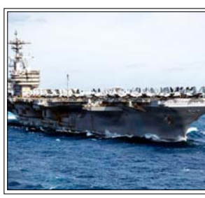
अमेरिकी अधिकारियों ने इस कार्रवाई को व्यापक समुद्री अभियान का हिस्सा बताया

फ्लोरिडा (अमेरिका)। अमेरिकी सेंट्रल कमांड (सेंटकॉम) ने पुष्टि की है कि अमेरिकी नौसेना के गाइडेड-मिसाइल डिस्ट्रिक्ट यूएसएस राफेल पेराल्टा (डीडीजी 115) ने एक ईरानी झंडे वाले जहाज को समुद्र में रोक दिया है। यह कार्रवाई एक विशेष समुद्री मिशन के तहत की गई, जिससे अंतर्राष्ट्रीय स्तर पर तनाव एक बार फिर बढ़ गया है। अमेरिकी नौसेना के अनुसार, 24 अप्रैल को इस जहाज की गतिविधियों पर नजर रखी जा रही थी। रिपोर्ट में दावा किया गया कि यह जहाज ईरान के बंदरगाह की ओर जा रहा था, जिसके बाद उसे रोकने का निर्णय लिया गया। इसके बाद अमेरिकी युद्धपोत ने तुरंत कार्रवाई करते हुए जहाज को रोका और बॉर्डिंग के जरिए उसकी जांच शुरू की। अमेरिकी अधिकारियों ने इस कार्रवाई को व्यापक समुद्री अभियान का हिस्सा बताया है। शुक्रवार को पेंटागन में हुई ब्रीफिंग के दौरान जाइंट चीफ्स ऑफ स्टयफ के चेयरमैन जनरल डैन केन ने कहा कि अमेरिका ईरान के खिलाफ सख्त समुद्री नाकाबंदी नीति लागू कर रहा है। उन्होंने कहा कि अमेरिकी सेना किसी भी स्थिति में