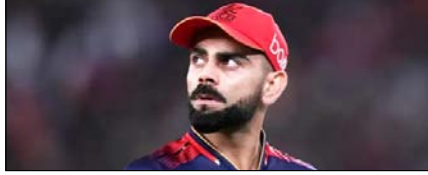
ऑरेंज कैप टेबल में शीर्ष पर पहुंचे कोहली