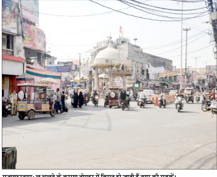
मुजफ्फरनगर: लू चलने के कारण दोपहर में विरान हो जाती हैं नगर की सड़कें।