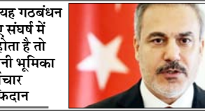
यदि यह गठबंधन किसी नए संघर्ष में शामिल होता है तो तुर्की अपनी भूमिका पर पुनर्विचार करेगा: फिदान

लंदन। तुर्की ने संकेत दिया है कि ईरान और अमेरिका के बीच समझौता होने की स्थिति में वह होर्मुज जलडमरूमध्य में बारूदी सुरंग हटाने के अभियानों में भाग ले सकता है। तुर्की के विदेश मंत्री हकन फिदान ने यहां कहा कि किसी भी संभावित अभियान का नेतृत्व बहुराष्ट्रीय तकनीकी गठबंधन द्वारा किया जाएगा और ऐसे ढांचे के तहत तुर्की को भागीदारी में कोई आपत्ति नहीं होगी। उन्होंने यह भी कहा कि यदि यह गठबंधन किसी नए संघर्ष में शामिल होता है तो तुर्की अपनी भूमिका पर पुनर्विचार करेगा। साथ ही उन्होंने उम्मीद जताई कि ईरान के परमाणु कार्यक्रम से जुड़े मुद्दों का समाधान