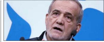
दबाव में युद्धविराम पर वार्ता नहीं करेगा तेहरान: पेजेशिकयन पृष्ठ 12