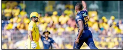
चेन्नई सुपर किंग्स को हराकर गुजरात टाइटंस ने चौथी जीत दर्ज की खेल टाइम्स