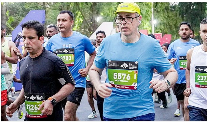
बेगलुरु। टीसीएस वर्ल्ड 10 किलोमीटर मैराथन में भाग लेते जम्मू-कश्मीर के सीएम उमर अब्दुल्ला।