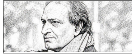
मानवीय संवेदना का इतिहासकार फोटोग्राफर रघु राय सम्पादकीय