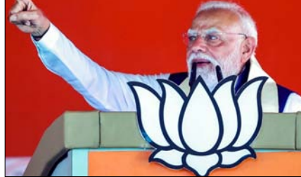
पीएम का आरोप : टीएमसी शासन में छोटे-छोटे नेता और गुंडे खुद को सरकार समझने लगे

पीएम नरेंद्र मोदी ने रविवार को पश्चिम बंगाल के नार्थ 24 परगना जिले के बनगांव और हुगली के हरिपाल में रेली की। उन्होंने बनगांव में कहा कि पहले फेज के मतदान में टीएमसी का घमंड टूट चुका है। दूसरे चरण में भाजपा की जीत तय होती दिख रही है। उन्होंने कोलकाता में रोड शो भी किया। पीएम ने आरोप लगाया कि टीएमसी शासन में छोटे-छोटे नेता और गुंडे खुद को सरकार समझने लगे हैं। 15 साल पहले टीएमसी 'मां, माटी, मानुष' का नारा देकर सत्ता में आई थी, आज वे इन शब्दों को बोल भी नहीं पाते। अगर बोलेंगे, तो इनके पाप सामने आ जाएंगे। टीएमसी के राज में