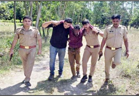
व्यक्ति आता दिखाई दिया तो पुलिस ने उसे संदिग्ध मानते हुए रुकने का इशारा किया मगर बाइक सवार व्यक्ति नहीं रुका और पुलिस को छोड़कर मोटरसाइकिल