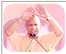
60,244 आरक्षी नागरिक पुलिस सीधी भर्ती के अंतर्गत दीक्षांत परेड समारोह को संबोधित करते हुए बोले मुख्यमंत्री

प्रशिक्षण में जितना पसीना बहना, बाद के जीवन में उतना ही कम खुन बहाने की नीवत आती है। योगी रविवार को 60,244 आरक्षी नागरिक पुलिस सीधी भर्ती के अंतर्गत वर्ष 2025 बैच के पुलिस आरक्षियों को दीक्षांत परेड समारोह