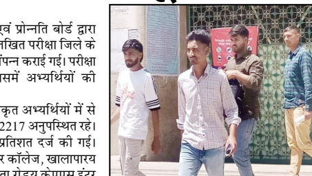
पिलखनीय जैन कॉलेज, प्रद्युमन नगरय महाराज सिंह महाविद्यालयय खेमका गर्ल्स कॉलेजय राजकीय इंटर कॉलेज, कमेला रोडय एसवीवीए इंटर कॉलेजय एसडी इंटर कॉलेजय एसएमए इंटर कॉलेजय सावित्रीबाई फुले महिला पॉलिटेक्निक तथा दिगंबर जैन कन्या इंटर कॉलेज शामिल रहे। इसी तरह द्वितीय पाली में कुल 9840 अभ्यर्थियों में से 7769 उपस्थित रहे, जबकि 2071 अनुपस्थित रहे। इस पाली में उपस्थिति प्रतिशत 78.95 रहा, जो पहली पाली से

शाह टाइम्स ब्यूरो सहारनपुर। उप पुलिस भर्ती एवं प्रोन्नति बोर्ड द्वारा होमगार्ड्स एनरोलमेंट-2025 की लिखित परीक्षा जिले के विभिन्न परीक्षा केंद्रों पर शांतिपूर्वक संपन्न कराई गई। परीक्षा दो पालियों में आयोजित हुई, जिसमें अभ्यर्थियों की उपस्थिति संतोषजनक रही। प्रथम पाली में कुल 9840 पंजीकृत अभ्यर्थियों में से 7623 अभ्यर्थी उपस्थित रहे, जबकि 2217 अनुपस्थित रहे। इस प्रकार कुल उपस्थिति 77.47 प्रतिशत दर्ज की गई। प्रमुख परीक्षा केंद्रों में आर्य कन्या इंटर कॉलेज, खालापार पीडी बाजारिया इंटर कॉलेज, चकलासा रोडय केएस इंटर कॉलेज, मिशन कंपाउंडय गिरी शंकर इंद्रपाल सिंह इंटर कॉलेजय राजकीय कन्या इंटर कॉलेज, लिंक रोडय राजकीय इंटर कॉलेज, कैलाशपुरय राजकीय इंटर कॉलेज, नेहरू मार्केटय गुरु नानक कन्या इंटर कॉलेज, गांधी पार्कय गुरु नानक इंटर कॉलेज, अंबाला रोडय एचवी इंटर कॉलेज, भाटागढय इंस्टिट्यूट मुस्लिम गर्ल्स इंटर कॉलेजय इस्तामिया इंटर कॉलेजय जेवी जैन इंटर कॉलेजय हिन्दू कन्या इंटर कॉलेज, रायवालाय जनता इंटर कॉलेज,