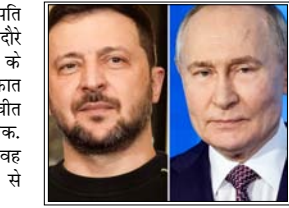
यूक्रेन के लिए यह बहुत जरूरी है कि रूस इस गलत युद्ध को खत्म करने की ताकत पाए

50 माह से जारी जंग के बीच रूस-यूक्रेन में सुलह के प्रयास तेज मास्को/कीव। यूक्रेन के राष्ट्रपति वोलोदिमिर जेलेंस्की अजरबैजान के दौर पर हैं, जहां उन्होंने अजरबैजान के राष्ट्रपति इल्हाम अलीयेव से मुलाकात की और ऊर्जा सुरक्षा को लेकर बातचीत की। राष्ट्रपति जेलेंस्की ने दक्षिण काकेशस के अपने पहले दौर पर कहा कि वह अजरबैजान में व्लादिमीर पुतिन से मिलने के लिए तैयार हैं। बता दें कि बीते कुछ समय से रूस और यूक्रेन के बीच सुलह कराने के लिए अमेरिकी की मध्यस्थता में बातचीत हो रही थी, लेकिन हाल फिलहाल में ईरान के साथ तनाव के बीच यह रुकी हुई है। पिछले कुछ हफ्तों में अमेरिका की अगुवाई वाली कूटनीतिक बातचीत रुकने के बाद जेलेंस्की का यह बयान सामने आया है। राष्ट्रपति वोलोदिमिर