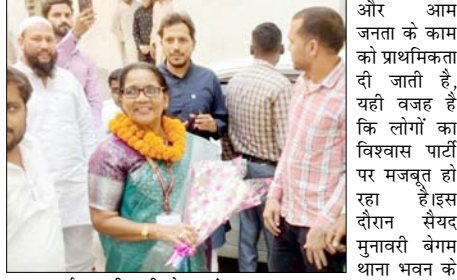
द्वारा चलाई जा रही सभी योजनाएं हर वर्ग के लिए समान रूप से हैं, न कि किसी एक समुदाय विशेष के लिए। भाजपा में कार्यकर्ताओं