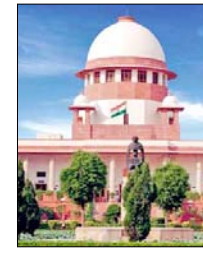
कहा: किसी भी आरोपी को अग्रिम जमानत याचिका को खारिज करना अदालत का अधिकार

नई दिल्ली। सुप्रीम कोर्ट ने अग्रिम जमानत और अदालती क्षेत्राधिकार को लेकर महत्वपूर्ण टिप्पणी की है। सुप्रीम कोर्ट ने कहा है कि किसी भी आरोपी को अग्रिम जमानत याचिका को खारिज करना अदालत का अधिकार है। हालांकि, याचिका खारिज करते समय अदालत के पास यह शक्ति नहीं है कि वह आरोपी को संबोधित ट्रायल कोर्ट के सामने आत्मसमर्पण करने का निर्देश दे। जस्टिस जेबी पारदीवाला और जस्टिस उज्ज्वल मुखर्जी की खंडपीठ ने एक मामले की सुनवाई के दौरान यह टिप्पणी की। यह मामला धोखाधड़ी और जालसाजी के आरोपी एक व्यक्ति की ओर से दायर की गई विशेष अनुमति याचिका से जुड़ा था। पीठ ने सुनवाई के दौरान न्यायिक सीमाओं के बारे में बात की। सुप्रीम कोर्ट ने कहा कि यदि अदालत अग्रिम जमानत खारिज करना चाहती है, तो वह ऐसा कर सकती है। लेकिन अदालत के पास यह कहने का कोई कानूनी अधिकार नहीं है कि याचिकाकर्ता अनिवार्य रूप से सरेंडर करे। यह पूरा मामला