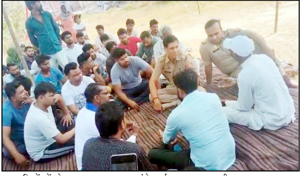
अनुयायियों में रोष पनप गया। गुस्साए लोगों ने गांव में ही धरना प्रदर्शन कर आरोपियों को पहचान कर गिरफ्तारी की मांग की। जानकारी मिलते ही घटनास्थल