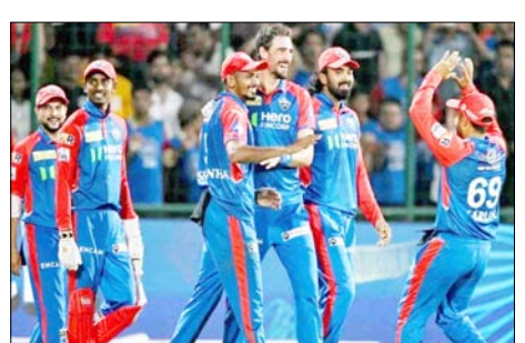
नाबाद पारी खेलने वाले- जो आईपीएल के इतिहास में किसी भी भारतीय खिलाड़ी का अब तक का सबसे बड़ा व्यक्तिगत स्कोर है, राहुल दिल्ली की बल्लेबाजी की रीढ़ बनकर उभरे हैं। उन्होंने इस सीजन में कई मैचों में अकेले दम पर टीम को जीत दिलाई है। सात पारियों में 357 रन और एक बेहतरीन स्ट्राइक रेट के

इस मुकाबले में सभी की निगाहें पूरी तरह से केएल राहुल पर टिकी हैं, जिनकी रिकॉर्ड तोड़ फॉर्म इस टूर्नामेंट की सबसे बड़ी चर्चा का विषय रही है। पंजाब के खिलाफ 152 रनों की शानदार