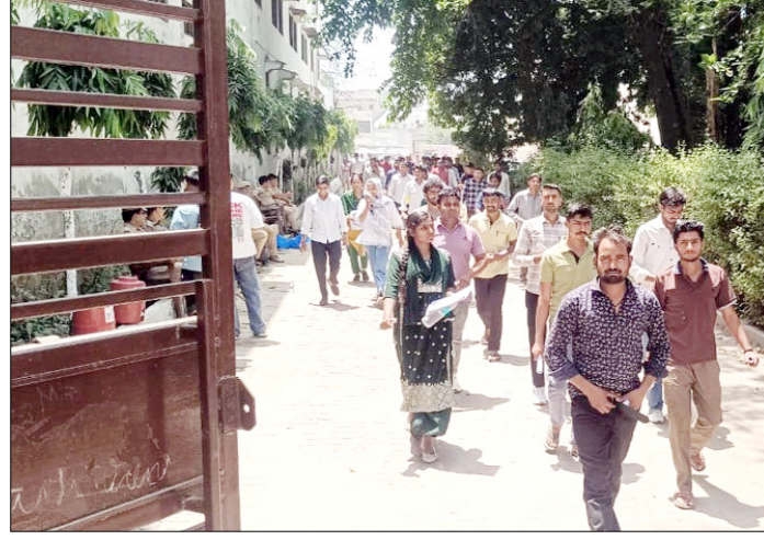
मुजफ्फरनगर: होमगार्ड परीक्षा का एग्जाम देकर कॉलेज परिसर से बाहर आते अभ्यर्थी।