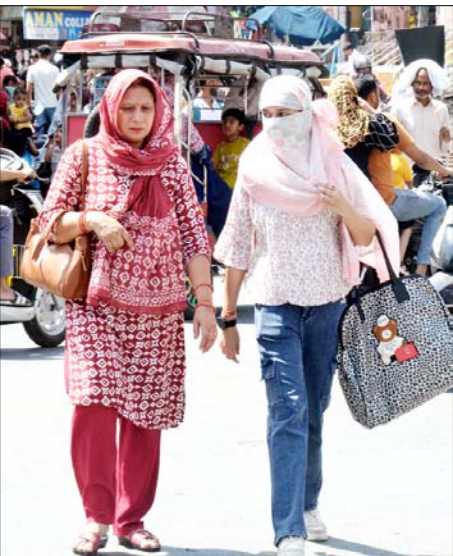
मुजफ्फरनगर: तेज धूप में अपने गंतव्य की ओर जाती महिलाएं।