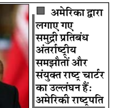
अमेरिका द्वारा लगाए गए समुद्री प्रतिबंध अंतर्राष्ट्रीय समझौतों और संयुक्त राष्ट्र चार्टर का उल्लंघन हैं: अमेरिकी राष्ट्रपति

और आर्थिक दबाव का दौर जारी है। इसके बावजूद अमेरिका और ईरान लगातार ऐसे संकेत दे रहे हैं, जो बातचीत को मज पर लौटने की उनकी इच्छा को बताता है। यूरोशिया रिब्यू में प्रकाशित कालिन्स्कोव यू केट के एक लेख में तर्क दिया गया है कि युद्ध के मैदान की बदलती हकीकत और कूटनीतिक पैरेन्जाजी दोनों पक्षों को समझौते की ओर धकेल रही हैं। वर्तमान परिस्थितियों लंबे संघर्ष के बजाय बातचीत के जरिए समाधान निकालने के पक्ष में बनती दिख रही हैं। रिपोर्ट के अनुसार, ईरान ने बातचीत में एक बेहद नयी-तुली रणनीति अपनाई है। वह समय और नियंत्रित तनाव को एक हथियार के रूप में इस्तेमाल कर रहा है ताकि अपनी बहुत बरकरार रख सके। ईरान अपने रणनीतिक लाभ से समझौता किए बिना बातचीत के रास्ते खुले रखना चाहता है। दूसरी ओर, अमेरिका लगातार सैन्य और आर्थिक दबाव के जरिए ईरान की सोदेबाजी की शक्ति को कमजोर करने की कोशिश कर रहा है।