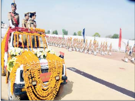
को जानकारी देते हुए इसे आधुनिक सुविधाओं से सुसज्जित बनाने की बात कही। समारोह में जनसेवा, सुरक्षा और कर्तव्यनिष्ठा के मूल्यों को प्रमुखता से रेखांकित किया गया, जिससे नवआरक्षियों को अपने दायित्वों के प्रति प्रेरणा मिली।