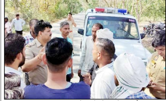
शाह टाइम्स संवाददाता रामपुर मनिहारान। थानाक्षेत्र के एक गांव में एक युवती का शव उसके घर में फंदे पर लटका मिलने से सनसनी फैल गई। घटना की सूचना मिलने पर पुलिस मौके पर पहुंची और फॉरेंसिक टीम को भी बुलाया गया। पुलिस ने शव को पोस्टमार्टम के लिए भेज दिया है।