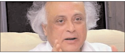
इजरायल पर भारत के रुख को नहीं मिला समर्थन: कांग्रेस

नई दिल्ली, मुजफ्फरनगर, देहरादून, हल्द्वानी, मुगदाबाद, बरेली, मेरठ व लखनऊ से प्रकाशित