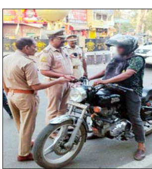
अभियान चलाते हुए 225 वाहनों के चालान किये। पुलिस का उद्देश्य था कि ध्वनि प्रदूषण पर