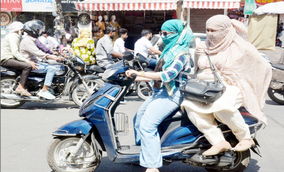
मुजफ्फरनगर: तपती धूप से बचने के लिए खुद को ढककर निकलती स्कूटी सवार महिलाएं।