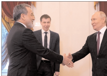
रूसी राष्ट्रपति बोले: ईरान अपनी आजादी के लिए लड़ रहा, टुम्प के अफसरों के साथ बैठक करेंगे

तेहरान/मास्को। ईरान के विदेश मंत्री अब्बास अराघची ने सोमवार को रूसी राष्ट्रपति व्लादिमीर पुतिन से मुलाकात की। बैठक में रूस ने ईरान के प्रति खुला समर्थन जताया। रूसी मीडिया के मुताबिक, पुतिन ने कहा कि ईरानी जनता साहस और वीरता के साथ अपनी आजादी और संप्रभुता के लिए लड़ रही है। उन्होंने यह भी कहा कि उन्हें ईरान के सुप्रीम लीडर मुज्तबा खामेनेई का संदेश मिला है। अराघची की यह यात्रा ऐसे समय हुई है, जब अमेरिका और ईरान के बीच हालिया बातचीत किसी नतीजे पर नहीं पहुंच सकी। ऐसे में ईरान रूस का समर्थन मजबूत करने