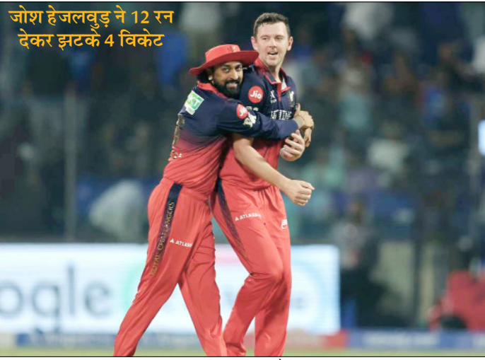
जोश हेजलवुड ने 12 रन देकर इटके 4 विकेट लिए। जवाब में बेंगलुरु ने 2 ओवर में बिना विकेट खोए 13 रन बना लिए हैं। जैकब बेथेल और विराट कोहली क्रमिक पर हैं। तीसरे ओवर में जैकब बेथेल ने लगातार दो सिक्स लगा दिए। उन्होंने शार्ट गेंद पर शानदार तरीके से पिकअप शाट खेलकर मिडविकेट के ऊपर छक्का जड़ा। अगली बाल में

दिल्ली को बेंगलुरु ने 75 रनों पर समेटा बेंगलुरु ने 6.3 ओवर में हासिल किया लक्ष्य