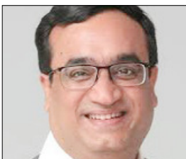
आप 'अरबपतियों की पार्टी': अजय माकन

कांग्रेस पार्टी के राष्ट्रीय कोषाध्यक्ष अजय माकन ने पंजाब के हालात को लेकर गंभीर चिंता जताते हुए कहा है कि पंजाब में अलगाववादी ताकतें एक बार फिर सिर उठाने लगी हैं। माकन ने सोमवार को एक संबोधन में आरोप लगाया कि देश को सरहद की रक्षा करने वाले अहम राज्य पंजाब में गैंगवार, ड्रोन के जरिए ड्रग्स की सप्लाई और बढ़ता अपराध 1980 के दशक जैसे हालात की ओर इशारा कर रहे हैं।