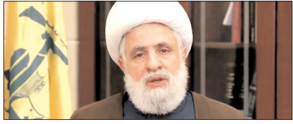
इजरायल के साथ सीधी बातचीत की संभावना नहीं: हिजबुल्लाह