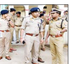
किया गया। निरीक्षण के दौरान द्वारा शाखाओं में नियुक्त अधिकारी/कर्मचारियों से वार्ता कर उनके कार्यों की जानकारी की। तथा सभी अधिकारी/कर्मचारियों को समय से कार्यालय में उपस्थित होकर पूर्ण मनोयोग से कार्य करने तथा कार्यालय रिपोर्ट को दुरुस्त रखने हेतु निर्देशित किया गया।

इस दौरान डीआईजी को सलामी दी गयी और उन्होंने पुलिस कार्यालय स्थित आगुन्तक कक्ष का निरीक्षण कर प्रतिदिन आने वाली शिकायतों एवं उनके निस्तारण की स्थिति के बारे में जानकारी की। इसके बाद प्रधान लिपिक शाखा, आर्थिक शाखा, आई.जी.आर. एस. कार्यालय, जन शिकायत प्रकोष्ठ, महिला सम्मान प्रकोष्ठ, पेशी कार्यालय वरिष्ठ पुलिस अधीक्षक, रिपोर्ट रूम, पत्रावली शाखा, डीसीआरबी शाखा, विशेष जांच प्रकोष्ठ शाखा, रिट सेल, मानवाधिकार शाखा, पासपोर्ट शाखा, स्थानीय अभिसूचना इकाई कार्यालय आदि शाखाओं तथा पुलिस कार्यालय में बने कैफे, शौचालय आदि का निरीक्षण किया गया। निरीक्षण के दौरान द्वारा शाखाओं में नियुक्त अधिकारी/कर्मचारियों से वार्ता कर उनके कार्यों की जानकारी की। तथा सभी अधिकारी/कर्मचारियों को समय से कार्यालय में उपस्थित होकर पूर्ण मनोयोग से कार्य करने तथा कार्यालय रिपोर्ट को दुरुस्त रखने हेतु निर्देशित किया गया।