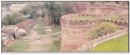
अब बदलाव की प्रयोगशाला बनने को तैयार है मप्र का धार सम्पादकीय