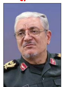
कोई टोस नतीजा नहीं निकला है। इस बीच ईरान पहली बार होर्मुज स्ट्रेट खोलने