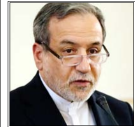
हालिया घटनाक्रमों ने दोनों देशों के संबंधों की शक्ति को प्रमाणित किया है: अराघची

कहा: क्षेत्रीय उथल-पुथल ने दोनों देशों के द्विपक्षीय संबंधों की मजबूती को उजागर किया