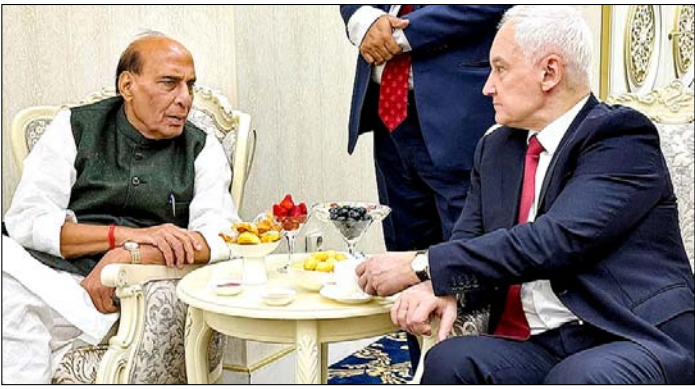
किर्गिस्तान। विश्वकेक में दक्षिण अफ्रीकी रक्षा मंत्री संघ (एससीओ) की बैठक के दौरान अपने रूसी समकक्ष एंड्री बेलोसोव के साथ रक्षा मंत्री राजनाथ सिंह।