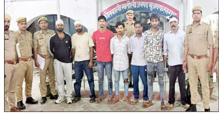
पुलिस अधिकारियों का कहना है कि गांव में शांति व्यवस्था बनाए रखने के लिए अतिरिक्त पुलिस बल तैनात कर दिया गया है और पूरे मामले की गहराई से जांच की जा रही है।