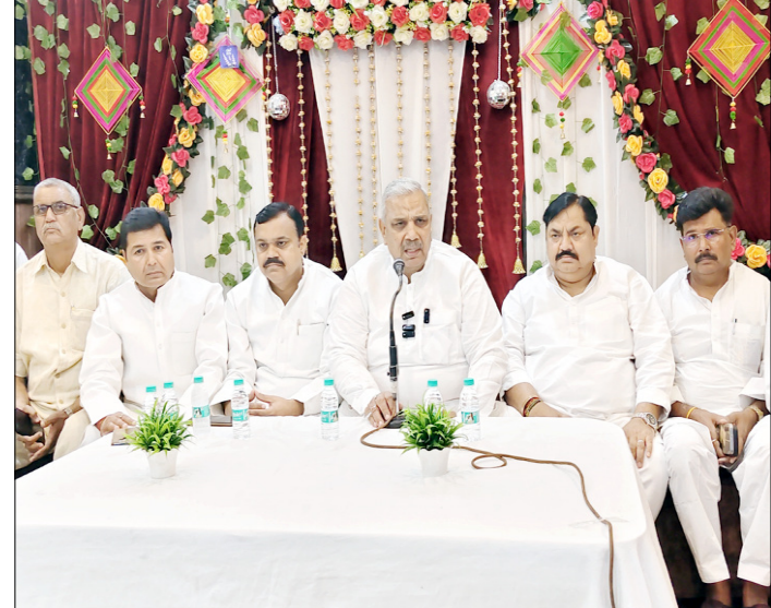
मुजफ्फरनगर: पत्रकारों से पार्टी की नीतियों को साझा करते सपा सांसद एवं अन्य नेता।