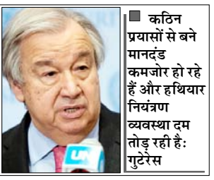
कठिन प्रयासों से बने मानदंड कमजोर हो रहे हैं और हथियार निर्यात व्यवस्था दम तोड़ रही है: गुटेरेस

न्यूयॉर्क। संयुक्त राष्ट्र महासचिव एंटोनियो गुटेरेस ने चेतावनी दी है कि वैश्विक स्तर पर परमाणु प्रसार तेज हो रहा है, जिससे नये परमाणु हथियारों की दौड़ का खतरा बढ़ता जा रहा है। गुटेरेस ने संयुक्त राष्ट्र मुख्यालय में परमाणु अप्रसार संधि (एनपीटी) के सदस्य देशों की बैठक के उद्घाटन सत्र को संबोधित करते हुए कहा कि यह ऐतिहासिक संधि कमजोर पड़ रही है, क्योंकि सदस्य देशों की प्रतिबद्धताएं पूरी नहीं हो रही हैं और वैश्विक भरोसा लगातार घट रहा है। उन्होंने कहा कि संधि कमजोर हो रही है, वचन पूरे नहीं हुए हैं, विश्वास और विश्वसनीयता क्षीण हो रही है तथा परमाणु प्रसार की प्रवृत्तियां तेज हो रही हैं। गुटेरेस ने कहा कि दुनिया परमाणु हथियारों के खतरों को 'सामूहिक रूप से' भूल रही है, जबकि