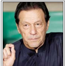
चौथी बार हुई सर्जरी इमरान खान की दाहिनी आंख में सेंट्रल रेटिनल वेन आक्वयूयूजन यानी सीआरवीओ नाम की बीमारी

चला था। इससे पहले इमरान खान को 24 जनवरी को पहला इंजेक्शन लगाया गया था। इसके बाद 24 फरवरी को उन्हें दूसरी खुराक दी गई और 23 मार्च को तीसरा इंजेक्शन लगाया गया। डाक्टरों ने बताया कि उनके ताजा टेस्ट में सुधार देखा गया है। यह प्रक्रिया एक डे कैंसर सर्जरी की तरह थी जिसके बाद उन्हें जरूरी सुझावों के साथ अस्पताल से छुट्टी दे दी गई। पीटीआई के अध्यक्ष बैरिस्टर गोहर अली खान ने सोशल मीडिया पर इमरान खान के अस्पताल जाने की पुष्टि की है। उन्होंने कहा कि इमरान खान को रात में इंजेक्शन और मॉडिकल चेकअप के लिए पिम्स ले जाया गया था। हालांकि उन्होंने सरकार के रवैये पर सवाल भी उठाए हैं। बैरिस्टर गोहर अली खान ने कहा, इशलाज जो भी हो लेकिन हमारी चिंताएं अभी भी बनी हुई हैं। इमरान खान और उनकी पत्नी बुशरा बीबी को किसी ऐसे अस्पताल में शिफ्ट किया जाना चाहिए जहां उनके निजी डाक्टरों और परिवार को देखरेख में इलाज हो सके। यह उनका मौलिक अधिकार है और हम लंबे समय से इसकी मांग कर रहे हैं। विपक्ष लगातार मांग कर रहा है कि पूर्व प्रधानमंत्री को इलाज के लिए शिका इंटरनेशनल अस्पताल में शिफ्ट किया जाए। पीटीआई का आरोप है कि सरकार इमरान खान के स्वास्थ्य को लेकर पारदर्शिता नहीं बरत रही है।