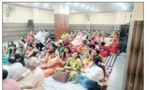
अज्ञान और भौतिक साम्राज्यत्वों में हो अंततः उसका नाश निश्चित है। महाराज ने आगे कहा कि रावण की लंका उसका हनुमान जी ने भक्ति की अग्नि से समाप्त किया। यह संदेश देता है कि ईश्वर की भक्ति और धर्म के