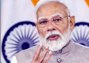
आज देश की लगभग 10 करोड़ महिलाएं स्वयं सहायता समूहों से जुड़ी हैं और उनमें से करीब तीन करोड़ महिलाएं 'लखपति दीदी' बन चुकी हैं। उन्होंने बताया कि इस उपलब्धि में नारसरी की हजारों महिलाएं भी शामिल हैं। उन्होंने भोजपुरी में कहा कि अभी त शुरुआत करीबम में मौजूद महिलाओं में उत्साह का

वाराणसी, वार्ता पीएम मोदी मंगलवार को दोपहर दो दिवसीय दौरे पर काशी पहुंचे। बाबतपुर एयरपोर्ट से हेलीकॉप्टर से बरोका पहुंचे। यहां गेस्ट हाउस में विश्राम के बाद शाम करीब पांच बजे बरोका में आयोजित जन आक्रोश महिला सम्मेलन में पहुंचे। यहां महिलाओं के बीच से होकर पीएम मंच पर पहुंचे। उन्होंने महिलाओं को संबोधित किया। प्रधानमंत्री नरेंद्र मोदी ने नारी बंदन सम्मेलन में महिलाओं के सशक्तिकरण को लेकर सरकार की उपलब्धियों और योजनाओं का विस्तार से उल्लेख किया। उन्होंने कहा कि