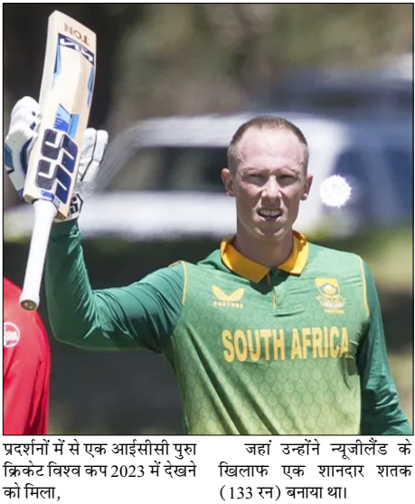
जहां उन्होंने न्यूजीलैंड के खिलाफ एक शानदार शतक (133 रन) बनाया था।

केप टाउन, वार्ता। दक्षिण अफ्रीका के बल्लेबाज रासी वैन डेर डुसेन ने सभी फॉर्मेट में खेलने के बाद अंतर्राष्ट्रीय क्रिकेट से संन्यास ले लिया है। इस दाएं हाथ के बल्लेबाज ने दो अप्रैल को अपने इस फैसले की पुष्टि की। उन्होंने अपने सोशल मीडिया पर एक दिल को छू लेने वाला संदेश साझा करते हुए अंतर्राष्ट्रीय क्रिकेट में अपनी यात्रा को याद किया। वैन डेर डुसेन ने नौ अक्टूबर, 2018 को जिम्बाब्वे के खिलाफ एक टी-20 मैच में अपना डेब्यू किया था और इसके बाद उन्होंने दक्षिण अफ्रीका के लिए तीनों फॉर्मेट में खेला। उन्होंने अपने करियर में 57 टी-20, 71 एकदिवसीय और 18 टेस्ट मैच खेले। उन्होंने आखिरी बार अंतर्राष्ट्रीय मैच 16 अगस्त, 2025 को ऑस्ट्रेलिया के खिलाफ टी-20 खेला था। उनके बेहतरीन