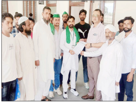
से गेहूं और सरसों की न्यूनतम समर्थन मूल्य ढ़एएमएसपीक़र पर खरीद

प्रदर्शन के दौरान किसानों ने कहा कि वर्तमान समय में किसान कई गंभीर समस्याओं से जूझ रहा है, लेकिन उनकी समस्याओं पर केंद्र और राज्य सरकारों द्वारा पर्याप्त ध्यान नहीं दिया जा रहा है। उन्होंने कहा कि रबी सीजन की फसलों, विशेष रूप