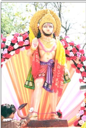
आकर्षण का केन्द्र रही झांकी।