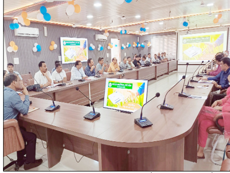
यदि उनका गेहूं निर्धारित मानकों के अनुरूप नहीं है, तो वे स्वयं उसकी

में कुल 28 क्रय केंद्र स्थापित किए गए हैं। इनमें खाद्य विभाग के 4, पीसीएफ के 16, पीसीयू के 5 तथा भारतीय खाद्य निगम के 3 केंद्र शामिल हैं। इनमें से 4 केंद्रों को मोबाइल क्रय केंद्र के रूप में भी विकसित किया गया है। उन्होंने बताया कि वर्ष 2026-27 के लिए गेहूं का न्यूनतम समर्थन मूल्य 2585 रुपये प्रति क्विंटल निर्धारित किया गया है, जो पिछले वर्ष की तुलना में 160 रुपये अधिक है। गेहूं खरीद की अवधि 30 मार्च से 15 जून 2026 तक निर्धारित की गई है। क्रय केंद्र रविवार और राजपत्रित अवकाश को छोड़कर अन्य कार्यदिवसों में सुबह 9 बजे से शाम 6 बजे तक खुले रहेंगे। कार्यशाला में किसानों को यह भी बताया गया कि