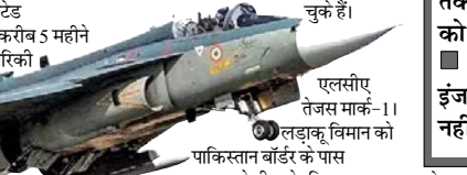
एलसीए तेजस मार्क-1। लड़ाकू विमान को पाकिस्तान बॉर्डर के पास

वायुसेना को सौंप देगा। इसके लिए एचएएल को जीई की ओर से अभी तक 4 इंजन भी मिल चुके हैं।