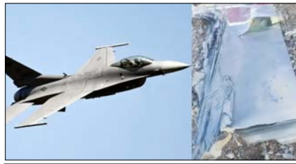
तस्वीरें भी जारी की हैं और कहा है कि यह विमान अमेरिका के लेकनहीथ स्क्वाड्रन का था। रिपोर्ट में यह भी कहा गया कि विमान पूरी तरह तबाह हो गया और पायलट के बचने की संभावना बहुत कम है। ईरान के सरकारी टीवी से जुड़े एक स्थानीय चैनल ने दावा किया है कि दक्षिण-पश्चिमी ईरान में एक

ईरान और अमेरिका के बीच बढ़ता तनाव कम होने का नाम ही नहीं ले रहा है। दोनों देश अपने-अपने हिसाब के कई बड़े दावे कर रहे हैं। कभी अमेरिका कहता है कि ईरान में सत्ता परिवर्तन हो चुका है। वहीं, इन सबके बीच ईरान को और से भी बड़ा दावा किया गया है।