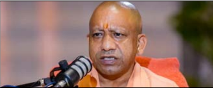
उत्तर प्रदेश पुलिस में जल्द पूरी होगी 81 हजार पदों पर भर्ती: योगी

नई दिल्ली, मुजफ्फरनगर, देहरादून, हल्द्वानी, मुद्रादाबाद, बरौली, मेरठ व लखनऊ से प्रकाशित