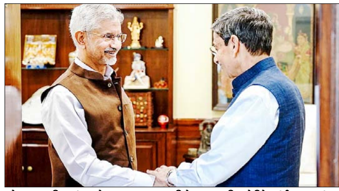
कोलकाता। पश्चिम बंगाल के राज्यपाल आरएन एच के साथ हाथ मिलाते विदेश मंत्री एस जयशंकर।

अड्डे के इस्तेमाल की अनुमति अमेरिकी बमवर्षक विमानों को देने से इन्कार कर दिया था। यूरोप देशों के इन्कार से अमेरिकी राष्ट्रपति डोनाल्ड ट्रम्प भी काफी खफा हैं। वो टुथ के अलावा विभिन्न प्लेटफॉर्म पर खुलकर विरोध जता चुके हैं। कई मीडिया साक्षात्कार में खुले तौर पर नाटो और यूरोपीय देशों के खिलाफ राय जाहिर कर चुके हैं। लगभग हर दूसरे दिन वो टुथ पर मदद न करने का तंज कसते हुए कह देते हैं कि अमेरिका याद रखेगा। जिस होर्मुज स्ट्रेट पर कब्जे का वो दावा करते थे अब उसे लेकर भी उन्होंने रुचि नहीं दिखाई है। राष्ट्र के नाम अपने संबोधन में कहा कि अब उसकी जिम्मेदारी वो उठाए, जिन्हें वहां से अपना सामान ले जाना है। हाल ही में डेली टेलीग्राफ को दिए एक साक्षात्कार में ट्रम्प ने ईरान-इजरायल संघर्ष के दौरान नाटो सहयोगियों, खासकर ब्रिटेन और फ्रांस की ओर से सैन्य मदद न देने पर नाराजी जताई। ट्रम्प ने नाटो को कागजी शेर करार दिया और अमेरिका के गठबंधन से बाहर निकलने की धमकी दी।