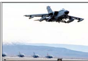
ऑस्ट्रिया ने पूरी तरह से अमेरिकी उड़ानों पर प्रतिबंध नहीं लगाया है, बल्कि हर अनुरोध की समीक्षा तथ्यों के आधार पर की जा रही है।

वियना। यूरोप के कई देशों ने अमेरिका के सैन्य अभियानों से दूरी बनानी शुरू कर दी है। इसमें सबसे नया नाम ऑस्ट्रिया का जुड़ गया है। जिसने ईरान से जुड़े सैन्य ऑपरेशनों के लिए अपने एयरस्पेस के इस्तेमाल की अमेरिकी मांग टुकरा दी है। ऑस्ट्रिया के रक्षा मंत्रालय के अनुसार, यह फैसला देश के सख्त तटस्थता कानून के तहत लिया गया है। मंत्रालय के प्रवक्ता के हवाले से ब्राडकास्टर ओआरएफ ने पुष्टि की कि वाशिंगटन की ओर से कई अनुरोध आए थे, लेकिन हर मामले को विदेश मंत्रालय के साथ मिलकर अलग-अलग आधार पर परखा जाएगा। हालांकि, ऑस्ट्रिया ने पूरी तरह से अमेरिकी उड़ानों पर प्रतिबंध नहीं लगाया है, बल्कि हर अनुरोध की समीक्षा तथ्यों के आधार पर की जा रही है।