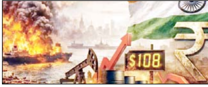
ईरान-अमेरिका युद्ध से दुनिया में लगा महंगाई का तड़का