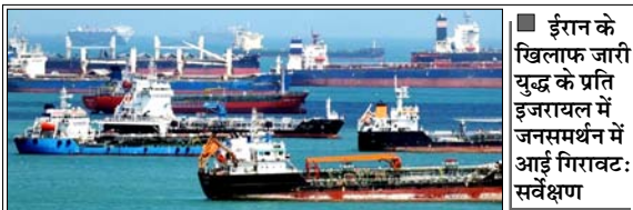
ईरान के खिलाफ जारी युद्ध के प्रति इजरायल में जनसमर्थन में आई गिरावट: सर्वेक्षण