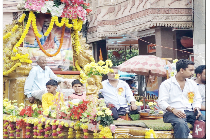
मुजफ्फरनगर: शहर में निकाली गई शोभायात्रा में आकर्षण का केंद्र रही झांकी।