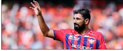
मोहम्मद शमी की आंधी में उड़ी हैदराबाद टीम