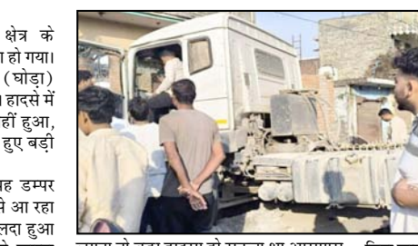
कलसिया रोड पर दोनो तरफ बाहनों की लंबी कतार लग गई। यातायात पूरी तरह ठप हो गया था। पुलिस मौके पर पहुंचकर जांच में जुट गई है और वाहन को क्रेन की मदद से बाहर निकालने का काम शुरू कर दिया गया है। थाना फतेहपुर पुलिस मामले को गहन जांच कर रही है। टैक्निकल खराबी और बिना लाइसेंस ड्राइविंग दोनो पहलुओं पर जांच कर रही है। पुलिस ने डम्पर को जब्त कर लिया है। हादसा एक बार फिर भारी बाहनों की अनियंत्रित गति और लापरवाही को और इशारा करता है। स्थानीय निवासियों ने प्रशासन से कलसिया रोड पर भारी बाहनों की आवाजाही पर सख्ती बरतने की मांग की है।

थाना फतेहपुर क्षेत्र के कलसिया रोड पर एक डराना हादसा हो गया। खनन से लदा भारी भरकम डम्पर (घोड़ा) अनियंत्रित होकर एक घर में जा घुसा। हादसे में किसी के जान-माल का नुकसान नहीं हुआ, लेकिन हादसे की तीव्रता को देखते हुए बड़ी अनहोनी टल गई। मिली जानकारी के अनुसार यह डम्पर कलसिया की तरफ से तेज रफ्तार से आ रहा था। डम्पर में खनन (गिट्टी बालू) लदा हुआ था। अचानक टेक्निकल खराबी के कारण ड्राइवर वाहन पर काबू नहीं रख पाया और यह फूलसिंह निवासी फतेहपुर के घर में सीधा घुस गया। घर में परिवार के सदस्य मौजूद थे, लेकिन संयोग से किसी को चोट नहीं आई। स्थानीय लोगों ने बताया कि अगर थोड़ी भी देर होती या डम्पर घर के किसी अन्य हिस्से में