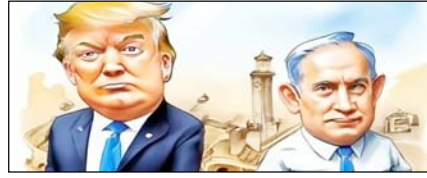
युद्ध अपराधी हैं डोनाल्ड ट्रम्प और नेतन्याहू