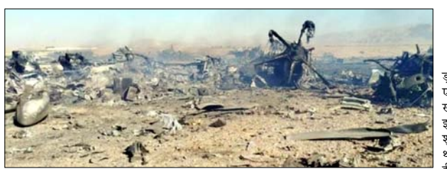
ईरान ने अमेरिकी विमानों को तबाह करने के सबूत देते हुए विमानों के मलबे की तस्वीरें और वीडियो जारी किए

ईरान और अमेरिका के बीच जारी युद्ध लगातार तेज होता दिख रहा है। ईरान की ओर से लगातार अमेरिका विमानों को मार गिराने का दावा किया जा रहा है। रविवार को ईरान की ओर से अमेरिका के विमानों को तबाह करने के सबूत जारी किए गए हैं। ईरानी न्यूज एजेंसी ने अमेरिका के विमानों के मलबे की तस्वीरें और वीडियो जारी किए हैं। ईरान का दावा है कि उसने इस्फहान इलाके में अमेरिकी सैन्य मिशन के दौरान दो ब्लैकहॉक हेलीकॉप्टर और दो सी-130 ट्रांसपोर्ट एयरक्राफ्ट को मार गिराया। ईरान की इस्लामिक