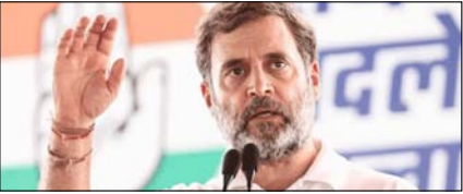
हिमंता बिस्वा सरमा सबसे भ्रष्ट मुख्यमंत्री: राहुल गांधी

नई दिल्ली, मुजफ्फरनगर, देहरादून, हल्द्वानी, मुस्ताबाद, बरौली, मेरठ व लखनऊ से प्रकाशित