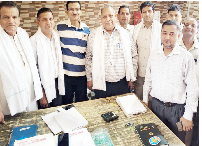
बुढ़ाना: बार संघ अध्यक्ष का स्वागत करते व्यापारी।