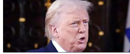
अमेरिकी पायलटों को ईरान से सुरक्षित निकाला: ट्रम्प