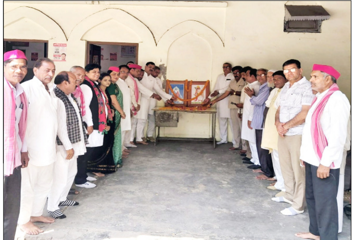
मुजफ्फरनगर: पार्टी कार्यालय पर महर्षि कश्यप व निषादराज को पुष्पाजलि अर्पित करते सपाईं।