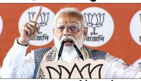
अब जनता बदलाव चाहती है, चुनाव के बाद भ्रष्टाचारियों के खिलाफ कार्रवाई होगी

नई दिल्ली। प्रधानमंत्री नरेंद्र मोदी ने रविवार को पश्चिम बंगाल के कूचबिहार में चुनावी सभा में कहा कि टीएमसी के पापों का घड़ा भर चुका है और अब जनता बदलाव चाहती है। चुनाव के बाद भ्रष्टाचारियों के खिलाफ सख्त कार्रवाई होगी, चुन-चुनकर हिंसा ली जा जाएगी। पीएम मोदी ने कहा कि 1905 में मजहबों ताकतों ने बंगाल में लाल इश्तेहार जारी किया था। उसके बाद हिंदुओं का नरसंहार किया गया था। टीएमसी उसी की याद दिलाना चाहती है। ये खास मजहब के लोग बंगाल में हिंदुओं का रहना मुश्किल कर देंगे। प्रधानमंत्री ने आरोप लगाया कि टीएमसी शासन में लोकतंत्र कमजोर हुआ है। संवैधानिक संस्थाओं की अनदेखी की जा रही है। राज्य में भ्रष्टाचार, घुसपैठ और महिलाओं के खिलाफ अत्याचार ने जनता को भय और असुरक्षा के माहौल में धकेल दिया है। उन्होंने संदेशखाली जैसी घटनाओं का जिक्र करते हुए महिलाओं