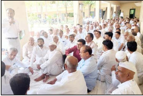
सादरपूर्ण बनाकर समाज को आर्थिक बल से बचाना समय की आवश्यकता है। इस दौरान प्रस्ताव रखा गया कि मछू के दावत को परंपरागत रूप से दाल, चावल, मिलाई" की परंपरा को अपनाया जाए, जिससे अनावश्यक प्रतिस्पर्धा और खर्च पर रोक लग सके।

शाह टाइम्स संवाददाता सरसावा। विकासखंड सरसावा क्षेत्र के शाहजहांपुर अंतर्गत गांव में हिन्दू गुर्जर समाज की एक प्रभावशाली बैठक आयोजित हुई, जिसमें समाज सुधार, कृषि, शिक्षा के प्रसार को लेकर व्यापक मंथन किया गया।