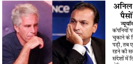
नियुक्ति-विदेश नीति से जुड़ी जानकारी साझा की, जो बाद में सही निकली

अमेरिका के यौन अपराधी जेफ्री एपस्टीन ने 2017 में उद्योगपति अनिल अंबानी के सामने खुद को डोनाल्ड ट्रम्प के पहले कार्यकाल के व्हाइट हाउस के 'इन्साइडर' की तरह पेश किया था। न्यूयॉर्क टाइम्स की रिपोर्ट के मुताबिक दोनों के बीच दो साल तक सैकड़ों मैसेज और ईमेल हुए। इनमें एपस्टीन ने ट्रम्प प्रशासन की नियुक्ति व विदेश नीति से जुड़ी जानकारी साझा की, जो बाद में सही भी निकलीं। हालांकि, इस बात का कोई सबूत नहीं मिला कि एपस्टीन को व्हाइट हाउस तक सीधी पहुंच थी। मैसेज में अनिल अंबानी ने एपस्टीन को लिखा था कि 'भारत के रिश्ते और रक्षा सहयोग के लिए व्हाइट हाउस से डील करने में आपकी ग्राइडेंस चाहिए।' जवाब में एपस्टीन ने 'इन्साइडर' जानकारी देने का दावा किया। न्यूयॉर्क टाइम्स ने जस्टिस डिपार्टमेंट की तरफ से जारी मैसेज के रीकॉर्ड के आधार पर बताया कि अनिल अंबानी और एपस्टीन के बीच बातचीत सिग्नल और टेलीग्राम जैसे एप्लिकेशन के माध्यम से हो रही थी, जहां अंबानी 'अरमानो ए' नाम से सक्रिय थे। यह संपर्क उस दौर का है, जब एपस्टीन नाबालिगों से जुड़े अपराधों में जेल की सजा काट चुका था। इनका