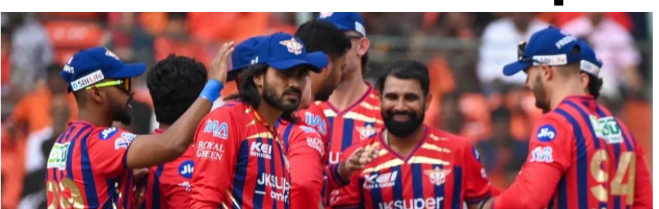
ऋषभ पंत की कप्तानी वाली लखनऊ ने सीजन के अपने दूसरे मैच में सनराइजर्स हैदराबाद को उसके घर में करीबी मुकाबले में 5 विकेट से हराया और पहली जीत दर्ज की, पंत ने आईपीएल सीजन में अपना पहला अर्धशतक भी लगाया

हैदराबाद। लखनऊ सुपर जायंट्स की जीत के साथ ही अब इस सीजन में 7 टीमों ने अपना खाता खोल लिया है। लखनऊ की 2 मैच में ये पहली जीत है, जबकि सनराइजर्स की 3 मैच में दूसरी हार है। लखनऊ सुपर जायंट्स ने भी आईपीएल 2026 में अपना खाता खोल ही लिया है।