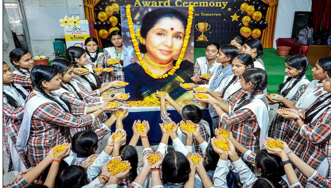
निर्जापुर। दिवंगत दिग्गज पार्वी गाविका आशा भोसले को श्रद्धांजलि अर्पित करती छात्राएं।