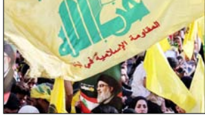
■ कहा: लेबनान सरकार का हिजबुल्लाह के खिलाफ रुख देश में आंतरिक विभाजन पैदा कर सकता है