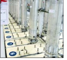
■ होर्मुज तनाव के बीच पुतिन का बड़ा दांव शांतिवार्ता के लिए पेश की ये योजना

मास्को। ईरान और अमेरिका के बीच शांति वार्ता विफल होने के बाद पश्चिम एशिया में तनाव काफी बढ़ गया है। इस बीच रूस ने भविष्य में होने वाली शांति वार्ता के लिए एक नया प्रस्ताव पेश किया है। क्रैमलिन ने सोमवार को जानकारी दी कि रूस अमेरिका के साथ किसी भी संभावित शांति समझौते के तहत ईरान का संवर्धित यूरेनियम (enriched uranium) अपने पास रखने के लिए तैयार है।