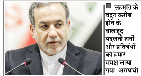
■ सहमति के बहुत करीब होने के बावजूद बदलती शर्तों और प्रतिबंधों को हमारे समक्ष लाया गया: अराघची

नई दिल्ली। ईरान को विदेश मंत्री अब्बास अराघची ने इस्लामाबाद वार्ता की विफलता के लिए अमेरिका को जिम्मेदार ठहराते हुए कहा है कि 'बदलती शर्तों और प्रतिबंधों' को हमारे सामने रखा गया। अराघची ने सोमवार को 'एक्स' पर अपनी पोस्ट में कहा कि वार्ता के दौरान सहमति के बहुत करीब होने के बावजूद बदलती शर्तों और प्रतिबंधों को हमारे समक्ष लाया गया। अराघची ने एक अन्य