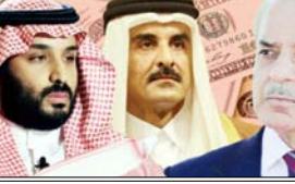
सिर्फ 11 दिन का समय बाकी है। इसके अलावा, अप्रैल में पाकिस्तान को कुल करीब 4.8 अरब डॉलर चुकाने हैं, जिसमें एक बड़ा बान्ड भी शामिल है। आईएमएफ ने पाकिस्तान को खराब आर्थिक स्थिति को संभालने के लिए 3 साल का प्रोग्राम शुरू किया है, जिसके तहत उसे करीब 7 अरब डॉलर की मदद मिलेगी। इसके बतले आईएमएफ ने शर्त रखी है कि पाकिस्तान के बड़े कर्जदाता सऊदी

इस्लामाबाद। पाकिस्तान को सऊदी अरब और कतर से 5 अरब डॉलर (लगभग 46500 करोड़ रुपये) की वित्तीय मदद मिलेगी। यह मदद ऐसे समय में आ रही है, जब देश को इस महीने के अंत तक यूई को 3.5 अरब डॉलर (लगभग 29000 करोड़ रुपये) चुकाने हैं। डान की रिपोर्ट के मुताबिक, पाकिस्तान की कमजोर विदेशी मुद्रा स्थिति संभालने के लिए यह मदद अहम मानी जा रही है। यूई ने हाल ही में कर्ज रोलओवर की नीति में बदलाव किए थे। इसके बाद पाकिस्तान ने अप्रैल तक यूई का 3.5 अरब डॉलर का कर्ज चुकाने का फैसला किया। तब शेंडयूल के मुताबिक 23 अप्रैल तक पाकिस्तान को इस कर्ज की आखिरी किस्त देनी है। इसका मतलब कर्ज चुकाने के लिए