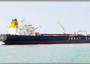
हुई है, लेकिन ये दावे पश्चिम एशिया में बढ़ते भू-राजनीतिक तनाव के बीच सामने आए हैं। इस बीच, रूस के राष्ट्रपति व्लादिमीर पुतिन ने क्षेत्रीय नेताओं से बातचीत कर कूटनीतिक समाधान की संभावनाओं पर जोर दिया है। राष्ट्रपति के सहयोगी निकोलाई पत्रुशोव ने नाटो पर 'सी शील्ड 2026' अभ्यास के जरिए काला सागर क्षेत्र में सैन्य ढांचे का विस्तार करने का आरोप लगाया है। पत्रुशोव ने कहा कि रूस का मुकाबला करने के उद्देश्य से किए जा रहे इन युद्धाभ्यासों के लिए रोमानिया को मुख्य