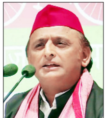
व्यापारियों और सूक्ष्म, लघु एवं मध्यम उद्यमों के लिए नुकसानदायक साबित हो रही हैं।

लखनऊ। हाल ही में उच्चतम न्यायालय के आदेश पर मेरठ की सेंट्रल मार्केट में सरकार की तरफ से की गई सीलिंग को कार्रवाई को लेकर समाजवादी पार्टी अध्यक्ष अखिलेश यादव ने निशाना साधा है।