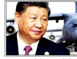
इरान में लैंडिंग के दावे से मचा हड़कंप, जाने क्या है मामला