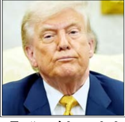
जॉनसन के लिए यह स्थिति राजनीतिक रूप से चुनौतीपूर्ण मानी जा रही है

वाशिंगटन। अमेरिका के राष्ट्रपति डोनाल्ड ट्रम्प को उस समय अपनी ही पार्टी के भीतर दुर्लभ विरोध का सामना करना पड़ा, जब रिपब्लिकन सांसदों ने फरिन इंटरिजेंस सर्विलांस एक्ट (फिसा) के नवीनीकरण को रोक दिया। इस घटनाक्रम से न सिर्फ सदन अध्यक्ष माइक जोनसन को बड़ा झटका लगा, बल्कि ट्रम्प के प्रभाव पर भी सवाल खड़े हो गए, क्योंकि अब तक अधिकांश मामलों में रिपब्लिकन सांसद उनके समर्थन में एकजुट रहते थे। विवाद के केंद्र में फिसा की धारा 702 है, जिसका उपयोग अमेरिकी खुफिया एजेंसियां विदेशी लक्ष्यों की निगरानी के लिए करती रही हैं। व्हाइट हाउस ने एंबेसि न्यूज प्रयासों के बावजूद 20 से ज्यादा रिपब्लिकन सांसदों ने पार्टी लाइन से हटकर मतदान किया और प्रक्रिया को रोक दिया। इस असफलता के बाद पार्टी नेतृत्व को मजबूरन इस निगरानी कार्यक्रम के लिए 10 दिन का अस्थायी विस्तार लागू करना पड़ा, जो आर्मि विकल्प था। यह घटनाक्रम इसलिए भी महत्वपूर्ण रहा, क्योंकि ट्रम्प, जो आमतौर पर प्रमुख मतदानों में पार्टी को एकजुट रखने में सफल रहते हैं, इस बार असंतुष्ट सांसदों को मनाने में विफल रहे। जोनसन के लिए यह स्थिति राजनीतिक रूप से चुनौतीपूर्ण मानी जा रही है, क्योंकि उनकी रणनीति काफी हद तक ट्रम्प के प्रभाव पर निर्भर रही है। प्रशासन ने सांसदों को मनाने के लिए व्यापक प्रयास