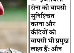
इजरायली सेना की वापसी सुनिश्चित करना और कैदियों की वापसी भी प्रमुख लक्ष्य हैं: औन

बेरूत। लेबनान के राष्ट्रपति जोसेफ औन ने इजरायल के साथ सीजफायर के बाद स्थायी समझौते पर बातचीत करने का ऐलान किया है। उन्होंने कहा कि यह कदम लेबनान के लोगों के अधिकारों, क्षेत्रीय एकता और देश की संप्रभुता की सुरक्षा के लिए उठाया गया है। यह घोषणा गुरुवार और शुक्रवार की आधी रात से लागू हुए 10 दिवसीय सीजफायर के बाद आई है, जिसका उद्देश्य इजरायल और हिजबुल्लाह के बीच भीषण तनाव को कम करना है। राष्ट्रपति औन ने लेबनान के लोगों को संबोधित करते हुए कहा कि देश अब सीजफायर लागू करने से आगे बढ़कर लंबे समय तक स्थिरता बनाए रखने के बड़े चरण की ओर बढ़ रहा है। उन्होंने सीजफायर का श्रेय लेबनान के लोगों के संयुक्त प्रयासों और कुर्बानियों के साथ-साथ अंतर्राष्ट्रीय व क्षेत्रीय राजनयिक जुड़ाव को दिया। आउन ने स्पष्ट किया कि बातचीत कमजोर हो सकती नहीं है, बल्कि यह लेबनान के हितों की रक्षा करने और जानमाल के नुकसान व विस्थापन को रोकने का एक संप्रभु निर्णय है। उन्होंने कहा कि हजारों लेबनानी मारे गए हैं और विदेशी हितों के लिए अब और जानें नहीं जानी चाहिए। राष्ट्रपति औन ने कहा कि मैं इन फैसलों की पूरी जिम्मेदारी लेने के लिए तैयार हूँ। उन्होंने एक