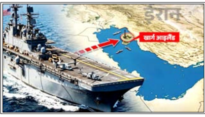
इस सबसे ताकतवर मारने वाले अमेरिकी जहाज का इतना लंबा रूट लेना कोई आम बात नहीं है

वाशिंगटन। समुद्र में दुनिया के सबसे ताकतवर जंगी जहाजों में शामिल अमेरिका का विशाल एयक्राफ्ट कैरियर यूएसएस जार्ज एचडब्ल्यू बुश सीधा रास्ता छोड़कर लंबा चक्कर लगा रहा है। यह जहाज अब डेह गुना ज्यादा दूरी तय करते हुए अफ्रीका का पूरा चक्कर लगाकर ईरान के करीब पहुंच रहा है। रिपोर्ट्स के मुताबिक रड सी का रास्ता हती विद्रोहियों के खतरों से भरा है। जिससे बचने के लिए यह अमेरिकी सुपरकैरियर लंबा रास्ता लेने को मजबूर है। फोर्ब्स की रिपोर्ट के मुताबिक अमेरिकी कैरियर जिब्राल्टर, भूमध्य सागर और स्वेज नहर होते हुए रड सी से गुजरते हैं। लेकिन इस बार अमेरिकी नौसेना ने यह रास्ता नहीं चुना है। इस कैरियर के साथ तीन डेस्ट्रॉयर और करीब 6000 नाविक हैं। जो अमेरिकी अधिकारियों ने एपी को बताया कि यह स्ट्राइक ग्रुप मिडिल ईस्ट तैनाती के लिए रवाना हुआ है। इस सबसे ताकतवर मारने वाले अमेरिकी जहाज का इतना लंबा रूट लेना कोई आम बात नहीं है। पेंटागन ने आधिकारिक तौर पर वजह नहीं बताई है, लेकिन संकेत साफ हैं कि अफ्रीका का रास्ता लेने से यह जहाज लाल सागर और बाब-अल-मंदेब स्ट्रेट से बच रहा है। हाल के सालों में इस इलाके को यमन के