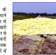
लोगों में अफरा-तफरी बनी रही और राहगीर भी दोनों साइडों में रूक गए। यहां पर लोगों को यह देहशत थी कि कहीं धुंए के साथ आग न लग जाए। काफी देर तक लोगों का आवागमन रूका रहा। और वाहन चालक अपने-अपने वाहनों को खड कर सही स्थान पर खड़े हो गए। कुछ देर के लिए

शामली मार्ग के तितावी क्षेत्र में गंधक से भरा ट्रक पलटने से इस मार्ग पर अचानक ही धुंआ से उड़ने लगा और सड़क पर बिखरी ज्वलनशील सामग्री को देखकर इधर से गुजरने वाले राहगीरों में अफरा-तफरी का माहौल बना रहा। काफी देर तक यहां धुंआ से उड़ता रहा और लोगों में देहशत बनी रही।