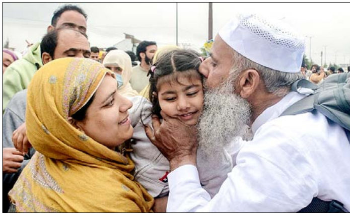
श्रीनगर। जम्मू-कश्मीर में हज यात्रियों का पहला जत्या मक्का के लिए रवाना होते समय एक हज यात्री बच्ची को दुलारते हुए।

वाशिंगटन। अमरीकी वित्त मंत्रालय ने शुक्रवार को 17 अप्रैल तक जहाजों पर पहले से लदे रूसी कच्चे तेल और पेट्रोलियम उत्पादों की आपूर्ति और बिक्री को इजाजत के लिए एक अस्थायी छूट देने की घोषणा की है। यह छूट 16 मई तक मान्य है। यह छूट सुनिश्चित करती है कि समुद्र में अभी मौजूद तेल अंतर्राष्ट्रीय खरीदारों तक पहुंच सके, साथ ही रूस पर कुल मिलाकर रोक का दबाव बना रहे। मंत्रालय के एक प्रवक्ता ने कहा कि जैसे-जैसे बातचीत आगे बढ़ रही है, मंत्रालय यह सुनिश्चित करना चाहता है कि तेल उन लोगों को मिले जिन्हें इसकी जरूरत है कि उन्होंने इस बात पर जोर दिया कि यह कदम बाजार को स्थिर करने के लिए है, न कि रोक नीति में बदलाव के लिए। यह फैसला अमरीकी वित्त मंत्री स्कॉट बसेंट के इस संकेत के कुछ ही दिनों बाद आया है कि प्रशासन रूसी तेल के लिए जनरल लाइसेंस नहीं बढ़ाएगा। इस मामले से जुड़े सूत्रों ने कहा कि ईरान युद्ध के बीच एशिया में बढ़ती ऊर्जा मांग का सामना कर रहे कई साझेदार देशों ने जी-20, विश्व बैंक और अंतर्राष्ट्रीय मुद्रा कोष की बैठक में चर्चा के दौरान वाशिंगटन पर छूट बढ़ाने का दबाव डाला। यह घोषणा ईरान के विदेश मंत्री के इस टिप्पणी के बाद आई है कि युद्धविराम के दौरान होर्मुज जलमार्ग वाणिज्यिक जहाजों के लिए खुला रहेगा।