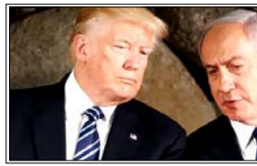
इजरायली प्रधानमंत्री बेंजामिन नेतन्याहू और उनके सलाहकारों में चिंता बढ़ गई और व्हाइट हाउस से स्पष्टीकरण मांगा गया

वाशिंगटन। पश्चिम एशिया में जारी ईरान संकट और इजरायल-लेबनान तनाव के बीच अमेरिका और इजरायल के रिश्तों में भी हलचल देखने को मिली है। अमेरिकी राष्ट्रपति डोनाल्ड ट्रम्प के ताजा बयानों ने कूटनीतिक स्तर पर नई बहस छेड़ दी है। यह बयान ऐसे समय में आया है जब संयुक्त राज्य अमेरिका-इजरायल और ईरान के बीच तनाव बढ़ रहा है।