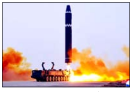
यह इलाका पहले भी मिसाइल परीक्षणों के लिए जाना जाता रहा है

सियोल। एशिया में एक बार फिर तनाव की लहर तेज हो गई है। रविवार को दक्षिण कोरिया ने दावा किया कि उत्तर कोरिया ने अपनी पूर्वी समुद्री सीमा की ओर कई बैलिस्टिक मिसाइलें दागी हैं। यह कदम ऐसे समय पर उठाया गया है, जब क्षेत्र पहले से ही सुरक्षा चुनौतियों और शक्ति संतुलन के दबाव से जूझ रहा है।