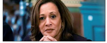
ईरान से युद्ध एपस्टीन विवाद से घ्याना भटकाने की चाल: कमला हैरिस