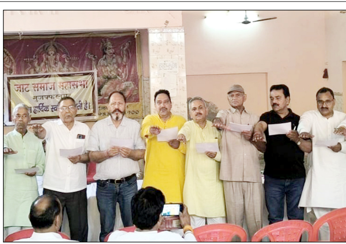
मुजफ्फरनगर। जाट महासभा की नई कार्यकारिणी शपथ लेते हुए।

स्थानीय लोगों के अनुसार, स्मार्ट मीटर और ऑनलाइन सिस्टम लागू होने के बाद इस तरह की त्रुटियां बड़ी हैं। छोटी-छोटी समस्याओं के समाधान के लिए भी उपभोक्ताओं को बार-बार विभाग के चक्कर काटने पड़ रहे हैं, जिससे नाराजगी बढ़ रही है। लोगों ने मांग की है कि विभाग ऐसे मामलों को गंभीरता से लेकर त्वरित समाधान सुनिश्चित करें और जिम्मेदार कर्मचारियों के खिलाफ कार्रवाई की जाए, ताकि भविष्य में इस तरह की लापरवाही दोहराई न जाए।