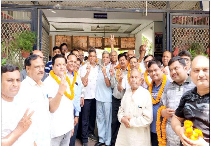
मुजफ्फरनगर: जैन कन्या पाठशाला संस्था की प्रबंध समिति में चुने गए पदाधिकारी।