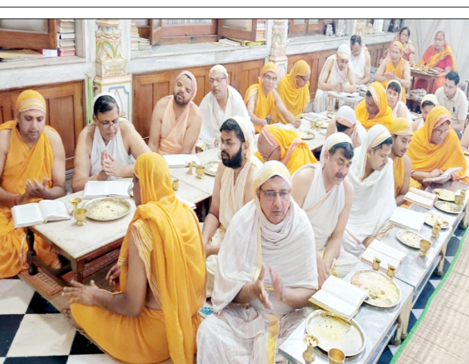
खतौली: अक्षय तृतीया पर श्रद्धा का अर्पण।