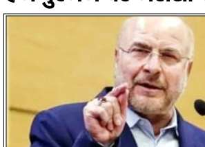
ईरानी विदेश मंत्रालय ने अंतर्राष्ट्रीय कानून के अनुपालन की यूरोपीय संघ की अपील को किया खारिज

मास्को। ईरानी संसद अध्यक्ष मोहम्मद बोरगे गालिबफ ने कहा कि मध्य पूर्व में संघर्ष को समाधान के लिए वाशिंगटन और तेहरान के बीच जारी बातचीत के बावजूद, ईरान के सशस्त्र बल पूरी तरह से युद्ध के लिए तैयार हैं। प्रेस टीवी ने गालिबफ के हवाले से कहा कि हमें दुश्मन पर भरोसा नहीं है। अभी भी, जब हम यहां बैठे हैं, युद्ध छिड़ सकता है। सशस्त्र बल जमीन पर पूरी तरह से युद्ध के लिए तैयार है। प्रसारक के अनुसार, संसद अध्यक्ष ने इस बात से इन्कार किया कि जारी बातचीत से राष्ट्रीय सुरक्षा के प्रति लापरवाही हो सकती है। गालिबफ ने कहा कि हमारा मानना है कि बातचीत के कारण सशस्त्र बल तैयार नहीं हैं। इसके विपरीत, सड़कों पर आम लोगों की तरह, हमारे सशस्त्र बल भी तैयार हैं। इससे पहले, पाकिस्तानी प्रसारक जिज्या टीवी ने बताया कि अमेरिका-ईरान वार्ता का दूसरा दौर इस्लामाबाद में अगले सप्ताह के अंत में होने की संभावना है। 28 फरवरी को अमेरिका और इजरायल ने ईरान में टिकानों पर हमले शुरू किए, जिनमें 3,000 से अधिक लोग मारे गए। 8 अप्रैल को वाशिंगटन और तेहरान ने दो सप्ताह के लिए युद्धविराम की घोषणा की। इस्लामाबाद में हुई वाद की बातचीत बेततीजा रही। हालांकि