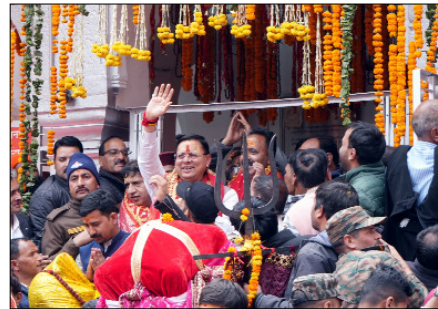
गंगोत्री धाम में कपाटोद्घाटन के अवसर पर मुख्यमंत्री ने की विशेष पूजा-अर्चना

नई दिल्ली। मुख्य चुनाव आयुक्त (सीईसी) ज्ञानेश कुमार को हटाने के लिए विपक्ष एक बार फिर कोशिश में जुटा है। सुत्रों के अनुसार, कई विपक्षी दलों के नेता आपस में बातचीत कर रहे हैं। करीब पांच सौ निर्यर लीडर एक नए नॉटिस का मसौदा तैयार करने पर काम कर रहे हैं, ताकि हटाने की कार्यवाही शुरू की जा सके। इससे पहले मार्च में विपक्ष ने ज्ञानेश कुमार को हटाने के लिए संसद में नोटिस दिया था। हालांकि लोकसभा अध्यक्ष ओम बिरला और राज्यसभा सभापति सोनी राधाकृष्णन ने इन नोटिसों को खारिज कर दिया। उन्होंने कहा कि ज्ञानेश कुमार के खिलाफ लगाए गए आरोप उन्हें हटाने के लिए आवश्यक उच्च संवैधानिक मानदंडों को पूरा नहीं करते। नए नोटिस में विपक्ष कम से कम 200 संसदों का समर्थन जुटाने की कोशिश कर रहा है।