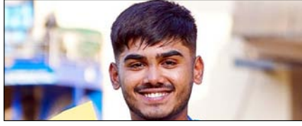
आयुष मन्त्रों की हैमस्ट्रिंग फटी, अब उन्हें बाहर बैठना पड़ेगा