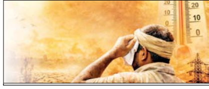
इस साल लोगों को झुलसाएगी गर्मी