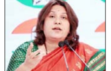
भाजपा नहीं देना चाहती महिलाओं को आरक्षण

कांग्रेस ने कहा है कि भाजपा हमेशा महिलाओं को आरक्षण देने के खिलाफ रही है और यही वजह है कि इस बार उसने महिला आरक्षण को आड़ में परिसीमन लाने का पदचरित्र किया, जिसके कारण संसद में पेश संविधान संशोधन विधेयक गिर गया और भाजपा को मुंह की खानी पड़ी। पार्टी ने कहा कि भाजपा शुरू से ही महिलाओं को आरक्षण नहीं देने का इरादा है। यह हमेशा महिला आरक्षण के विरुद्ध रही है और यही कारण था कि पूर्व प्रधानमंत्री राजीव गांधी 1990 में महिलाओं को आरक्षण देने के लिए संविधान संशोधन विधेयक लेकर आए थे, तो भाजपा ने इसका विरोध किया था, जिसके कारण वह विधेयक संसद में पारित नहीं हो सका था। कांग्रेस प्रवक्ता सुप्रिया श्रीनेत ने