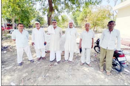
दी गई है जहां खले में पड़े हजारों बोरे गेहूँ को लोड करने का कार्य चल रहा है।