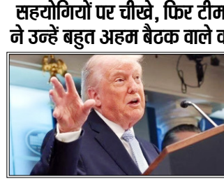
ईरान युद्ध के दौरान अमेरिकी राष्ट्रपति डोनाल्ड ट्रम्प का रवैया सार्वजनिक रूप से बेहद आक्रामक रहा है

वाशिंगटन। अमेरिका और ईरान के बीच दो हफ्ते के युद्ध विराम की मियाद 21 अप्रैल को पूरी होने वाली है। अमेरिका-ईरान संघर्ष के दौरान एक मौका, तो ऐसा आ गया था, जब ट्रम्प अचानक हुए कुछ घटनाक्रमों के चलते बुरी तरह बौखला गए थे।