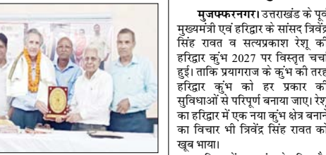
मुजफ्फरनगर। उत्तराखंड के पूर्व मुख्यमंत्री एवं हरिद्वार के सांसद त्रिवेंद्र सिंह रावत व सत्यप्रकाश रेशू का हरिद्वार कुंभ 2027 पर विस्तृत चर्चा हुई। ताकि प्रथमराज के कुंभ को तरह हरिद्वार कुंभ को हर प्रकार की सुविधाओं में विधिपूर्वक बनाया जाए। रेशू का हरिद्वार में एक नया कुंभ क्षेत्र बनाने का विचार भी त्रिवेंद्र सिंह रावत को खूब था। हरिद्वार में नया कुंभ क्षेत्र बिजनौर व लखर रोड पर संभव है। दोनों ही रोड शीघ्र से शीघ्र गंगा एक्सप्रेसवे व दिल्ली हरिद्वार एक्सप्रेसवे से जुड़ जायेंगे। जिससे हरिद्वार के अंदर व हर की पौड़ी क्षेत्र का यातायात कम हो जायेगा। यात्रियों को सुविधा उपलब्ध कराने के लिए रेशू ने हर यात्री को कुंभ में आने से पूर्व स्वयं को कुंभ पेंच पर रजिस्टर्ड करने का सुझाव भी दिया। जिससे यात्री के हर पल को जानकारी आसानी से उपलब्ध रहेगी। साथ ही