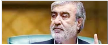
कूटनीतिक बातचीत सैन्य संघर्ष का ही एक विस्तार: अजीजी पेज 12