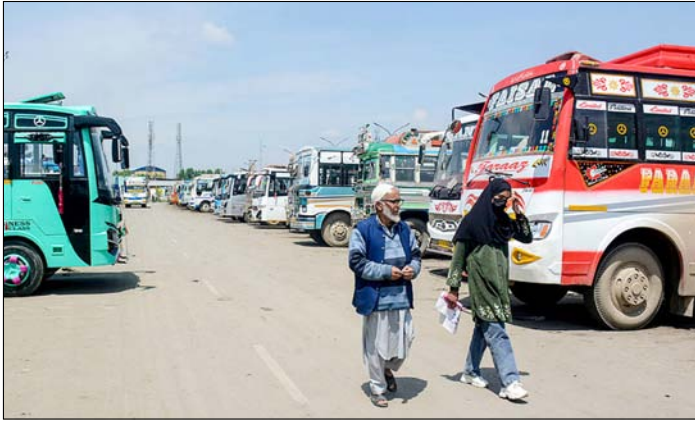
श्रीनगर। गिजी बसों के चालकों और कंडक्टरों द्वारा सरकार के स्टाट सिटी बस सेवाओं को अन्य जिलों में विस्तारित करने के प्रस्ताव के खिलाफ विरोध प्रदर्शन के बाद बस स्टैंड के पास से गुजरते लोग।

नई दिल्ली। प्रधानमंत्री नरेन्द्र मोदी और दक्षिण कोरिया के राष्ट्रपति ली जे म्युंग ने सोमवार को यहां द्विपक्षीय मुद्दों पर व्यापक वार्ता कर दोनों देशों के संबंधों को 'भविष्योन्मुखी साझेदारी' में बदलने का संकल्प लिया और कहा कि भारत तथा दक्षिण कोरिया के बीच के ये संबंध प्रौद्योगिकी, व्यापार और हिंद-प्रशांत क्षेत्र में साझा रणनीति, तिक हितों पर आधारित होंगे। बैठक के बाद संयुक्त संवाददाता सम्मेलन को संबोधित करते हुए मोदी ने कहा कि आठ वर्ष बाद दक्षिण कोरिया के राष्ट्रपति की यह भारत यात्रा, अत्यंत महत्वपूर्ण है और दोनों देशों के बीच के गहरा तालमेल को दर्शाती है। उन्होंने कहा कि लोकातांत्रिक मूल्य, बाजार अर्थव्यवस्था और कानून के शासन के प्रति सम्मान दोनों देशों की मूल पहचान का हिस्सा है।