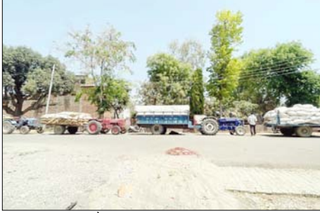
उतरती नजर आ रही हैं।