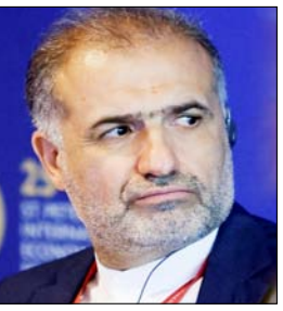
जैसी रणनीतिक चिंताओं तक आ गए हैं। उन्होंने तर्क दिया कि अमेरिका की ए महत्वाकांक्षाएँ पूरी नहीं हुईं। उन्होंने कहा कि शुरूआत में वे सत्ता परिवर्तन चाहते थे, लेकिन अब वे उस स्थिति में आ गए हैं, जहां वे केवल हॉर्मुज जलडमरूमध्य को खोलना चाहते हैं।