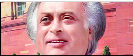
मोदी सरकार की विदेश नीति पर कांग्रेस ने उठाए सवाल पेज 2

नई दिल्ली, मुजफ्फरनगर, देहरादून, हल्द्वानी, मुस्ताबाद, बरौली, मेरठ व लखनऊ से प्रकाशित