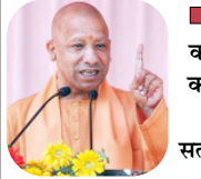
■ किसानों को हो रही असुविधा को ध्यान में रखते हुए उग्र सरकार का अहम फैसला, गर्मी और बढ़ते तापमान को देखते हुए योगी ने सतर्कता और तैयारी का दिया संदेश

शाह टाइम्स ब्यूरो लखनऊ। उत्तर प्रदेश के किसानों को बड़ी राहत देते हुए मुख्यमंत्री योगी आदित्यनाथ ने गेहूं खरीद को लेकर अहम फैसला लिया है। अब किसान बिना फार्मर रजिस्ट्री के भी अपना गेहूं सरकारी क्रय केंद्रों पर बेच सकेंगे। सरकार के एक वरिष्ठ अधिकारी ने बताया कि सरकार ने यह निर्णय किसानों को हो रही असुविधा को ध्यान में रखते हुए लिया है। हाल के दिनों में फार्मर रजिस्ट्री की अनिवार्यता के कारण कई किसानों को गेहूं बेचने में दिक्कतों का सामना करना पड़ रहा था। इसे देखते हुए मुख्यमंत्री ने तत्काल प्रभाव से व्यवस्था में ढील देने के निर्देश दिए। नई व्यवस्था के तहत किसान पूर्व के वर्षों की तरह सीधे क्रय केंद्रों पर जाकर अपना गेहूं बेच सकेंगे। इससे विशेष रूप से छोटे और सीमांत किसानों को राहत मिलने की उम्मीद है। मुख्यमंत्री ने प्रदेश के सभी जिलाधिकारियों को निर्देश दिए हैं कि इस फैसले को तुरंत लागू किया जाए और यह सुनिश्चित किया जाए कि किसी भी किसान को गेहूं बिक्री में परेशानी न हो। सरकार के इस कदम को किसानों के हित में एक महत्वपूर्ण निर्णय माना जा रहा है, जिससे गेहूं खरीद प्रक्रिया में तेजी आने के साथ ही किसानों को समय पर भुगतान मिलने का रास्ता भी आसान होगा। वहीं भीषण गर्मी और बढ़ते तापमान को देखते हुए उत्तर प्रदेश के मुख्यमंत्री योगी आदित्यनाथ ने प्रदेशवासियों के नाम एक भावनात्मक और जागरूकता से भरपूर संदेश जारी किया है। इसमें उन्होंने जहां मौसम के बदलते चक्र और उसके प्रभावों पर चिंता जताई, वहीं सरकार की