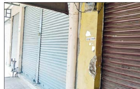
ये ही दुकानदार अपनी अपनी दुकानों के आगे शटर बंद कर दुकानों के आगे ग्राहकों का इंतजार करते रहे और ग्राहक के आते ही दुकानों शटर खोल ग्राहकों से साथ दुकानों के अंदर पहुँच दुकानदारी करते दिखाई दिए। व्यापारियों ने चेतावनी दी है कि