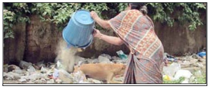
शहर की सेहत ठीक नहीं: हमारी आदतें इसका सम्पादकीय रोग हैं