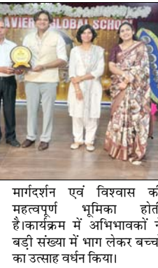
मार्गदर्शन एवं विश्वास की महत्वपूर्ण भूमिका होती है। कार्यक्रम में अभिभावकों ने बड़ी संख्या में भाग लेकर बच्चों का उत्साह वर्धन किया।

ऊर्जा जैसे क्षेत्रों में करियर की अपार संभावनाओं को अपनाने के लिए प्रेरित किया। विद्यालय की प्रधानाचार्य ने अपने उद्बोधन में सभी विद्यार्थियों को उनके उत्कृष्ट प्रदर्शन के लिए शुभकामनाएं दीं तथा उनके उज्वल भविष्य की कामना की। उन्होंने अभिभावकों को भी बधाई देते हुए कहा कि विद्यार्थियों की सफलता में उनके सहयोग,