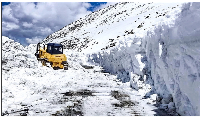
जम्मू-कश्मीर। किश्तवार जिले में सिंथम टॉप तक बर्फ हटाने का काम पूरा हो चुका है, जिसके बाद दकसुम-किश्तवार सड़क को यातायात के लिए फिर से खोल दिया गया।