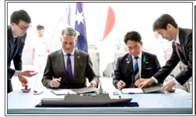
हाल ही में जापान और ऑस्ट्रेलिया के बीच 7 अरब डॉलर का समझौता हुआ है। 1976 में जापान ने घातक हथियारों के निर्यात पर लगभग पूरी तरह रोक लगा दी

टोक्यो। जापान ने सेकेंड वर्ल्ड वॉर के बाद अपनी शांतिवादी नीति में बड़ा बदलाव किया है। प्रधानमंत्री साने ताकाइची की कैबिनेट ने घातक हथियारों के निर्यात पर लगी दशकों पुरानी रोक हटा दी है। इसके तहत अब जापान फाइटर जेट, मिसाइल और वारशिप जैसे हथियार दूसरे देशों को बेच सकेगा। मंगलवार को एक्स पर पोस्ट करते हुए ताकाइची ने कहा कि अब सभी रक्षा उपकरणों का ट्रांसफर संभव होगा। उन्होंने कहा कि हथियार सिर्फ उन देशों को दिए जाएंगे जो यूएन चार्टर (संविधान) के मुताबिक उनका इस्तेमाल करने का वादा करेंगे। जापान के रक्षा मंत्रालय ने बताया कि कई देश जापानी हथियार खरीदने में दिलचस्पी दिखा रहे हैं।