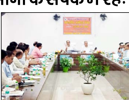
चाहिए। किसानों की मांग पर फार्म मशीनरी बैंक से यंत्र भी नियमानुसार दिए जाएं। इससे पूर्व उन्होंने मंडल के