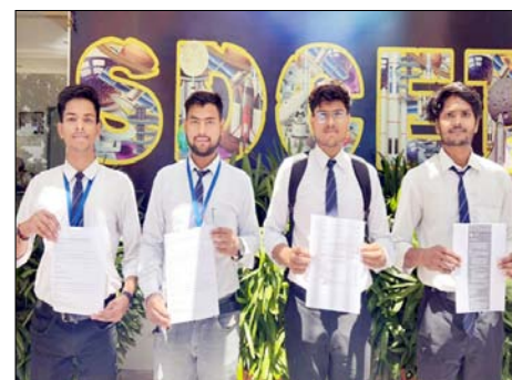
परिणाम है। हम आगे भी छात्रों को राष्ट्रीय स्तर पर उत्कृष्ट अवसर प्रदान करने के लिए प्रयत्न करेंगे, जिससे वे अपने करियर में नई ऊंचाइयों को प्राप्त कर सकें। उन्होंने बताया इस सफलता में कॉलेज के आईआईटी रुड़की के सहयोग और प्रोफेसर, आईआईटी सेल एवं ट्रेनिंग एंड प्लेसमेंट सेल का विशेष योगदान रहा है। इन विभागों द्वारा समय-समय पर आयोजित मार्गदर्शन सत्र, प्रशिक्षण कार्यक्रम एवं नवाचार गतिविधियों ने छात्रों को इस मुकाम तक पहुंचाने में महत्वपूर्ण भूमिका निभाई है।