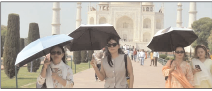
उग्र में अगले पांच दिन आसमान से बरसेगी आग

नई दिल्ली, मुजफ्फरनगर, देहरादून, हल्द्वारी, मुताबाद, बरेली, मेरठ व लखनऊ से प्रकाशित