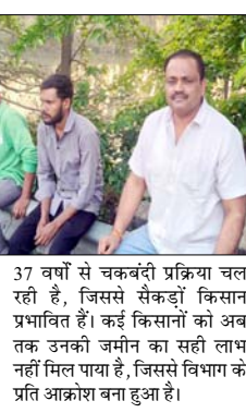
37 वर्षों से चकबंदी प्रक्रिया चल रही है, जिससे सैकड़ों किसान प्रभावित हैं। चाचा की संपत्ति का अब तक उनकी जमीन का सही लाभ नहीं मिल पाया है, जिससे विभाग के प्रति आक्रोश बना हुआ है।

बराबद हुई, लेकिन उसका कोई सुराग नहीं लग सका। इसके बाद पुलिस और ग्रामीणों ने नहर व आसपास के क्षेत्रों में तलाश अभियान चलाया। परिजन कोतवाली पहुंचकर युवक की गुमशुदगी दर्ज कराते हुए शीघ्र बरामदगी की मांग कर रहे हैं। युवक के लापता होने से परिवार में कोहराम मचा हुआ है। ग्रामीणों का कहना है कि पुरबालियान गांव में पिछले करीब