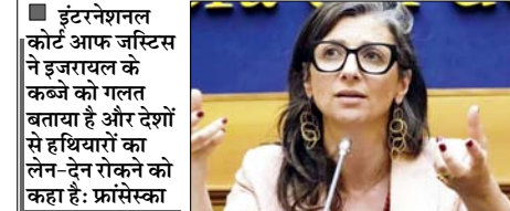
इंटरनेशनल कोर्ट आफ जस्टिस ने इजरायल के कब्जे को गलत बताया है और देशों से हथियारों का लेन-देन रोकने को कहा है: फ्रांसेस्का

वाशिंगटन। संयुक्त राष्ट्र की एक रिपोर्ट में भारत पर अंतर्राष्ट्रीय कानून के उल्लंघन का आरोप लगाया गया है। रिपोर्ट में कहा गया है कि इजरायल के साथ उसके संबंध और युद्ध के समर्थन को लेकर भारत को कानूनी और नैतिक जिम्मेदारी बनती है। 'टार्चर एंड जेनोसाइड' नाम की इस रिपोर्ट को यूएन स्पेशल दूत फ्रांसेस्का अल्बनीज ने 23 मार्च को संयुक्त राष्ट्र मानवाधिकार परिषद में पेश किया। दहिंदू से बात करते हुए उन्होंने भारत पर आरोप लगाया कि इजरायल के साथ करीबी संबंधों के चलते भारत अंतर्राष्ट्रीय कानून के तहत अपने दायित्वों का उल्लंघन कर रहा है और उसे इसकी जिम्मेदारी उठानी पड़ सकती है। उन्होंने यह भी कहा कि इंटरनेशनल कोर्ट आफ जस्टिस ने इजरायल के कब्जे को गलत बताया है और देशों से हथियारों का लेन-देन रोकने को कहा है। इसके