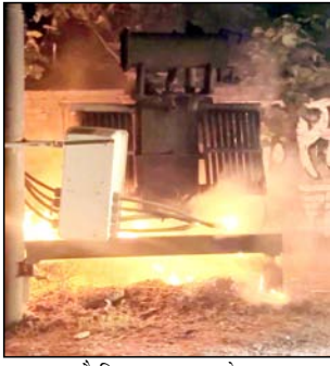
का कहना है कि इस समस्या को लेकर कई बार विद्युत विभाग को लिखित शिकायत दी जा चुकी है और ट्रांसफार्मर को सुरक्षित स्थान

मुजफ्फरनगर। शहर की फ्रेंड्स कॉलोनी में देर रात ट्रांसफार्मर में भीषण आग लगने से इलाके में अफरा-तफरी मच गई। आग इतनी भयंकर थी कि पास स्थित मकान में रहने वाले लोग दहशत में आ गए और बड़ा हादसा होते-होते टल गया।