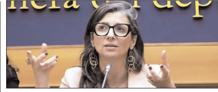
भारत ने इजरायल की मदद कर कानून तोड़ा: यूएन दूत