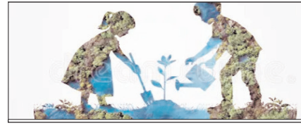
घघकती धरती: विकास की अंधी दौड़ या विनाश का काउंटडाउन