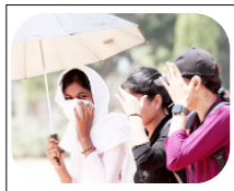
कई जिलों में पारा 44 डिग्री के पार वेस्ट यूपी में 27 को कहीं-कहीं गरज चमक के साथ बौछार पड़ेगी

लखनऊ। उत्तर प्रदेश में अगले कई दिनों तक भीषण गर्मी और लू का प्रकोप जारी रहने के आसार हैं। मौसम विभाग ने पश्चिमी और पूर्वी उत्तर प्रदेश के अनेक हिस्सों में 25 अप्रैल तक दिन के समय लू चलने की चेतावनी जारी की है। राज्य के अधिकांश भागों में फिलहाल मौसम शुष्क रहने की संभावना है, जबकि 27 अप्रैल को पश्चिमी उत्तर प्रदेश के कुछ स्थानों पर गरज-चमक के साथ हल्की बारिश अथवा बौछार पड़ सकती है। मौसम विभाग के लखनऊ केंद्र द्वारा जारी दैनिक बुलेटिन के अनुसार 21 से 26 अप्रैल तक पश्चिमी और पूर्वी उत्तर प्रदेश में सामान्यतः मौसम