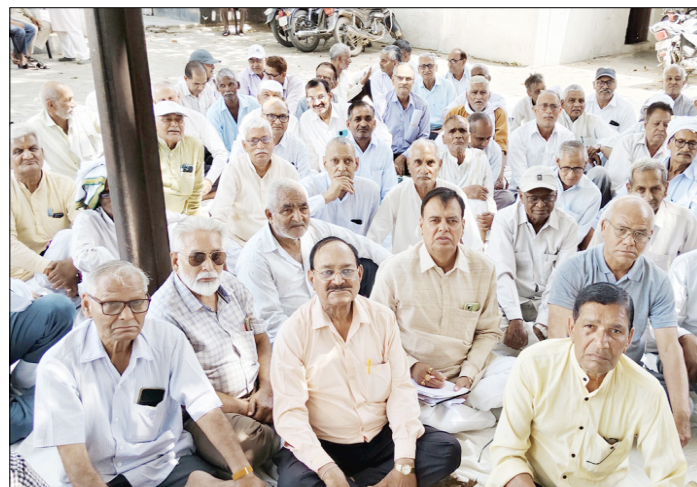
मुजफ्फरनगर: डीएम कार्यालय पर धरना देते रिटायर्ड कर्मचारी।