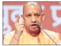
हर पात्र महिला तक योजना पहुंचाने का लक्ष्य

लखनऊ। उत्तर प्रदेश में योगी आदित्यनाथ के नेतृत्व वाली सरकार महिला सशक्तिकरण को लेकर लगातार सक्रिय है। महिलाओं को आर्थिक, सामाजिक और सुरक्षा के स्तर पर मजबूत बनाने के लिए विभिन्न योजनाएं संचालित की जा रही हैं। इसी कड़ी में विधवा पेंशन योजना महत्वपूर्ण भूमिका निभा रही है। इस योजना के तहत प्रदेश में 40.32 लाख से अधिक निराश्रित महिलाओं को आर्थिक सहायता प्रदान की जा रही है। महिला कल्याण विभाग को इस पहल के माध्यम से उन महिलाओं तक सीधे मदद पहुंचाई जा रही है, जिन्हें पति के निधन के बाद आजीविका संबंधी कठिनाइयों का सामना करना पड़ता है। विभागीय आंकड़ों के अनुसार अब तक कुल 40,32,629 महिलाएं इस योजना से लाभान्वित हो चुकी हैं। योजना के अंतर्गत पेंशन राशि वर्ष में चार