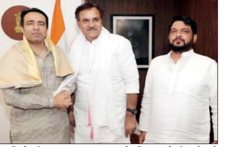
नेताओं की सक्रियता अचानक बढ़ गई है। सामाजिक कार्यकर्ता, नुककड़ सभाओं और जनसंपर्क में दावेदार जुट गए हैं। दिल्ली दरबार में हाजिरी लगाने का सिलसिला भी शुरू हो गया है। अब देखना यह होगा कि