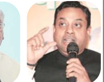
आती है, फिर भी प्रधामंत्री नरेंद्र मोदी को आतंकवादी कहती है। संबित पात्रा ने कहा कि कांग्रेस पार्टी को याद रखना चाहिए कि जब भी कांग्रेस पार्टी ने प्रधानमंत्री के खिलाफ अपशब्दों का इस्तेमाल किया है, भारत की जनता ने उसे सजा दी है। इस बार भी भारत की जनता इसका जवाब देगी। खड़गे ने क्या कहा था? कांग्रेस अध्यक्ष खड़गे ने तमिलनाडु में कहा कि ये एआईएडीएमके के लोग जो खुद अनातुरुर के फोटो लगाते हैं, वो मोदी के साथ कैसे जुड़ सकते हैं? वह एक आतंकवादी हैं। उनकी पार्टी समानता और न्याय में विश्वास नहीं करेगी। इसके बाद अपना टिप्पणी पर सफाई देते हुए कहा कि पीएम मोदी लोगों और राजनीतिक पार्टियों को डरा रहे हैं। मैंने कभी आतंकवादी नहीं कहा।

कांग्रेस अध्यक्ष मल्लिकार्जुन खड़गे ने तमिलनाडु में एक प्रेस कॉन्फ्रेंस में पीएम मोदी को 'आतंकवादी' कहा। हालांकि बाद में सफाई देते हुए इसे 'आतंकिक करने' के संदर्भ में बताया। बीजेपी ने इसे कांग्रेस की सोची-समझी साजिश करार दिया और तीखी निंदा की। बीजेपी प्रवक्ता संबित पात्रा ने कहा कि ये कोई जुमान फिसलना नहीं, बल्कि राहुल गांधी को इशारे पर कहा गया है। हालांकि खड़गे ने कहा कि उनके कहने का ये मतलब नहीं था। जो कहना चाह रहे थे कि पीएम आतंकित करते हैं। खड़गे के इस बयान पर बीजेपी आगबबूला है। बीजेपी नेता संबित पात्रा ने कहा कि यह न सिर्फ निंदनीय है, बल्कि कांग्रेस पार्टी की मानसिकता को भी दिखाता है। भले ही वह कोई सफाई दे रहे हों, लेकिन याद रखिए कि यह कांग्रेस पार्टी की एक सोची-समझी साजिश है। हर रोज राहुल गांधी अपने भाषणों में प्रधानमंत्री के खिलाफ अपशब्दों का इस्तेमाल करते हैं और आज राहुल के इशारे पर खड़गे ने प्रधानमंत्री को आतंकवादी कह दिया। उन्होंने कहा कि यह वही कांग्रेस पार्टी है, जो ओसामा बिन लादेन को 'ओसामा जी' कहती है। यह वही कांग्रेस पार्टी है जो बड़े-बड़े आतंकवादियों के साथ खड़ी नजर