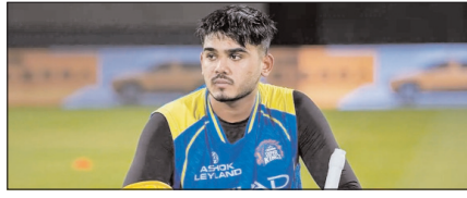
चोटिल आयुष म्हात्रे आईपीएल से बाहर