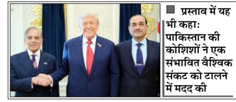
प्रस्ताव में यह भी कहा: पाकिस्तान की कोशिशों ने एक संभावित वैश्विक संकट को टालने में मदद की