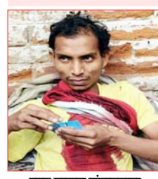
शाह टाइम्स संवाददाता शेरकोट। मजदूरी करने जा रहे युवक पर गुलदार ने हमला कर गंभीर रूप से घायल कर दिया। युवक के शरीर मचाने पर आसपास के लोगों को इकट्ठा होता देख गुलदार भाग गया।