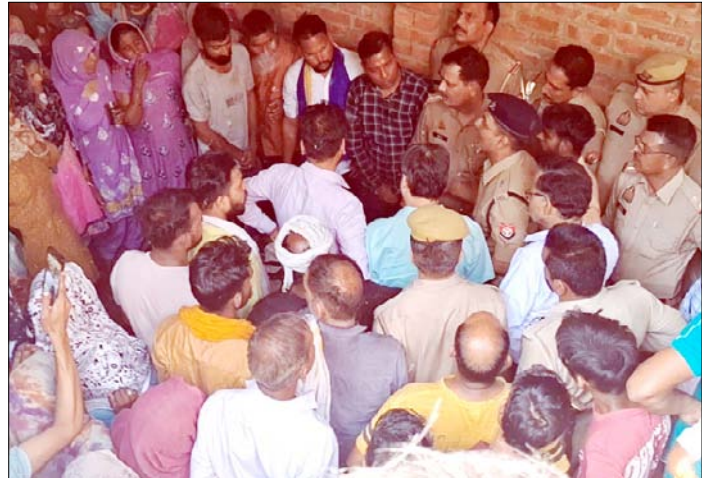
खतौली: गंगधाड़ी में युवक की मौत के बाद परिजनों को समझाते पुलिस अधिकारी।

मिलते ही कोतवाली पुलिस मौके पर पहुंची और शव को नीचे उतरवाकर आवश्यक कार्रवाई की। पुलिस ने पंचनामा भरकर शव को पोस्टमार्टम के लिए भेज दिया है। पुलिस अधिकारियों का कहना है कि शुरुआती जांच में मामला आत्महत्या का लग रहा है, हालांकि सभी बिंदुओं पर जांच की जा रही है। युवक की असमय मौत से परिवार में गहरा दुख है और परिजनों का रो-रोकर बुरा हाल है। वहीं, क्षेत्र में भी इस घटना को लेकर शोक और चर्चा का माहौल बना हुआ है। मामला कुछ भी हो लेकिन युवक की जान चली गई है एक मां से बेटा छिन गया और बहन से भाई।