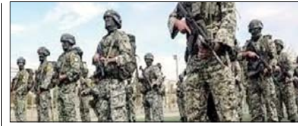
ईरानी सेना की ताकत अब भी मजबूत, पेंटागन रिपोर्ट में खुलासा