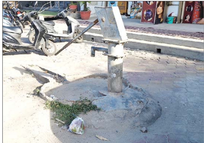
मुजफ्फरनगर: तेज गर्मी के बाद भी सूखा पड़ा सरकारी नला।