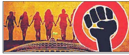
नारी शक्ति वंदन पर राष्ट्र के नाम पीएम का रुंदन भरा संबोधन