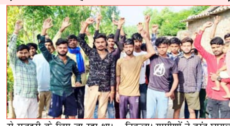
से मजदूरी के लिए जा रहा था। रास्ते में घात लगाए बैठे गुलदार ने उस पर हमला कर दिया। जिससे वह गंभीर रूप से घायल हो गया। अचानक हुए हमले से युवक अपना होश खो बैठा और उसने चीखना-चिल्लाना शुरू कर दिया। आसपास के लोगों में अफरा-तफरी मच गई। शोर मचाने पर किसी तरह गुलदार भाग

कोई ठोस कदम नहीं उठाया गया। वहीं गुलदार के हमले से गांव में दहशत का माहौल है और लोग अपने घरों से बाहर निकलने में भी डर महसूस कर रहे हैं।