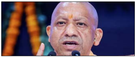
कोई माई का लाल बंगाल की अस्मिता से खिलवाड़ नहीं कर सकता : योगी

नई दिल्ली, मुजफ्फरनगर, देहरादून, हल्द्वानी, मुतादाबाद, बरेली, मेरठ व लखनऊ से प्रकाशित