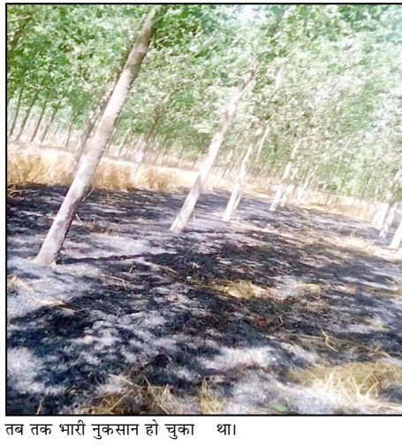
तब तक भारी नुकसान हो चुका था।