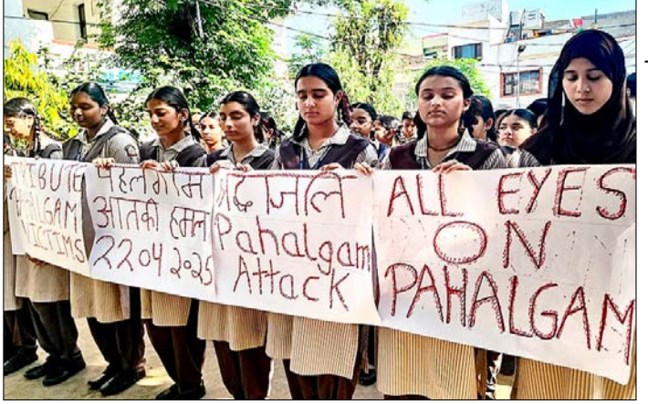
जम्मू। पहलगाम आतंकी हमले की पहली बरसी पर प्रार्थना व श्रद्धांजलि अर्पित करती छात्राएं।

बर्लिन। जर्मनी होर्मुज जलडमरूमध्य में जहाजों को सुरक्षित करने के वास्ते अंतर्राष्ट्रीय मिशन में भाग लेने के लिए तीन जहाज तैनात करने की योजना बना रहा है। 'डेर स्पीगल' मैगजीन ने जर्मन राष्ट्रीय सुरक्षा परिषद के सदस्यों का हवाले से अपनी रिपोर्ट में यह जानकारी दी है। मैगजीन ने मंगलवार को अपनी रिपोर्ट में बताया कि जर्मन चांसलर फ्रेडरिक मर्ज की अध्यक्षता में परिषद की बैठक हुई, जिसमें पश्चिम एशिया की स्थिति सहित कई महत्वपूर्ण राजनीतिक और आर्थिक मुद्दों पर चर्चा की गई। रिपोर्ट में कहा गया है कि परिषद इस मिशन में भाग लेने के लिए दो माइन्स्वीपर (बारूदी सुरंग हटाने वाले जहाज) और एक आपूर्ति जहाज तैनात करने की इजाजत दे सकती है। इसके अलावा, रिपोर्ट में बताया गया है कि जर्मनी ने 'एस्पाइड्स' मिशन के हिस्से के रूप में वर्तमान में जितनी भी तैनात एक छोटी टोही विमान को भी तैनात करने का प्रस्ताव दिया है।