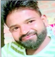
मृतक का फाइल फोटो।

शाह टाइम्स संवाददाता खतौली। गंगधाड़ी गांव में आत्मदाह की घटना में घायल युवक की इलाज के दौरान मौत हो जाने से पूरे क्षेत्र में शोक और तनाव का माहौल बन गया है। बुधवार को जैसे ही युवक का शव गांव पहुंचा, परिजनों में चीख-पुकार मच गई और माहौल बेहद गमगीन हो गया। हालात को देखते हुए प्रशासन ने गांव में भारी पुलिस बल तैनात कर दिया और अधिकारियों की निगरानी में कड़ी सुरक्षा के बीच अंतिम संस्कार कराया गया।