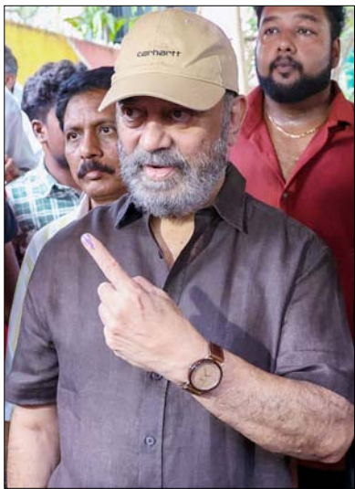
चेन्नई: अभिनेता कमल हासन मतदान के बाद फोटो खिंचवाते हुए।