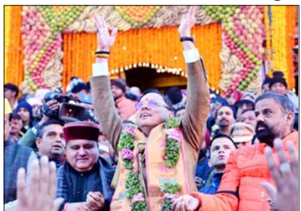
प्रधानमंत्री नरेंद्र मोदी के नाम से पहली महाभिषेक पूजा संपन्न कर देश एवं प्रदेश की

चमोली: भगवान श्री बद्रीनाथ के कपाट गुरुवार प्रातः 6 बजेकर 15 मिनट पर विधिविधान एवं वैदिक मंत्रोच्चार के साथ ग्रीष्मकाल के लिए श्रद्धालुओं के दर्शनार्थ खोल दिए गए। कपाट खुलते ही पूरा बद्रीनाथ धाम भक्ति और श्रद्धा के भाव से सरावट हो उठा। इस पावन अवसर पर देश-विदेश से पहुंचे लगभग 15 हजार श्रद्धालुओं ने भगवान बद्री विशाल एवं अखंड ज्योति के दर्शन कर पुण्य लाभ अर्जित किया।