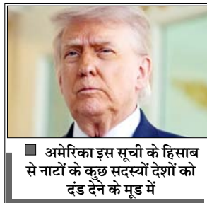
■ अमेरिका इस सूची के हिसाब से नाटो के कुछ सदस्यों देशों को सजा देने के मुद्दे में

वाशिंगटन। अमेरिकी राष्ट्रपति डोनाल्ड ट्रम्प प्रशासन ने नाटो (नाटो) देशों की एक खास सूची तैयार की है। इस सूची को शरारती और अच्छे सहयोगियों का नाम दिया गया है। कथित तौर पर इस सूची के जरिए उन देशों की पहचान की गई है जिन्होंने ईरान के साथ चल रहे युद्ध में अमेरिका का साथ दिया है। इस एक ऐसे कदम के तौर पर देखा जा रहा है, जिसका मकसद, अमेरिका के साथ खड़े देशों को इनाम मिलेगा और पीछे हट गए देशों को सजा भुगतनी पड़ सकती है। बताया जा रहा है यह सूची नाटो के महासचिव मार्क स्टे की इसी महीने हुई वाशिंगटन यात्रा से पहले तैयार की गई थी। रिपोर्ट के मुताबिक, इस विचार की शुरुआत दिसम्बर में अमेरिकी युद्ध सचिव पीट हेगसेथ ने की थी। उन्होंने एक रक्षा मंच पर कहा था कि जो देश आदर्श सहयोगी की तरह व्यवहार करेंगे, अमेरिका उन्हें विशेष सुविधाएं देगा। वहीं, जो देश अपनी सामूहिक रक्षा की जिम्मेदारी पूरी नहीं करेंगे, उन्हें इसके गंभीर नतीजे झेलने होंगे। अमेरिका इस सूची के हिसाब से नाटो के कुछ सदस्यों देशों को सजा देने के लिए कदम उठा सकता है। इसमें उन