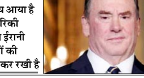
■ यह फैसला ऐसे समय आया है जब अमेरिकी नौसेना ने ईरानी बंदरगाहों की घेराबंदी कर रखी है।

वाशिंगटन। पश्चिम एशिया में जारी तनाव के बीच पेंटागन ने बुधवार को अचानक घोषणा की कि नौसेना सचिव जान फेलन अपना पद छोड़ रहे हैं। राष्ट्रपति डोनाल्ड ट्रम्प के दूसरे कार्यकाल में किसी सैन्य सेवा के प्रमुख का यह पहला इस्तीफा है। हालांकि, रक्षा विभाग में पिछले कुछ समय से कई बड़े अधिकारियों को हटाया जा रहा है। फेलन के अचानक हटने का कोई कारण नहीं बताया गया है। यह फैसला ऐसे समय आया है जब अमेरिकी नौसेना ने ईरानी बंदरगाहों की घेराबंदी कर रखी है और दुनिया भर में तेहरान से जुड़े जहाजों को निशाना बना रही है। अब ट्रम्प के करीबी और अंडरसेक्रेटरी हंग काओ नौसेना के कार्यवाहक सचिव की जिम्मेदारी