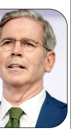
■ अमेरिकी वित्त मंत्री स्कॉट बेसेंट ने कहा कि उन्होंने रूसी तेल की बिक्री को अनुमति देने वाली प्रतिबंध छूट को आगे बढ़ाया है।

वाशिंगटन। अमेरिकी वित्त मंत्री स्कॉट बेसेंट ने कहा कि उन्होंने रूसी तेल की बिक्री को अनुमति देने वाली प्रतिबंध छूट को आगे बढ़ाया है। यह फैसला दुनिया के 10 से अधिक 'सबसे कमजोर और सबसे गरीब' देशों के ऊर्जा जरूरतों को देखते हुए लिया गया। उन्होंने बताया कि यह अनुरोध पिछले हफ्ते अंतर्राष्ट्रीय मुद्रा कोष (आईएमएफ) और विश्व बैंक की बैठक के दौरान सामने आया था। बेसेंट ने सीनेट की विनियोग समिति के सामने यह बयान दिया। उन्होंने कहा कि पहले उनका विचार था कि छूट आगे नहीं बढ़ाई जाएगी। लेकिन बाद में ऊर्जा संकट से जुड़े 10 से अधिक देशों ने अमेरिका से इसे बढ़ाने की अपील की। इसके बाद केवल 30 दिनों के लिए प्रतिबंधों पर यह छूट दी गई। पिछले हफ्ते अमेरिकी वित्त मंत्रालय ने घोषणा की थी कि रूसी या ईरानी तेल की बिक्री के लिए दी गई छूट आगे नहीं बढ़ाई जाएगी। लेकिन शुक्रवार रात को मंत्रालय ने अचानक प्रतिबंधों पर छूट को 30 दिन के लिए बढ़ा दिया। बेसेंट ने कहा, इस हफ्ते विश्व बैंक और आईएमएफ की बैठक थी। मेरा मानना था कि हम इसे आगे नहीं बढ़ाएंगे। लेकिन दस से अधिक कमजोर और गरीब देशों ने हमसे अनुरोध किया। उन्होंने कहा कि ऊर्जा संकट के कारण इसे आगे बढ़ाया जाए। इसलिए हमने केवल 30 दिनों के लिए छूट दी। इससे पहले अमेरिका ने भारत को रूसी तेल खरीदने के लिए 5 मार्च से एक महीने के लिए प्रतिबंधों पर छूट दी थी। कुछ दिनों बाद इसी तरह की छूट कई अन्य देशों को भी दी गई थी, जो 11 अप्रैल को समाप्त हो गई थी।