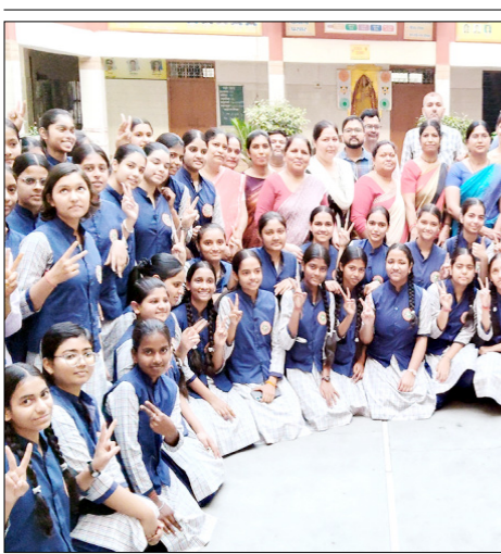
मुजफ्फरनगर: भगवती सरस्वती विद्या मंदिर में मेधावी छात्राएं विजय चिन्ह बनाते हुए।