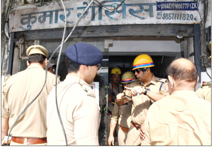
मुजफ्फरनगर: घटना स्थल का निरीक्षण करते समय आवश्यक दिशा-निर्देश देते एसएसपी।