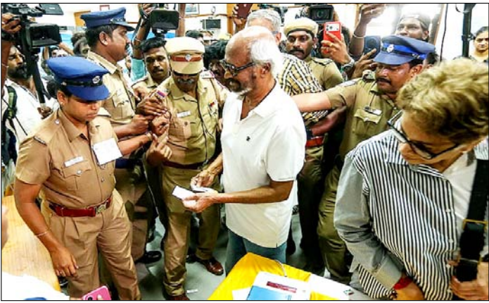
तमिलनाडू। विधानसभा चुनाव में अपना वोट डालने के लिए रेवेन्यू के मतदान केंद्र पर पहुंचे अभिनेता रजनीकांत।

होर्मुज में विदेशी जहाजों पर सवार भारतीय नागरिक सुरक्षित- सरकार नई दिल्ली। सरकार ने आखिरी बार कहा है कि पश्चिम एशिया के होर्मुज जलडमरूमध्य में जिन दो विदेशी जहाजों पर हमला किया गया है उन पर सवार सभी भारतीय नागरिक सुरक्षित हैं और सरकार स्थिति पर नजर बनाए हुए है। दूसरी ओर रसाई गैस की कालाबाजारी और जमाखोरी के खिलाफ देश भर में अभियान जारी है और अब तक 1.5 लाख से अधिक