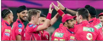
पंजाब किंग्स का हरफनमौला संतुलन रंग लाएगा