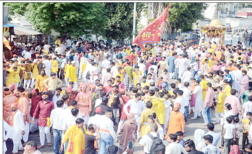
मुजफ्फरनगर: बालाजी जन्मोत्सव पर शोभायात्रा में उमड़ी भक्तों का सैलाब।