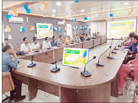
यदि उनका गेहूं निर्धारित मानकों के अनुरूप नहीं है, तो वे स्वयं उसकी

में कुल 28 क्रय केंद्र स्थापित किए गए हैं। इनमें खाद्य विभाग के 4, पीसीएफ के 16, पीसीयू के 5 तथा भारतीय खाद्य निगम के 3 केंद्र शामिल हैं। इनमें से 4 केंद्रों को मोबाइल क्रय केंद्र के रूप में भी विकसित किया गया है। उन्होंने बताया कि वर्ष 2026-27 के लिए गेहूं का न्यूनतम समर्थन मूल्य 2585 रुपये प्रति क्विंटल निर्धारित किया गया है, जो पिछले वर्ष की तुलना में 160 रुपये अधिक है। गेहूं खरीद की अवधि 30 मार्च से 15 जून 2026 तक निर्धारित की गई है। क्रय केंद्र रविवार और राजपत्रित अवकाश को छोड़कर अन्य कार्यदिवसों में सुबह 9 बजे से शाम 6 बजे तक खुले रहेंगे। कार्यशाला में किसानों को यह भी बताया गया कि