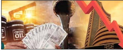
सुधार या बोझ? आम आदमी की जेब पर लगातार पड़ता भार