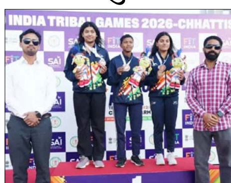
ओडिशा की यह दोहरी स्वर्णिम सफलता केवल एक खेल उपलब्धि नहीं, बल्कि यह इस बात का सशक्त उदाहरण है कि कैसे हॉकी ओडिशा, झारखंड और छत्तीसगढ़ के जनजातीय क्षेत्रों में जीवन को नई दिशा दे रही है। खेल प्रतिभा के भंडार माने जाने

रायपुर, वार्ता। ओडिशा ने खेलो इंडिया ट्राइबल गेम्स 2026 में पुरुष और महिला दोनों वर्गों में हॉकी का स्वर्ण पदक जीतकर अपने दबदबे को साबित किया। रायपुर के वल्लभभाई पटेल अंतर्राष्ट्रीय हॉकी स्टेडियम में खेले गए फाइनल में पुरुष टीम ने झारखंड को 4-1 से हराया, जबकि महिला टीम ने रोमांचक मुकाबले में मिजोरम को 1-0 से मात दी। पुरुष वर्ग में झारखंड को रजत और छत्तीसगढ़ को कांस्य मिला, जबकि महिला वर्ग में झारखंड ने कांस्य पदक हासिल कर पोडियम पूरा किया। आज यहां खेले गए मुकाबलों में ओडिशा की पुरुष टीम ने फाइनल में झारखंड को 4-1 से हराया, जबकि महिला टीम ने कड़े मुक। इबले में मिजोरम को 1-0 से पराजित किया। झारखंड और छत्तीसगढ़ की टीमों भी पोडियम