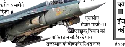
एलसीए तेजस मार्क-1। लड़ाकू विमान को पाकिस्तान बॉर्डर के पास राजस्थान के बीकानेर स्थित नाल एयरबेस पर तैनात करने की योजना है। रक्षा मंत्रालय ने बताया था कि इस जेट में स्वयं रक्षा कवच और कंट्रोल एक्जुचुर होमेंगे। तेजस मार्क-1। के 65 फीसदी से ज्यादा उपकरण भारत में बने हैं। मार्क 1, सिंगल इंजन वाले तेजस एयरक्राफ्ट का एडवॉंस वर्जन है। यह चौथी पीढ़ी का हल्का लड़ाकू विमान है, जो कम वजन के बावजूद बेहद फुर्तीला है। इसमें आपग्रेडेड एवियॉनिक्स और रडार सिस्टम लगे हैं। तेजस के पुराने वर्जन को भी एचएएल ने

वायुसेना को सौंप देगा। इसके लिए एचएएल को जीई की ओर से अभी तक 4 इंजन भी मिल चुके हैं।