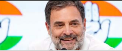
सैनिकों को मिले सम्मान जिसके हैं वे हकदार: राहुल गांधी

नई दिल्ली, मुजफ्फरनगर, देहरादून, हल्द्वारी, मुतादाबाद, बरौली, मेरठ व लखनऊ से प्रकाशित