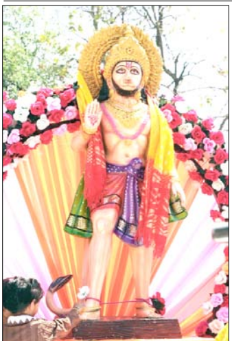
आकर्षण का केन्द्र रही झांकी।