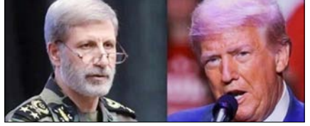
अमेरिका ने जमीनी हमला किया, तो कोई जिंदा नहीं बचेगा: ईरान