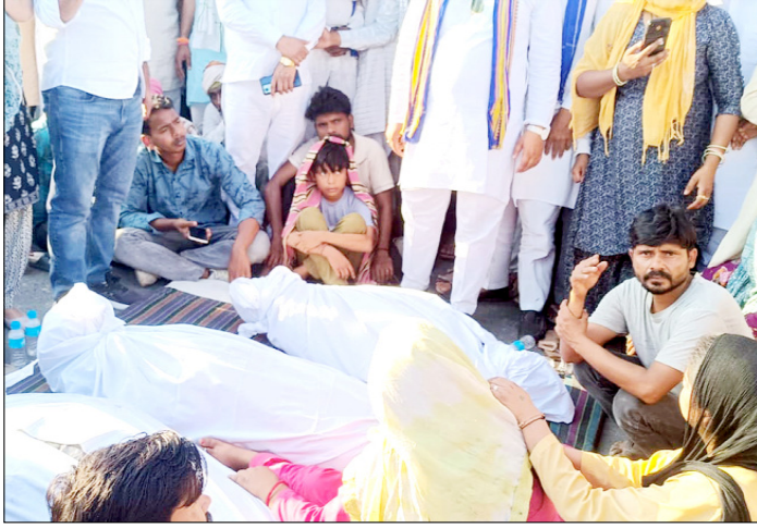
मुजफ्फरनगर: शव रखकर पानीपत खटीमा मार्ग पर धरना प्रदर्शन करते ग्रामीण।