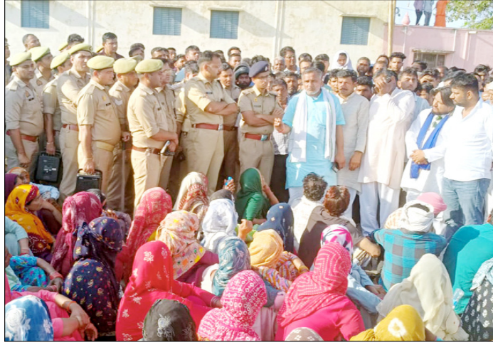
मुजफ्फरनगर: आक्रोशित ग्रामीणों को समझाते बुझाते पुलिस अधिकारी।