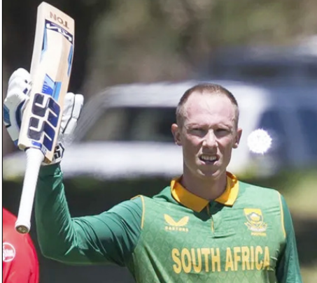
उन्होंने अपने करियर में 57 टी-20, 71 एकदिवसीय और 18 टेस्ट मैच खेले। उन्होंने आखिरी बार अंतर्राष्ट्रीय मैच 16 अगस्त, 2025 को ऑस्ट्रेलिया के खिलाफ टी-20 खेला था। उनके बेहतरीन प्रदर्शनों में से एक आईसीसी पुरुष क्रिकेट विश्व कप 2023 में देखने को मिला, जहां उन्होंने न्यूजीलैंड के खिलाफ एक शानदार शतक (133 रन) बनाया था।

केप टाउन, वार्ता। दक्षिण अफ्रीका के बल्लेबाज रासी वैन डेर डुसेन ने सभी फॉर्मेट में खेलने के बाद अंतर्राष्ट्रीय क्रिकेट से संन्यास ले लिया है। इस दाएं हाथ के बल्लेबाज ने दो अप्रैल को अपने इस फैसले की पुष्टि की। उन्होंने अपने सोशल मीडिया पर एक दिल को छू लेने वाला संदेश साझा करते हुए अंतर्राष्ट्रीय क्रिकेट में अपनी यात्रा को याद किया। वैन डेर डुसेन ने नौ अक्टूबर, 2018 को जिम्बाब्वे के खिलाफ एक टी-20 मैच में अपना डेब्यू किया था और इसके बाद उन्होंने दक्षिण अफ्रीका के लिए तीनों फॉर्मेट में खेला।