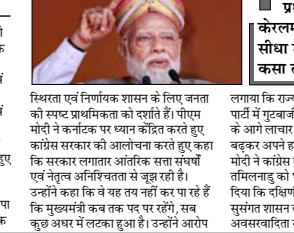
प्रधानमंत्री ने कर्नाटक, केरलम एवं तमिलनाडु का सीधा उदाहरण देते हुए कसा तंज

वेणुगुड, वार्ता प्रधानमंत्री नरेंद्र मोदी ने रिवरका को कांग्रेस पर तीखा प्रहार करते हुए 'यहाँ एक जनसभा में विस्थापना अस्थिरता पर व्यापक चर्चा की और जनता, केरल एवं तमिलनाडु को शांति सदाचार देते हुए कांग्रेस को सैन्य संघर्षी विचलितकों एवं आंतिक विरोधियों को उन्मत्त किया।