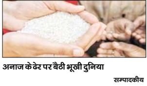
अनाज के ढेर पर बैठी भूखी दुनिया सम्पादकीय