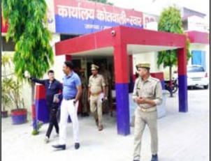
टीएन एस केश, मेस व विवेचना कक्ष को चीक कर सम्बन्धित को आवश्यक दिशा निर्देशित किए गए।