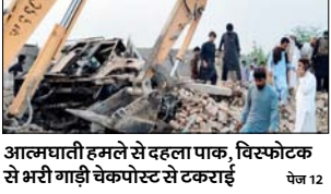
आत्मघाती हमले से दहला पाक, विस्फोटक से भरी गाड़ी चेकपोस्ट से टकराई पेज 12