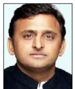
-अखिलेश यादव, अध्यक्ष, समाजवादी पार्टी

उप्र में मंत्रिपरिषद विस्तार में मुख्यमंत्री की कोई भूमिका नहीं रह गई है और फंसले ऊपर से आने वाली परिचयों के आधार पर हो रहे हैं, समय बिताने के लिए करना है कुछ काम, वैसे भी मंत्रिमंडल के विस्तार में तो इनका कोई काम है नहीं, उधर से पच्ची आगरी, यहां तो सिर्फ पढ़ी जाएगी, भाजपा राज में वैसे भी सीएम का मतलब बस यही रह गया है, कूरियर मैसेंजर, जनता पूछ रही है कि फिल्म सबसे आगे बैठकर देखेंगे या पीछे बैठकर साथ ही उन्होंने यह भी कहा कि फिल्म ध्यान से देखिएगा, हो सकता है कर्मफल-कंसफल का सिद्धांत समझ में आए और कुछ सकारात्मक बदलाव देखने को मिले, मूल रूप से व्यक्ति नहीं, बल्कि उसका लालच और लोभ बुरा होता है, जो दुराचरण का रूप ले लेता है।