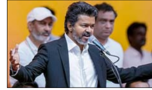
नौ अन्य मंत्री भी मंत्रिमंडल में शामिल, सभी ने तमिल भाषा में ईश्वर के नाम पर शपथ ग्रहण की

चेन्नई, वार्ता तमिलनाडु की राजनीति में एक नया अध्याय लिखते हुए, नवगठित पार्टी 'तमिलना वेंडी कणम' (टीवीके) के संस्थापक और अभिनेता-राजनेता सी. जोसेफ विजय ने रिवरका को राज्य के 13वें मुख्यमंत्री के रूप में शपथ ली। उन्होंने इस राज्य में कई दसकों से शासन की बागडोर संभालते वाले व्हालेंद्र प्रदीप मुनिर कणम (द्रमुक) और अनादम कणम को हरा कर यह मुकाम हासिल किया। उन्होंने चुनाव में शांतिपूर्ण प्रदर्शन करते हुए इन दोनों पार्टियों के लगभग 60 साल पुराने एकाधिकार को समाप्त कर दिया। विजय सुबह करीब दस बजे, जवाहरलाल नेहरू इन्डोर स्टेडियम में भव्योजित एक सारं समाारोह