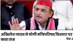
अखिलेश यादव ने योगी मंत्रिपरिषद विस्तार पर कसा तंज पेज 2

नई दिल्ली, मुजफ्फरनगर, देहरादून, हदरामी, मुद्राबाद, बोली, मेरठ व लखनऊ से प्रकाशित