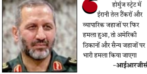
होर्मुज स्ट्रेट में ईरानी तेल टैंकरों और व्यापारिक जहाजों पर फिर हमला हुआ, तो अमेरिकी ठिकानों और सैन्य जहाजों पर भारी हमला किया जाएगा -आईआरजीसी