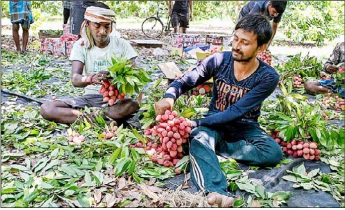
पश्चिम बंगाल। नाटिया में गर्मी के दिन बाजार में भोजन से पहले तोड़ी गई लीटियों को छांटते किसान।

फ्रांस के नीस में गोलीबारी में दो लोगों की मौत, छह घायल नीस। फ्रांस के नीस शहर में सोमवार को हुई गोलीबारी में दो लोगों की मौत हो गई और छह अन्य घायल हो गए। रिबेरा शहर के मेयर ने बताया कि यह घटना नशीले पदार्थों से जुड़ी थी। दक्षिण-पूर्वी आल्प्स-मैरिटाइम्स विभाग के प्रशासन ने बताया कि गोलीबारी शुरू हो गई, जिसके परिणामस्वरूप दो लोगों की मौत हो गई, तीन लोगों को हल्की चोटें आईं और तीन लोग गंभीर रूप से घायल हो गए। नीस के मेयर एरिक सियोटी ने बताया कि गोलीबारी 'प्लेस डेस अमेरिलिस' में हुई। यह मोलिनस जिले का एक चौक है, जो नशीले पदार्थों से जुड़े अपराधों के लिए बदनाम है। उन्होंने नशीले पदार्थों के खिलाफ जंग छेड़ने का आह्वान किया।