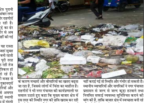
के कारण मच्छरों और बीमारियों का खतरा बढ़ता जा रहा है, जिससे लोगों में चिंता का माहौल है। राहगीरों ने भी नगर पंचायत को कागजगोली पर सवाल उठाते हुए कहा कि मुख्य बाजार क्षेत्र में इस तरह की स्थिति नगर को छत्र छत्रावण कर रही है। लोगों का कहना है कि यदि समय रहते सफाई नहीं करवाई गई तो स्थिति और गंभीर हो सकती है। स्थानीय व्यापारियों और नागरिकों ने नगर पंचायत प्रशासन से जल्द से जल्द कूड़ा हटाने तथा नियमित सफाई व्यवस्था सुनिश्चित करने की मांग की है, ताकि बाजार क्षेत्र में स्वच्छता बनी रहे और लोगों को राहत मिल सके।

शाहबाद। नगर के स्वतंत्र बाजार क्षेत्र पुरानी तहसील के सामने इन दिनों गंदगी का अंबार लगा हुआ है, जिससे स्थानीय व्यापारियों और राहगीरों में भारी नाराजगी देखने को मिल रही है। कान्तवाली के निफ्ट कट्टे दिनों से कूड़े का ढेर जमा है, जिसे नगर पंचायत की ओर से अब तक सफाई की कोई प्रभावी व्यवस्था नहीं की गई है। स्थानीय दुकानदारों का कहना है कि यह रास्ता नगर के प्रमुख बाजारों में शामिल है, जहाँ सुबह से देर शाम तक लोगों की आवाजाही बनी रहती है। इसके बावजूद सफाई व्यवस्था पूरी तरह बहाल नजर आ रही है। कूड़े से उठ रही तेज दुर्गंध के कारण दुकानों पर बैठना मुश्किल हो गया है और ग्राहक भी प्रभावित हो रहे हैं। व्यापारियों का कहना है कि गंदगी को बहाल से उनके व्यापार को भी असर पड़ रहा है। दुकानदारों ने बताया कि कूड़े का ढेर सफाई कर्मचारियों और संबंधित अधिकारियों को समस्या से अवगत कराया गया, लेकिन अभी तक कोई स्थायी समाधान नहीं निकला। यमों के मौसम में गंदगी