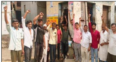
शाह टाइम्स संवाददाता हसनपुर। ग्राम भदौरा में पिछले एक माह से पेयजल आपूर्ति ठप होने के कारण ग्रामीणों का धैर्य जागृत हो गया। जल जीवन मिशन के तहत हो रही