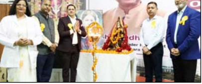
शाह टाइम्स संवाददाता अमरोहा। श्री वेकेंडश्वरा विश्वविद्यालय में अंतर्राष्ट्रीय नर्सस दिवस पर राष्ट्रीय सेमिनार, ओथ सेमिनारों में नर्सस समान समारोह का आयोजन किया गया। कार्यक्रम में अवर नर्सस-अवर प्रभार, एमपीओ नर्सस-सेल्स लीडर। विषय पर सौगोठी आयोजित हुई। जिसमें नर्सस प्रोफेशनल की महत्ता और स्वास्थ्य सेवाओं में उसकी भूमिका पर विस्तार से चर्चा की

अंतर्राष्ट्रीय नर्सस दिवस पर वेकेंडश्वरा में राष्ट्रीय सेमिनार