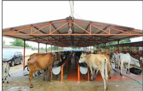
आश्रय स्थलों तक पहुंचाया जाना काफ़ी है। सड़क बिना गोवंश संरक्षण में सबसे आगे, जहाँ 27,768 गोवंश संरक्षित किए गए। विकीनर में 3,259 गोवंशों को आश्रय मिला है। अमरौहा में 6,647 और रामपुर में 14,658, मुरादाबाद में 10,781, गोवंशों के भरण-पोषण के लिए

शाह टाइम्स ब्यूरो रामपुर। मुरादाबाद मंडल में बेसहारा और निर्वासित गोवंशों के संरक्षण को दिशा में प्रशासन द्वारा व्यापक स्तर पर कार्य किया जा रहा है। आबुतन और अन्य कृषक विहारी को आबुतन में आगोशित समीक्षा बैठक में सामने आये आबुतन के अनुसर मंडल के 218 गो आश्रय स्थलों में कुल 65,113 गोवंशों को सुरक्षित आश्रय दिया गया है।