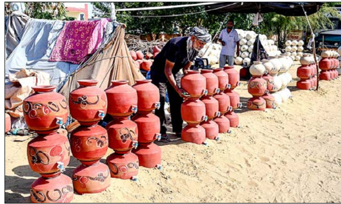
बीकानेर। राजस्थान में गर्मी के दिनों में मिट्टी के बर्तनों को बिक्री के लिए सजाता विक्रेता।

तेहरान। ईरान की लगभग नौ करोड़ की आबादी पिछले दो महीनों से इंटरनेट पर भारी पाबंदियों का सामना कर रही है। यह 'ब्लैकआउट' दुनिया के सबसे लंबे और सख्त प्रतिबंधों में से एक बन गया है, जिसने देश की ऑनलाइन अर्थव्यवस्था को पूरी तरह तबाह कर दिया है। इंटरनेट बंद होने का सबसे बुरा असर छोटे और मध्यम उद्योगों पर पड़ा है। फेशन, फिटनेस, विज्ञापन और खुदरा व्यापार जैसे क्षेत्रों से जुड़े कारोबारियों की आय पूरी तरह खत्म हो गई है। गौरतलब है कि ईरान की ऑनलाइन अर्थव्यवस्था ने लंबे समय तक सरकारी पाबंदियों और अंतर्राष्ट्रीय प्रतिबंधों के बावजूद खुद को संभाला रखा था लेकिन अब यह चरमराम पर है। अमेरिका और इजरायल के साथ हुए अस्थिर और नाजुक समझौते के बावजूद, ईरान के शासकों ने इंटरनेट सेवा बहाल करने से इनकार कर दिया है।