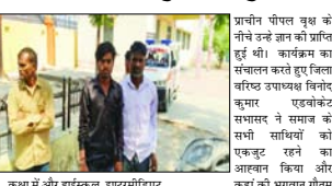
कक्षा में और हाईस्कूल, इंटरमीडिएट व अन्य उच्च स्तरीय परीक्षा में अच्छे अंक के प्रथम श्रेणी में उत्कृष्ट प्रदर्शन करते हुए मजदूरों को प्रोत्साहित करने व प्रेरणा प्रदान करने के लिए कई कानून बनाए गए हैं। इनमें न्यूनतम वेतन अधिनियम, औद्योगिक विवाद अधिनियम, श्रमिकों अधिनियम और हकान के श्रम संहिता (लैबर कोडर) शामिल हैं। इन कानूनों का उद्देश्य श्रमिकों को उचित वेतन, सुरक्षित कार्य वातावरण और सामाजिक

शाह टाइम्स संवाददाता रामपुर। श्रद्धांजलि को चौकी हाथियों विभिन्न लक्षण मनुआ समाज के जिला कार्यालय पर आयोजित हुए बुद्ध प्रतिमा के शुभ अन्वेषण पर भाग्यवान हुए जो यह कार्य हुए सर्वप्रथम संगठन सभी उपस्थित कार्यकर्ताओं व काका ब्रह्मचारी के द्वारा भाग्यवान बुद्ध के चित्र पर दीप जलाकर कर पुण्य अर्पित किए गए।