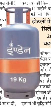
इंधन 19 Kg

शह टाइम्स ब्यूरो नई दिल्ली। देश में सरकारी तेल विपणन कंपनियों ने कमर्शियल रसोई गैस (एलपीजी) सिलेंडर की कीमतों में भारी बढ़ोतरी की है। होटलों और रेस्त्राओं में आमतौर पर इस्तेमाल होने वाले कमर्शियल एलपीजी सिलेंडर की कीमत में एक ही झटके में 993 रुपये की बढ़ोतरी एक रिपोर्ट है। स्थानीय करों को मिलाकर दिल्ली में इसकी कीमत अब 2,078.50 रुपये से बढ़कर 3,071.50 रुपये हो गई है। गत 28 फरवरी को पश्चिम एशिया संकट शुरू होने के बाद से अब तक कमर्शियल रसोई गैस सिलेंडर के दाम में यह चौथी बढ़ोतरी है। इससे पहले, एक अप्रैल को 195.50 रुपये, सात मार्च को 114.50 रुपये और एक मार्च को 28 रुपये प्रति सिलेंडर की बढ़ोतरी हुई थी। इसके साथ ही, दाम में भी वृद्धि सीमित रखी गई है।