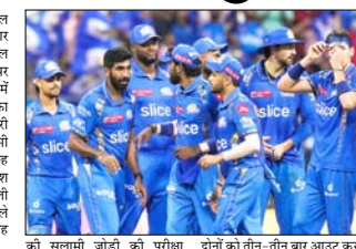
मुंबई के लिए यह मैच आखिरी उम्मीद बनाए रखने वाला मैच है जबकि एक जीतने वाली कोशिश को होरे में समाप्त रखेगी। बुरमगार और चोट लेने सीएसके

चेन्नई, वार्ता। आईपीएल 2026 के 44वें मैच में एक बार फिर दो पुराने राइवल आमने-सामने होंगे। चेन्नई सुपर किंग्स (सीएसके) अपने घर में मुंबई इंडियंस (एमआइए) का सामना करेगी और सीजन में दूसरी बार उन्हें हराने की कोशिश करेगी। एस सीजन अंत में से छह मैच गंवा चुकी मुंबई की कोशिश करेगी कि अपने घर में मिली क्राइस को बरतना चेकमेंट से जाए। हालांकि, उनके लिए यह आसान नहीं होने वाला है। मुंबई के लिए यह मैच आखिरी उम्मीद बनाए रखने वाला मैच है जबकि एक जीतने वाली कोशिश को होरे में समाप्त रखेगी। बुरमगार और चोट लेने सीएसके