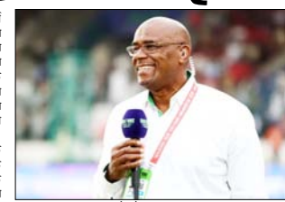
इयान बिशप ने क्रिकेटर्स को स्टीवेंस में अभिनव मुकुंद के साथ होल्डर के कैच पर चर्चा के दौरान यह बात कही। उन्होंने कहा कि इस बारे में मेरी बहस इस चीज पर होगी: जेसन होल्डर ने पहले ही कैच खड़े होने की कोशिश करने के बाद उनका हाथ स्लाइड कर रहा था तो उस पर विरोधा ध्यान दिया जाना चाहिए था। इसके बाद हाथ

अहमदाबाद, वार्ता। पूर्व क्रिकेटर और कमेंटेटर इयान बिशप का मानना है कि गुजरात टाइटंस (जीटी) और रॉयल चैलेंजर्स बेंगलूर (आरसीबी) के बीच गुरुवार की रात खेले गए मैच में जेसन होल्डर द्वारा रजत पटेलीर का पकड़ा गया कैच पूरी तरह वैध नहीं था। इयान बिशप ने क्रिकेटर्स को स्टीवेंस में अभिनव मुकुंद के साथ होल्डर के कैच पर चर्चा के दौरान यह बात कही। उन्होंने कहा कि इस बारे में मेरी बहस इस चीज पर होगी: जेसन होल्डर ने पहले ही कैच खड़े होने की कोशिश करने के बाद उनका हाथ स्लाइड कर रहा था तो उस पर विरोधा ध्यान दिया जाना चाहिए था। इसके बाद हाथ