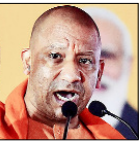
श्रमवीर गौर कार्यक्रम में बोले सीएम पहले होता था श्रमिकों का शोषण, अब नहीं

लखनऊ। अंतर्राष्ट्रीय मजदूर दिवस के अवसर पर मुख्यमंत्री योगी आदित्यनाथ ने श्रमिकों के हितों को लेकर सख्त रुख अपनाते हुए फैक्ट्री मालिकों और ठेकेदारों को स्पष्ट चेतावनी दी। उन्होंने कहा कि अब श्रमिकों से काम लेकर भुगतान में डालमटोल या कटौती बंद कर दी जाएगी। उन्होंने कहा कि यदि श्रमिक काम करना मना कर दें, तो उसे उसका पूरा काम मिलना ही चाहिए, अन्यथा सरकार सख्त कार्रवाई करेगी।