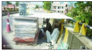
फेसला किया गया। तब से यह दिन शैथिल्य स्तर पर श्रमिकों के अधिकारों के सम्बन्ध में मनाया जाने लगा।

शाह टाइम्स संवाददाता रामपुर। अंतर्राष्ट्रीय मजदूर दिवस हर साल 1 मई को दुनिया भर में मनाया जाता है। यह दिन उन मेहनतकश लोगों को समर्पित है, जिनकी कड़ी मेहनत से हमारे जीवन और अर्थव्यवस्था को जीवंत मजबूत रहता है। मजदूर दिवस सिर्फ एक औपचारिक उत्सव नहीं, बल्कि यह श्रमिकों के अधिकारों, उनके संघर्षों और उनकी उपलब्धियों का प्रतीक भी है। यह दिन हमें यह दिलाता है कि आज जो आम काम, कार्य के पेटे और बेतन को व्यवस्था हमें सबक लाती है, उनके पीछे कितनी कठिन परिश्रम है।