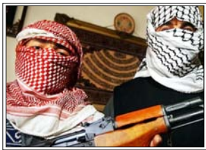
पाक सरकार पश्चिमी देशों के करीब जा रही है, जिससे क्षेत्रीय हित प्रभावित हो रहे हैं: अल कायदा

इस्लामाबाद। पाकिस्तान ईरान और अमेरिका के बीच मध्यस्थता कराने की कोशिश में घरेलू मोर्चे पर धिरता जा रहा है। दरअसल खुफिया रिपोर्टों में पता चला है कि खूंखार आतंकी संगठन अल-कायदा, पाकिस्तान में अशांति भड़काना चाहता है और उसने इसकी कोशिशें भी शुरू कर दी हैं।