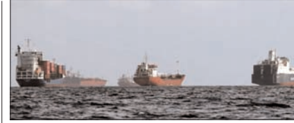
होर्मुज स्ट्रेट में 90 प्रतिशत घटी जहाजों की आवाजाही