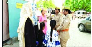
मिशन शक्ति अभियान के तहत फिर पुलिस ने किया जागरूक

शाह टाइम्स संवाददाता रामपुर। महिलाएं और बालिकाएं अपने अधिकार और सुरक्षा के प्रति जागरूक होनी चाहिए। मिशन शक्ति अभियान के तहत फिर पुलिस ने किया जागरूक