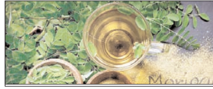
शरीर पर चढ़ाना है मांस, तो मोरिंगा के पत्तों का करें इस्तेमाल