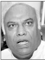
-मल्लिकार्जुन खड़गे, अध्यक्ष, कांग्रेस

बढ़ती बेरोजगारी सरकार की नीतियों का परिणाम है और सरकार ने जो श्रम संहिता लागू की है, उससे कामगारों की स्थिति कमजोर हुई है, इसके अलावा ठेका श्रमिक व्यवस्था तथा हायर एंड फायर जैसी नीतियों को बढ़ावा दिया गया है, इन श्रम कानूनों को समीक्षा की जानी चाहिए, मनरेगा को कमजोर कर दिया गया है और मजदूरी के खर्च का बड़ा हिस्सा राज्यों पर डाल दिया गया है, जिससे राज्यों के लिए योजना को प्रभावी ढंग से चलाना कठिन हो गया है, सरकार की नीतियों के कारण श्रमिकों को असंगठित और गिग कार्य की ओर धकेला जा रहा है, जहां बड़ी संख्या में लोग न्यूनतम मजदूरी से कम पर काम करने को मजबूर हैं, महंगाई को ध्यान में रखा जाए तो पिछले वर्षों में मजदूरी वृद्धि बहुत कम रही है।