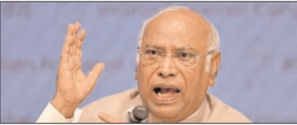
केन्द्र सरकार मनरेगा को बहाल करे और न्यूनतम मजदूरी बढ़ाए: खड़गे

नई दिल्ली, मुजफ्फरनगर, देहरादून, हल्द्वानी, मुतादाबाद, बरेली, मेरठ व लखनऊ से प्रकाशित