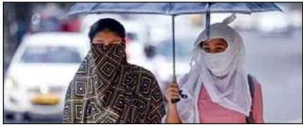
उत्तर प्रदेश में प्रचंड गर्मी से आम जनजीवन प्रभावित

नई दिल्ली, मुजफ्फरनगर, देहरादून, हल्द्वानी, मुरादाबाद, बरेली, मेरठ व लखनऊ से प्रकाशित