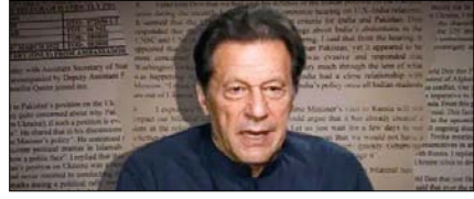
अमेरिकी साजिश थी इमरान खान का तख्तापलट