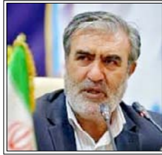
द टेलीग्राफ की रिपोर्ट के मुताबिक 500 करोड़ से ज्यादा का इनाम दे सकता है ईरान ईरानी संसद का राष्ट्रीय सुरक्षा आयोग इस बिल को तैयारी कर रहा है

तेहरान/वाशिंगटन। ईरान की संसद अमेरिकी राष्ट्रपति डोनाल्ड ट्रम्प और इजराइली प्रधानमंत्री बेंजामिन नेतन्याहू की हत्या करने वालों को 500 करोड़ से ज्यादा इनाम देने वाला बिल ला सकती है। द टेलीग्राफ की रिपोर्ट के मुताबिक, ईरानी संसद का राष्ट्रीय सुरक्षा आयोग इस बिल को तैयारी कर रहा है। आयोग के प्रमुख इब्राहिम अजीजी ने कहा कि 'इस्लामिक रिपब्लिक की सैन्य और सुरक्षा बलों की जवाबी कार्रवाई' नाम से बिल तैयार किया जा रहा है। ईरानी संसद महमूद नवाविजन ने कहा कि संसद जल्द इस बिल पर वॉटिंग कर सकती है, जो ट्रम्प और नेतन्याहू को जहन्यम पहुंचाने वालों को इनाम देगा। रिपोर्ट में कहा गया है कि ईरान के सर्वोच्च