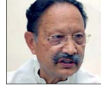
काफी समय से मैक्स अस्पताल में चल रहा था इलाज, सीएम धामी ने जताया दुख

भारतीय सेना से मेजर जनरल के पद से रिटायर्ड हुए थे और