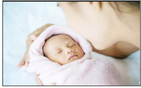
योगी सरकार ने जारी किया नया आदेश