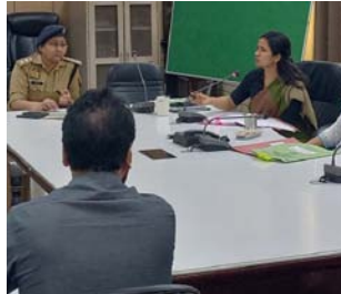
नाराजगी जाता है, कड़ा कि प्लास्टिक वेस्ट मैनेजमेंट पर्यावरण संरक्षण अधिनियम को अनुपूर

विभागीय अधिकारियों को 2026-27 की वार्षिक कार्ययोजना को समीक्षा करते हुए सभी संबंधित विभागों को आवंटित लक्ष्य के