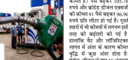
पेट्रोल 98.64 व डीजल 91.58 रुपये में एक लीटर मिलेगा

नई दिल्ली। राष्ट्रीय राजधानी दिल्ली में मंगलवार से पेट्रोल 87 पैसे और डीजल 91 पैसे प्रति लीटर महंगा हो गया। तेल विपणन कंपनियों ने पांच दिन में दूसरी बार दोनों ईंधनों के दाम बढ़ाए हैं। इससे पहले, 15 मई को पेट्रोल-डीजल के मूल्य में तीन-तीन रुपये की वृद्धि की गई थी। देश की सबसे बड़ी तेल विपणन कंपनी इंडियन ऑयल कॉर्पोरेशन से प्राप्त जानकारी के अनुसार, दिल्ली में मंगलवार से पेट्रोल की कीमत 87 पैसे बढ़कर 98.64 रुपये प्रति लीटर हो गई है। डीजल भी 91 पैसे महंगा हुआ। अब एक लीटर डीजल 91.58 रुपये का मिलेगा। देश की वाणिज्यिक राजधानी मुंबई में पेट्रोल की कीमत 91 पैसे और डीजल की 94 पैसे बढ़ी है। वहां अब पेट्रोल 107.59 रुपये का और डीजल 94.08 रुपये का हो गया है। चेन्नई में पेट्रोल 82 पैसे और डीजल