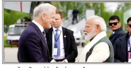
व्यापार और संस्थागत सहयोग के तहत भी कई महत्वपूर्ण समझौतों को अंतिम रूप दिया गया

ओस्लो। भारत और नार्वे ने द्विपक्षीय संबंधों को नई दिशा देते हुए अपने संबंधों को ग्रीन स्ट्रेटजिक पार्टनरशिप के स्तर तक उन्नत करने के साथ-साथ समुद्री सहयोग, हरित प्रौद्योगिकी, अंतरिक्ष, स्वास्थ्य, डिजिटल विकास और वैज्ञानिक अनुसंधान सहित कई क्षेत्रों में सहयोग को मजबूत करने के उद्देश्य से नौ समझौतों और तीन पहलों की घोषणा की है।