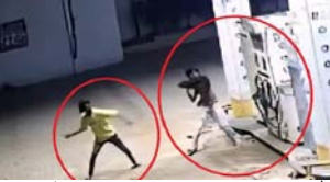
सामान को निशाना बनाकर तोड़फोड़ कर रहे हैं। घटना के बाद हमलावर मौके से फरार हो गए। इसक बाद कर्मचारियों ने तलाक डाक्यू 112 पर कॉल कर पुलिस को सूचना दी। पुलिस ने विभागीय के आधार पर मुकदमा दर्ज कर लिया है और सोसिटीयों के अध्यक्ष पर आरोपों को गिरफ्तार कर लिया जाएगा।