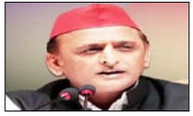
सीएम योगी के नमाज वाले बयान पर पहली प्रतिक्रिया

लखनऊ, वार्ता सपा के राष्ट्रीय अध्यक्ष और यूपी के पूर्व सीएम अखिलेश यादव ने मुख्यमंत्री योगी आदित्यनाथ के नमाज वाले बयान पर कहा कि सड़कों पर क्या होना चाहिए और क्या नहीं, इसके लिए नियम-कानून बने हुए हैं, लेकिन इस मुद्दे पर राजनीतिक लाभ लेने की कोशिश नहीं होनी चाहिए। उन्होंने भाजपा पर निशाना साधते हुए कहा कि अगर कोई सबसे अधर्मी पार्टी है, तो वह भाजपा है। उन्होंने कहा कि समाजवादी पार्टी सभी को साथ लेकर चलने में विश्वास करती है। अखिलेश यादव ने कहा कि हाल ही में अधिवक्ता संघ के लोग विरोध प्रदर्शन के लिए निकले थे, जिनके हाथों में रामचरितमानस थी, फिर भी उन पर लाठीचार्ज किया गया और उन्हें पीटा गया। उन्होंने कहा कि अगर भाजपा खुद