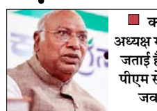
कांग्रेस अध्यक्ष खड़गे ने जताई हैरानी, पीएम से मांगा जवाब

नई दिल्ली, वार्ता कांग्रेस अध्यक्ष मल्लिकार्जुन खड़गे ने चार दिन के भीतर दूसरी बार पेट्रोल और डीजल के दाम बढ़ाए जाने के सरकार के फैसले पर हैरानी जताते हुए कहा है कि प्रधानमंत्री नरेंद्र मोदी को इस बारे में जनता को जवाब देना चाहिए। खड़गे ने मंगलवार को सोशल मीडिया प्लेटफॉर्म 'एक्स' पर कहा कि सरकार ने 15 मई के बाद आज सुबह अचानक फिर पेट्रोल और डीजल के दाम बढ़ा दिए। उन्होंने कहा कि अब स्पष्ट हो गया है कि देश संकट में है और श्री मोदी को इसका जवाब देना चाहिए। कांग्रेस अध्यक्ष ने तेल के दाम चार दिन में दूसरी बार बढ़वाने के निर्णय को सरकार का गलत नीतियों का परिणाम बताया और कहा कि मोदी सरकार नाकामियों का बोझ जनता के सिर पर डाल रही है। उन्होंने कहा कि दाम बढ़े चार ही दिन हुए कि मोदी सरकार ने पेट्रोल-डीजल के दाम फिर बढ़ा दिए। पूरी भूमिका बनाकर, जबतक का उपदेश देकर अपनी नाकामियों का बोझ जनता पर डालने का कार्य प्रगति पर है। कांग्रेस अध्यक्ष ने आरोप लगाते हुए कहा कि 'आम जनता को लूट और उद्योग पति गौतम अडानी को अमेरिका से छूट', यही मोदी जी का 'कम्प्लाइड मॉडल' है। प्रधानमंत्री ने अमेरिका से हाथ-पैर जोड़कर रूसी तेल खरीदने की अनुमति की अवधि एक महीने के लिए बढ़वाई है और इससे देश के स्वाभिमान को ठेस पहुंचे है। उन्होंने कहा कि यदि सरकार के अनुसार रूसी तेल खरीदने की अनुमति मिल गई है, तो पेट्रोल-डीजल की कीमतों का बोझ आम जनता पर क्यों डाला जा रहा है। खड़गे ने आरोप लगाया कि भारतीय जनता पार्टी में दूदरिंश और नेतृत्व की कमी है।