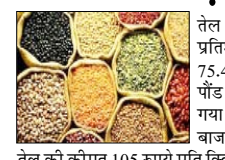
तेल वायदा 0.29 प्रतिशत टूटकर 75.45 सेंट प्रति पौंड के भाव बोला गया। स्थानीय बाजारों में सरसों तेल की कीमत 105 रुपये प्रति क्विंटल बढ़ गई। पाम ऑयल 87 रुपये और मूंगफली तेल 45 रुपये महंगा हुआ। सोया तेल का भाव 27 रुपये और वनस्पति का 25 रुपये बढ़ गया। वहीं सूरजमुखी तेल 27 रुपये प्रति क्विंटल फिकल गया। मोटे के बाजार में आज गूड़ का औसत भाव 13 रुपये प्रति क्विंटल टूट गया, जबकि चीनी तीन रुपये महंगी हुई। सरकारी वेबसाइट पर जारी खाद्यान्नों के दिन के औसत थोक भाव इस प्रकार रहे: दाल-दलहन: दाल चना 7677.12 रुपये, मसूर काली 8132.72 रुपये, मूंग दाल 10161.78 रुपये, उड़द दाल 10844.96 रुपये, तुअर दाल 11253.53 रुपये प्रति क्विंटल रही।

नई दिल्ली, वार्ता घरेलू थोक जिन बाजारों में मंगलवार को चावल की औसत कीमत बढ़ गई। चावल के साथ गेहूं, चीनी और दालों में भी तेजी रही। वहीं खाद्य तेलों में उतार-चढ़ाव का रुख देखा गया। औसत दर्जे के चावल की औसत कीमत सात रुपये बढ़कर 3,871 रुपये प्रति क्विंटल पर पहुंच गई। गेहूं आठ रुपये महंगा हुआ और 2,784 रुपये प्रति क्विंटल बोला गया। आटा 15 रुपये मजबूत हुआ। दाल-दलहनों के भाव भी बढ़ गए। उड़द दाल और मूंग दाल के दाम 15.15 रुपये प्रति क्विंटल बढ़े। चना दाल में पांच रुपये की तेजी रही। तुअर दाल और मसूर दाल की कीमतें पिछले कारोबारी दिवस के स्तर पर ही पड़ी रहीं। मलेशिया के बुरसा मलेशिया डेरिवेटिव एक्सचेंज में पाम ऑयल का अगस्त वायदा 53 रिगिट चढ़कर 4,587 रिगिट प्रति टन पर पहुंच गया। वहीं जुलाई का अमेरिकी सोया