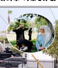
दोनों के शव मस्जिद के पास एक वाहन में मिले, शुरुआती जांच में माना जा रहा है कि उन्होंने खुद को गोली मारी

वाशिंगटन। अमेरिका के सैन डिएगो स्थित मस्जिद में गोलीबारी में 5 लोगों की मौत हो गई। इनमें एक सिक्सोरीटी गार्ड और दो संदिग्ध शामिल हैं। पुलिस के मुताबिक, दोनों संदिग्ध किशोर थे। एक की उम्र 17 साल और दूसरे की 19 साल थी।