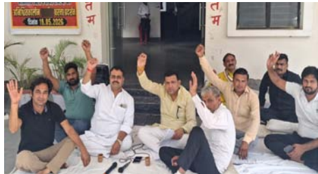
प्रकरण की निष्पत्ति जांच कराई जाए और जांच पूरी होने तक संबंधित अधिकारी को पदमुक्त