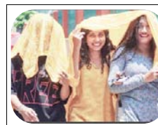
गर्म हवा के थपेड़े से लोग बेहाल दिखाई दे रहे हैं, सुबह 11 बजे से शाम चार बजे तक घर से बाहर न निकलने की सलाह दी

शाह टाइम्स ब्यूरो लखनऊ। उत्तर प्रदेश समेत समूचे उत्तर भारत में प्रचंड गर्मी और लू के थपेड़ों ने आम जनजीवन को अस्त-व्यस्त कर दिया है। मौसम विभाग ने मंगलवार को जारी पूर्वानुमान में अगले सात दिनों तक प्रदेश के अधिकांश हिस्सों में हीटवेव से लेकर सीवियर हीटवेव चलने की चेतावनी जारी की है। राजधानी लखनऊ समेत पूर्वांचल और बुंदेलखंड के जिलों में दिन का तापमान 44 से 46 डिग्री सेल्सियस के बीच पहुंच गया है, जबकि रात में भी गर्म हवाओं के कारण लोगों को राहत नहीं मिल रही है। प्रदेश के अधिकांश जिलों में कक्षा आठ तक के स्कूलों में गर्मी को छुट्टियां कर दी गई हैं। मौसम के तल्लू तेवरों के बीच सरकारी और निजी अस्पतालों के बाह्य रोगी विभाग (ओपीडी) में भीड़ बढ़ गई है। चिकित्सकों ने लोगों से पर्याप्त मात्रा में पेय पदार्थों का सेवन करने और सुबह 11 बजे से शाम चार बजे तक बाहर न निकलने की सलाह दी है। हृदय रोगियों से अपील की गई है कि वे डाकरी परामर्श से लगे रहें और नियमित सेना करें और अपरिहार्य स्थितियों में मेडिकल स्टोर का