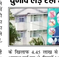
चुनाव लड़ रहा उम्मीदवार बोला: भारतीय मजदूरों को भगाओ