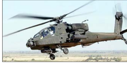
भारतीय सैन्य ताकत होगी और मजबूत

वाशिंगटन, वार्ता भारत और अमेरिका के बीच रक्षा सहयोग लगातार मजबूत होता जा रहा है। इसी कड़ी में अमेरिका ने भारत को अपाचे हेलीकॉप्टर और एम777ए2 अल्ट्रा-लाइट हॉवित्जर तोपों के लिए सपोर्ट सर्विस और संबंधित उपकरणों की संभावित बिक्री को मंजूरी दे दी है।