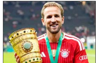
बर्लिन, बार्ता। हरी केन ने दूसरे हाफ में हेट्टिक जमाई, जिसमें बायर्न म्यूनिख ने शनिवार को बर्लिन में हुए फाइनल में बोरफोर्न स्ट्रेटार्ड को 3-0 से हराकर डीएफबी-पोकल (जर्मन कप) जीते का अपना लंबा इंतजार खत्म कर दिया। एक और कप जीत को लताएं में उतरे स्ट्रेटार्ड ने मैच को शुरुआत जोरदार तरीके से की और पहले हाफ के ज्यादा समय तक बार्नम को डेकेंडेट पर रखा। मैच शुरू होने से दो मिनट के भीतर ही डीनिंग उंडवय ने फिर से गेंद को सही जोनास अर्बिंग को उठाया, इसके बाद दो बार्न, इनके के एक डील पास का फायदा उठाते हुए एंजेलो रिटलर

ए और एक जीत की लड़ाई में उतरे स्ट्रेटार्ड ने मैच की शुरुआत जोरदार तरीके से की।