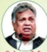
भिलो क लखौ जी राष्ट्रीय लोकदल संस्थापक