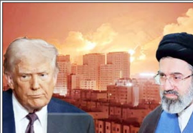
ट्रम्प सरकार ने ईरान वार्ता में इजरायल की भूमिका सीमित कर दी, जिससे प्रधानमंत्री नेतन्याहू को बड़ा राजनीतिक झटका लगा

तेहरान। ईरान ने साफ कर दिया है कि वह अपना हाईली एनरिचड यूरेनियम भंडार अमेरिका को नहीं सौंपेगा। रायटर्स के मुताबिक, एक सीनियर ईरानी अधिकारी ने कहा है कि मौजूदा शुरुआती समझौते में परमाणु मुद्दा शामिल ही नहीं है।