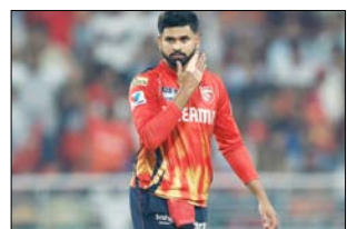
लखनऊ, बार्ता। यह कना मुश्किल है कि श्रेयस अय्यर ने खुद को ऐसा बनाया है या यह स्वाभाविक रूप से उनके व्यक्तित्व का हिस्सा है, लेकिन वह मैदान पर बेहद शांत और भावनाओं पर काबू रखने वाले खिलाड़ी हैं और कप्तान नजर आते हैं। पचास बाले सहीरी में यह एक बड़े खुशी मानी जाते हैं।

अय्यर ने श्रेयस को साव-साध भावनाएं भी सुलकर जाहिर कीं। कप्तान आचर ने इस सीजन की लगातार बहतर बल्लेबाजी की।