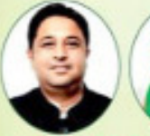
चन्दन चौहान जी राज्य, विधायक