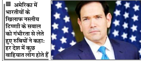
अमेरिका में भारतीयों के खिलाफ नस्लीय टिप्पणियों के सवाल को गंभीरता से लेते हुए रुबियो ने कहा: हर देश में कुछ वाहियात लोग होते हैं।

नई दिल्ली। अमेरिका के विदेश मंत्री मार्को रुबियो ने ट्रम्प सरकार की नई वीजा नीति का बचाव करते हुए कहा है कि अमेरिका में आब्रजन नीति सुधार और आधुनिकीकरण के दौर से गुजर रही है और यह केवल भारतीयों के लिए नहीं बल्कि दुनिया भर के लिए है।