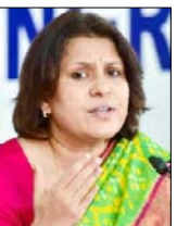
सुप्रिया श्रीनेत, चेयरमैन, कांग्रेस सोशल मीडिया विभाग

उप्र के सभी 75 जिलों में बिजली कटौती से विकराल स्थिति उत्पन्न हो गई है, जनता तकलीफें झेलने को मजबूर है, देश के 50 सबसे गर्म शहरों में से 26 शहर उत्तर प्रदेश के हैं, लेकिन भीषण गर्मी के बीच लोगों को 24 घंटे में केवल सात-आठ घंटे ही बिजली मिल पा रही है, मेरठ से लेकर बलिया तक लोग बिजली संकट से परेशान हैं और कई जगहों पर लोग रात में घरों से निकलकर सड़कों पर सोने को मजबूर हैं, राजधानी लखनऊ तक में घंटों बिजली गुल रहने से अस्पतालों की सेवाएं प्रभावित हो रही हैं, एक्स-रे और स्कैन जैसी सुविधाएं ठप पड़ गई हैं, कानपुर देहात के मेडिकल कॉलेज के छात्रों को देर रात तक बिजली नहीं मिलने के कारण घर पर बैठना पड़ा।