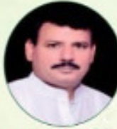
मनोज चौधरी जी वि.स.अ.स. राज्य विधायक, मुरादाबाद