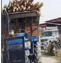
गाली-गलौज करते हुए धमकी दी तथा मौके से फरार हो गए।