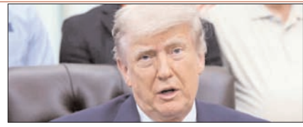
ट्रम्प की ईरान बैठक रही बेनतीजा, नहीं हो सका कोई फैसला या समझौता पेज 2