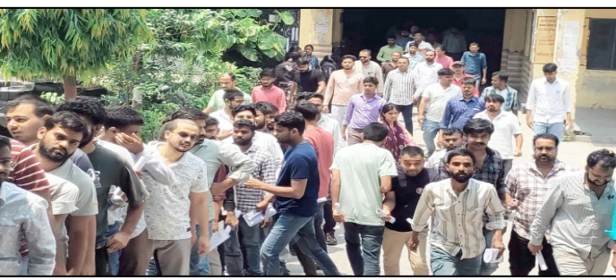
शाह टाइम्स ब्यूरो

नगर के नौ केन्द्रों पर सम्पन्न हुई परीक्षा