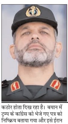
कठोर होता दिख रहा है। बयान में ट्रंप के कार्रवाई को भेजे गए पत्र को निष्क्रिय बताया गया और इसे ईरान की वार्ता शर्तों की स्वीकारोक्ति के संकेत के रूप में प्रस्तुत किया गया।

तेहरान। ईरान की इस्लामिक रिवालयनरी गार्ड कोर (आईआरजीसी) ने कहा है कि मोजुदा पश्चिम एशियाई तनाव में अमेरिका की रणनीतिक स्थिति तेजी से सीमित होती जा रही है और अमेरिकी राष्ट्रपति डोनाल्ड ट्रंप को सामने विकल्प अब बेहद कम रह गए हैं।