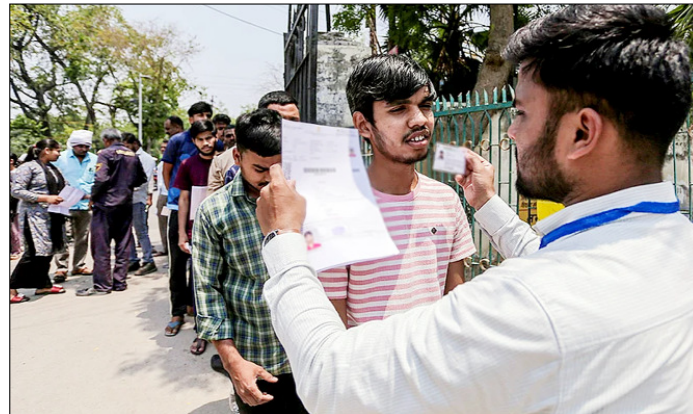
प्रयागराज। राष्ट्रीय पात्रता-सह प्रवेश परीक्षा (NEET & UG) में शामिल होने से पहले उम्मीदवारों की जांच करते हुए।

बना रहा है। सोशल मीडिया पर जारी वीडियो में बीएलए अपने हमलों को 'आजादी की लड़ाई' के रूप में पेश करता है, जिससे उसे स्थानीय युवाओं का समर्थन मिल रहा है। बलूचिस्तान में अलगाववाद की शुरुआत 1948 में पाकिस्तान के गठन के बाद हुई थी। स्थानीय लोगों का आरोप है कि उनके क्षेत्र के प्राकृतिक संसाधनों का फायदा बाहरी कंपनियों और केंद्र सरकार उठाती है, जबकि उन्हें रोजगार, शिक्षा और स्वास्थ्य जैसी बुनियादी सुविधाएं नहीं मिलतीं। इसी असंतोष के कारण शिक्षित युवाओं का एक वर्ग भी उग्रवाद की ओर झुक रहा है। बलूचिस्तान की सीमा ईरान और अफगानिस्तान से लगती है। ऐसे में इन देशों में अस्थिरता का सीधा असर इस क्षेत्र पर पड़ता है। पाकिस्तानी अधिकारियों को आशंका है कि अगर ईरान के पूर्वी हिस्से में हालात बिगड़ते हैं, तो बीएलए जैसे संगठन और मजबूत हो सकते हैं और सीमा पार से हमले बढ़ सकते हैं।