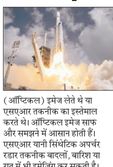
(ऑप्टिकल) इमेज लेते थे या एसएआर तकनीक का इस्तेमाल करते थे। ऑप्टिकल इमेज साफ और समझने में आसान होती हैं। एसएआर यानी सिंथेटिक अपचर रडार तकनीक बादलों, बारिश या रात में भी इमेजिंग कर सकती है।

शाह टाइम्स ब्यूरो नई दिल्ली। भारतीय स्टार्टअप गैलेक्सआई ने रविवार को अमेरिकी कंपनी स्पेसएक्स के फाल्कन 9 रॉकेट से अपना पहला सैटेलाइट 'दृष्टि' लॉन्च किया। 190 किलो वजन के साथ दृष्टि भारत का सबसे बड़ा प्राइवेट सैटेलाइट है। दृष्टि सैटेलाइट एक साथ ऑप्टिकल और रडार (एसएआर) दोनों से फोटो ले सकता है। अब तक दुनिया के सैटेलाइट या तो मल्टी-स्पेक्ट्रल/हाइपर-स्पेक्ट्रल