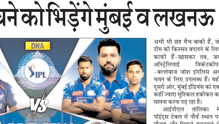
आईपीएल 2026 की तालिका में सबसे निचले स्थान पर चल रही मुंबई इंडियंस और लखनऊ सुपरजायंट्स उम्मीदों के साथ वानखेड़े स्टेडियम में आमने-सामने होगी

मुंबई। आईपीएल तालिका में सबसे निचले स्थान पर चल रही मुंबई इंडियंस और लखनऊ सुपर रजायंट्स आखिरी स्थान पर आने से बचने की उम्मीद के साथ वानखेड़े स्टेडियम में सोमवार की रात भिड़ेंगी। दोनों टीमों के चार-चार अंक हैं। मुंबई नौवें और लखनऊ दसवें स्थान पर हैं। सात दिन के ब्रेक के बाद वापसी कर रही लखनऊ सुपर जायंट्स को उम्मीद होगी कि इस आराम से उन्हें कोलकाता नाइट राइडर्स के खिलाफ मिली दिल तोड़ने वाली हार से उबरने में मदद मिलेगी। वह मैच सुपर ओवर में जाकर उनके हाथ से फिसल गया था। मोहसिन खान की शानदार गेंदबाजी (5/23) - जो इस सीजन का पहला पांच विकेट हॉल था - ने शाम को रोशन कर