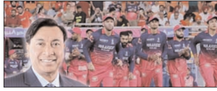
लक्ष्मी मित्तल ने राजस्थान रॉयल्स फ्रेंचाइजी को 15,660 करोड़ में खरीदा