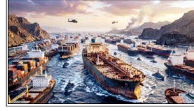
ईरानी जहाज अब एशिया-प्राशांत क्षेत्र में पहुंचा, घटना से अमेरिका की पहरेदारी पर सवाल खड़े हुए।

तेहरान। अमेरिका और ईरान के बीच लुकाछिपी खेल में एक ताजा रिपोर्ट ने विश्वभर में खलबली मचा कर रख दी है। मानिटरिंग फर्म टेकरटैकसंडाटकाम ने दावा किया है कि ईरान का एक बहुत बड़ा तेल का जहाज अमेरिकी नौसेना की सख्त नाकेबंदी को चकमा देकर बाहर निकल गया है। यह जहाज अब एशिया-प्राशांत क्षेत्र में पहुंच गया है।