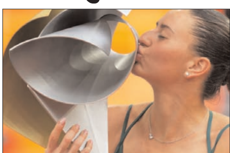
दुनिया की 23वें नंबर की खिलाड़ी ने अपनी रूसी प्रतिद्वंद्वी के खिलाफ 6-3, 7-5 से जीत हासिल की

मैड्रिड। यूक्रेन की मार्टा कोयुक ने मीरा आंद्रीवा को सीधे सेटों में हराकर मैड्रिड ओपन और डब्ल्यूटीए 1000 स्तर पर अपना पहला खिताब जीता। दुनिया की 23वें नंबर की खिलाड़ी ने अपनी रूसी प्रतिद्वंद्वी के खिलाफ 6-3, 7-5 से जीत हासिल की। इस स्तर पर अपने पहले फाइनल में जीतने के बाद, 26वीं वरीयता प्राप्त कोयुक ने कहा, 'अभी यहाँ खड़े होकर अविश्वसनीय महसूस हो रहा है। इस मुकाम तक पहुंचने में मुझे कई साल लगे, और इस समय मेरे मन में जो एक शब्द आ रहा है, वह है 'लगातार बने रहना' - हर दिन मौजूद रहना, चाहे काम कितना भी मुश्किल क्यों न हो, और चाहे आप अपने काम को कितना भी पसंद या नापसंद क्यों न करते हों। मुझे लगता है कि पिछले कुछ सालों में मैंने यह काम बहुत अच्छे