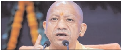
यूपी ने बनाया 9 साल में 9 लाख से अधिक नौकरी देने का रिकॉर्ड: योगी

नई दिल्ली, मुजफ्फरनगर, देहरादून, हल्द्वानी, मुगदाबाद, बरेली, मेरठ व लखनऊ से प्रकाशित