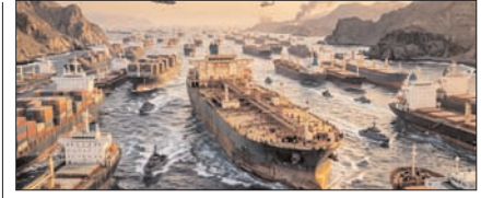
अमेरिका की नाक के नीचे से निकला ईरानी सुपर टैंकर