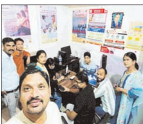
चिन्हित किया गया। मेले में 457 आयुष्मान गोल्ड कार्ड बनाए गए, 59 ABHA आईडी तैयार की गईं और 15 लोगों को आंखों की जांच की गई। टेलीमैडिसिन के माध्यम से 4 मरीजों को परामर्श दिया गया। गंभीर स्थिति वाले 21 मरीजों को उच्च केंद्रों के लिए रेफर किया गया, जिनमें 8 मरीजों को जनरल सर्जरी के लिए भेजा गया। सीएमओ डॉ. दीपा सिंह ने बताया कि मुख्यमंत्री आरोग्य मेला का उद्देश्य आमजन को उनके नजदीक ही बेहतर स्वास्थ्य सेवाएं उपलब्ध कराना है, जिससे लोगों को समय पर इलाज मिल सके और गंभीर बीमारियों को पहचान शुरूआती स्तर पर ही हो सके।

शाह टाइम्स संवाददाता रामपुर। जिले में मुख्यमंत्री आरोग्य मेला सीएमओ डॉ. दीपा सिंह के नेतृत्व में सफलतापूर्वक आयोजित किया गया। जिले के कुल 38 PHC/UPHC केंद्रों पर मेले का आयोजन हुआ, जिसमें स्वास्थ्य सेवाओं का व्यापक लाभ लोगों को मिला। मेले के दौरान कुल 45 डॉक्टरों और 213 पैरामेडिकल स्टाफ ने सेवाएं दीं। इस दौरान कुल 1212 मरीजों का उपचार किया गया, जिनमें 528 पुरुष, 568 महिलाएं और 116 बच्चे शामिल रहे। स्वास्थ्य जांच और उपचार के तहत 110 बुखार के मरीज, 123 गैस्ट्रो, 106 डायबिटीज, 260 त्वचा रोग, 18 लीवर