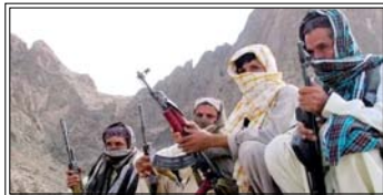
हमलावरों ने बैंक, पुलिस स्टेशन, जेल और सरकारी इमारतों को निशाना बनाया। कई जगहों पर आगजनी की गई और मुख्य सड़कों को जाम कर दिया गया।

क़्वेटा। पाकिस्तान के बलूचिस्तान में बढ़ती हिंसा ने अमेरिका-पाकिस्तान के रैको डिक माइनिंग प्रोजेक्ट को संकट में डाल दिया है। मीडिया रिपोर्ट्स के मुताबिक इसकी वैल्यू करीब 7.7 अरब डॉलर (64000 करोड़) है। बलूच लिबरेशन आर्मी (बीएलए) के 500 से ज्यादा लड़ाकों ने 31 जनवरी को बलूचिस्तान के कई इलाकों में हमला कर 58 लोगों की हत्या कर दी थी, जिससे रैको डिक माइनिंग प्रोजेक्ट की सुरक्षा पर सवाल खड़े हो गए। हमलावरों ने बैंक, पुलिस स्टेशन, जेल और सरकारी इमारतों को निशाना बनाया। कई जगहों पर आगजनी की गई और मुख्य सड़कों को जाम कर दिया गया, जिससे क़्वेटा और कराची के बीच कर्नेक्टिविटी प्रभावित हुई। कुछ हमलावरों ने आत्मघाती ब्रिस्फोट भी किए। रिपोर्ट्स के मुताबिक, हमलावरों ने आर्टोमेटिक राइफल और ग्रेनेड लॉन्चर जैसे आधुनिक हथियारों का इस्तेमाल किया। इनमें से कुछ हथियार अफगानिस्तान में 2021 के