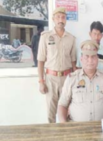
शाह टाइम्स ब्यूरो

शाह टाइम्स संवाददाता सैदनगली। पुलिस ने चोरी की एक बड़ी वारदात का खुलासा करते एक आरोपी को गिरफ्तार कर उसके कब्जे से करीब साढ़े चार लाख रुपये मूल्य के सोने-चांदी के जेवरात और नकदी बरामद की गई है।