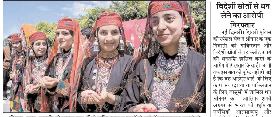
श्रीनगर: जम्मू-कश्मीर के मादक पदार्थों के हानिकारक प्रभावों के बारे में जागरूकता बढ़ाने के लिए चलाए गए 'नशा मुक्त अभियान' के दौरान लोक कलाकार।

सभी तैयारियां पूरी कर ली गई हैं। सभी मतगणना केंद्रों पर सुरक्षा के पुख्ता इंतजाम किए गए हैं। मतदाता सूचियों के विशेष गहन पुरीक्षण (एसआईआर) को लेकर राष्ट्रव्यापी बहस के बीच पश्चिम बंगाल, तमिलनाडु, केरल, असम और केंद्र शासित प्रदेश पुदुचेरी की विधानसभा के चुनावों में मतदाताओं ने मतदान में बहचदकर भागीदारी की। पश्चिम बंगाल और तमिलनाडु में आजादी के बाद मतदान - प्रतिशत के नये रिकॉर्ड बने। पश्चिम बंगाल में दो चरणों में हुए चुनाव में मतदान का कुल प्रतिशत -शेष पृष्ठ दो पर