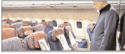
महाशक्ति के पतन का कारण मासूमों की शहादत