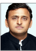
अखिलेश यादव, राष्ट्रीय अध्यक्ष, सपा

जनता इस बात को बखुबी जानती थी कि चुनाव खत्म होते ही महंगाई का ग्राफ ऊपर जाएगा, और आज वही हो रहा है, भाजपा अपने करीबियों को ज्यादा मुनाफा कमाने से नहीं रोक रही है, जिसके कारण आम जनता महंगाई की मार झेल रही है, हमें तब तक नहीं रुकना चाहिए जब तक हम अपना लक्ष्य हासिल न कर लें, समाजवादी सरकार में बांटे गए लैपटॉप आज भी सूचारू रूप से चल रहे हैं, जिन्हें डिजिटल डिवाइड खत्म करने के उद्देश्य से दिया गया था, यदि स्मार्ट मीटर में बेईमानी संभव है, तो ईवीएम में गड़बड़ी क्यों नहीं हो सकती, भाजपा भय का माहौल बनाकर चुनाव लड़ती है, पश्चिम बंगाल में जनता का चुनाव है और ममता बनर्जी ही वहां बनी रहेंगी, अकेले गोरखपुर में ही हजारों शिक्षकों के पद काम हो गए हैं, जिससे पूरे प्रदेश की चिंताजनक स्थिति का अंदाजा लगाया जा सकता है।