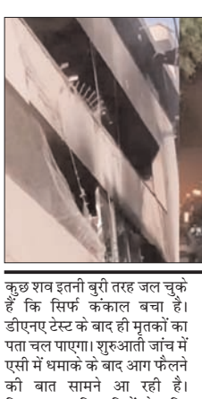
कुछ शव इतनी बुरी तरह जल चुके हैं कि सिर्फ कंकाल बचा है। डॉनएट्टेस्ट के बाद ही मृतकों का पता चल पाएगा। शुरुआती जांच में एसी में धमाके के बाद आग फैलने की बात सामने आ रही है। फिलहाल अधिकारियों ने पुष्टि