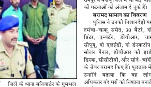
शासनायुक्त पुलिस दर रात गत पर चोरी का प्रयास किया तो वह भागने लगे। पुलिस ने चारों को चोर कर चार को दबोका लिया। बरामद में पुराना कर देने उन्होंने खुद को चोर बताते हुए

रामपुर: संभल का गिरोह अपने जिले के अलावा रामपुर व बदायूं जिले में आकर चोरी के घटनाओं को अंजाम देता था। शासनायुक्त पुलिस ने गिरोह के चार सदस्यों को गिरफ्तार कर उनके पास से भारी मात्रा में चोरी का सामान बरामद किया है। यह सामान संभल, रामपुर व बदायूं जिले से चोरी किया गया था। शासनायुक्त पुलिस दर रात गत पर चोरी का प्रयास किया तो वह भागने लगे। पुलिस ने चारों को चोर कर चार को दबोका लिया। बरामद में पुराना कर देने उन्होंने खुद को चोर बताते हुए