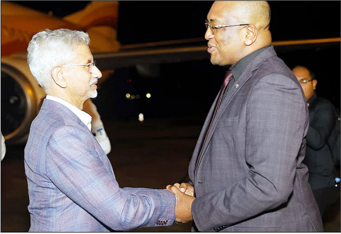
सूरीनाम। पारामरिबो पहुंचने पर विदेश मंत्री एस जयचंकर का स्वागत करते सूरीनाम के विदेश मंत्री मेरिवन बोवा।