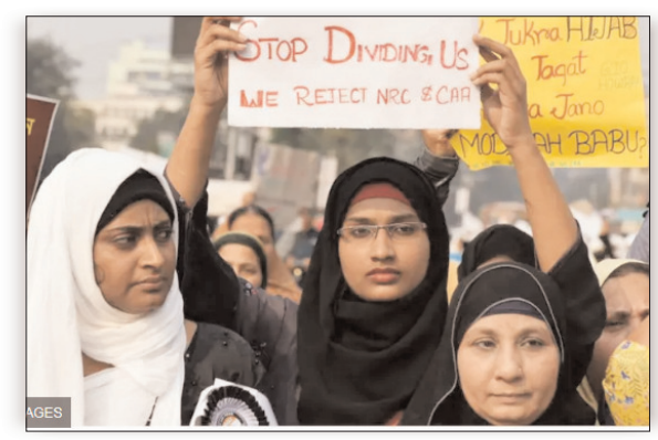
केरल में कुल 140 सीटें हैं। कांग्रेस के सिंबल पर यहां से 8 मुस्लिम जीते हैं। तमिलनाडु में कांग्रेस के सिंबल पर एक मुस्लिम जीतकर सदन पहुंचे हैं।

बंगाल में सबसे ज्यादा 36 मुस्लिम विधायक चुनकर विधानसभा पहुंचे हैं। केरलम से 35 मुस्लिम विधायकों ने जीत हासिल की है। असम के 22 विधायक ऐसे हैं, जो मुस्लिम समुदाय से ताल्लुक रखते हैं। इसी तरह तमिलनाडु से मुस्लिम समुदाय के 9 विधायक जीतकर सदन पहुंचे हैं। असम, बंगाल के विधानसभा चुनाव में जहां मुसलमानों का दबदबा कम हो गया है। वहीं केरल में मुस्लिम विधायकों की संख्या में बढ़ोतरी हुई है। चुनाव परिणाम के आंकड़ों के मुताबिक इस बार विपक्ष के मजबूत सपोर्ट के बावजूद असम और बंगाल में 15 मुस्लिम विधायक कम हो गए हैं। वहीं केरल में मुस्लिम विधायकों की संख्या में 3 की बढ़ोतरी हुई है। जम्मू कश्मीर के बाद असम और पश्चिम बंगाल में मुसलमानों की संख्या सबसे ज्यादा है। पश्चिम बंगाल और असम में बीजेपी तो केरल में कांग्रेस गठबंधन को जीत मिली है। असम में कांग्रेस बीजेपी के मुकाबले सीधे मैदान में थी। बंगाल में तृणमूल कांग्रेस और बीजेपी के बीच चुनाव का मुख्य मुकाबला था। कांग्रेस यहां पर वोट के मामले में चौथे नंबर पर रही है। पश्चिम बंगाल में विधानसभा की 294 सीटें हैं। यहां पर 36 मुस्लिम विधायकों ने जीत हासिल की है। 2021 में यहां मुस्लिम समुदाय के 42 विधायक जीतकर आए थे। इस बार 31 विधायक टीएमसी से जीतकर आए हैं, जबकि 5 विधायक ऐसे हैं, जो