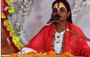
गौरवशाली इतिहास में भी प्रकाश डाला। शिवाजी ने मोहा मन कथा के दौरान प्रभुत्व की हई मनमोहक शोभाओं में मंगलवार को मनाया है। उन्होंने मूकदम, राजा बलि के अर्पण के पूरे करने वाले भक्तों के आभार के पथ वार्न के साथ किया। इस

शाह टाइम्स संवाददाता, गजरोला। नगर स्थित सुप्रसिद्ध श्री श्राद्ध महादेव शिवलला मंदिर में आयोजित सात दिवसीय श्रीमन् भावगत कृष्ण के पांचवें दिन, मंगलवार की दुकान का जन्मोत्सव में हई हो प्रसन्नता और शोभासल्लोचन में नमस्कार मनाया। इस पावन अवसर पर पूरा परिवार परिवार संतर्न के आनंद भरो, जय कर्जैया लाल को के भक्तों से मूब हुआ।