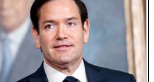
■ रूबियो ने मानवीय अनिवार्यता और वैश्विक समुद्री मार्ग को खुला रखने की रणनीतिक आवश्यकता पर बल दिया

में गाइडेड मिसाइल विध्वंसक, सौ से अधिक हवाई और समुद्री विमान, मानव रहित प्लेटफॉर्म और 15000 सैनिक शामिल हैं। रूबियो ने स्पष्ट किया कि यह ऑपरेशन आक्रामक प्रकृति का नहीं है। उन्होंने कहा कि जब तक हम पर पहले गोली नहीं चलाई जाती, तब तक कोई गोलीबारी नहीं होगी। हम केवल तभी जवाब देंगे हैं जब पहले हमला किया जाए। यह एक रक्षात्मक अभियान है। विदेश मंत्री ने पुष्टि की कि चेतावनी को अनदेखा करने के बाद ईरान की सात नौकाओं को पहले ही नष्ट कर दिया गया है। उन्होंने कहा कि उनमें से सात अब समुद्र के तल में हैं, साथ ही ईरान की बाकी नौसेना भी। रूबियो ने आर्थिक मोर्चे पर कहा कि 'ऑपरेशन इकोनॉमिक प्युरी' इसके समानांतर जारी है।