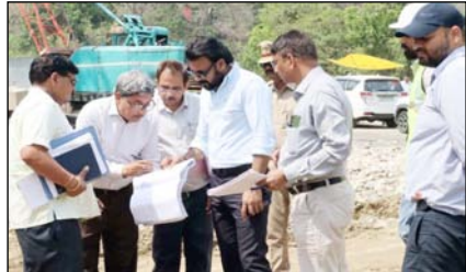
सुविधा उपलब्ध हो सके। निरीक्षण के दौरान जिलाधिकारी ने ठेकेदार को चले रहे कार्यों का जायजा लिया।