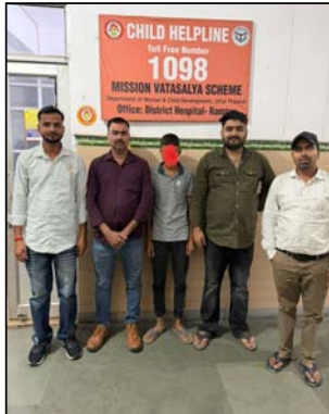
जिला प्रबंधक कुमार को बालक को सुरक्षित रूप से लौटाया

रामपुर। चाइल्ड हेल्पलाइन रामपुर ने 13 बच्चों एक बालक लता, रिस अक्षय में मिला। जिला प्रबंधक अधिकारी ईद आर्य व निदेशा पर चाइल्ड हेल्पलाइन टीम ने बालक को सुरक्षित रूप से परिवार में लौटाया। 05 मई 2026 को रविवार स्टेशन पर लता, 13 बच्चों एक बालक लता, रिस अक्षय में मिला। जिला प्रबंधक अधिकारी ईद आर्य व निदेशा पर चाइल्ड हेल्पलाइन टीम ने बालक को सुरक्षित रूप से परिवार में लौटाया। 05 मई 2026 को रविवार स्टेशन पर लता, 13 बच्चों एक बालक लता, रिस अक्षय में मिला। जिला प्रबंधक अधिकारी ईद आर्य व निदेशा पर चाइल्ड हेल्पलाइन टीम ने बालक को सुरक्षित रूप से परिवार में लौटाया।