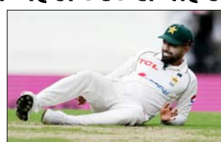
घुटने के चोट के कारण बांग्लादेश के खिलाफ पहले टेस्ट मैच में खेल नहीं पाएंगे। बाबर गुरुवार को अपने बाएं घुटने का स्केन करवाने के लिए ट्रेनिंग छोड़कर चले गए थे, और बाद में पाकिस्तान क्रिकेट बोर्ड (पीसीबी) ने इसकी पुष्टि की। बोर्ड ने बताया कि यह दाएं हाथ का बल्लेबाज बांग्लादेश के खिलाफ आईसीसी वर्ल्ड टेस्ट चैंपियनशिप सीरीज का पहला मैच नहीं खेल पाएंगे। पीसीबी ने एक बयान में कहा कि पाकिस्तान के बल्लेबाज बाबर आज़म बाएं

मीरपुर, वार्ता। पाकिस्तान को एक बड़ा झटका लगा है, क्योंकि खबर आई है कि टीम के मुख्य बल्लेबाज बाबर आज़म घुटने की चोट के कारण बांग्लादेश के खिलाफ यहां होने वाला पहला टेस्ट मैच नहीं खेल पाएंगे। बाबर गुरुवार को अपने बाएं घुटने का स्केन करवाने के लिए ट्रेनिंग छोड़कर चले गए थे, और बाद में पाकिस्तान क्रिकेट बोर्ड (पीसीबी) ने इसकी पुष्टि की। बोर्ड ने बताया कि यह दाएं हाथ का बल्लेबाज बांग्लादेश के खिलाफ आईसीसी वर्ल्ड टेस्ट चैंपियनशिप सीरीज का पहला मैच नहीं खेल पाएंगे। पीसीबी ने एक बयान में कहा कि पाकिस्तान के बल्लेबाज बाबर आज़म बाएं