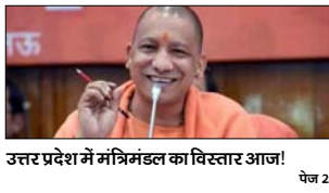
उत्तर प्रदेश में मंत्रिमंडल का विस्तार आज!

नई दिल्ली, मुजफ्फरनगर, देहरादून, हल्द्वानी, मुद्राबाद, बोली, मेरठ व लखनऊ से प्रकाशित