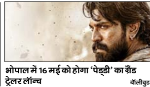
भोपाल में 16 मई को होगा 'पेड्डी' का बैंड ट्रेलर लॉन्च