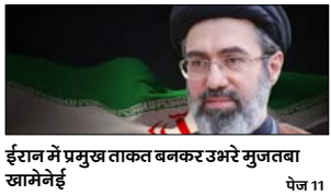
ईरान में प्रमुख ताकत बनकर उभरे मुजतबा खानेनेई