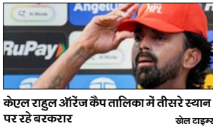
केएल राहुल औरेंजर कैप तालिका में तीसरे स्थान पर रहे बरकरार