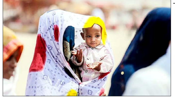
प्रयागराज। भीषण गर्मी में कपड़ा ढककर अपने बच्चे को घुप से बचाती महिला।

तात्कालिक खतरा नहीं था और कुछ राजनीतिक शक्तियों ने बाहरी प्रभाव में आकर अमेरिका को युद्ध में धकेला। उन्होंने अमेरिकी विदेश नीति की भी आलोचना करते हुए कहा कि राजनीतिक नैरेटिव के कारण खुफिया सूचनाओं को कमजोर किया गया और युद्ध को इजरायल तथा उसके समर्थकों के दबाव में आगे बढ़ाया गया। उन्होंने आशंका जताई कि यह संघर्ष अमेरिका को एक और लंबे परिचय एशिया युद्ध में धकेल सकता है और युद्ध तक पहुंचने वाली निर्णय प्रक्रिया को पुनर्समीक्षा की जरूरत है। उन्होंने लिखा कि जून 2025 तक आप समझते थे कि मध्य-पूर्व के युद्ध एक जाल है, जिन्होंने अमेरिका के सैनिकों की जान ली और देश की समृद्धि को नुकसान पहुंचाया। उन्होंने ट्रम्प के पहले कार्यकाल में कासिम सुलेमानी की हत्या और थाई बमबारी के खिलाफ कार्रवाई का उल्लेख करते हुए कहा कि उस समय सैन्य शक्ति का उपयोग बिना लंबे युद्ध में फंसे किया गया था।