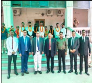
दो नए रिश्ते को राष्ट्रीय लोक अदालत ने फिर जोड़ा। 14 वैवाहिक मामलों सहित 34 मामलों का हलआ निस्तारण।

रामपुर। उच्च न्यायालय विधिक सेवा प्राधिकरण, लखनऊ के निर्देशानुसार शनिवार को जिला जजो परिसर रामपुर में राष्ट्रीय लोक अदालत का आयोजन किया गया। प्रधान न्यायाधीश परिवार न्यायालय अरविंद कुमार-1 को अध्यक्षता में आयोजित लोक अदालत में वैवाहिक विवादों सहित विभिन्न मामलों का आसानी से हल-समझौते के आधार पर निस्तारण कराया गया। राष्ट्रीय लोक अदालत में 14 वैवाहिक मामलों सहित 34 मामलों का हलआ निस्तारण किया गया। इस दौरान ऐसे कई मामले भी सामने आए जिनमें पति-पत्नी के रिश्ते टूटने की कारण पर धुंधलक भूके थे। उपरत न्यायाधीश परिवार न्यायालय द्वारा दोनों पक्षों को साथ बैठकर विस्तारपूर्वक बातों की गई तथा आपसी समझाइश और काउंसलिंग के माध्यम से 05 जोड़ों को पुनः साथ रहने के लिए राजी किया गया। समझौते के उपरत जनद-न्यायाधीश भानु देव शर्मा एवं अन्य न्यायिक अधिकारियों को उपस्थित में जोड़ों