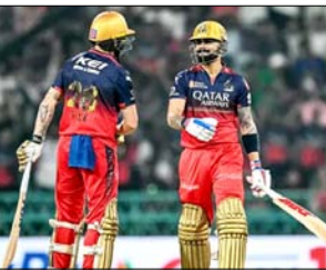
हालांकि, हाल के मैचों में लगातार मिली हार ने उनके अभियान में थोड़ी बेकरी पैदा कर दी है। जैसे-जैसे टूर्नामेंट अपने निर्णायक दौर की ओर बढ़ रहा है, बंगलूर को टीम के लिए योग्यता सिद्ध है; लगातार जीत हासिल कर, बरना प्लेऑफ में जगह बनाने की कड़ी सड़ में पिछड़े का जीवित उठाए। इसके निरपत्ता, मुंबई इतिहास परदेस टेवल के निचले हिस्से में स्थिति को और गंभीर बना रहा है। हालांकि उनके आगे बढ़ने की गणितीय संभावनाएं बहुत कम हैं, लेकिन अब उनका पूरा ध्यान अपने मैच को बनाने और इस सीजन का समापन एक मजबूत अंदाज में करने पर है। अपने उदार-व्यवहार प्रदर्शन के बावजूद, मुंबई अपने लिए एक खतरनाक टीम मानित हो सकती है, जिसके पास ऐसे अनुभवी मैच हैं, जिनमें जो कुछ भी ओवरों में मैच का रुख बदलने की संभावना रहती है। रायपुर की फिर इस मुकामले में एक और रोमांचक पारतु, जोड़ देती है। हाल के आईएनए सीजन में अनेकछक्का कम स्कोरिंग मुंबई यह विवर, सॉल, विल परफिमेंसिटीय प्रदर्शन करने और समय कमिटीय के अवसर देने की उम्मीद है। परिहासिक रूप से, यह मैदान बहुत ज्यादा खतरा बाला नहीं रहा है, यहाँ

रायपुर, बार्ना। महल्लकांक्षा और गौरव के बीच होने वाले एक रोमांचक मुकाबले में, रॉयल चैलेंजर्स बंगलूर (आरसीबी) विवरकप का खंड शरारत और नागरण विह्वल करीब 100 रनों के स्कोर पर जीतने में सफल प्रदर्शन किया। आरसीबी की बल्लेबाजी में जगह बनाने की दिशा में एक अलग कदम उठाने पर है, जबकि मुंबई अपने निराशाजनक अभियान में मुश्किल रूप से अपने गौरव और प्रतिष्ठा के लिए खेल रही है।